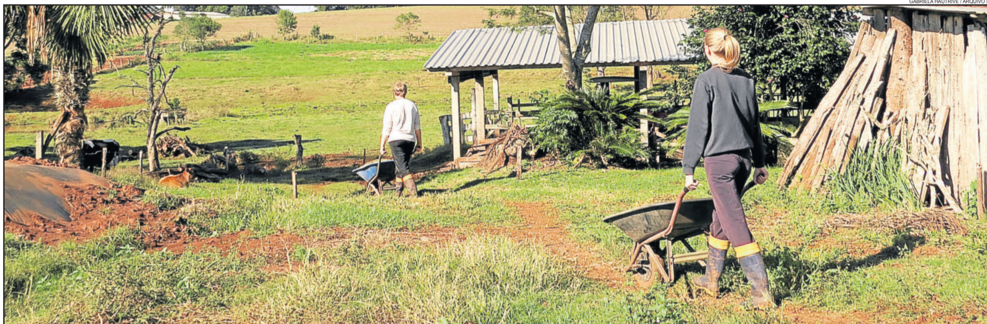
Atualmente, produtores da região se enquadram no DAP. Com a mudança, não há certeza sobre o enquadramento