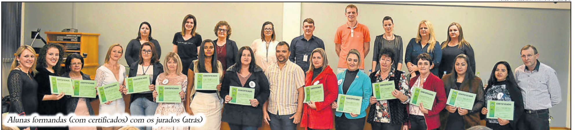
Alunas formandas (com certificados) com os jurados (atrás)