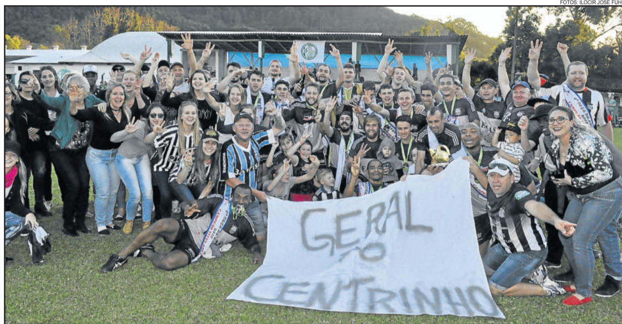
ECAS festejou o tricampeonato sobre o Juventude

Os minutos finais da partida foram de muita pressão do Juventude.