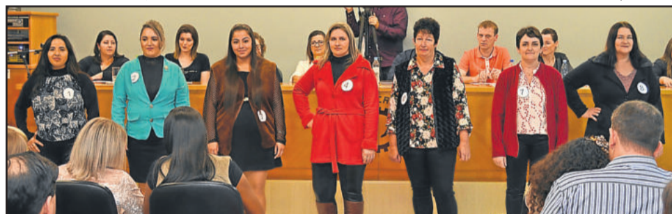
Alunas tiveram que confeccionar suas roupas e desfilar para o público e jurados