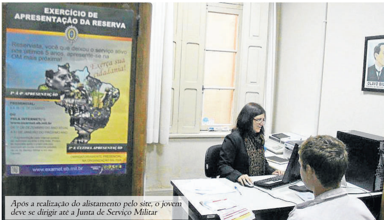
Após a realização do alistamento pelo site, o jovem deve se dirigir até a Junta de Serviço Militar