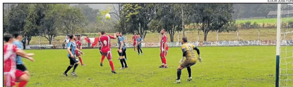
Atlético Gaúcho, de Índio (9), busca seu terceiro título do municipal

pois apesar do empate em pontos e vitórias com o Esperança, a disciplina dos Titulares do Atlético é melhor, o que lhe coloca à frente pelos critérios de desempate. Os dois times somaram 29 pontos, com 9 vitórias, 2 empates e apenas 1 derrota. Na primeira fase, na estreia do campeonato, o Esperança venceu ao Atlético, no Bairro Languiru, por 1 a 0.