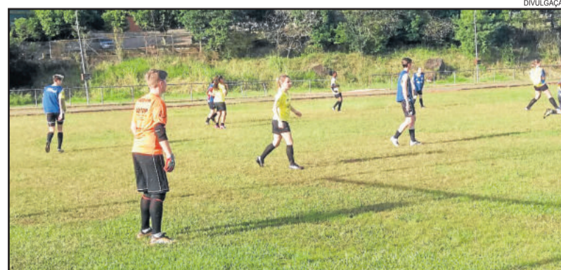
AEF intensifica treinamentos visando o Gauchão Adulto Feminino

jeadense, Ijuí, Atlântico de Erechim e Internacional de Porto Alegre. Confira na tabela os grupos e as equipes que vão participar da competição.