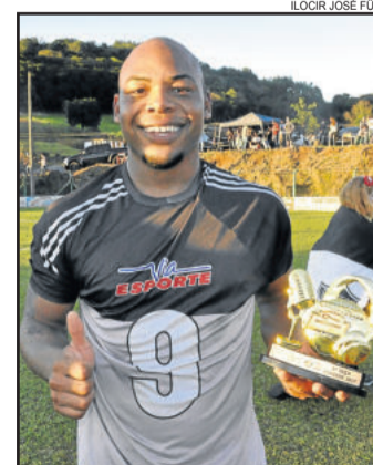
Tanque, do ECAS, craque dos Titulares