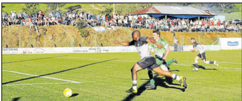
ECAS, de Tanque, virou o placar e conquistou a vitória para ser tricampeão

Na categoria Aspirantes, o Poço das Antas empatou por 2x2 com o Ecas e, pela melhor campanha, conquistou o título inédito da Taça da Amizade, quebrando a hegemonia do tricampeão Ecas. Os melhores nas duas categorias receberam troféu, medalhas e faixas. As festas iniciaram em Westfália e se estenderam para Poço das Antas e Imigrante.