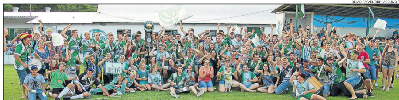
Juventude da Berlim é o campeão regional 2016