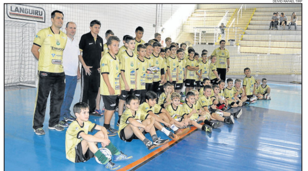
Entrega oficial foi feita aos garotos que treinam no ginásio da Associação da Água, mas o restante dos núcleos também já recebeu os uniformes

As mais de 400 crianças atendidas treinam e recebem gratuitamente todo o material de treinamento.