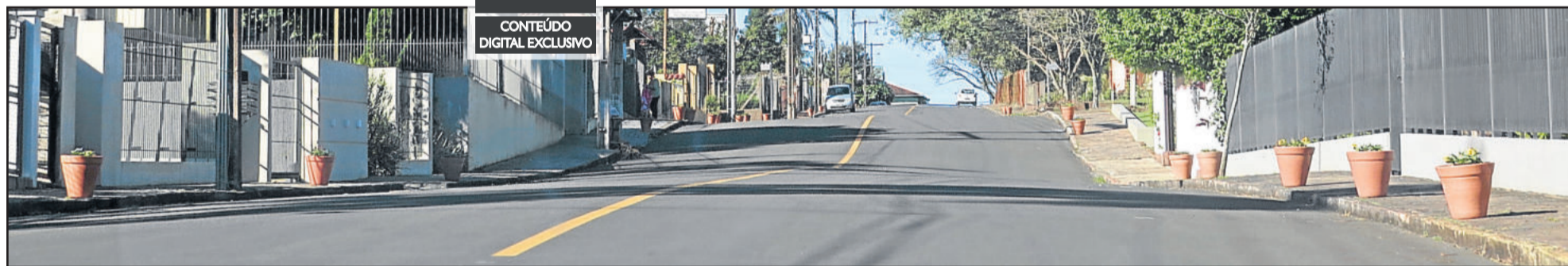
Rua conta com cerca de 70 vasos e outros 20 ainda serão colocados