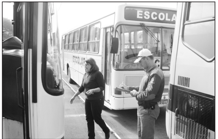
Veículos foram vistoriados para garantir segurança aos alunos