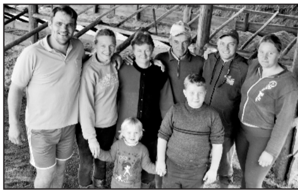
Família de Linha Leopoldina, interior de Teutônia, une esforços na melhoria constante da propriedade e ganhos de produção

temos vacas que produzem mais de 30 litros de leite/dia”, avalia. “Temos sala de ordenha, resfriador à granel e ordenha canalizada”, acrescenta.