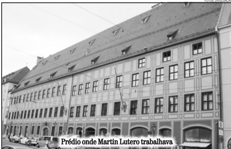
Prédio onde Martin Lutero trabalhava

A viagem é realizada através de parceria com a Mission Eine Welt, entidade internacional que incentiva intercâmbios entre a Alemanha e outros países, principalmente da América do Sul. Além do apoio da entidade, a Orquestra tem auxílio do município de Imigrante.