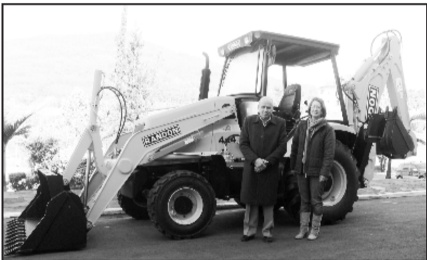
Retroescavadeira e escavadeira hidráulica irão auxiliar no desenvolvimento de obras