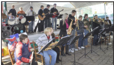
Apresentação da Orquestra Infante Juvenil de Teutônia

Festa do Colono teve por objetivo oferecer momentos de integração e valorização da agricultura