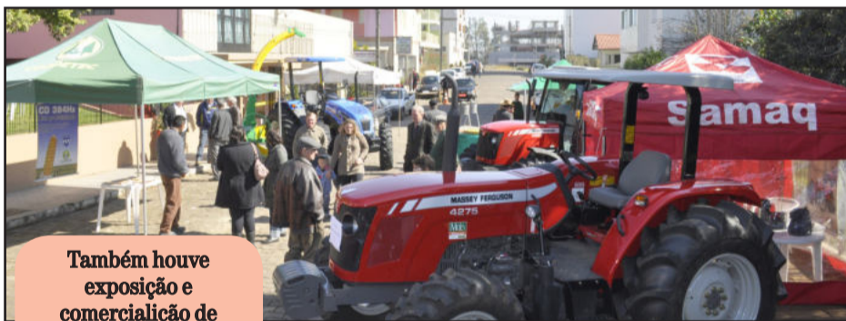
Também houve exposição e comercialização de implementos e máquinas agrícolas