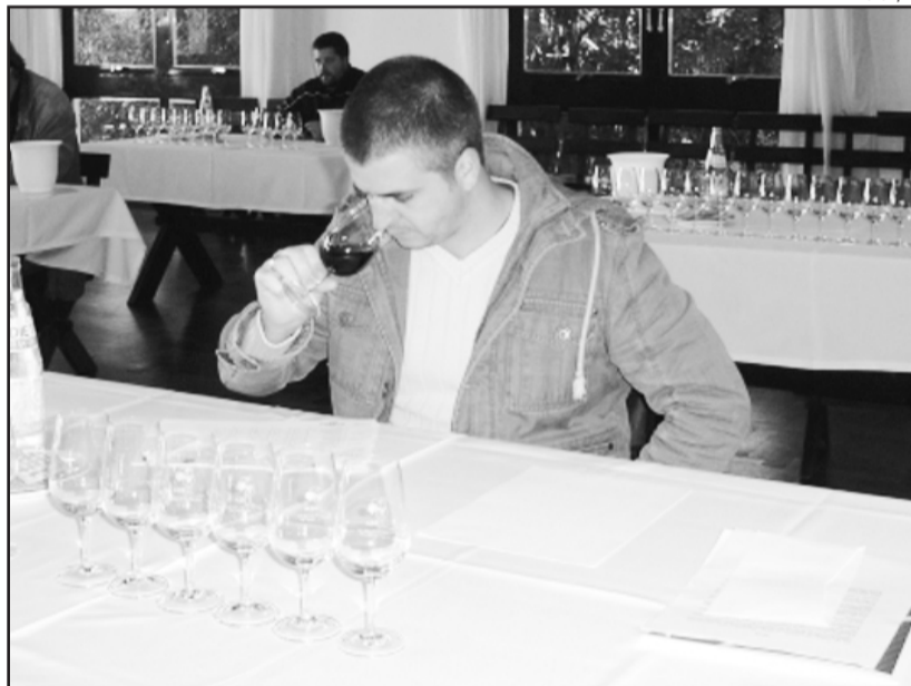
Enólogos realizaram avaliações das amostras de vinhos e espumantes

A Seleção dos Melhores Vinhos e Espumantes de Garibaldi é realizada anualmente pela AVIGA e conta com o apoio da Prefeitura Municipal, APEME e Ibravin.