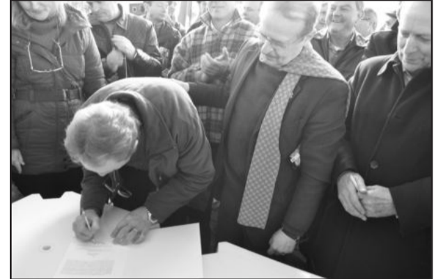
Também foi assinado contrato com uma agroindústria de Teutônia