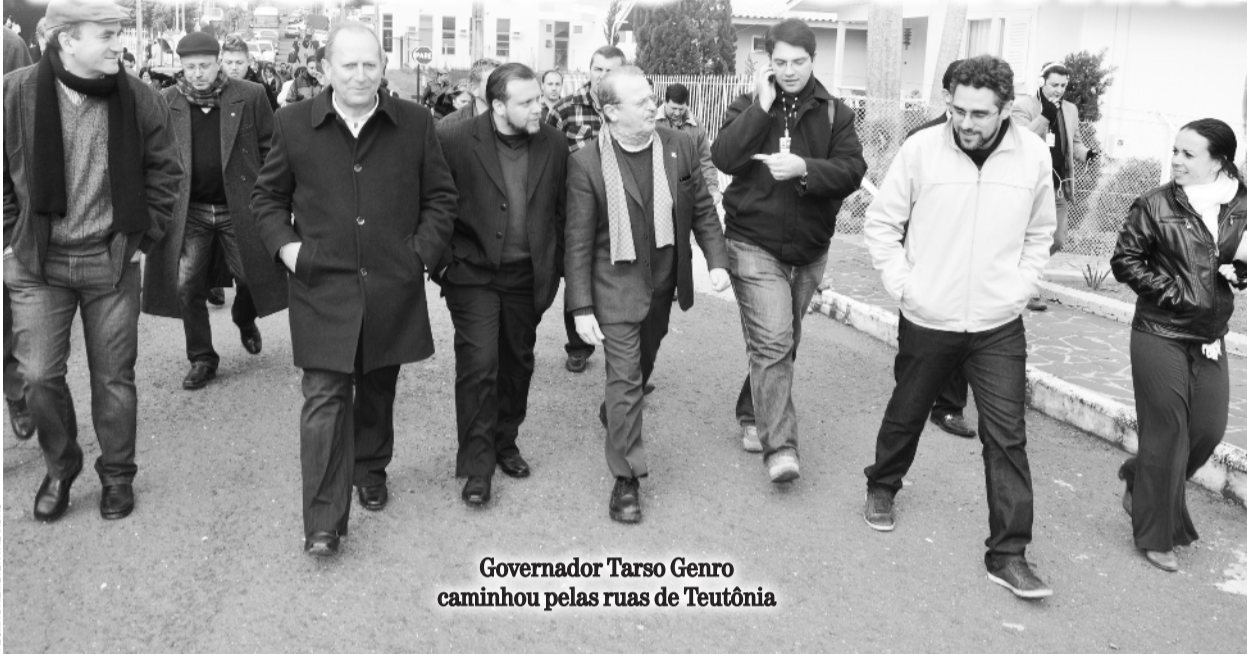
Governador Tarso Genro caminhou pelas ruas de Teutônia