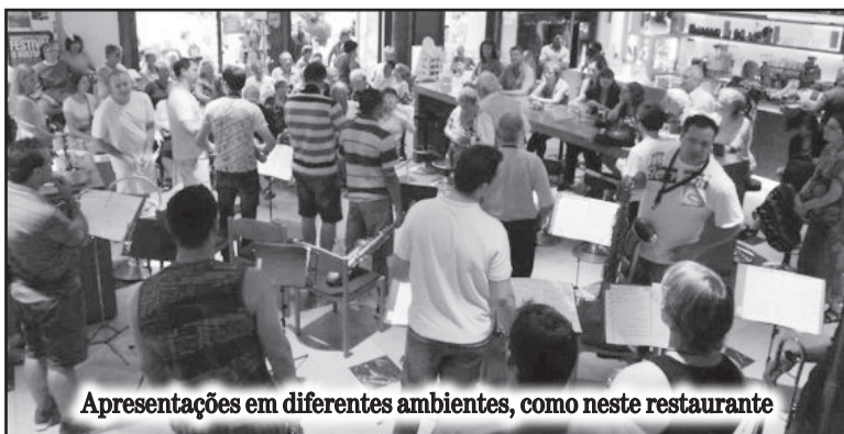
Apresentações em diferentes ambientes, como neste restaurante