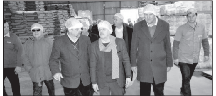
Comitiva conheceu setores de expedição e ensacação da Fábrica de Rações da Languiru, instalada em Estrela