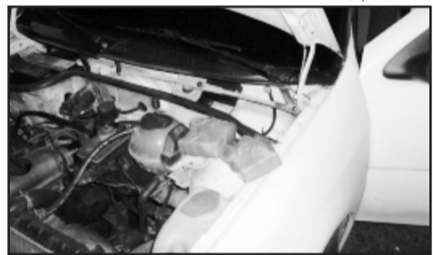
Drogas estavam escondidas dentro de capo de veículo

Após as formalidades de praxe, a mulher foi encaminhada à Penitenciária Modulada Estadual de Montenegro. Os homens foram conduzidos ao Presídio Central.