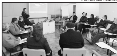
Projeto de sinalização foi apresentado na reunião desta semana

evento. Também foi apresentado e aprovado o projeto de sinalização e divulgação com placas indicativas, que serão colocadas desde as rodovias de acesso ao município até o Centro Comunitário Cristo Rei, onde se realizará a feira.