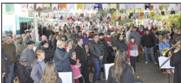
Evento reuniu expressivo número de agricultores