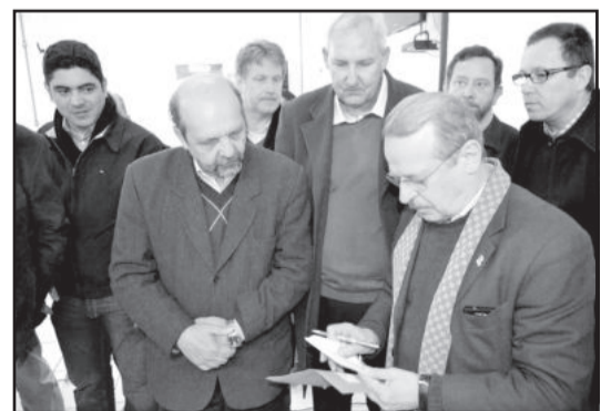
Presidente e vice entregaram pedido de atenção especial para a construção de rótula de acesso ao novo Frigorífico de Suínos da cooperativa, instalado em Poço das Antas