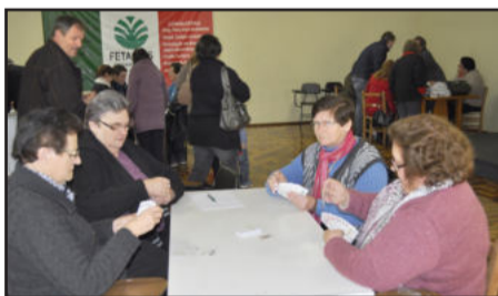
Torneio de canastra ocorreu durante a tarde