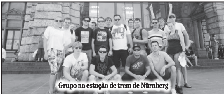
Grupo na estação de trem de Nürnberg