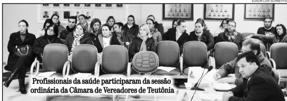
Profissionais da saúde participaram da sessão ordinária da Câmara de Vereadores de Teutônia

As reivindicações da categoria são por melhorias salariais e criação de plano de carreira. Segundo os profissionais, os salários pagos pelo município são os mais baixos da região. A principal reclamação é de que o executivo teutoniense não recebe a categoria. A categoria não descarta a possibilidade de greve.