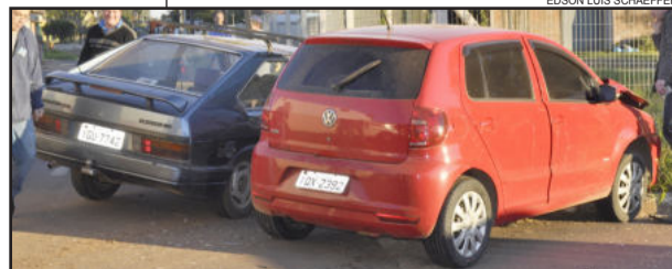
Acidente envolveu um Fox de Teutônia e um Passat de Imigrante

A Brigada Militar de Teutônia foi acionada às 18 horas de terça-feira, dia 23, para atender ao acidente de número 239 neste ano. O fato aconteceu na Subida para a Lagoa da Harmonia, em Linha Harmonia, na divisa com Colinas. Dois veículos estavam envolvidos no acidente: uma caminhonete Frontier e uma Saveiro. Houve apenas danos materiais.