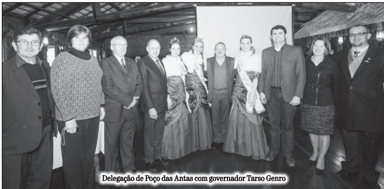
Delegação de Poço das Antas com governador Tarso Genro