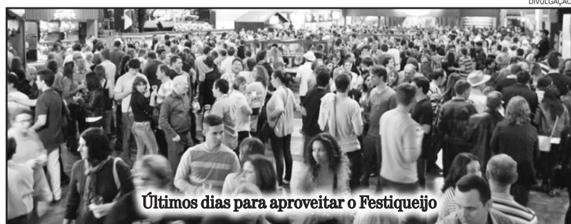
Últimos dias para aproveitar o Festiqueijo