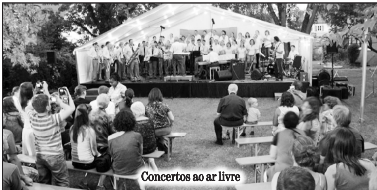
Concertos ao ar livre