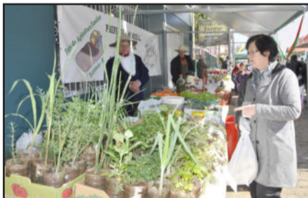
Feira do produtor foi uma das atrações