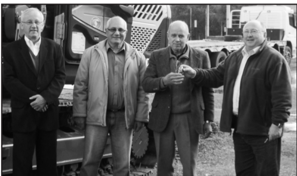
Município conta com duas novas máquinas a partir de julho