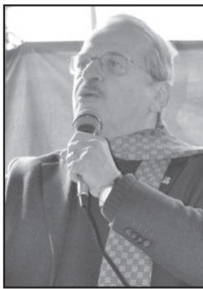
Governador do Estado, Tarso Genro