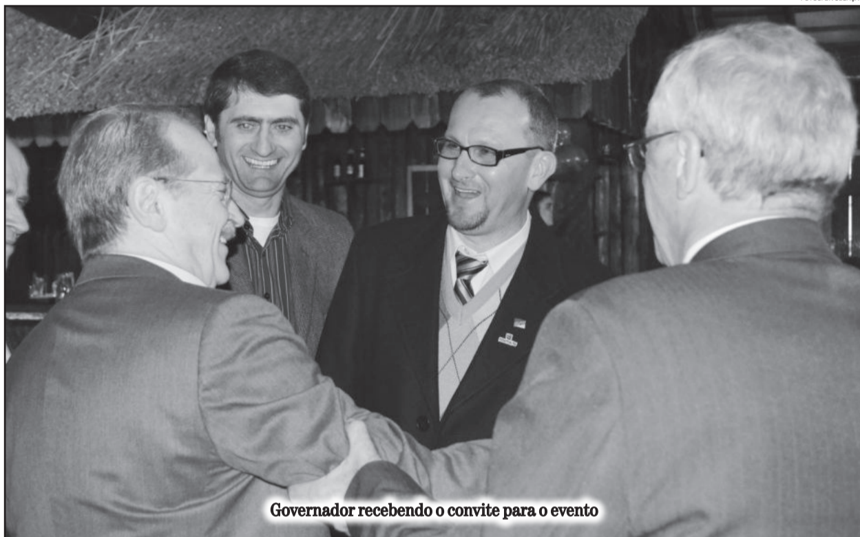
Governador recebendo o convite para o evento