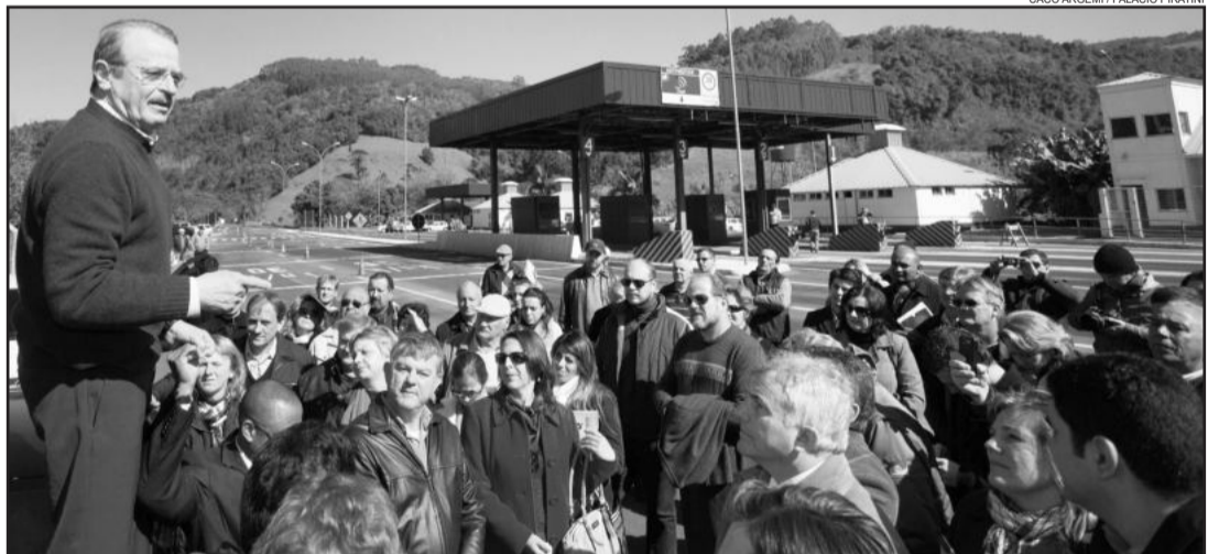
Governador participou de ato na antiga praça de pedágio de Marques de Souza