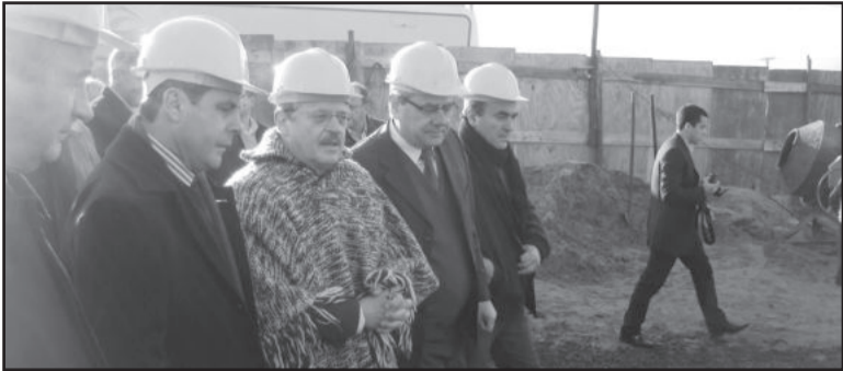
Comitiva vistoriou as obras da escola estadual

Os alunos do Ensino Médio de Westfália terão uma nova escola para estudar quando começar o ano letivo, em 2014. Ampla, com salas de aula, pátios, quadra esportiva, cozinha e refeitórios modernos, além de monitoramento eletrônico, iluminação, sala de estudos para professores, climatização em todas as salas e água quente em cozinhas e vestiários, acessibilidade e Plano de Prevenção e Combate a Incêndio (PPCI).