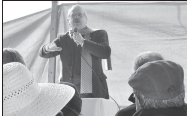
Governador destacou a importância da agricultura familiar

Por fim, destacou que aquilo que faz a diferença é o tratamento igualitário, reconhecendo os potenciais produtivos de cada região. “Viva a agricultura familiar, viva o colono, viva o motorista”, congratulou.