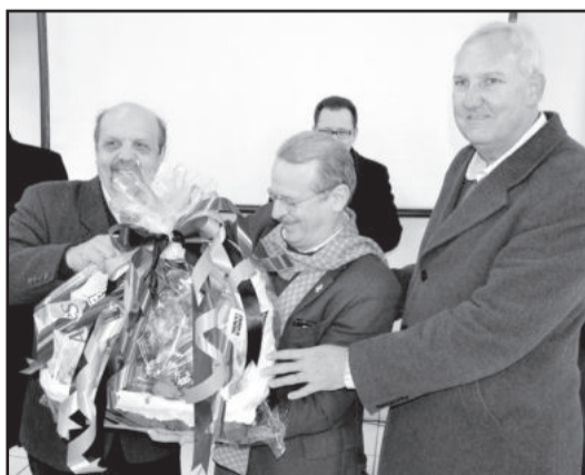
Bayer (E) e Kreimeier presentaram governador com cesta de produtos Languiru