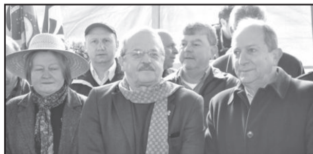
Diversas autoridades participaram dos festejos, dentro dos quais o governador Tarso Genro e o secretário Ivar Pavan