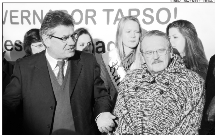
Governador também esteve visitando Westfália