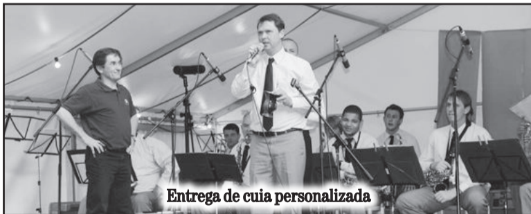
Entrega de cuia personalizada