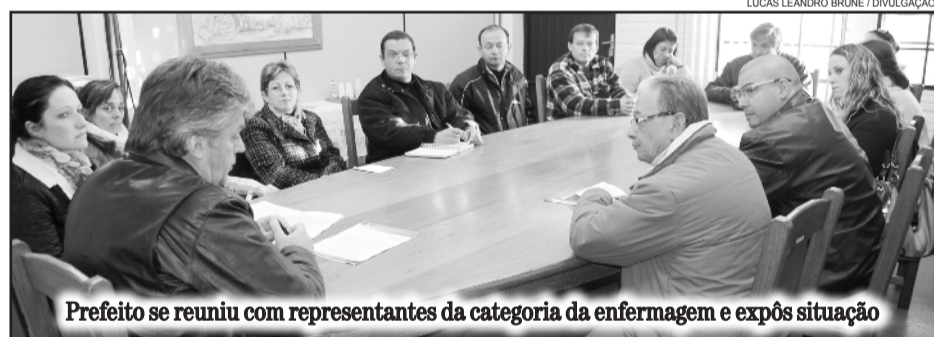
Prefeito se reuniu com representantes da categoria da enfermagem e expôs situação