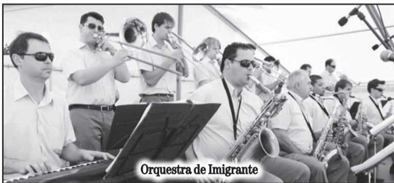
Orquestra de Imigrante