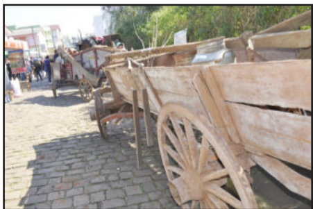
Público pode prestigiar implementos e objetos antigos