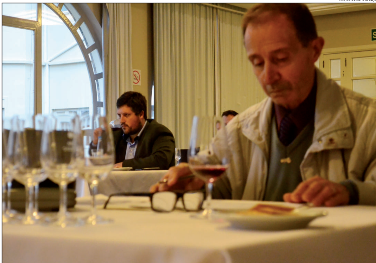
Equipe de avaliadores imergiu, em total silêncio, no universo das sensações causadas pelas bebidas que são o cartão postal da cidade e da região

Para o presidente, o evento contribui para a imagem das bebidas de Garibaldi, bem como de toda cadeia produ-