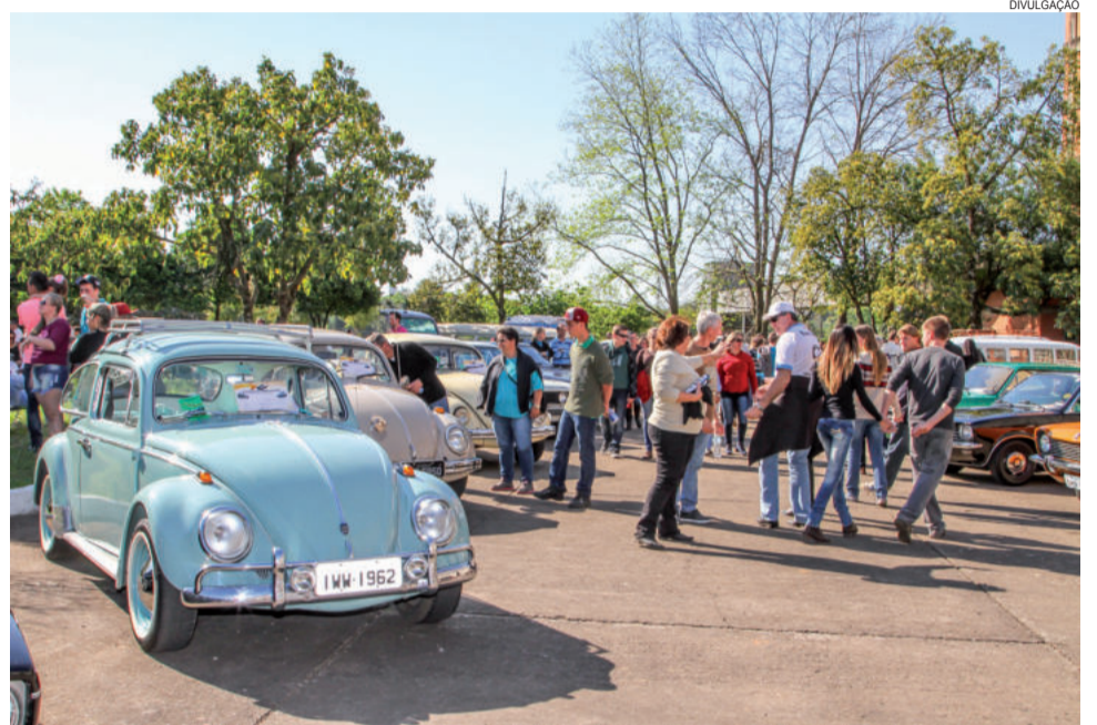
Em 2015, exposição registrou cerca de 200 participantes

A Estrela Multifeira 2017 ocorre entre os dias 6 e 10 de setembro, no Porto de Estrela. A realização é da Câmara de Comércio, Indústria e Serviços de Estrela (Cacis), com o patrocínio de Prefeitura de Estrela, Câmara de Vereadores, Sicredi, Lojas Benoit, Imec, Brasilata, Launer, Redemac Morelli, Carrocerias Altari, Girando Sol, Metanox, Compasul, Languiru e Trip Tecnologia. O apoio é do Banco do Brasil, Prost Bier, Rota Gráfica, Unimed e Secretaria Estadual de Desenvolvimento Rural, Pesca e Cooperativismo, com a organização de Lume Eventos.