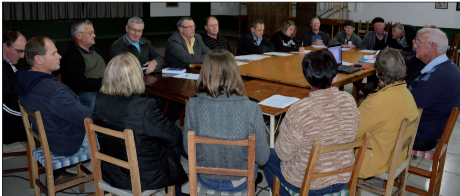
Comissão Organizadora volta a se reunir nesta quinta-feira, dia 27 de julho

Após 12 anos sem realizá-lo, a intenção da comissão organizadora, liderada pelo Grupo Amigos do Sapato de Pau, é reeditar o encontro, tendo em vista incentivar que mais pessoas se envolvam e mantenham viva a tradição dos imigrantes westfalianos também através da fala.