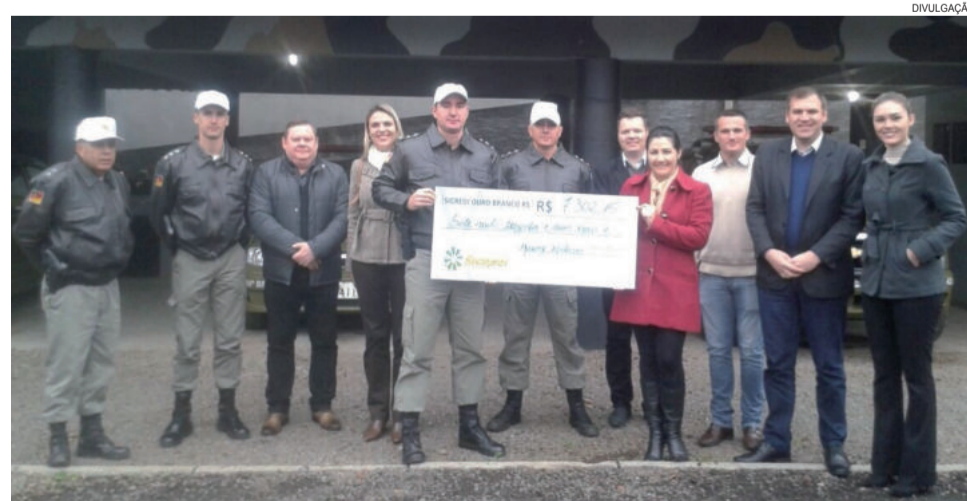
Entrega do Valor arrecadado para a Brigada Militar de Estrela

A Sicredi Ouro Branco agradece a comunidade pelo apoio e por fazer parte do Dia de Cooperar, uma grande corrente do bem, que leva as ações sociais de voluntariado para as cidades da área de atuação da Cooperativa. São pessoas unidas para proporcionar transformação social nas comunidades em que atuam, fazendo assim um mundo melhor juntos.