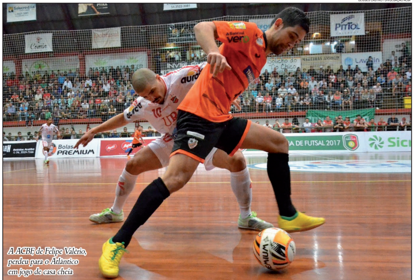
A ACBF de Felipe Valério, perdeu para o Atlântico em jogo de casa cheia

A ACBF permanece com 19 pontos na Liga Gaúcha. Agora, o time de Carlos Barbosa volta aos treinos na quinta-feira, visando o confronto contra o Concórdia pela LNF. A partida será no sábado, às 19h, em Carlos Barbosa.