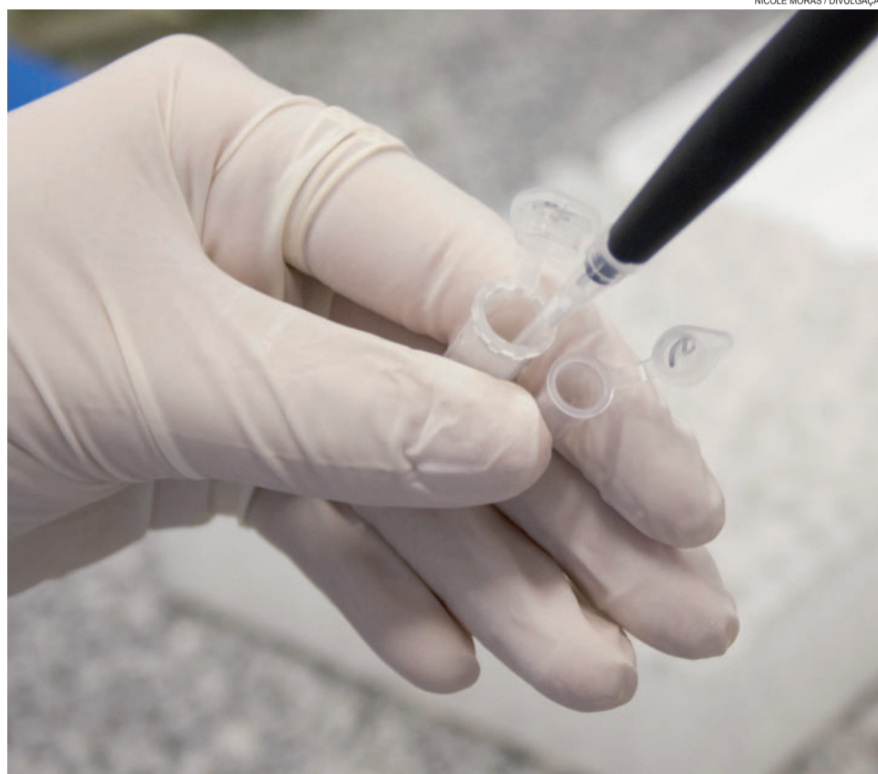
A aplicação da biotecnologia em saúde é uma das áreas de concentração do Programa de Pós-Graduação em Biotecnologia (PPGBiotec) da Univates

Para ser voluntário da pesquisa de nutrigenética, o interessado participa de uma consulta na qual responde a um questionário sobre seus hábitos de vida e alimentares. Além disso, é verificada a pressão arterial e realizada a avaliação antropométrica - verificação de peso, altura e dobras cutâneas. Os procedimentos são realizados por profissionais capacitados e registrados pelo pesquisador. Já na segunda consulta é realizada a coleta de sangue. O procedimento leva menos de um minuto e o paciente não sente dor ou desconforto. Após a coleta, o voluntário recebe um lanche e, ao final de todo processo, também recebe um laudo com os resultados de seus exames bioquímicos básicos, como glicemia, colesterol e triglicerídeos. Interessados em participar podem contatar a equipe da pesquisa pelo e-mail nutrigeneticauni@gmail.com e agendar a consulta.