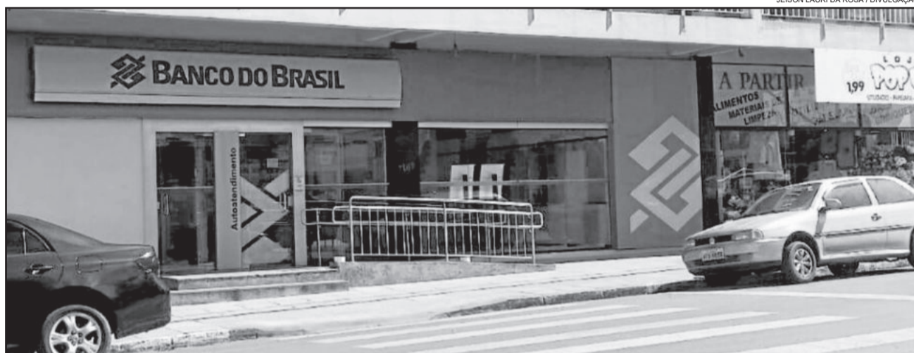
Banco do Brasil permanecerá na cidade, mas espera reforço na segurança