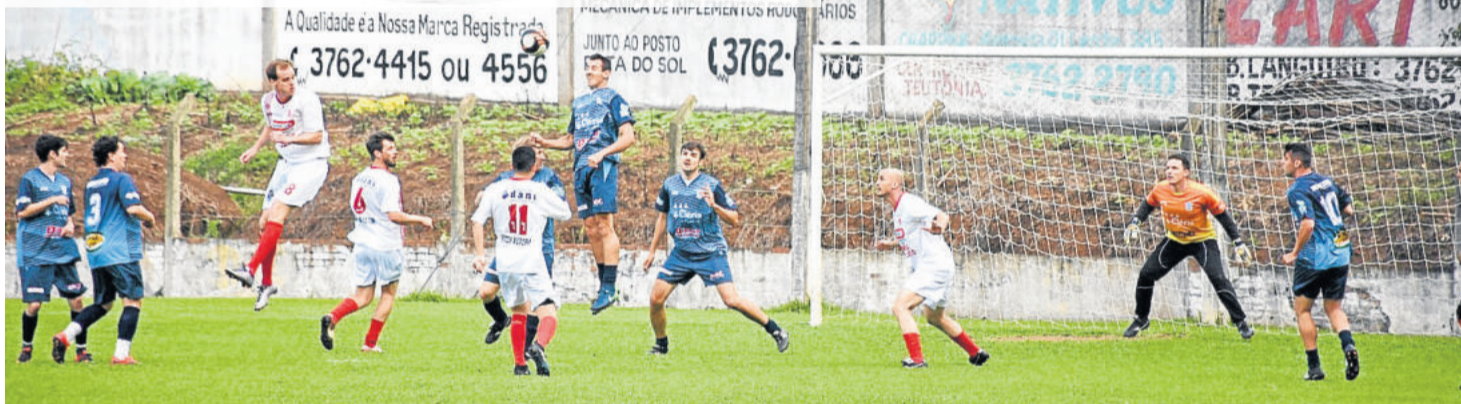
Assespe (azu) enfrentará o União Carneiros em busca de vaga na final