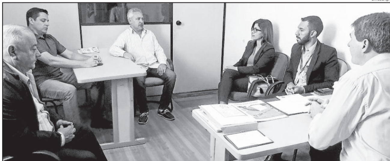
Gerência do Banrisul se reuniu com o Executivo nesta segunda-feira e confirmou reforma do prédio e retomada dos serviços em dezembro

A agência do Banrisul foi alvo de ataque no dia 4 de outubro, enquanto que o Banco do Brasil foi invadido com uso de explosivos no dia 18 de julho.