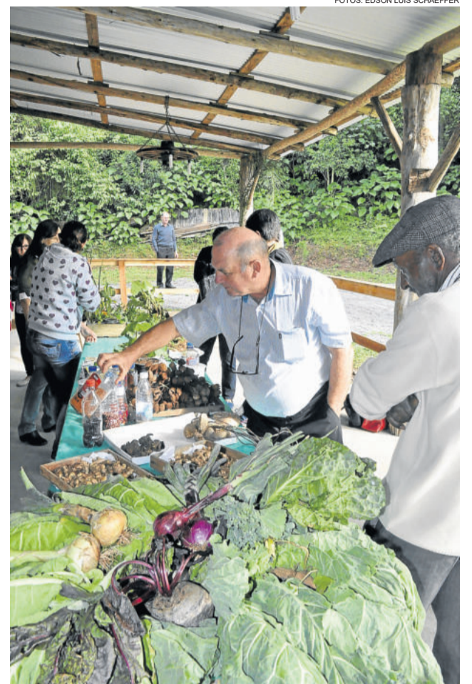
Troca de sementes e mudas é um dos destaques do evento