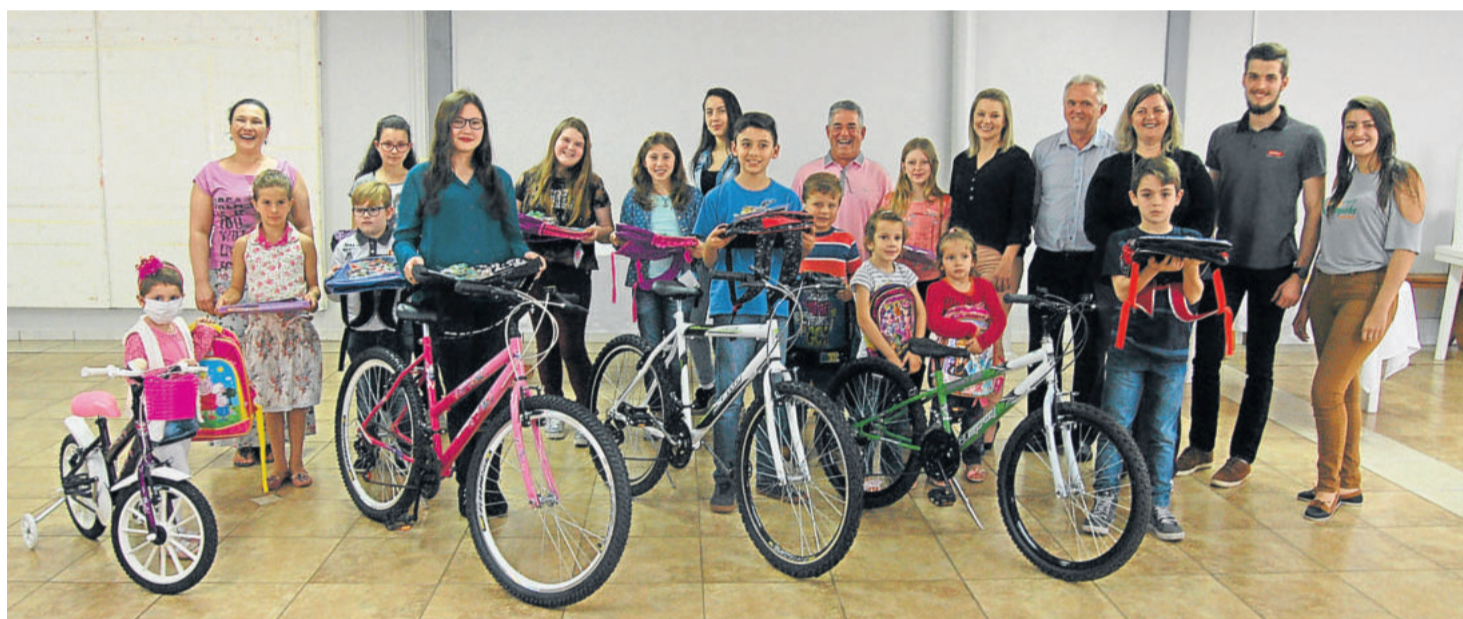
Entrega dos prêmios aos artistas vencedores

A organização do concurso agradece a todos participantes, de forma especial aos pais e professores que apoiaram a iniciativa e aos patrocinadores, que viabilizaram a premiação a estes jovens talentos, nesta programação alusiva ao Dia das Crianças.