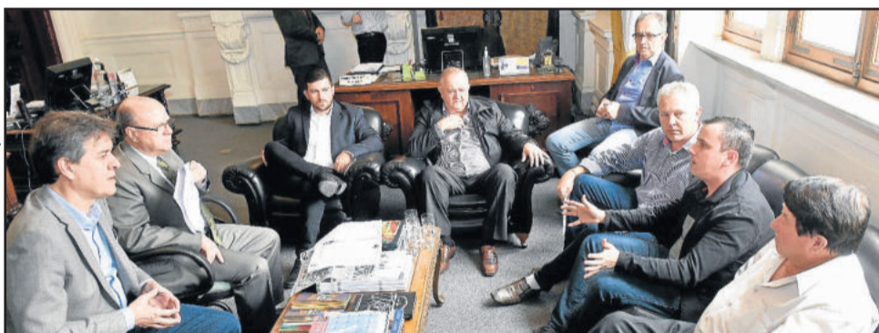
Audiência no Governo do Estado objetiva mais efetivo para melhorar a segurança pública

Ainda reforçou o pedido para que a Brigada Militar do município esteja subordinada ao comando de Teutônia, distante 12 quilômetros. Hoje, quem responde pela BM no município é o comando de Taquari, distante 30 quilômetros.