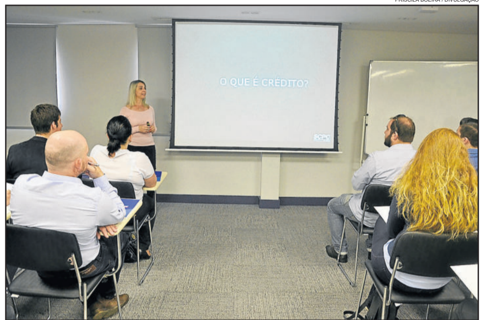
Palestra com o tema Entendendo o processo de análise de crédito foi feita pela APEME

Preocupada com estes índices, a Apeme lançou a campanha de recuperação "Comece 2018 com o pé direito". O objetivo é incentivar os lojistas a diminuírem o tempo de espera, aumentando a recuperação. Para que isto ocorra é fundamental praticar ações de inclusão com menor período. O período é propício pela chegada das datas festivas do ano. Hoje, cerca de 160 empresas garibaldenses utilizam o SCPC, entre elas grandes redes como Colombo, Lebes, Pompéia e Farmácias São João, além de lojas de varejo, financeiras e bancos.