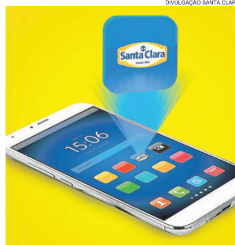
Clientes podem receber as ofertas das lojas direto no aplicativo

Em 2017, a Santa Clara completa seus 105 anos de história, o que a faz a mais antiga cooperativa de laticínios em atividade no Brasil. A sua sede está localizada no município de Carlos Barbosa e está presente através de seus 5.606 associados, em mais de 120 municípios gaúchos, atuando nos ramos de Laticínios, Frigorífico, Fábrica de Rações, Cozinha Industrial, Farmácia e 22 unidades de varejo, entre supermercados e mercados agropecuários, nos municípios onde possui associados. Atualmente possui um mix de 340 produtos, entre Laticínios, Frigorífico, Doces e Sucos.