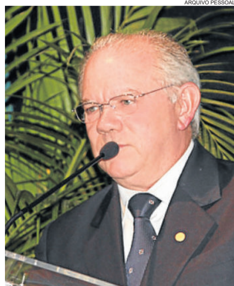
Pedro Bertolucci foi prefeito de Gramado por quatro mandatos

O evento será realizado no dia 29 de novembro, às 19h30min, no Auditório da Tramontina, localizado na rua Maurício Cardoso, 348, e é aberto ao público. Mais informações podem ser obtidas através do telefone (54) 3433-2195, ou e-mail desenvolvimento@carlosbarbosa.rs.gov.br.