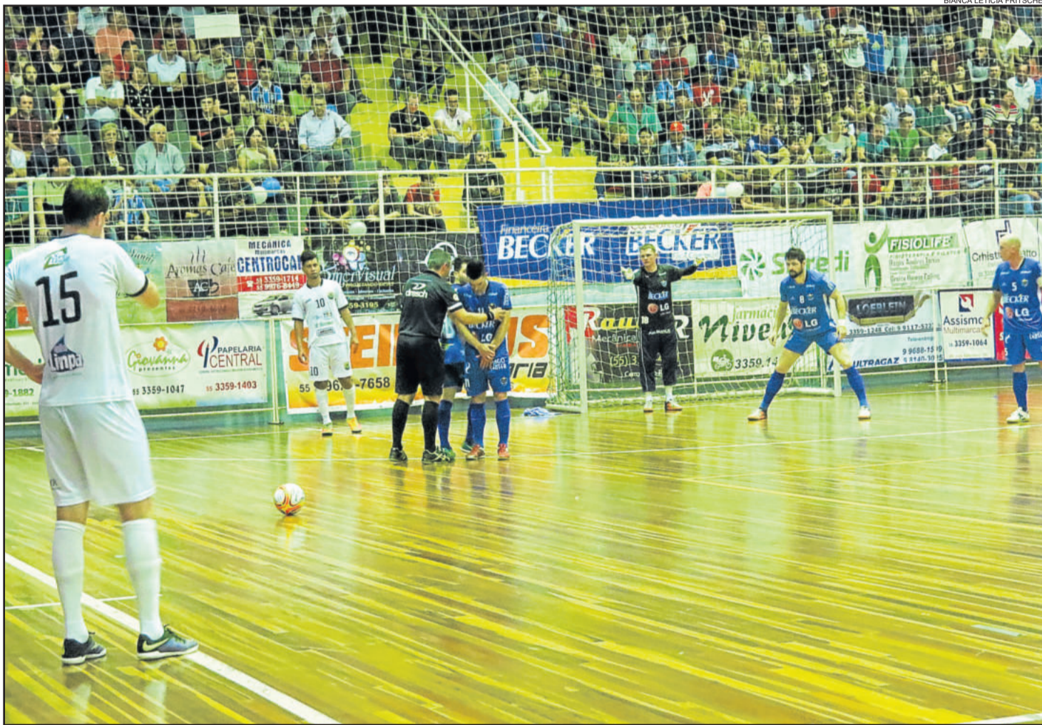
BIANCA LETICIA FRITSCHER