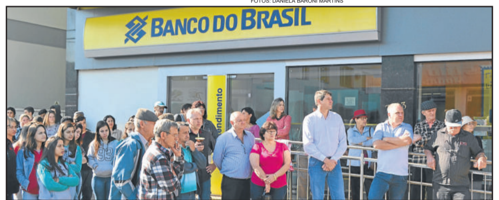
Comunidade se reuniu em frente ao Banco do Brasil, no Centro

O prefeito ainda destacou que a necessidade de maior segurança não é somente em função do banco, mas por toda a comunidade que está apreensiva com os assaltos que vêm ocorrendo.