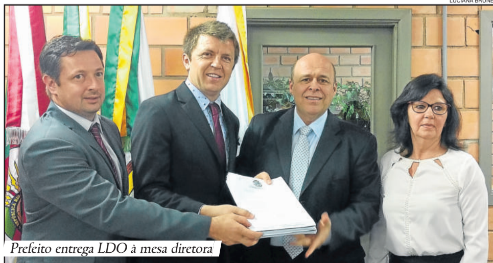
Prefeito entrega LDO à mesa diretora