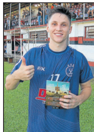
Dani Boy, do Flor de Maio, mudou o cenário e foi o craque do jogo