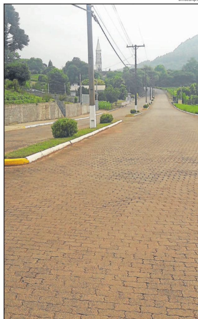
Canteiros receberam embelezamento