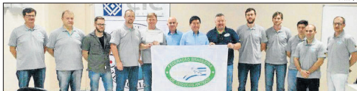
Grupo é o primeiro do Vale a receber a certificação