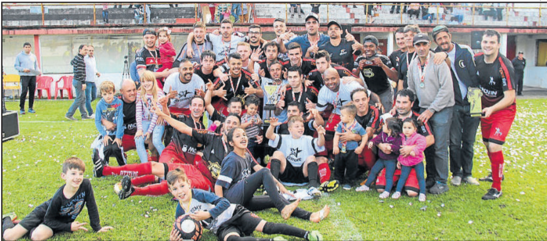
Guarani é o campeão na categoria Principal