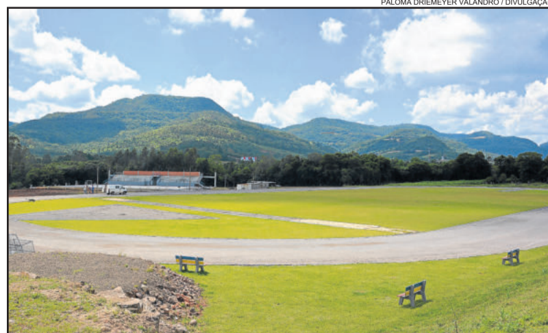
Pista de Atletismo será inaugurada amanhã, com torneio intermunicipal

O Torneio Intermunicipal de Atletismo envolverá as equipes CEMEF de Teutônia, Westfália, Colégio Teutônia e Imigrante. A promoção é da Administração Municipal de Westfália, através da Secretaria de Educação, Cultura, Turismo e Desporto (SMEC).