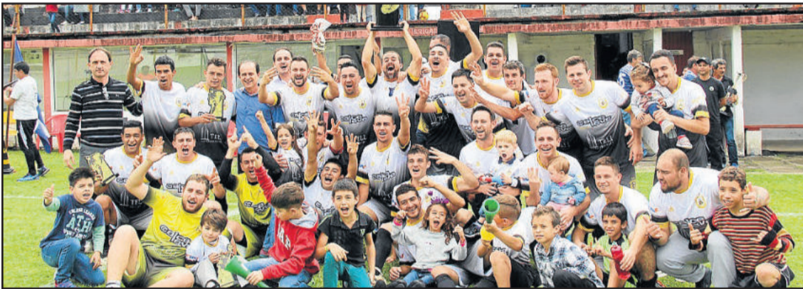
Sexta livre faturou o título na categoria Aspirantes