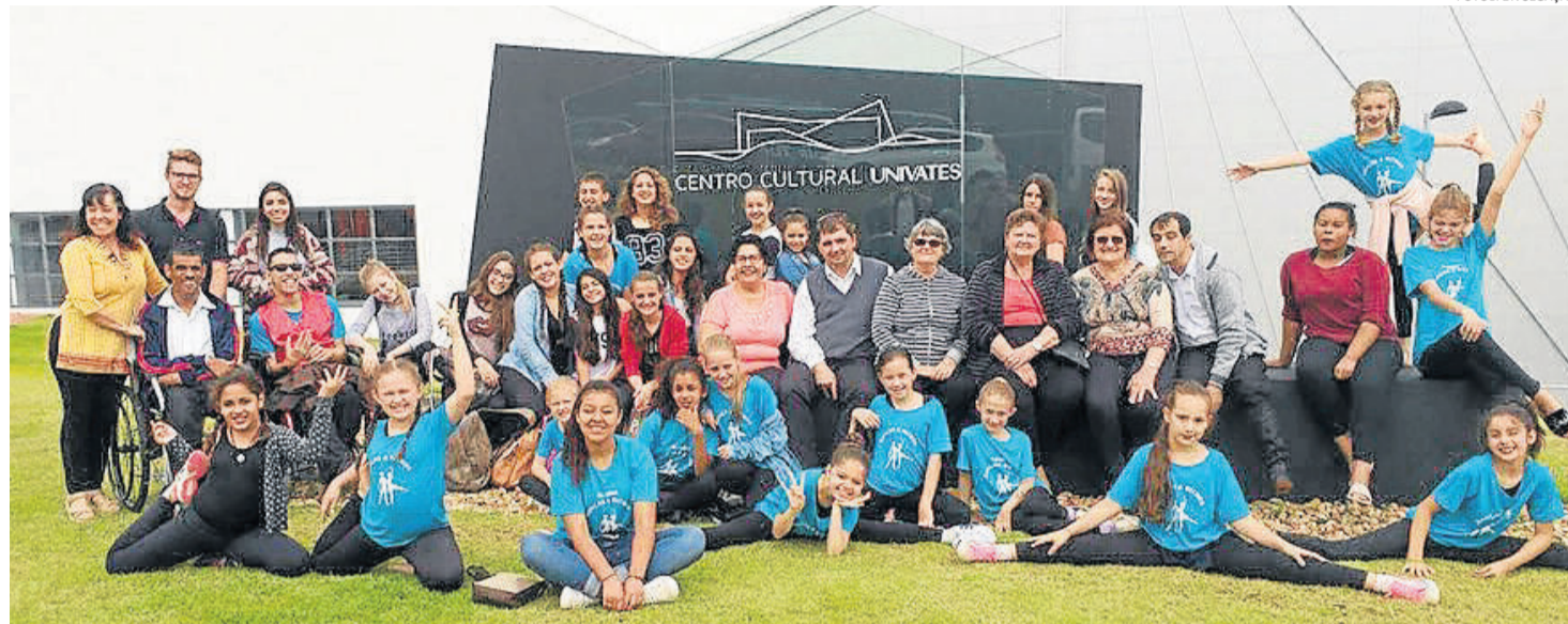
Danças Cemef e Melhor Idade na Univates