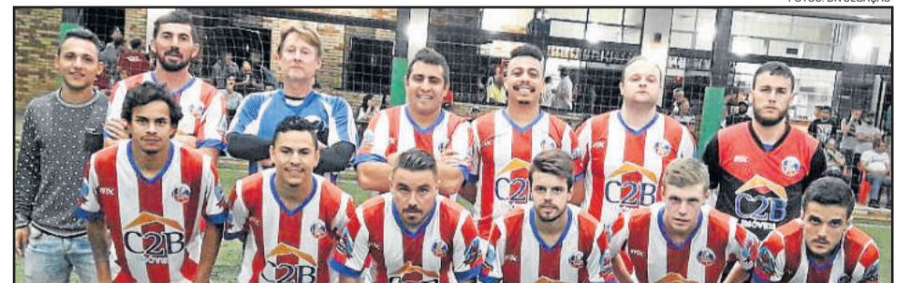
Lesionados passou pelo Martello e agora enfrentará o Nova Geração

Já estavam garantidos na próxima fase: IMEEC de Teutônia, Kaxa Baxa de Teutônia, AABBOC de Canoas (atual campeã) e Amizade de Caxias do Sul.