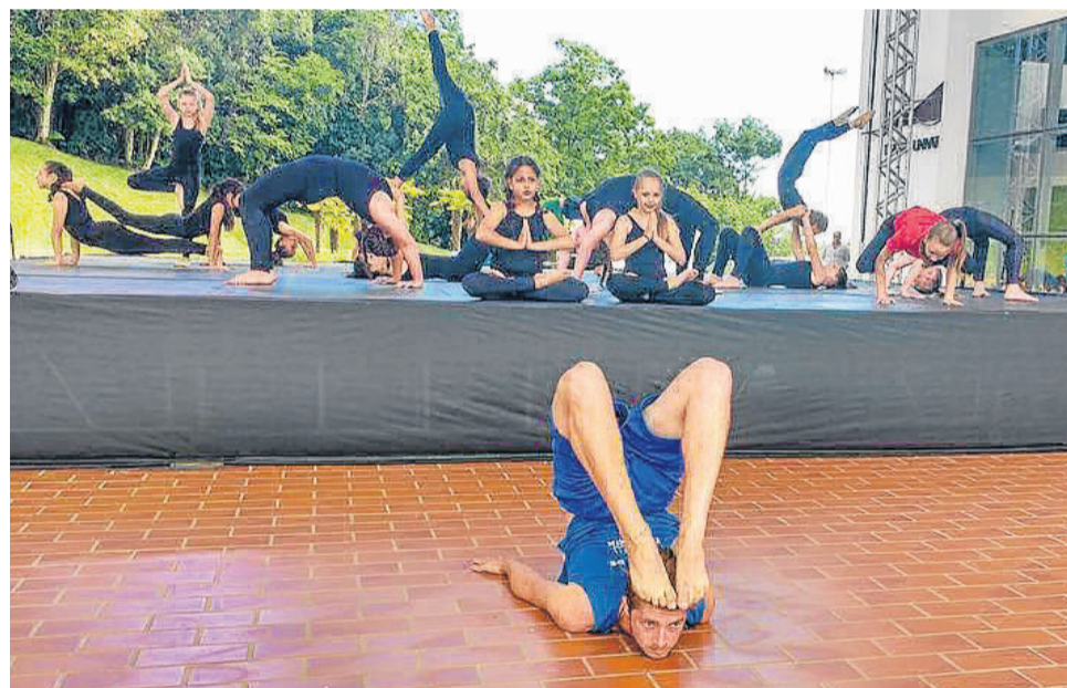
Yoga do Cemef na Ciranda Cultural

Já a Mostra de Dança Univates, evento em sua 10ª edição, aconteceu em duas noites no Teatro Univates. Dia 24 foi a vez da categoria infantil e no dia 25, jovens e adultos. Os alunos participantes dos dois grupos foram os mesmos citados acima. As apresentações foram: Infantil com Amizade Cemef, Alegria Cemef e Colorir Papel Cemef; Juvenil com Mix Street Dance e Yoga Cemef; Adulto com Esperando na Janela Melhor Idade.