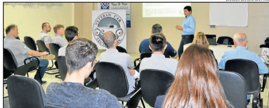
Presidente da Federação Nacional palestrou na oportunidade

A cerimônia de filiação do Veteran Car encerrou com um almoço de confraternização na Lagoa da Harmonia. O grupo teutoniense realiza reuniões todo terceiro domingo do mês na Prefeitura de Teutônia ou, então, participa de encontros pelo Estado.