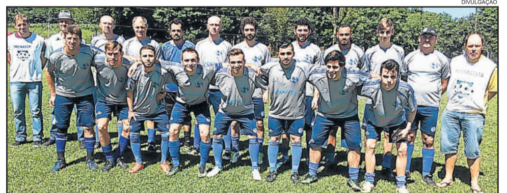
Avante venceu o primeiro jogo da final