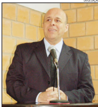
Prefeito Celso Kaplan

O prefeito destacou que nem tudo foram flores, que as dificuldades também fizeram parte, com a necessidade de enxugar as despesas para fechar as contas com tranquilidade. Lembrou também a enxurrada de 9 de dezembro, que danificou muitas estradas que ainda não foram completamente recuperadas.