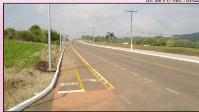
CRISTIANO STAPENHORST SCHWARZ