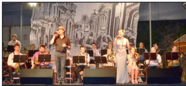
Programação encerrou com a apresentação da Orquestra Municipal de Garibaldi, com o concerto Sopros do Caribe

Em sua 16ª edição, o Natal Borbulhante foi uma realização da Prefeitura de Garibaldi, por meio da Secretaria de Turismo e Cultura.