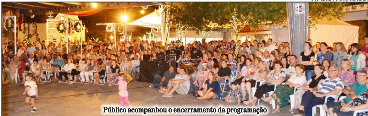
Público acompanhou o encerramento da programação

O evento garibaldense que teve início no dia 11 de dezembro, encerrou no domingo, dia 22. Foram 12 dias e mais de 40 atrações na Praça Loureiro da Silva. O concerto Sopros do Caribe, executado pela Orquestra de Garibaldi, finalizou as atividades.