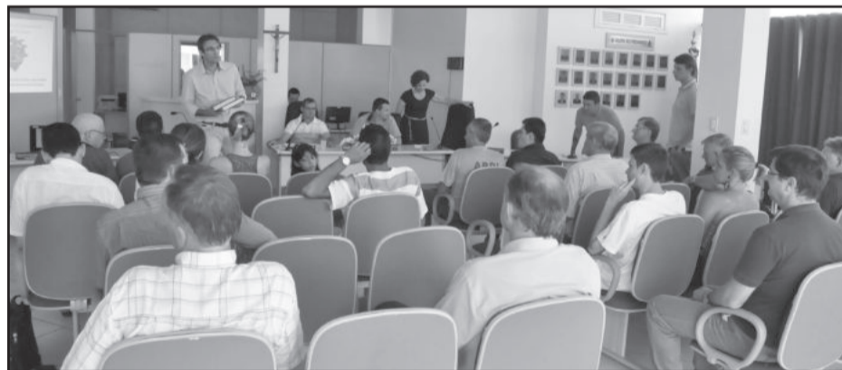
Audiência pública serviu para a apreciação do Plano de Saneamento