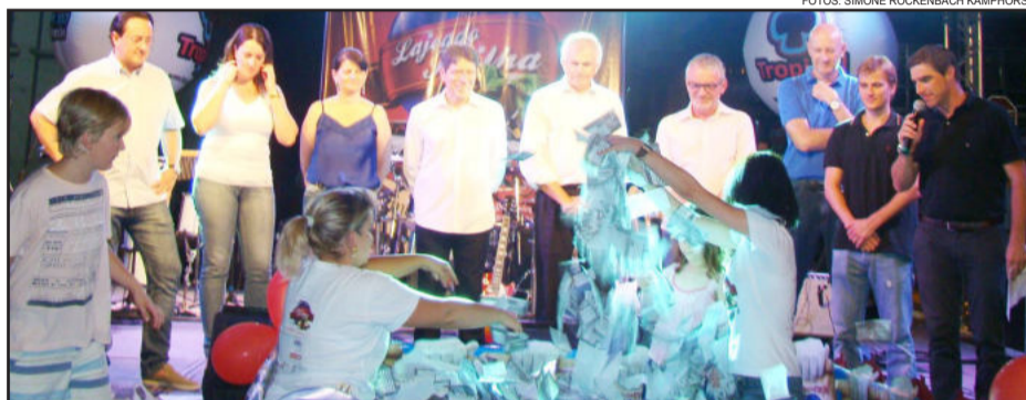
Sorteio foi realizado em frente à Casa de Cultura, no Centro de Lajeado