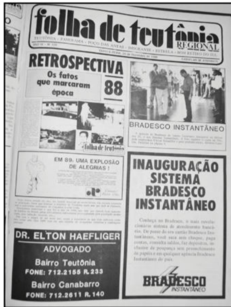
Ortografia mantida conforme edição da época