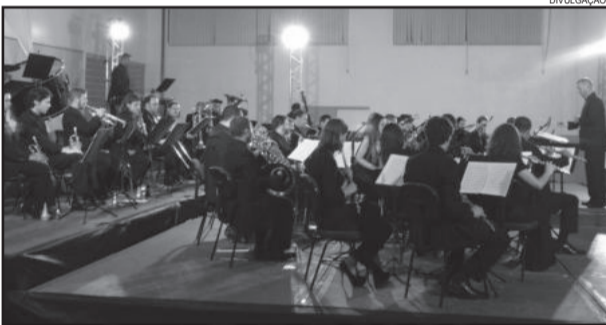
Orquestra Municipal de Carlos Barbosa apresenta um repertório diversificado

O governo tem como prática o incentivo a cultura local, por meio da música, arte, dança. Esta apresentação faz parte da programação do Natal no Caminho das Estrelas, uma realização da Administração Municipal por meio da Secretaria da Indústria, Comércio e Turismo de Carlos Barbosa.