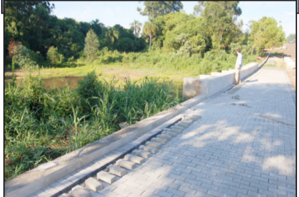
Construção do passeio público junto ao Parque Ambiental no Bairro Alesgut