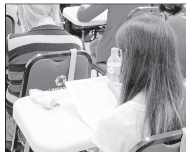
Gabarito foi divulgado ontem, dia 27

O gabarito foi divulgado no dia de ontem, segunda-feira, e o prazo para recursos é de 28 (hoje) a 30 de abril (quinta-feira). Mais informações podem ser obtidas pelo site www.unars.com.br .