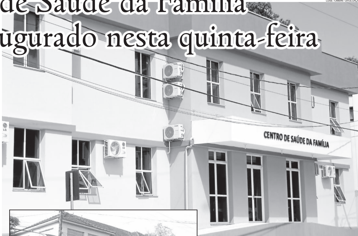
Centro de Saúde da Família irá unificar os serviços de saúde prestados

As novas instalações do Centro de Saúde da Família, além de oferecer um espaço mais amplo, estruturado e acolhedor, serão em um prédio com grande valor histórico e cultural para a toda população. “Tentamos manter a fachada num projeto moderno e arquitetônico, bem como buscamos preservar alguns equipamentos, que estarão expostos como forma de museu da saúde.