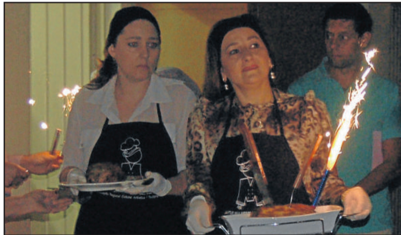
Pratos sendo trazidos ao salão