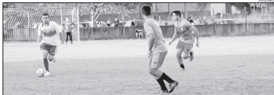
Internacional venceu o União e se garantiu na final

Titulares - Guaíba x Internacional As finais serão nos dias 10 e 17 de maio, devido a melhor campanha o Internacional joga por dois empates em ambas as categorias, uma vitória para cada equipe leva a decisão para as penalidades.