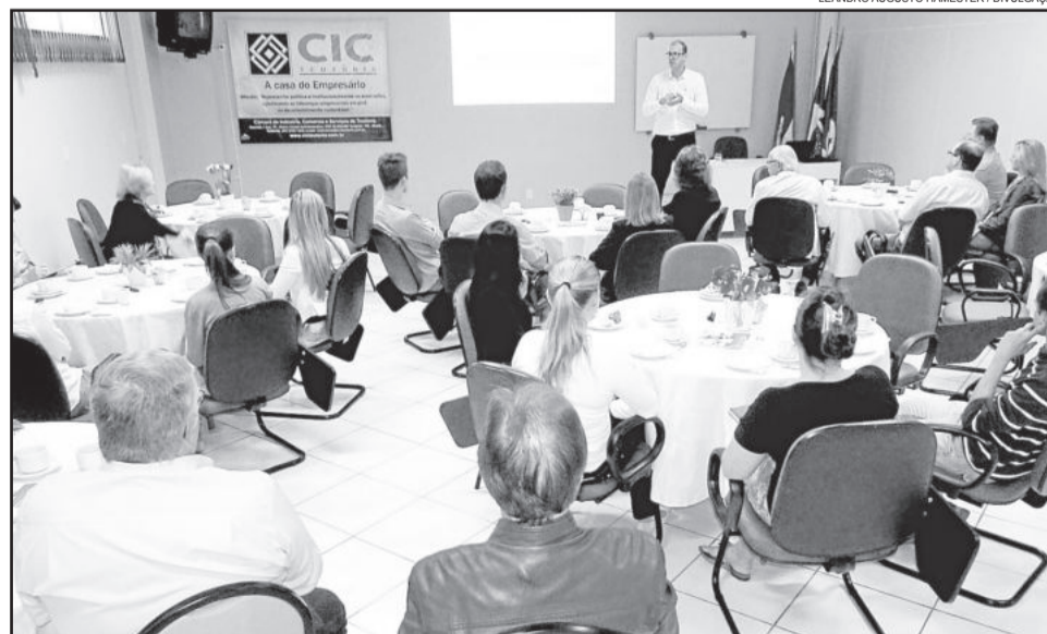
Café da Manhã Empresarial teve a participação de 30 pessoas

está na 40ª posição. A liderança, com folga, é dos Estados Unidos. "O Brasil apresenta uma taxa baixa de implementação da nossa criatividade, por isso essa colocação no ranking da inovação. O esforço em inovação está fortemente relacionado ao nível de desenvolvimento de um país. O importante é não desistir. Aprender com os seus erros e erros dos outros", ponderou.