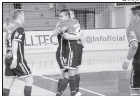
ALAF goleou o São Paulo por 6 a 2

Foi a segunda vitória em quatro jogos da ALAF na Liga Nacional de Futsal. Ontem à noite, os comandados de Giba encararam o Brasil/Kirin, de Sorocaba/SP, do craque Falcão, jogando em casa. E amanhã, a ALAF volta a jogar pela Série Ouro, ao enfrentar a Teutônia Futsal, em Teutônia.