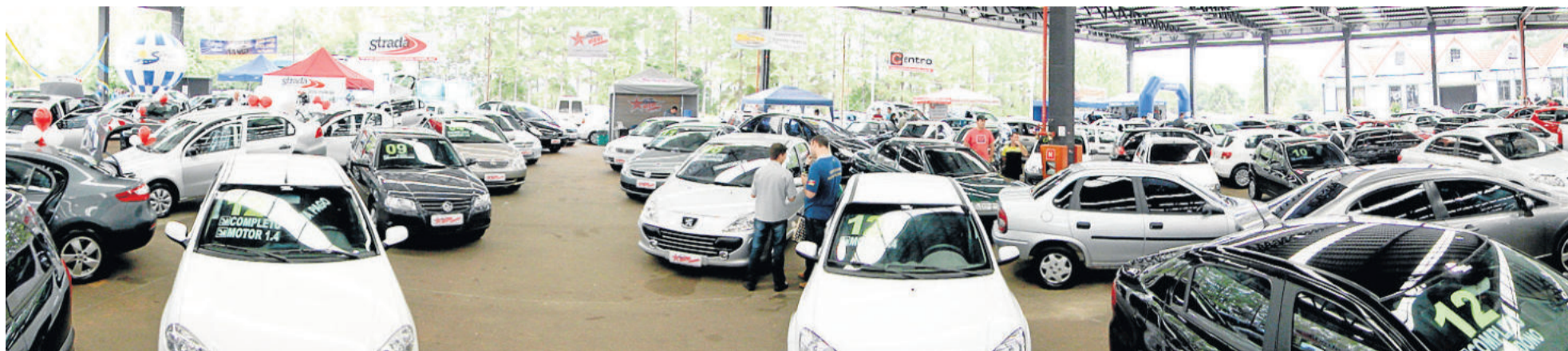
Feirão reuniu sete revendas de Teutônia no Pavilhão Multiuso do Centro Administrativo Municipal