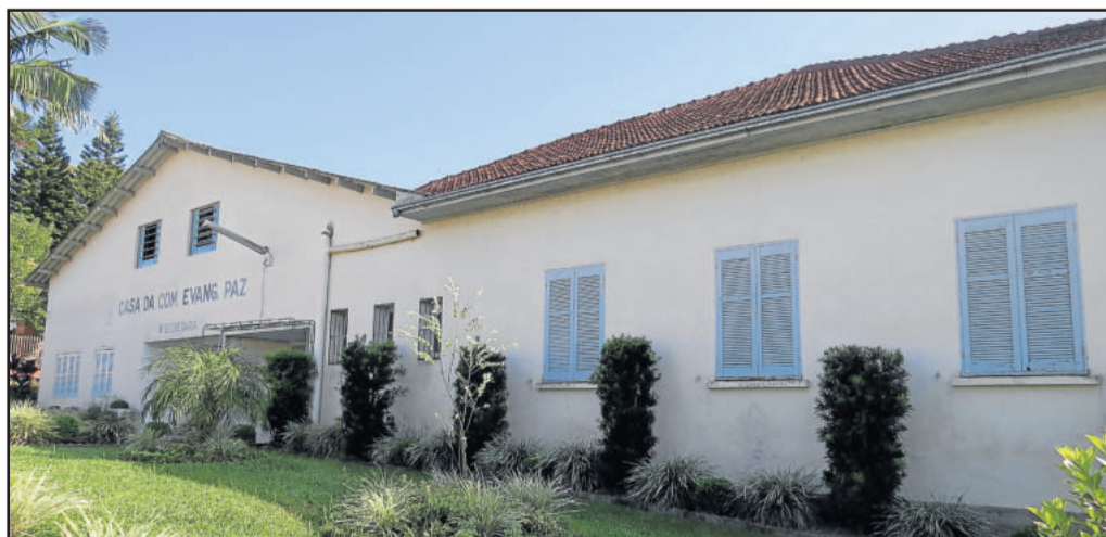
Hoje, a Comunidade Evangélica Paz, do Bairro Teutônia, sedia o encontro

Nesta terça-feira, dia 28 de abril, a Administração Municipal de Teutônia realizará o Encontro Comunitário no Bairro Teutônia para apresentar as ações desenvolvidas, se aproximar da população e ouvir a comunidade. O primeiro encontro está marcado para o Bairro Teutônia, com convite estendido aos moradores de Linha Frank/Vila Cuba. A programação será na Comunidade Evangélica Paz do Bairro Teutônia, com início às 18h30min.