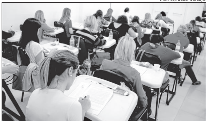
Concurso público foram aplicadas sábado, dia 25

As provas escritas do Concurso Público de Imigrante foram aplicadas no sábado, dia 25, no Prédio 18 do Centro Universitário Univates, em Lajeado. No total, 556 candidatos se inscreveram e mais de 90% do inscritos compareceu para a realização das provas.