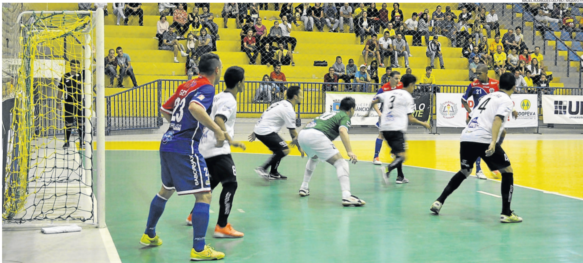
Teutônia Futsal (de branco) venceu em São Luiz Gonzaga. ALAF vem de sequência forte pela Liga Nacional. TEUTÔNIA ▶ 15 E CONTRACAPA