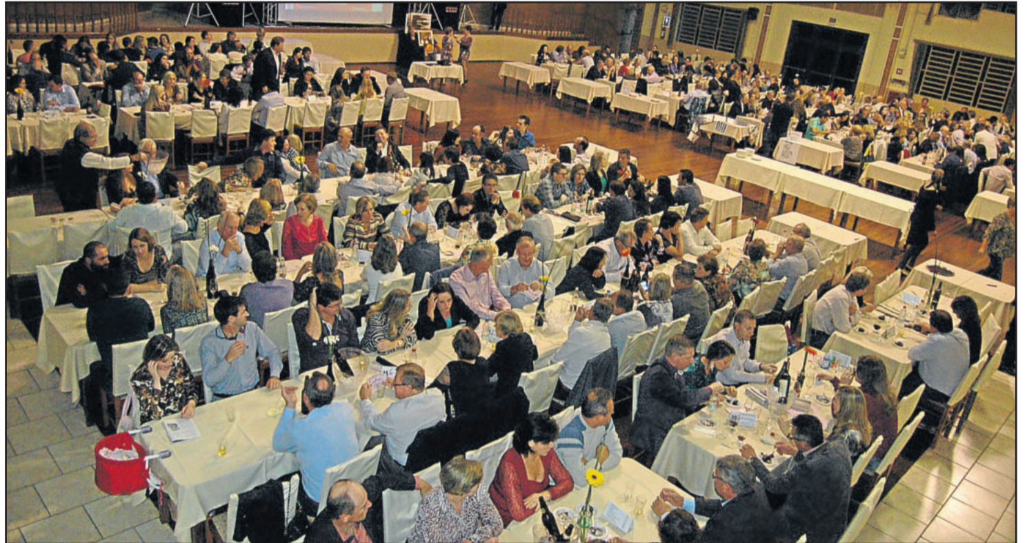
Público prestigiou jantar na Associação Pró-Desenvolvimento de Languiru

Depois do jantar, das sobremesas que também são doadas por voluntários, e do sorteio de prêmios, a festa prosseguiu com animação de Xepa e Banda.