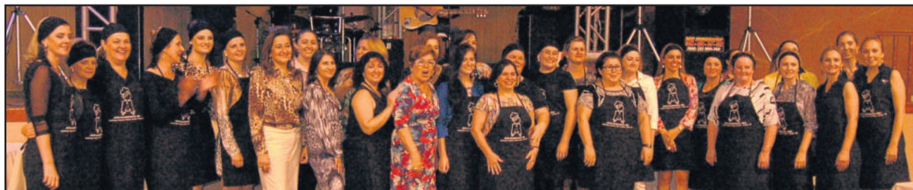
Gourmets da noite prepararam 14 diferentes pratos