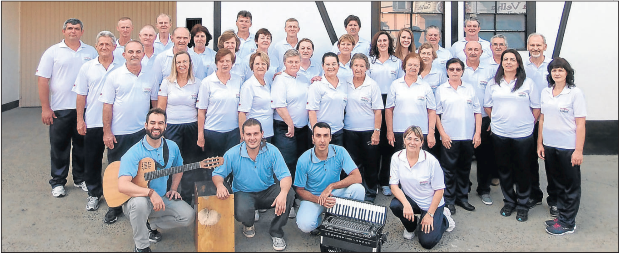
Grupo Teuto-Brasileiro faz pré-estreia na próxima quinta-feira, dia 30