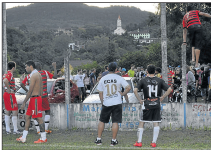
Confusão se estendeu para fora do gramado

A intensidade da rivalidade no clássico se refletiu em confusão, além de se estender para fora do gramado. Ao final da partida, alguns dos atletas e dirigentes, de ambas equipes, buscaram explicações e também apresentaram críticas ao árbitro da partida. A partir desse episódio, até então, pacífico, começou a confusão. A invasão de torcedores no gramado foi o estopim. Depois disso, a confusão se estendeu para fora do campo. As torcidas se envolveram e a arena do confronto foi atrás da goleira. Os dois técnicos manifestaram, em entrevista, sua clara insatisfação com a atuação do árbitro.