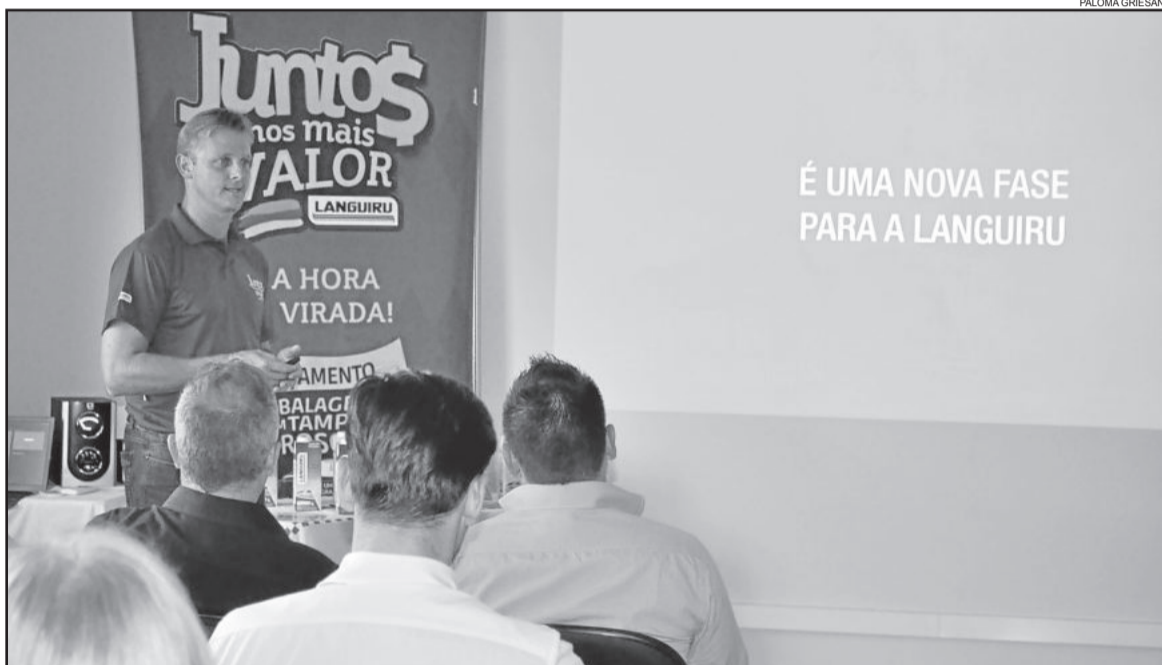
Rückert apresentou as novas embalagens para a imprensa ontem à tarde, na sede administrativa

Novas embalagens prometem mais praticidade