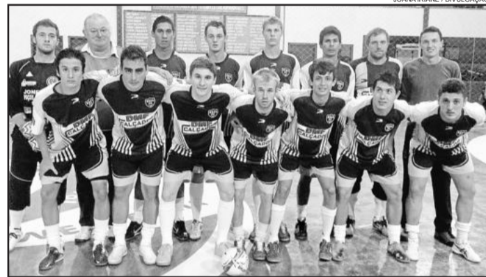
Cristal Mòveis/Isafarma categoria Força livre

O equilíbrio prevaleceu nos três primeiros jogos da noite de sexta-feira, dia 25, pela 5ª Copa Juventude/Só Alegria de Futsal,