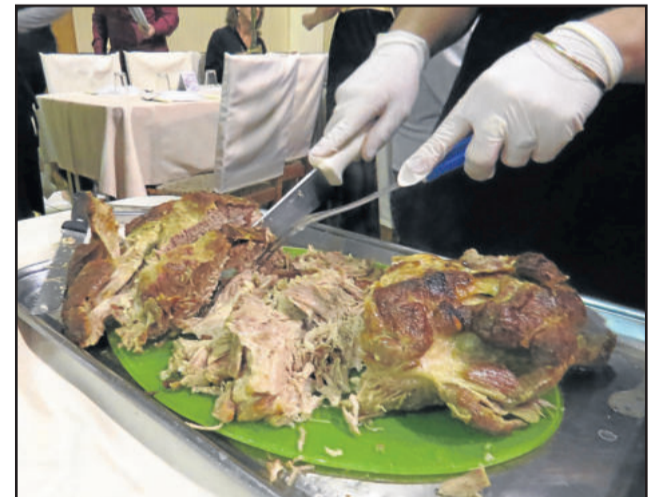
Prato típico de Teutônia, Schweinbraten, foi apresentado pelo Teutotanzgruppe