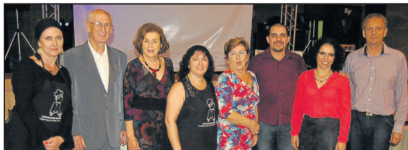
Diretoria da Arca