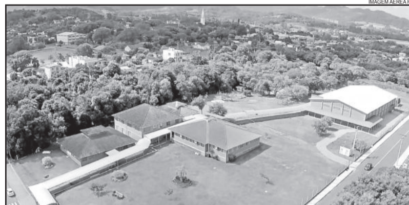
Escolas Municipais, como a Alfredo Schneider, terão escolha de diretores por meio do voto da comunidade