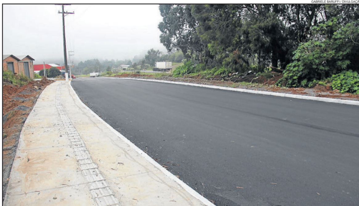
Rua Jorge Amado foi entregue à comunidade no dia 24, sexta-feira

Finalizando a programação de sábado, uma comitiva visitou a obra da Rua Nova Esperança localizada no Bairro Fenachamp e que receberá pavimentação de blocos de concreto intertravado