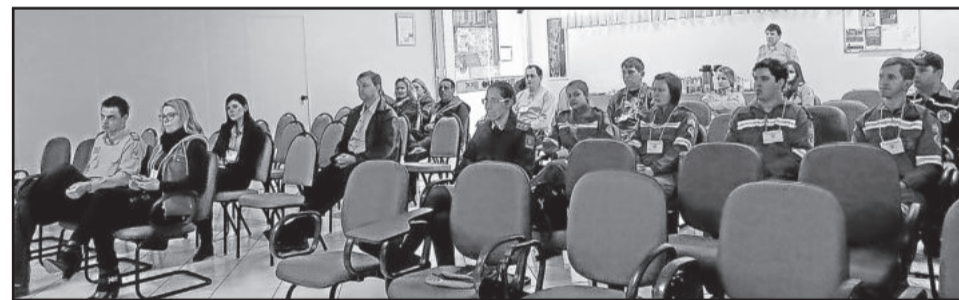
Bombeiros voluntários e outras entidades ligadas ao trânsito se reuniram para discutir a prevenção e atendimento a acidentes

Outro ponto positivo que ele destacou foi que o evento atraiu mais voluntários. “Mais pessoas se interessaram e vão querer ser bombeiros voluntários também. Então, minha avaliação foi essa, de que conseguimos abrir o leque. O problema que eu achei que iríamos resolver em Teutônia, percebi que era uma causa em nível de Estado, que todos os bombeiros voluntários estão abraçando”, conclui.