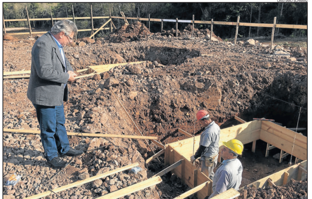
Base para os pilares em construção

1ª Etapa da Quadra poliesportiva de Westfália, a ser executada na Rua Leopoldo Fiegenbaum, S/N, Bairro Centro, numa área total de 2.250,90 m², incluindo material e mão-de-obra.