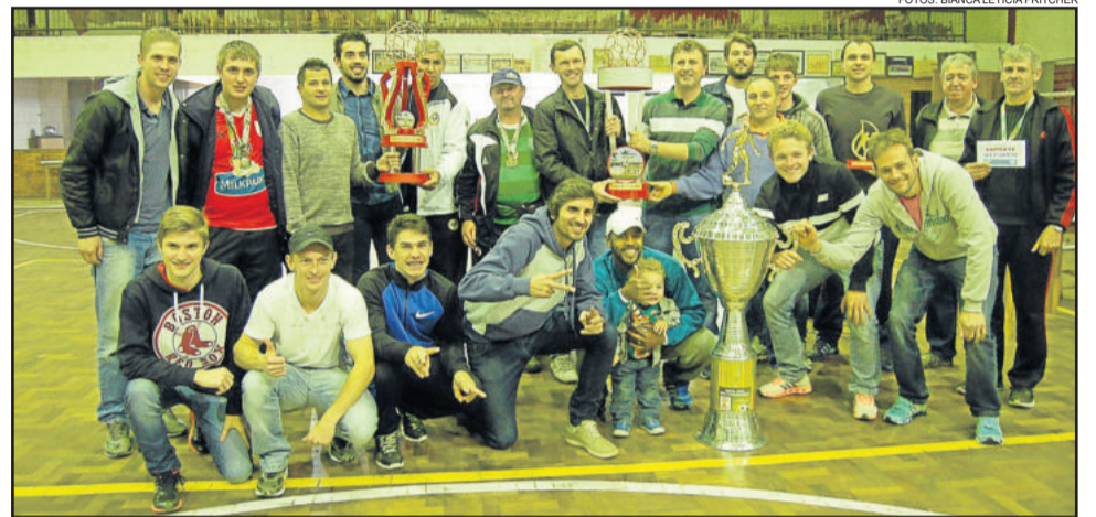
Grêmio Esportivo Catarinense, campeão da Supercopa e do Municipal de Teutônia na categoria Titulares

Antes do início da premiação do Campeonato Municipal de Teutônia, foram premiadas as equipes envolvidas na Supercopa Erni Stapenhorst.