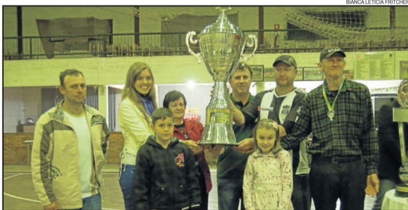
ECAS foi campeão dos Aspirantes e vice nos Titulares da Supercopa