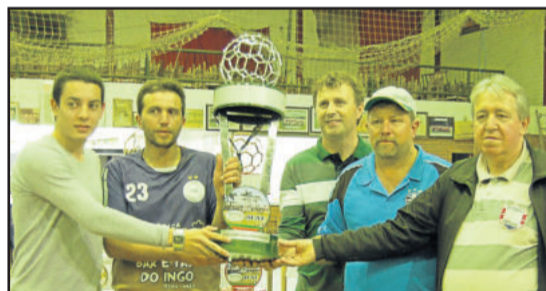
Juventude da Cuba, vice-campeão dos Aspirantes