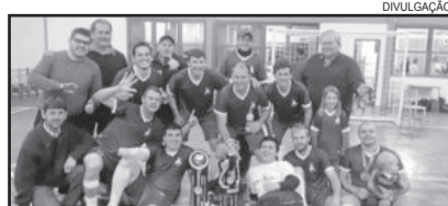
Schneider Construções conquistou o título nas cobranças de pênaltis