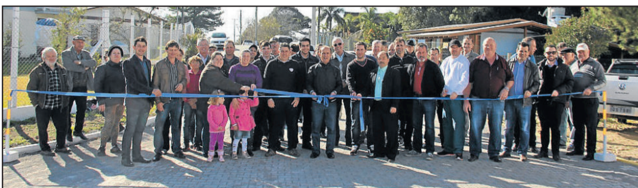
Inauguração Rua Júlio Zanotto