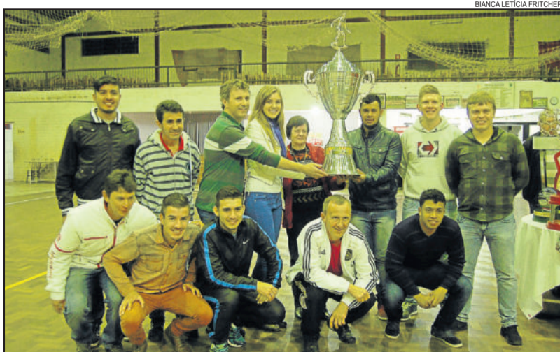
Atlético Gaúcho foi vice-campeão dos Aspirantes