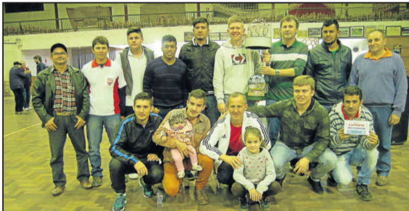
Atlético Gaúcho, campeão dos Aspirantes do Municipal de Teutônia