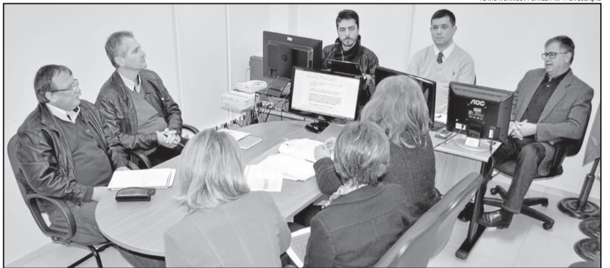
Empresa e MPT encaminham acordo para melhorias na segurança e saúde no trabalho