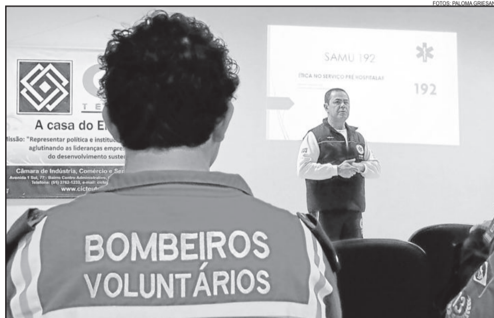
Seminário buscou trazer mais qualificação e novas ideias para os bombeiros voluntários