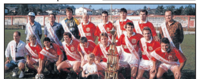
Apixonado, levou o Gaúcho a grandes conquistas