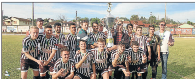
ECAS festejou a conquista da Supercopa Erni Stapenhorst nos Aspirantes