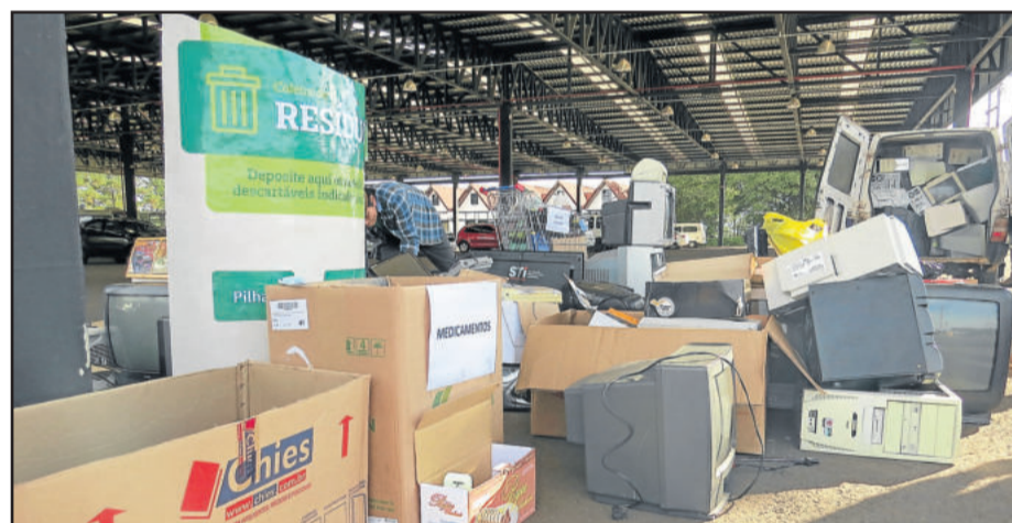
Recolhimento de lixo eletrônico e medicamentos vencidos superou a expectativa