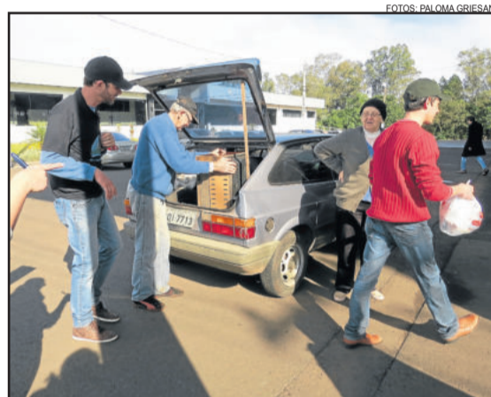
Equipe da Parceiros Voluntários recebeu os resíduos

A ação de recolhimento de lixo eletrônico e medicamentos faz parte do projeto ambiental Revive Boa Vista. Neste ano, a iniciativa chega à sua 7ª edição e é realizada pela Parceiros Voluntários, com apoio da Prefeitura de Teutônia, Emater/RS e das mantenedoras CIC Teutônia, Certel, Couros Bom Retiro, Seccare, Languiru, Sicredi, Unimed, Grupo Krabbe e Star Led.