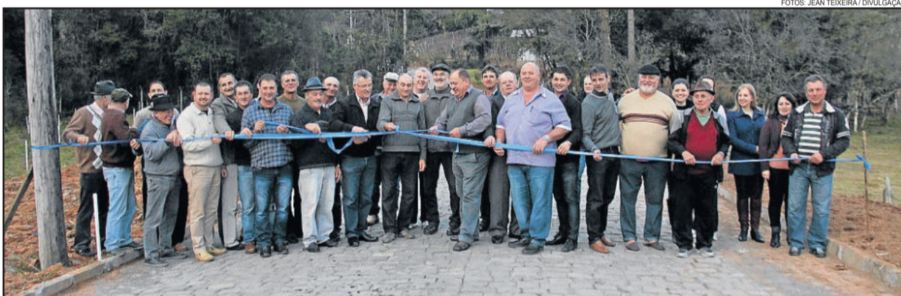
Inauguração Santo Alexandre