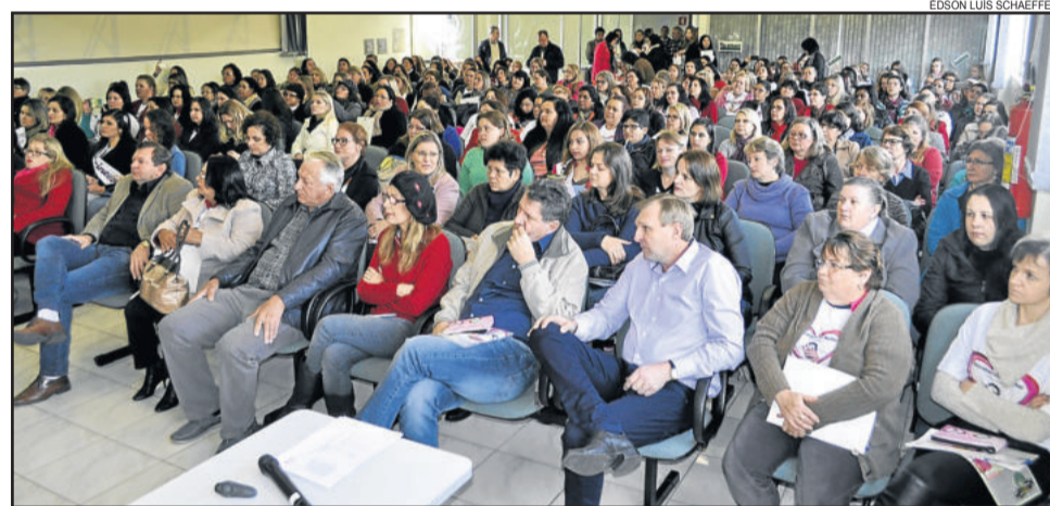
Mais de 200 mulheres participaram do encontro