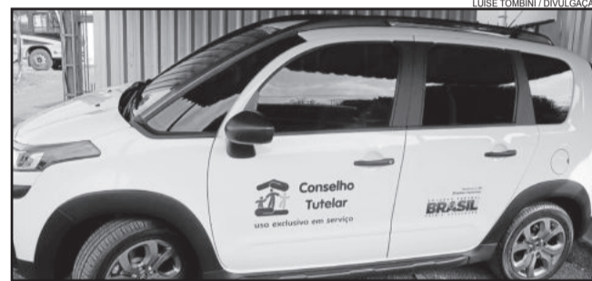
Imigrante foi um dos municípios contemplados com carro e kit para o Conselho Tutelar