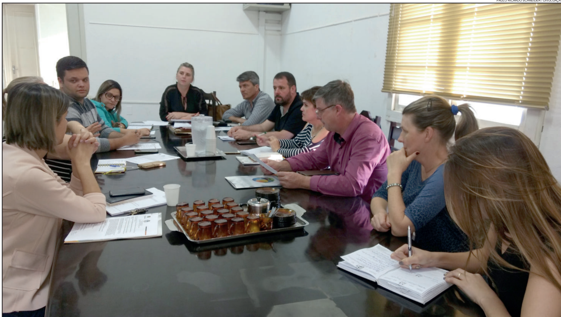
Reunião na Prefeitura de Estrela definiu mais detalhes da programação regional

R eunidos no Salão Nobre da Prefeitura de Estrela, na tarde de segunda-feira (25/09), os representantes do município, de Bom Retiro do Sul, Colinas e Imigrante começaram a definir a programação da Jornada dos Três Reis Magos, evento que envolverá as quatro cidades durante o período natalino. A proposta de uni-las em torno de uma programação integrada é para que os visitantes possam desfrutar do que cada uma oferece, incrementando assim a economia e o turismo.