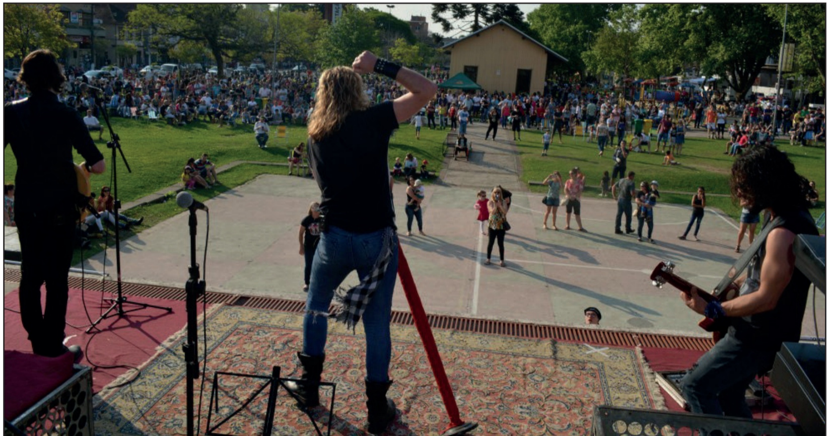
Shows reuniram o público no Parque da Estação