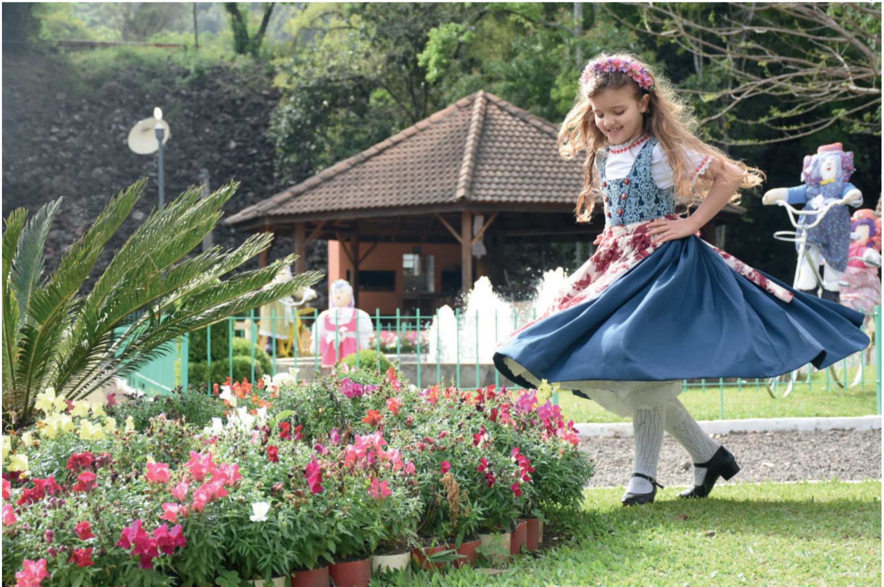
Em 2016, 3º lugar - Dançando e encantando