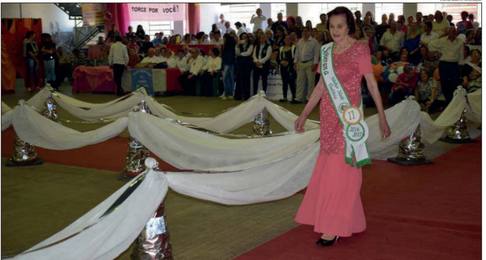
Nova Soberana Municipal será escolhida no dia