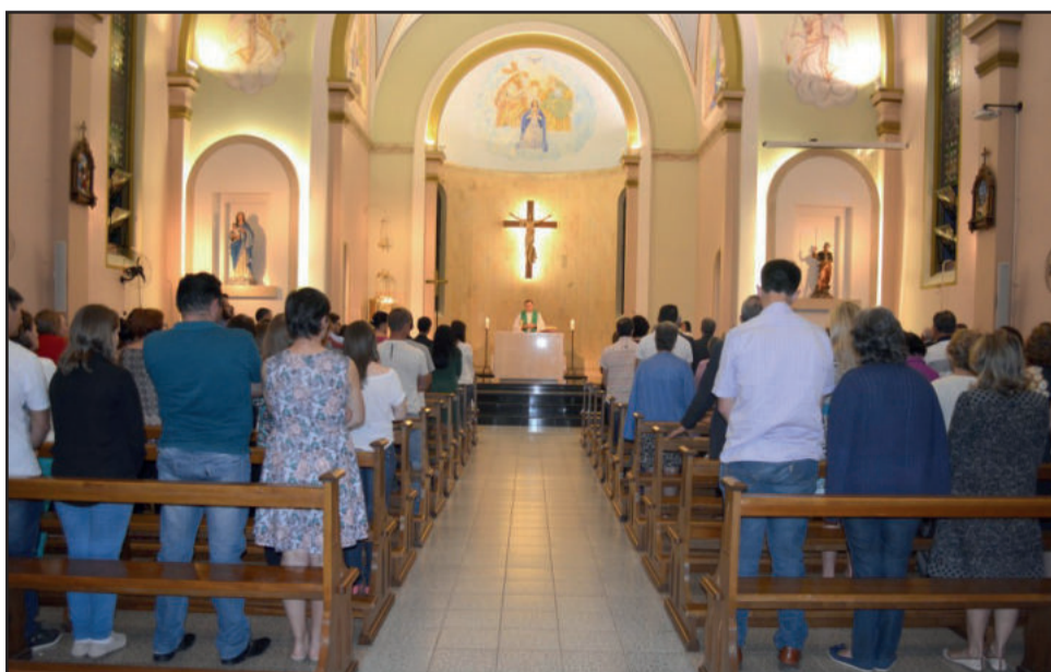
Missa celebrou o aniversário do município