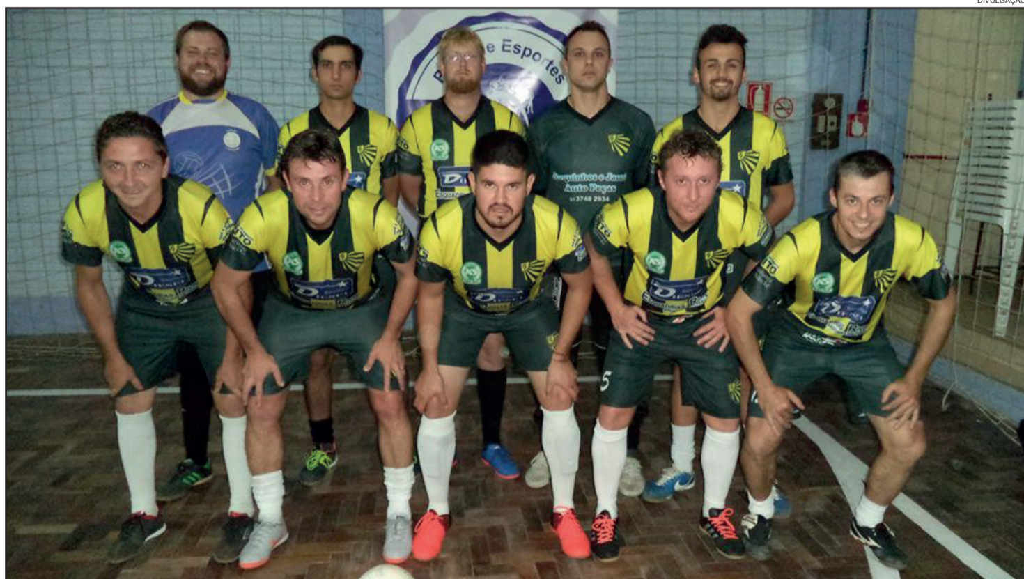
Elenco do Geraldo Alta B vai encarar um dos times da casa, Costão A

Os Jogos Intercomunitários já realizaram as disputas da canastra (campeão: Linha Geraldo), do vôlei misto (Linha Lenz), futsal feminino (Linha Lenz) e futebol de campo masculino (Costão). Agora os jogos prosseguem com o futsal masculi-