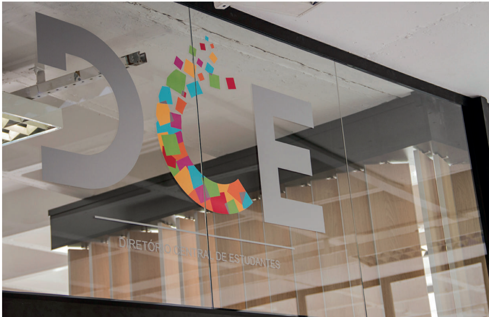
Núcleo da Diversidade do Diretório Central de Estudantes (DCE) debate representações LGBT e negras na região