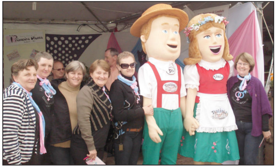
Liga participou da última edição da Festa de Maio e orientou munícipes e visitantes sobre a doença

Mais do que isso, o trabalho da entidade reforça que é possível viver com muita paz, amor e, principalmente, dignidade. “Buscamos potencializar energias psíquicas até então reprimidas para abrir novas possibilidades de vida e de relações, tratando de assuntos em que os pacientes sentem necessidades, pois toda doença promove um desequilíbrio psico-