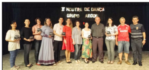
Autoridades e Grupos participantes com o troféu de participação