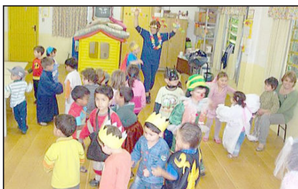
Educandário promoveu diversas atividades na Semana das Crianças