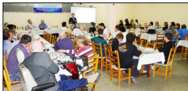
Evento contou com a participação de cerca de 50 pessoas

"A internet é um mundo maravilhoso e perigoso ao mesmo tempo. O comportamento no uso da internet deveria ser pauta de conversa na mesa de jantar das famílias, uma vez que há muitos negócios ilícitos utilizando a internet para ganhar dinheiro. Para isso, entre os métodos de propagação das ameaças digitais mais eficazes estão o medo, a ganância e a curiosidade dos usuários", concluiu o palestrante, acrescentando que "vale muito mais a consciência e o comportamento dos usuários do que o antivírus propriamente dito".