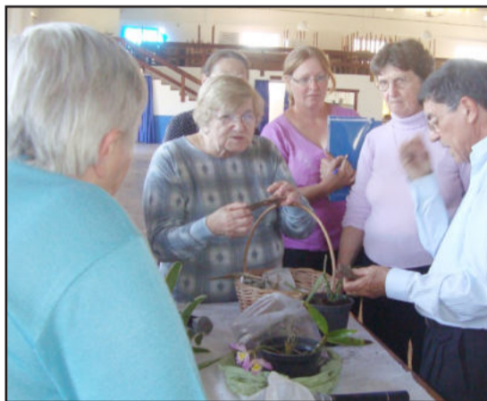
Demonstração prática aos presentes