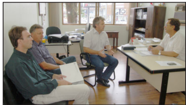
No DAER, Município pede melhorias na RS-419

No encontro de segunda-feira, dia 24, a Administração Municipal também recebeu posição favorável do DAER para construir um refúgio na RS-419, em Pontes Filho, para permitir que os motoristas aguardem em segurança, na lateral da pista, para ingressar à estrada que dá acesso a Linha Clara. O formato atual é perigoso, pois não existe refúgio nem espaço, o que obriga os motoristas a aguardarem em cima da pista. O entroncamento ainda fica próximo a uma ponte e a uma curva, o que dificulta o quadro. O DAER entende que a obra é necessária e terá a parceria do Município na execução da melhoria.