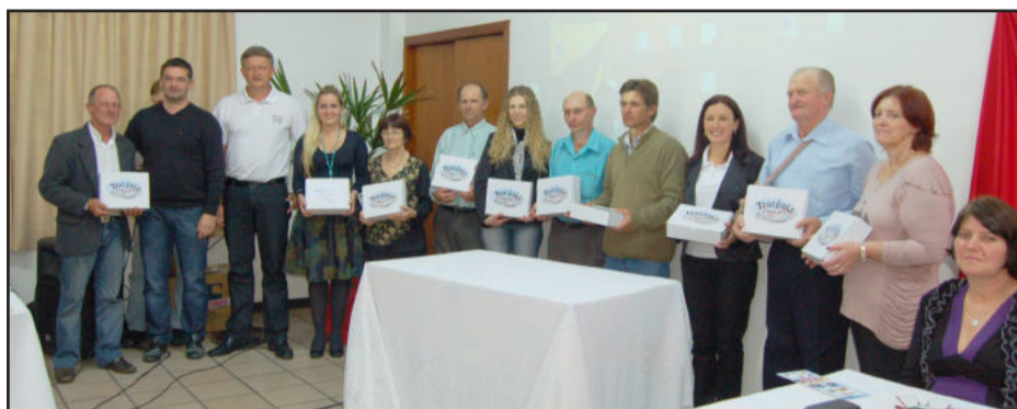
Integrantes da Rota Germânica foram homenageados