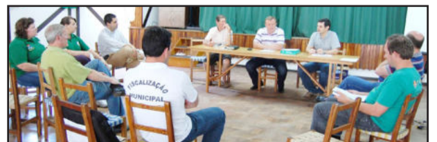
1ª Conferência Municipal realizada neste mês