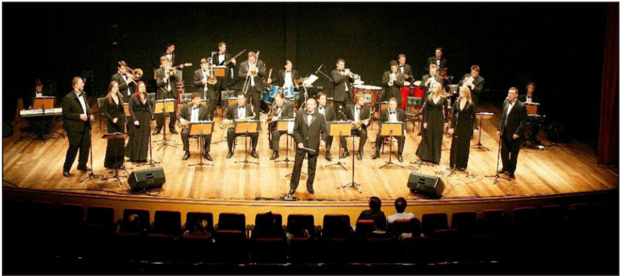
Orquestra de Teutônia faz show na segunda-feira, dia 31

A Prefeitura de Garibaldi oferece à comunidade um grande presente no dia do aniversário do Município: nesta segunda-feira, dia 31, a Orquestra Municipal de Teutônia apresenta-se de forma gratuita na Praça Loureiro da Silva, a partir das 20h, dentro da programação da Semana do Município.