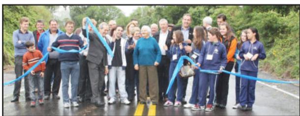
Inauguração da Rua Buarque de Macedo

Cirano também falou do empenho do Município em realizar a obra e parabenizou as comunidades de Borghetto e Garibaldina pela luta em prol da conclusão deste asfaltamento. A inauguração desta obra integrou o calendário de eventos em comemoração aos 111 anos de emancipação política de Garibaldi. Também serão inauguradas pavimentações asfálticas nas comunidades de São José de Costa Real e em Linha Araújo e Souza.