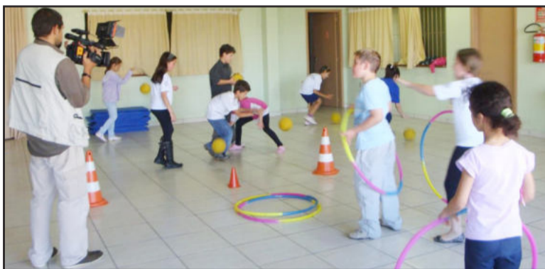
Equipe esta percorrendo núcleos do Projeto e recolhendo depoimentos de participantes

A série de reportagens foca a seriedade de como o projeto é desenvolvido no Município e pode ser acompanhada pelo site do ministério ( www.esporte.gov.br ) ou pelo canal do Youtube: ( http://www.youtube.com/ministerioesporte#p/u/4/1r1JEvXnWfQ ).