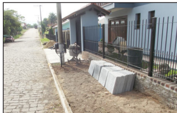
Obras de revitalização das calçadas têm continuidade

As ruas do Centro de Paverama recebem melhorias e são alargados trechos dos passeios públicos (calçadas), dando mais mobilidade ao fluxo de pedestres. A construção e reforma das calçadas tem incentivo da Prefeitura, conforme lei nº 372/93, de 08 de março de 1993, na qual foi criado programa de incentivo à construção de passeios públicos no perímetro urbano. No caso, para os proprietários de residências e prédios comerciais cabe custear o material e para a Prefeitura a mão-de-obra. Interessados podem procurar a Prefeitura, setor de fiscalização e fazer inscrição para construção, reforma ou troca de calçadas.