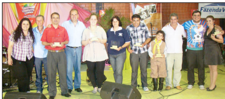
Grupos que se apresentaram receberam placas dos membros da Administração Municipal