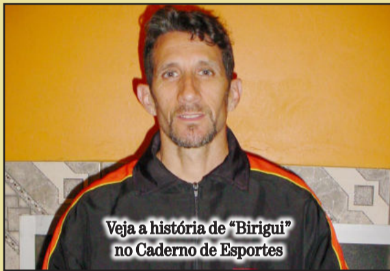
Veja a história de “Birigui” no Caderno de Esportes

“Birigui” representa o Vale na final do Estadual de Duathlon