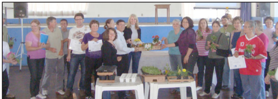
Participantes confraternizando com flores