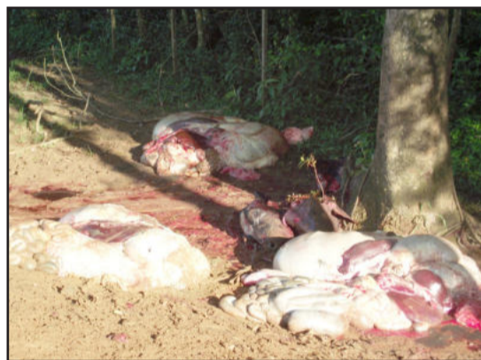
... e vísceras