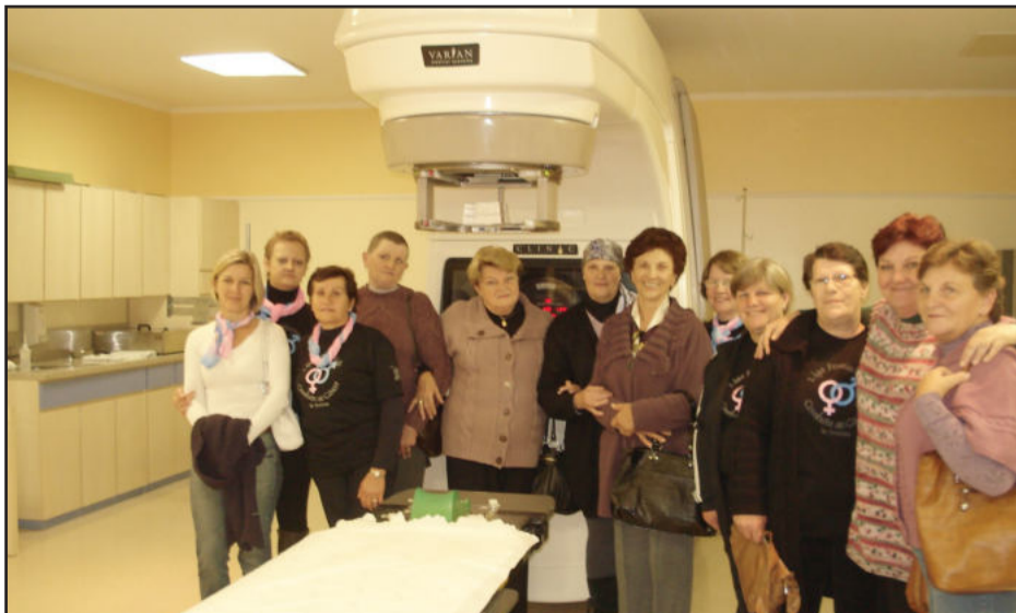
Voluntárias e pacientes realizam visitas técnicas a instituições de saúde que atendem os pacientes

A Liga conta com a parceria e apoio de diferentes entidades e profissionais. Entre esses auxiliam na divulgação da LFCCT a Municipalidade, empresas, associações de bairro, esco-