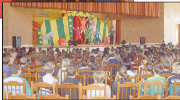
Caravana dos Poupedis movimentou 800 estudantes