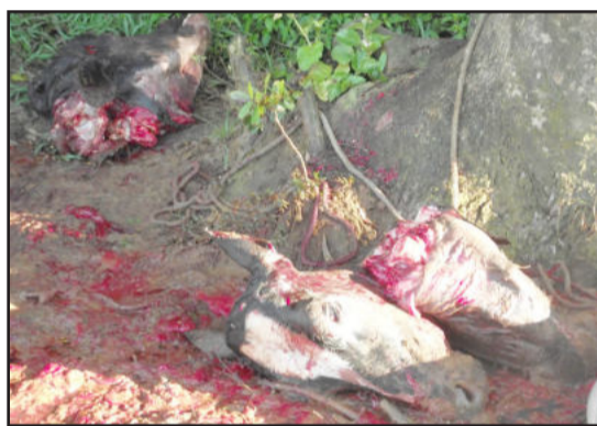
Só restaram cabeças...