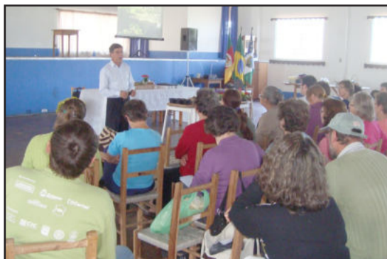
Seminário ocorreu em Colinas

O evento foi uma promoção da Prefeitura Municipal de Colinas, Secretaria da Agricultura de Colinas e Emater/RS-Ascar, com o apoio da Associação de Mulheres de Colinas e STR.