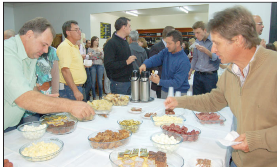
Evento encerrou com coquetel de confraternização