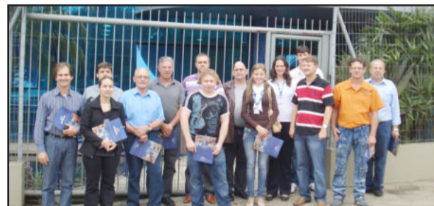
Participantes da visita técnica em frente à administração da empresa em Arroio do Meio

Atualmente a Bremil conta com mais de 300 funcionários e é considerada a empresa nacional com o mais completo portfólio de produtos, atuando no segmento de condimentos aditivos, floculados para empanados, fumaça líquida, entre outros. Está presente em 46 países dos cinco continentes, onde conta com distribuição, estrutura técnica e comercial.