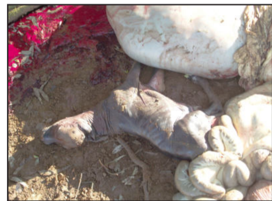
Produtor perdeu cinco vacas em ato criminoso ocorrido ontem