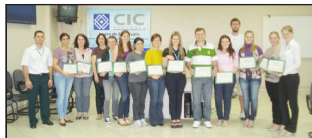
Formação ocorreu no auditório da CIC