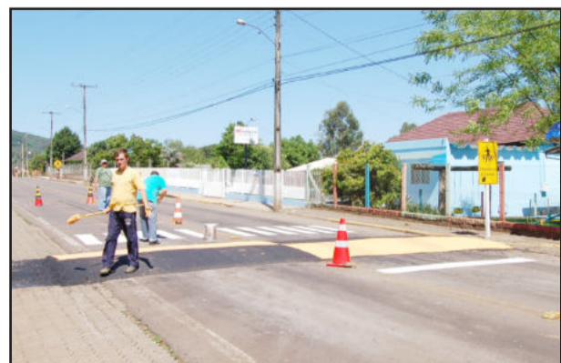
No Bairro Boa Vista, colocação de lombadas e faixas de segurança já estão concluídas