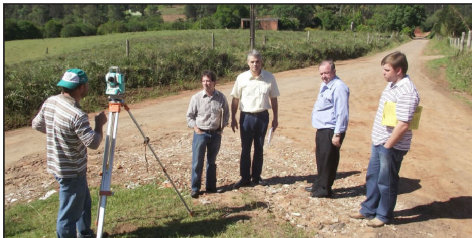
Neutral anuncia retomada da implantação de fábrica em Paverama

Inicialmente será utilizada mão-de-obra para cortes e podas da vegetação por profissionais ligados ao município, como também a reposição e compensação de arborização.