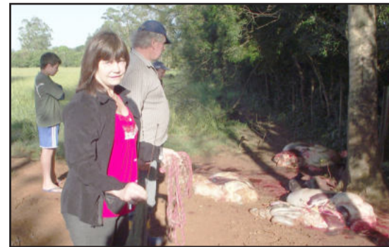
Polícia Civil esteve no local recolhendo pertences deixados pelos meliantes

A Polícia Civil investiga o caso para apurar os autores do crime de abigeato, mas não há pistas ou suspeitos. O certo é que se há crimes deste gênero é porque há estabelecimentos que recebem carne oriunda de abigeato.