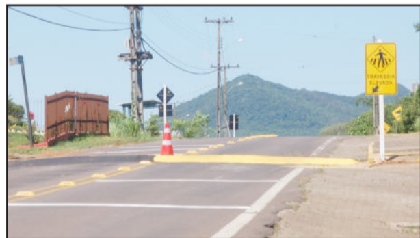
Na Vila Botafogo, tachões impedem ultrapassagens e lombada reduz velocidade