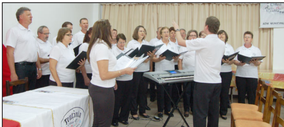
Coral Municipal de Teutônia abriu o evento