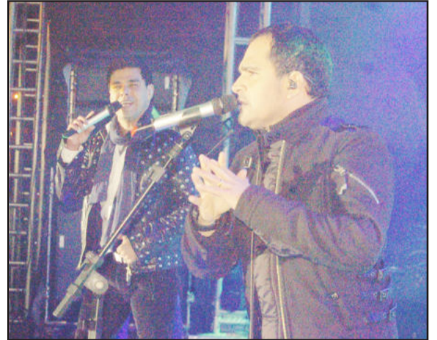
Em maio deste ano, a dupla sertaneja esteve em Teutônia para show na Festa de Maio