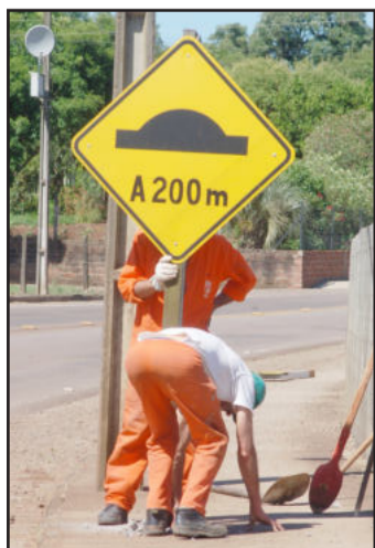
No Bairro Boa Vista, colocação de lombadas e faixas de segurança já estão concluídas