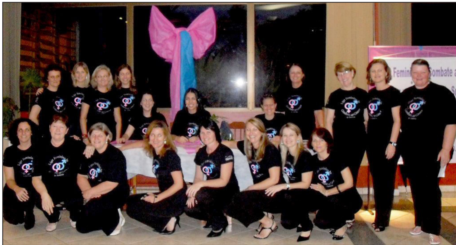
Entidade realiza eventos especiais para arrecadar recursos utilizados no auxílio aos pacientes com câncer

las, creches, clubes de mães, Oases, hospitais, postos de saúde e veículos de comunicação. Também são apoiadores o Rotary Club de Teutônia e o Lions Club de Teutônia, assim como as comunidades teutonienses (Boa Vista, Pontes Filho, Linha Clara, Bairro Alesgut, Bairro Languiru, Bairro Canabarro, Bairro Teutônia, Linha Wink, Linha Harmonia, Linha Germano, Posses, Linha Paissandu, Linha Catarina, Boa Vista Fundos e Linha São Jacó).