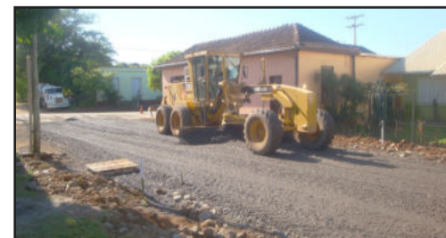
Rua Chá da Índia recebe pavimentação asfáltica