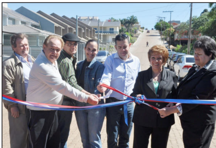
Rua Dalton de Bem Stumpf recebeu bloquetes de concreto

comunidade na busca pela realização desta obra. "Ela simboliza o querer, o persistir, e o, hoje, vibrar, pois a obra é pra (sic) vocês, é de vocês", frisou.