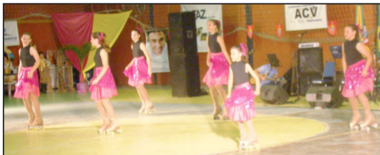
Meninas da patinação encantaram o público com diversas apresentações