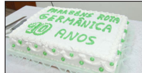
Torta para comemorar os 10 anos

Durante o evento também foram empossados os integrantes do Conselho Municipal de Turismo de Teutônia, que iniciarão um trabalho de apoio à organização do setor. O encontro teve parabéns a você, homenageando todos os envolvidos, com direito ao bolo dos 10 anos, degustado junto com o coquetel de confraternização que ocorreu ao final.