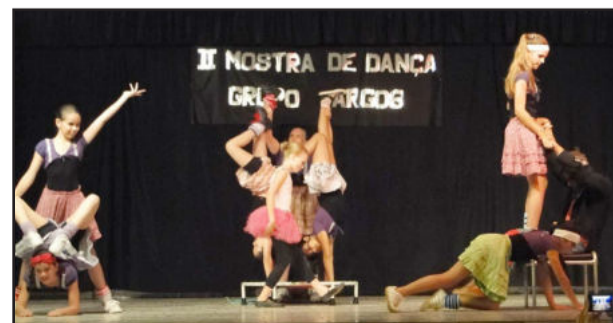
Danças & Ritmos do CEMEF