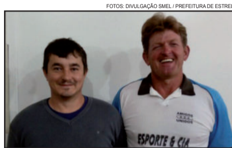
Dupla da São Luiz A lutará pela 9ª posição na Linha Geraldo

A competição da Smel contará ainda com a realização do futsal masculino, marcada para ocorrer após o fim do futebol. Se contabilizados os atletas que disputarão mais de uma modalidade, os Intercomunitários envolverão mais de mil participantes. A disputa exige a inscrição de moradores da localidade ao qual se esta defendendo, ou que este seja sócio da comunidade local há pelo menos dois anos e votante, obrigatoriamente, em Estrela. Participam as comunidades de São Luiz, São José, São Jacó, Lenz, Arroio do Ouro, Glória, Delfina, Costão, Linha Geraldo Alta e Novo Paraíso Baixo. O fim está previsto para outubro, na Glória, com a realização da Festa dos Campeões e entrega da premiação. Mais informações pelo telefone 3981-1067.