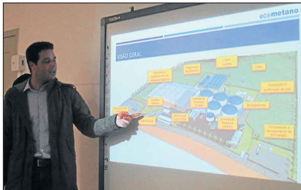
Representante da Ecometano fez apresentação detalhada do processamento da matéria-prima e funcionamento da usina