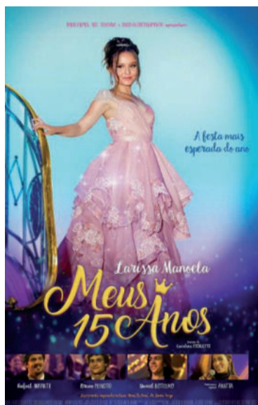
MEUS 15 ANOS

Aos quatorze anos de idade, Bia (Larissa Manoela) descobre que vai ganhar uma grande festa de quinze anos. Mas tem um problema: a garota sonhadora e apaixonada por música não tem muitos amigos para convidar ao evento, por ser pouco popular na escola. Ela conta com a ajuda do único grande amigo, Bruno, e do pai Edu, para consertar a situação.