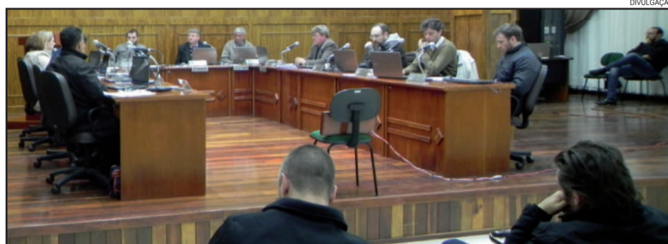
Vereadores avaliam a possibilidade de reduzir o número de vereadores a partir de 2021

O Projeto de Lei nº 52/2017, aprovado por unanimidade, trata a respeito da contratação temporária de monitor de creche, com carga horária de 40 horas semanais. Segundo o Executivo, a contratação se faz necessária em função da substituição de servidora que estará em licença prêmio.