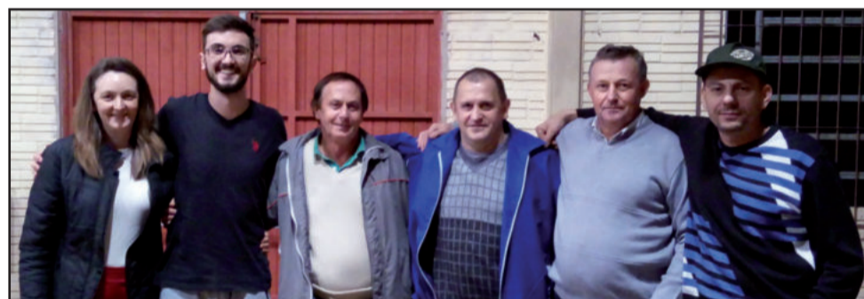
Duplas de São Jacó seguem na competição