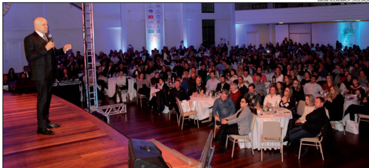
Leandro Karnal recebeu nota 9,9 e foi o destaque desta edição

O resultado da avaliação da 17ª Convenção CDL Lajeado confirma que o grande destaque do evento de capacitação realizado no dia 22 de junho foi a palestra de Leandro Karnal. Falando sobre determinação, estratégia, mudança, ética e educação, o professor e historiador recebeu nota 9,9, sendo considerado praticamente perfeito. A pontuação feita pelos demais palestrantes - 8,6 para Gustavo Bozetti; 8,5 para João Miragem; e 8,4 Carolina Bahia - comprova a satisfação dos participantes com a programação desta edição.