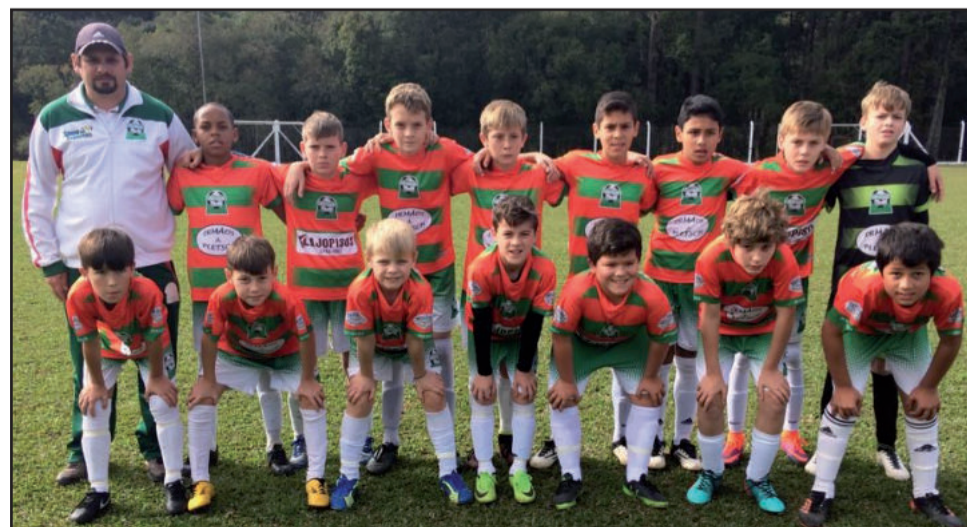
Categoria 2006 perdeu para o Juventude