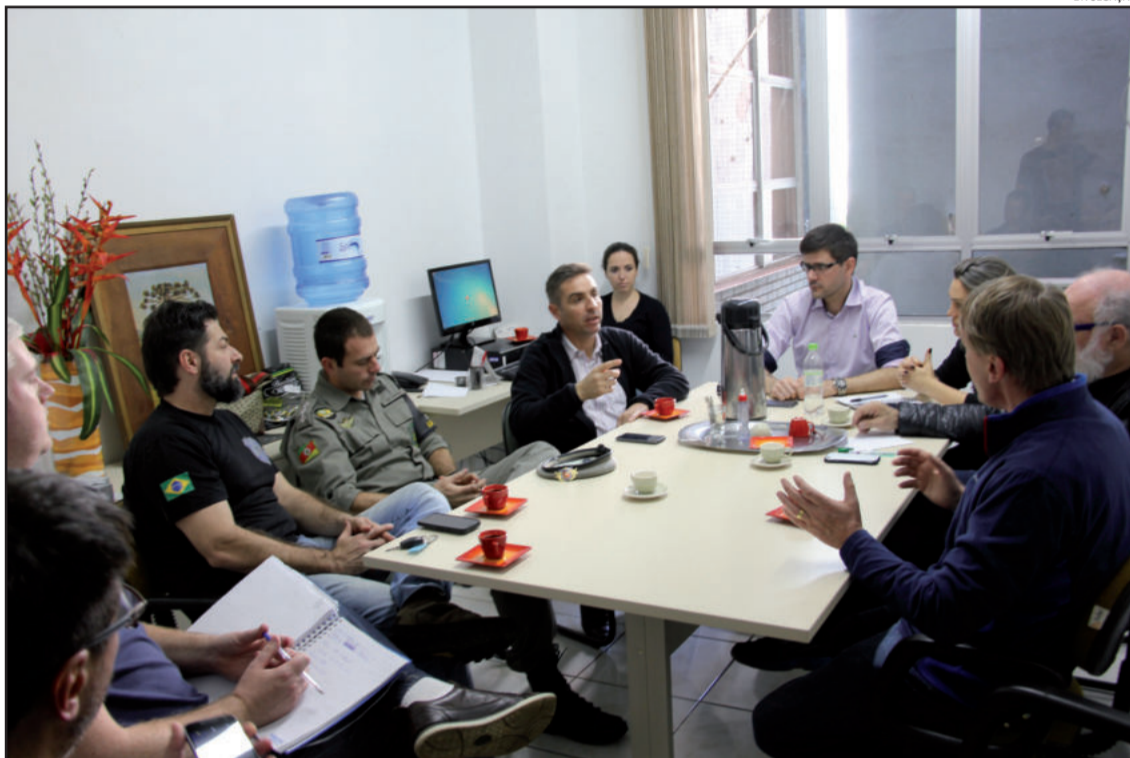
Reunião após tiroteio com resgate de apenado na UPA