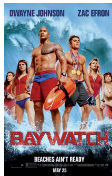
BAYWATCH SOS MALIBU

Mitch Buchannon (Dwayne Johnson) é um devoto salva-vidas, orgulhoso do seu trabalho. Enquanto está treinando o novo e exibido recruta Matt Brody (Zac Efron), os dois descobrem uma conspiração criminosa no local que pode ameaçar o futuro da baía.