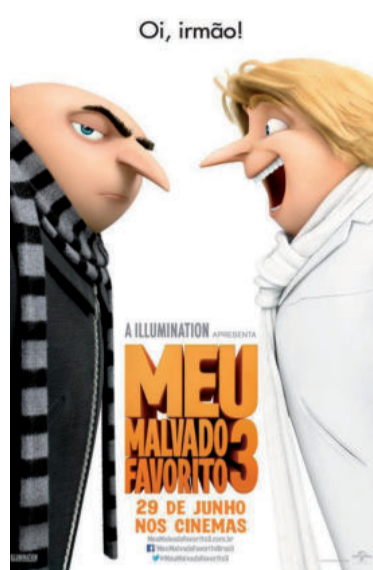
MEU MALVADO FAVORITO 3

Nos anos 1980, Balthazar Bratt fazia muito sucesso através de sua série de TV, onde interpretava um vilão chamado EvilBratt. Entretanto, o tempo passou, ele cresceu, a voz mudou e a fama se foi. Com a série cancelada, Balthazar tornou-se uma pessoa vingativa que, nas décadas seguintes, planejou seu retorno triunfal como vingança. Gru e Lucy são chamados para enfrentá-lo logo em sua reaparição, mas acabam sendo demitidos por não terem conseguido capturá-lo. Gru então descobre que possui um irmão gêmeo, Dru, e parte com a família para encontrá-lo no país em que vive.