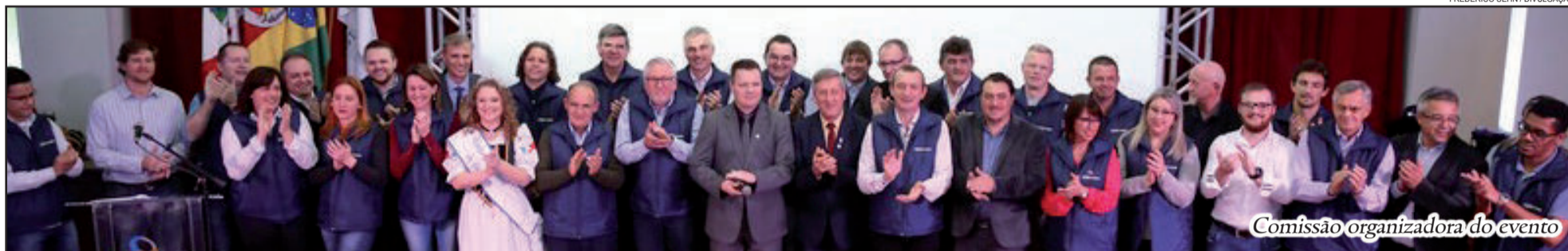
Comissão organizadora do evento

P ara mostrar o que tem de melhor na indústria, comércio, serviços, agrogêncio e agroindústrias, o Porto de Estrela sedia, entre os dias 06 e 10 de setembro, a 5ª edição da Estrela Multifeira. Promovida pela Câmara de Comércio, Indústria e Serviços de Estrela (Cacis), a feira traz o slogan “Vem que tem diversidade” e oferecerá aos visitantes variadas opções de compras, entretenimento, esporte, cultura e turismo,