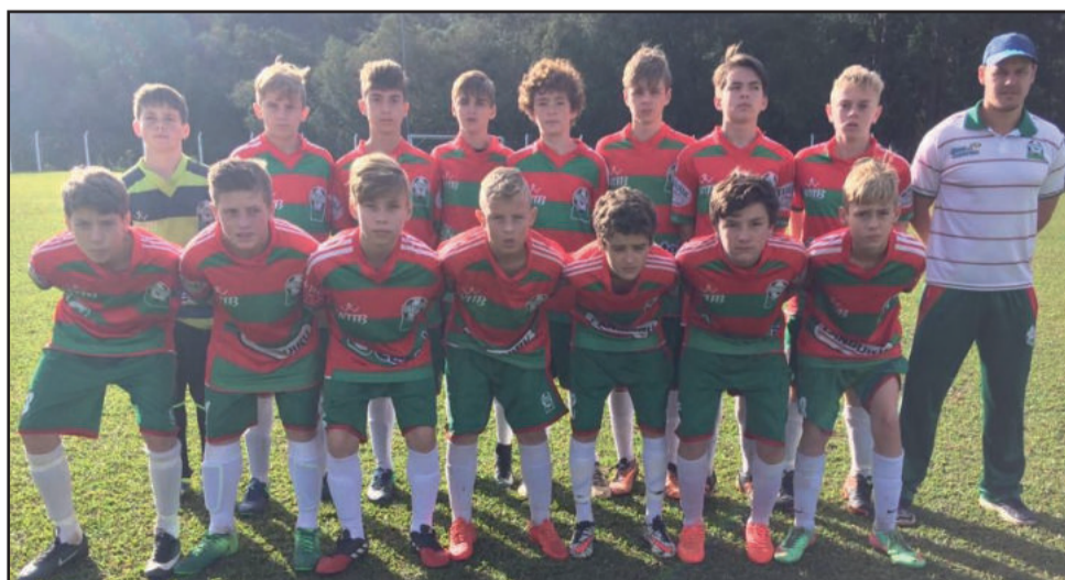
Categoria 2004 empatou sem gols com o Juventude