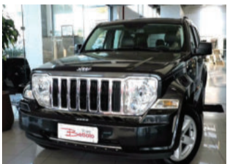
Jeep Cherokee Limited 4x4 3.7 V6 12V 2011 Preto, 4 portas, Automático, Gasolina. FAP-9586