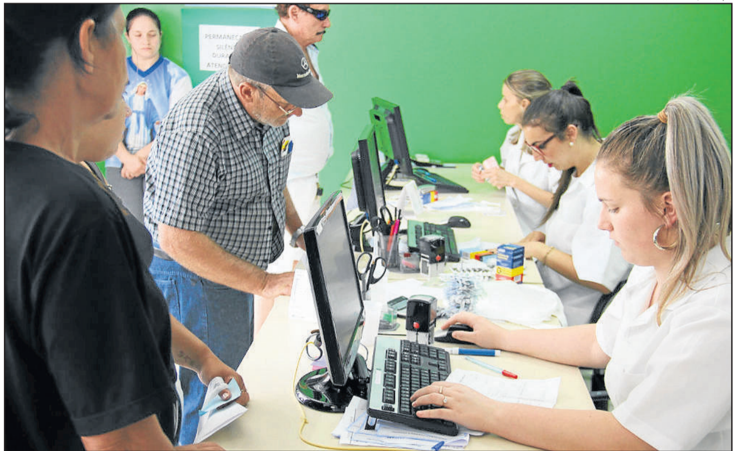
Atendimento na Farmácia Municipal de Garibaldi