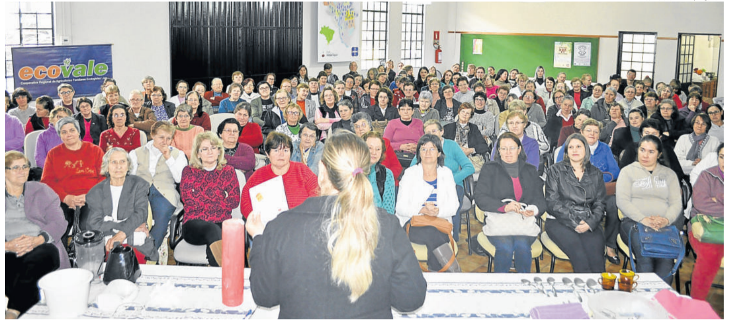
Encontro ocorre anualmente