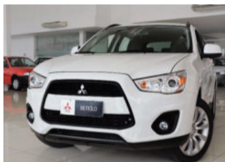
Mitsubishi ASX 4X2 FWD 2.0 16V 2016 Branco, 4 portas, Automático, Gasolina, 18.000Km. PAM-3555