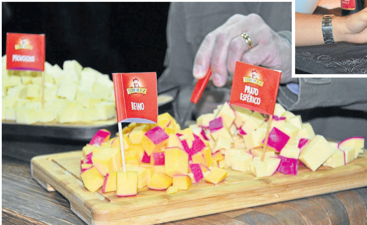
FestiQueijo oferece mais de 40 tipos de queijos