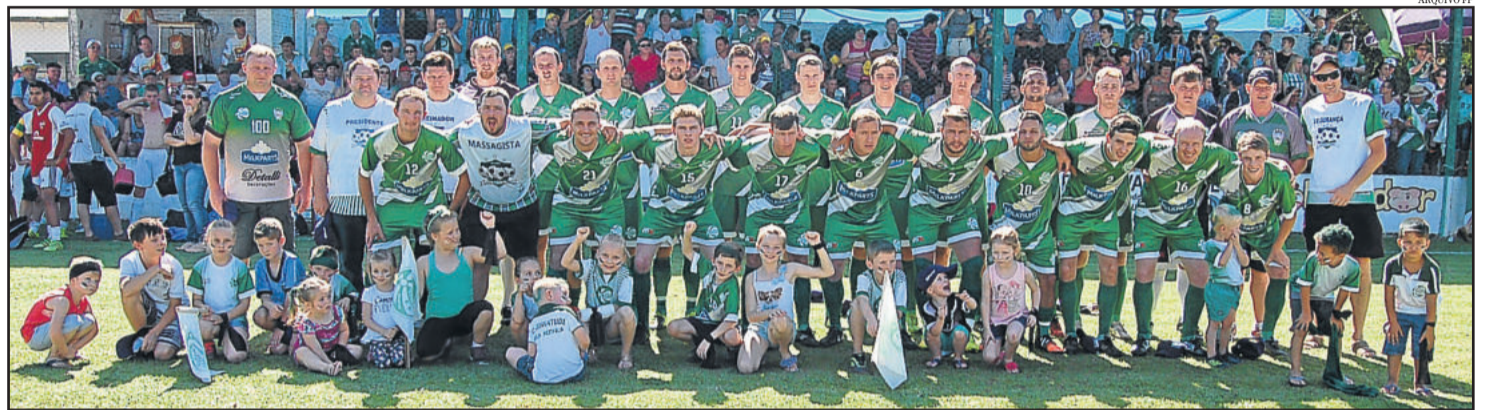
Juventude da Berlim foi o campeão da Copa Certel Sicredi de 2016

A Chave B possui o Bicampeão União Carneiros, que estreia em casa frente ao Juventude de Brochier, reeditando a semifinal de 2015. Em Cruzeiro do Sul, o Bom Fim recebe o ECAS de Imigrante. E em