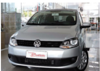
Volkswagen Fox Trend 1.6 Mi 8V Total Flex 2014 Prata, 4 portas. FLG-8904