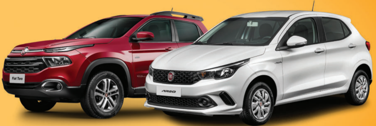
TORO FREEDOM 1.8 16V AT6 FLEX 4P Completo, Câmbio automático 6M, Rádio connect viva-voz, Lanternas de LED, 3 anos de garantia