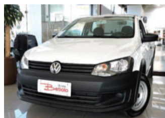
Volkswagen Saveiro 1.6 8V 2015 Branco, 2 portas, 48.441Km. IVX-4984