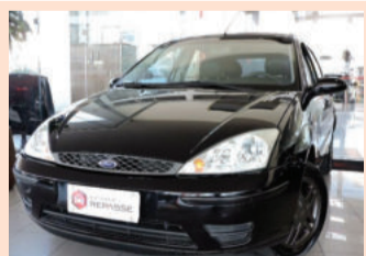
Ford Focus 1.6 8V 2005 Preto, 4 portas, Gasolina. IML-4252