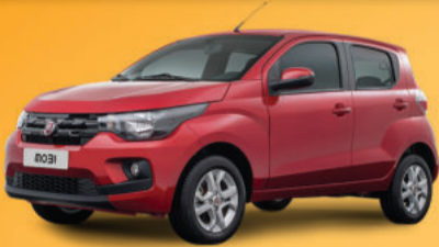
MOBI LIKE 1.0 FLEX 4P 2018 Completo, 3 anos de garantia