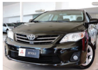
Toyota Corolla GLI 1.8 16V Flex 2014 Preto, 4 portas, Automático. MMJ-4203