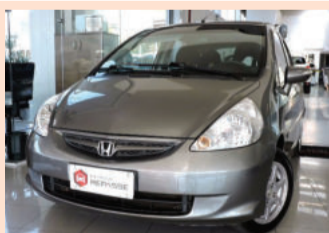
Honda Fit EX 1.5 16V 2008 Cinza, 4 portas, Automático, Gasolina. MEL-2135