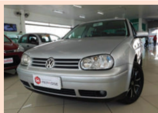
Volkswagen Golf Generation 1.6 Mi 8V 2003 Prata, 4 portas, Gasolina. IKZ-6265