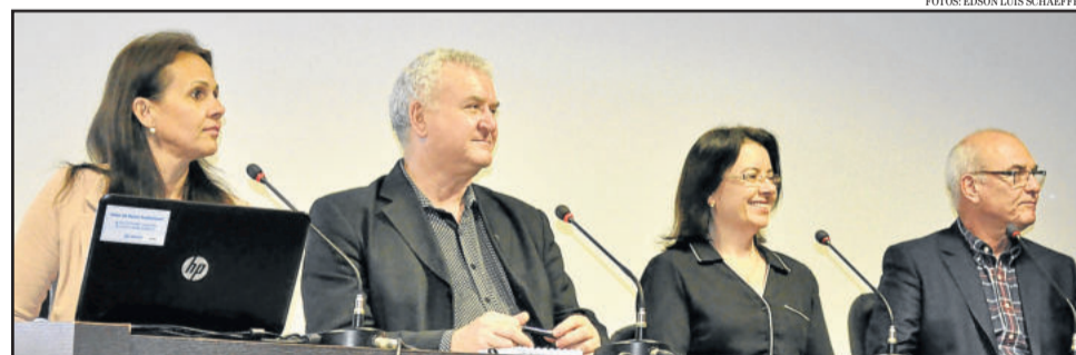
Reitoria destacou importância do título durante coletiva de imprensa