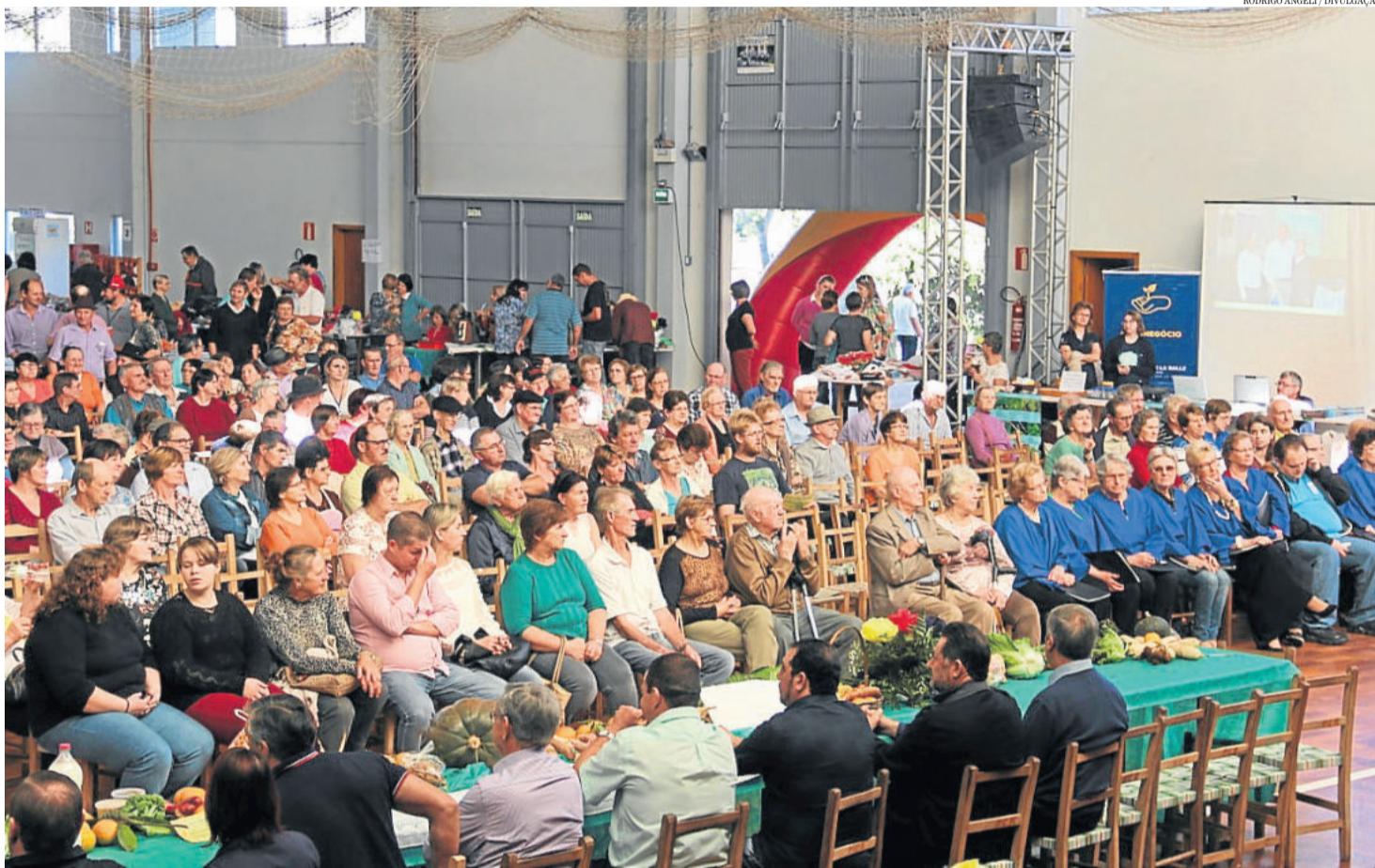
Cerca de 900 pessoas participaram do evento promovido pelo Sindicato dos Trabalhadores Rurais

Festa iniciou com desfile e prosseguiu no Centro Comunitário Cristo Rei com uma série de atrações, almoço, baile e homenagens