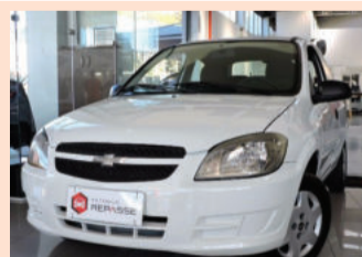
Chevrolet Celta LS 1.0 VHCE 8V Flexpower 2012 Branco, 2 portas. MJF-2332