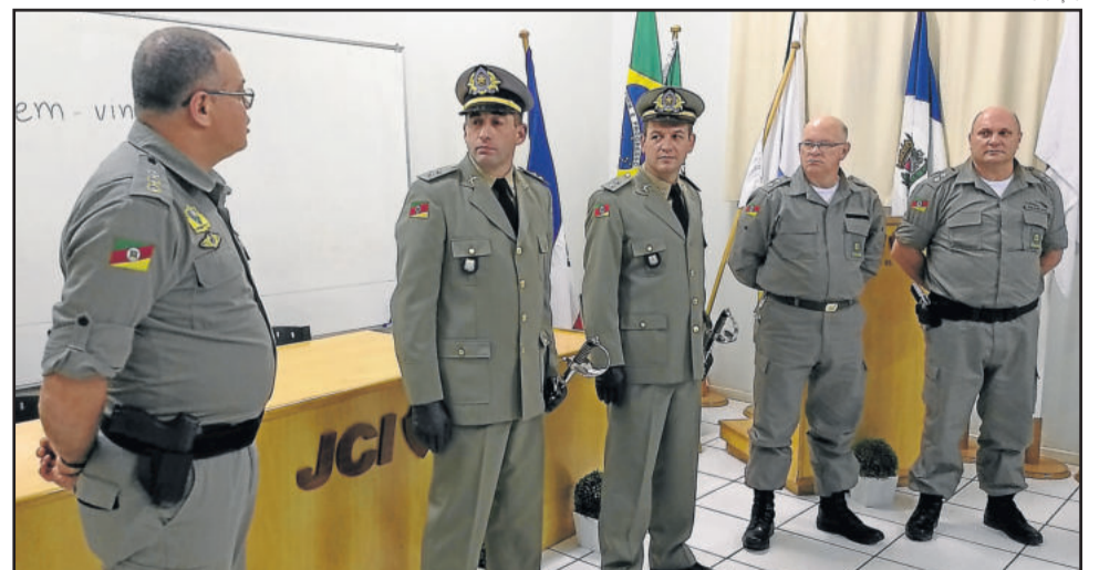
Tenentes foram recebidos e apresentados na quinta-feira, dia 27