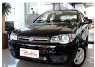
Fiat Palio Economy 1.0 8V Fire Flex 2014 Preto, 4 portas, 58.148Km. IUG-1175