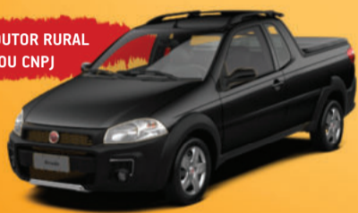
STRADA WORKING 1.4 EVO FLEX 2P 2018 Maior caçamba da categoria, Suspensão elevada, Comp. de bordo, Protetor de caçamba