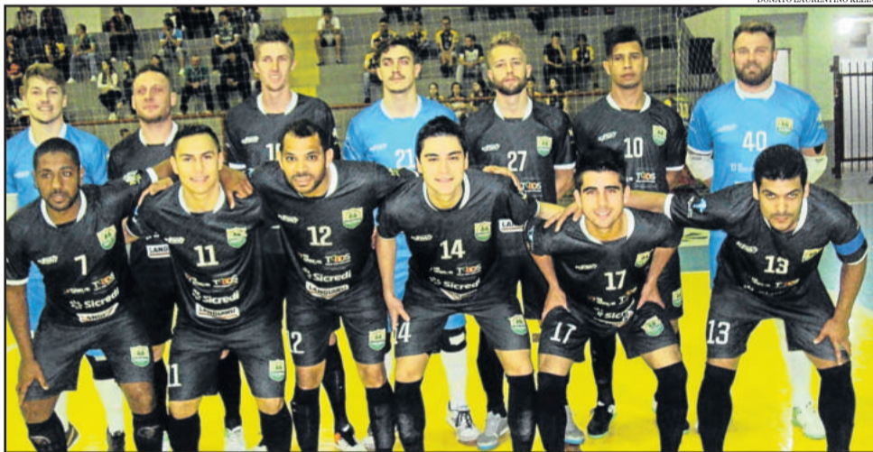
Teutônia Futsal vem de vitória fora de casa contra o XV de Novembro de Vila Maria