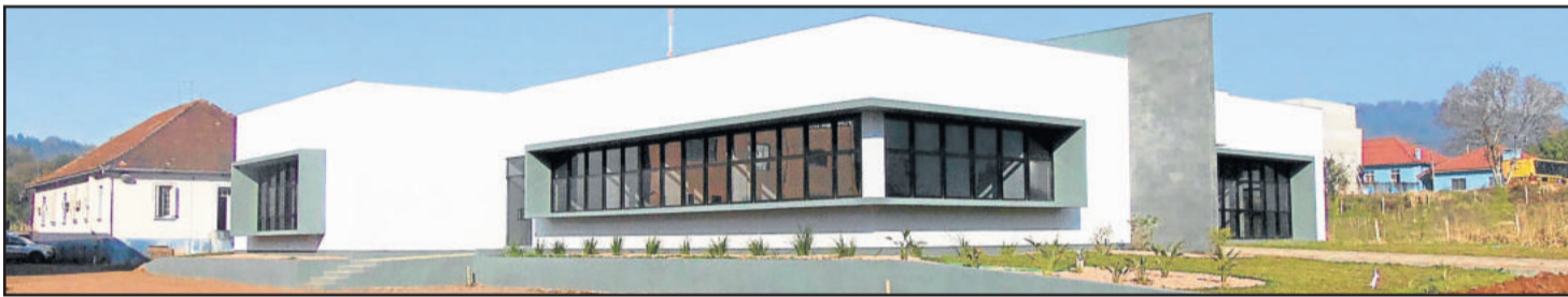
Prefeitura nova estruturalmente já concluída e as melhorias estão concentradas na Rua Jacob Flach

A obra foi custeada com R$ 700 mil oriundos de financiamento pelo Badesul. O Executivo ainda aplicou R$ 248 mil de recursos próprios.