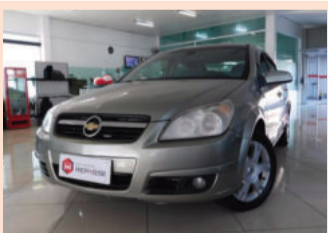
Chevrolet Vectra Elegance 2.0 Mpf 8V Flexpower 2006 Cinza, 4 portas, Automático. IMY-3182