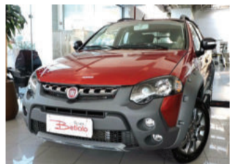
Fiat Strada Adventure Cabine Dupla 1.8 16V Flex 2015 Vermelho, 3 portas, 27.430Km. IWR-0716