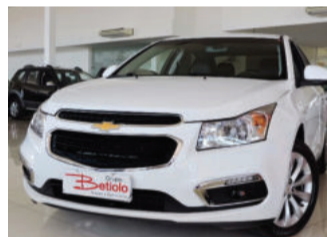
Chevrolet Cruze LT 1.8 Ecotec 16V Flex 2015 Branco, 4 portas, Automático, 45.500Km. AZI-9742