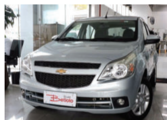
Chevrolet Agile LTZ 1.4 Mpf 8V Econo. Flex 2011 Prata, 4 portas. ISC-4839