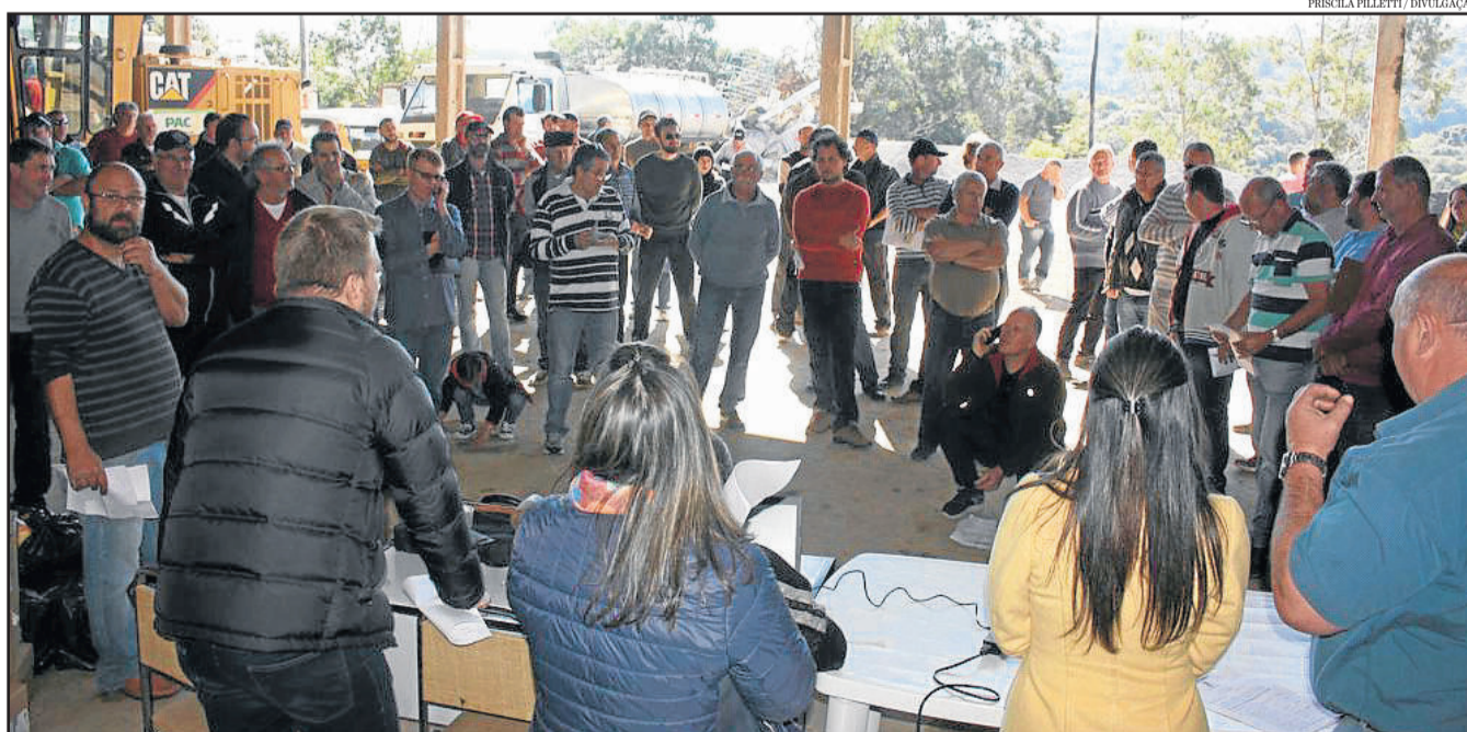
Leilão contou com aproximadamente 100 participantes

A Prefeitura de Garibaldi realizou na sexta-feira, dia 21, um leilão de bens inservíveis no Parque de Máquinas. Dos 18 lotes disponíveis, entre veículos, maquinário e outras peças, apenas um não foi arrematado. O leilão contou com aproximadamente 100 participantes, entre pessoas físicas e jurídicas. Com a destinação dos bens, foram captados R$ 196.050,00, que a Administração Municipal deve investir na renovação da frota de veículos, para uma melhor prestação de serviços aos garibaldenses.