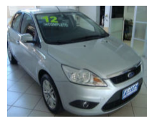
Focus Sedan 2.0 R$ 43.500,00

Aberto de segunda a sexta das 8h às 18h30min. Sem fechar ao meio dia e nos sábados das 8h às 16h.