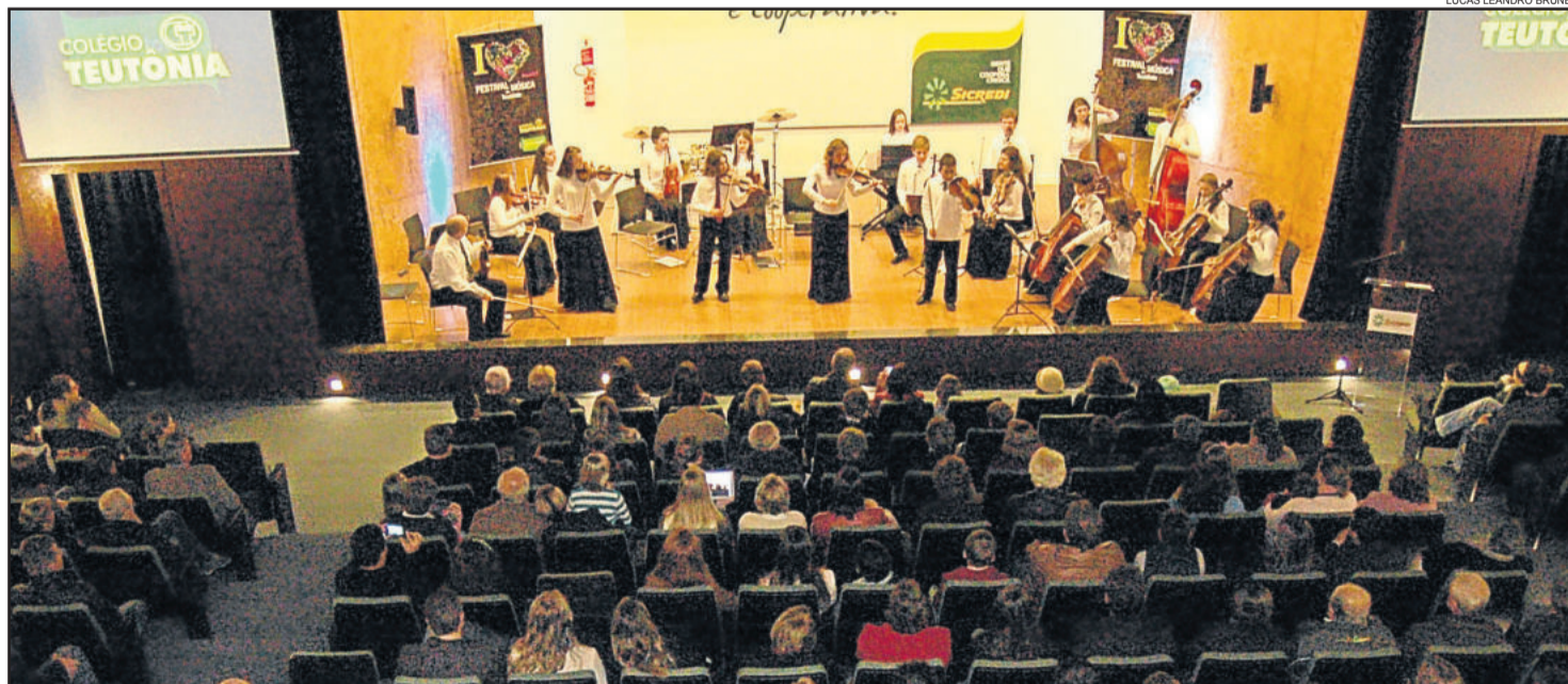
Camerata Ivoti abriu os concertos do 1º Festival de Música de Teutônia