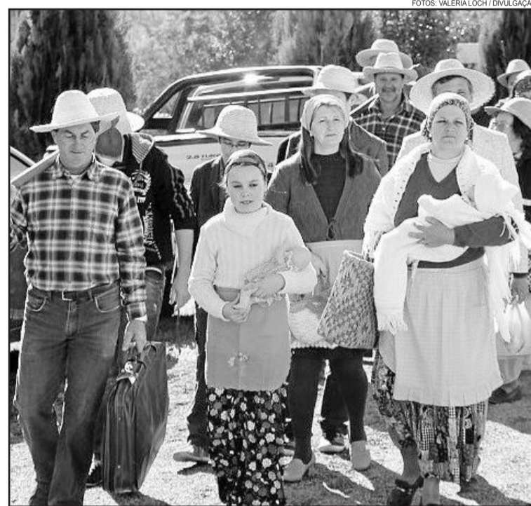
Chegada dos imigrantes foi encenada

O evento foi promovido pela Prefeitura de Garibaldi, através da Secretaria de Agricultura e Pecuária, Conselho Municipal de Desenvolvimento Rural, Sindicato dos Trabalhadores Rurais e Emater, além da comunidade de Santo Alexandre, que neste ano sedia o evento.