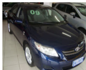
Corolla XLI 1.8 R$ 44.900,00