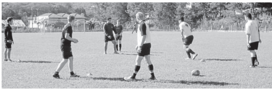
Categorias masculina juvenil também realizou treino

Iniciativa do Centauros Rugby Club de Estrela promoveu o treino tático voltado para as categorias feminina e juvenil, com o objetivo de expandir o esporte na região