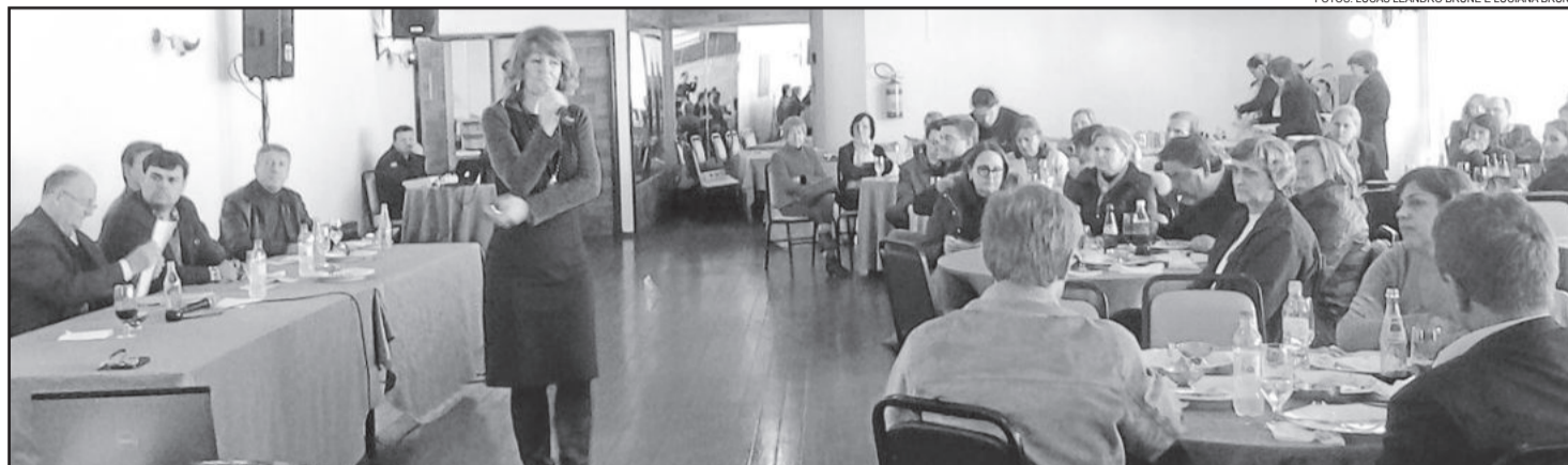
Evento ocorreu no Estrela Palace Hotel

Vivemos a era da transformação e do prazer. Ela explicou que quando índices mostram que mais de 80% dos trabalhadores pensam em mudar de trabalho, é porque estão precisando descobrir sua verdadeira vocação. E as empresas precisam ser aliadas nesta busca, mesmo que a responsabilidade pelo gerenciamento da carreira seja de cada um. "Quan-