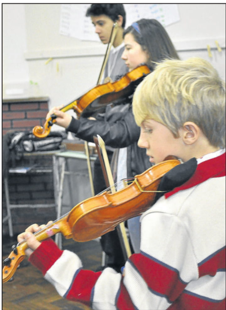
Evento conta com diversas oficinas, como a de viola

O 1º Festival de Música de Teutônia integra o 17º Encontro de Jovens Instrumentistas de Ivoti.