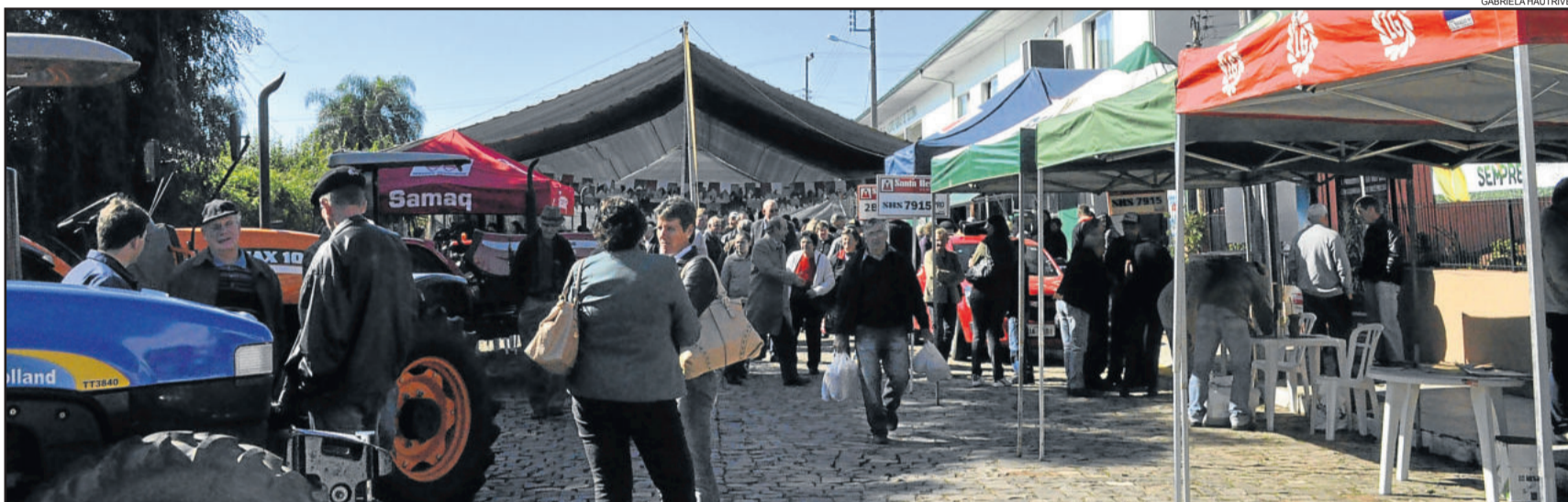
Programação foi festiva, mas também teve feira de produtos coloniais, tratores e máquinas