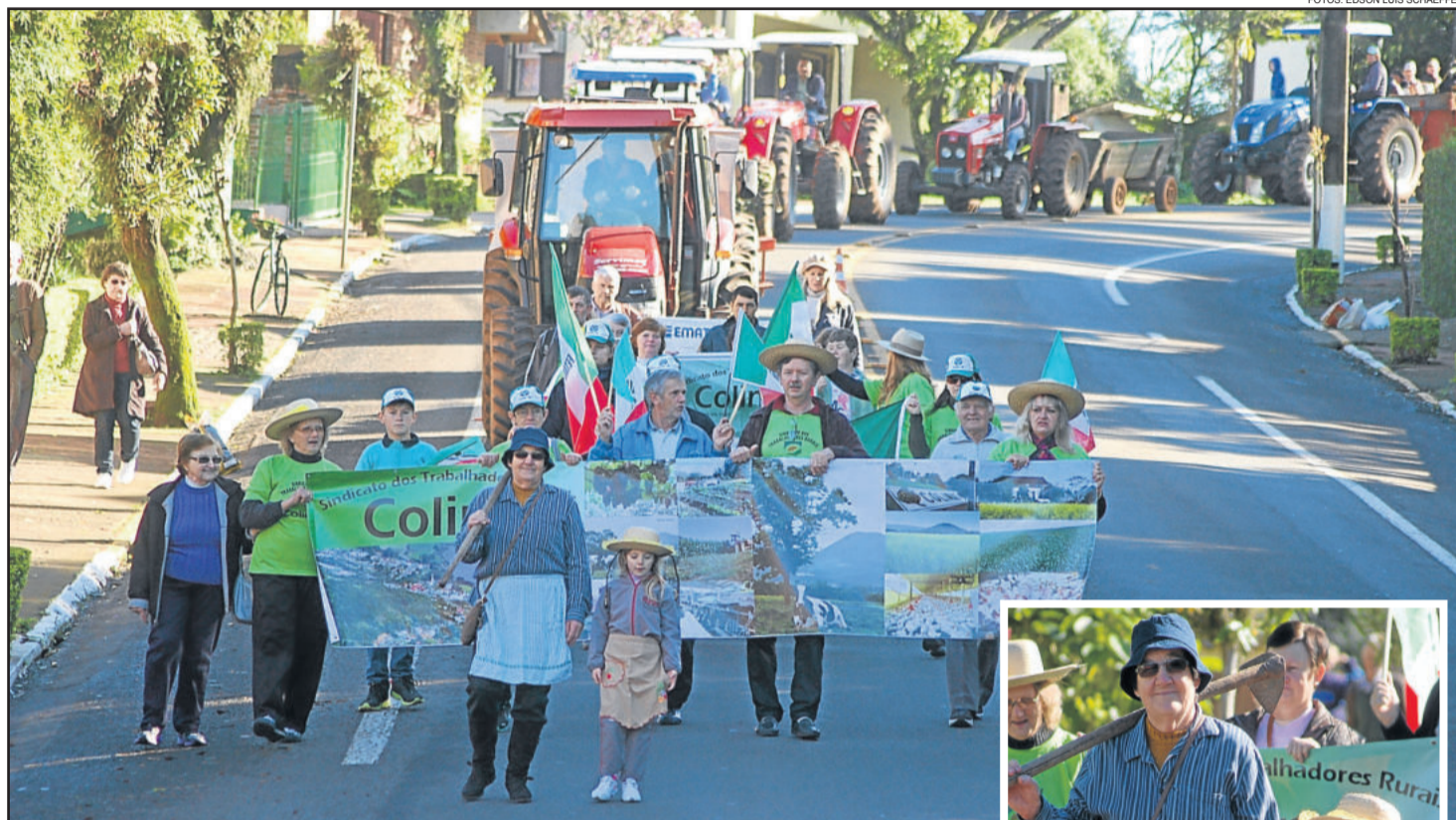
Programação iniciou com desfile pelas principais ruas de Colinas