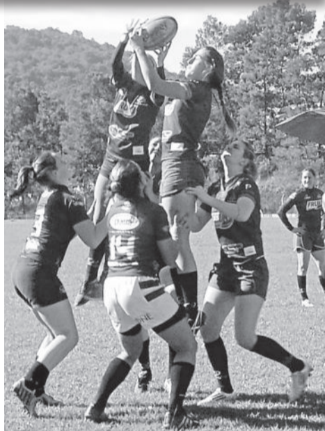
Treino da categoria feminina serviu para apresentar o esporte e recrutar novas atletas

Ainda de acordo com a atleta, o treino mais tático foi realizado justamente para mostrar a diferença do rugby. "É um esporte muito diferente