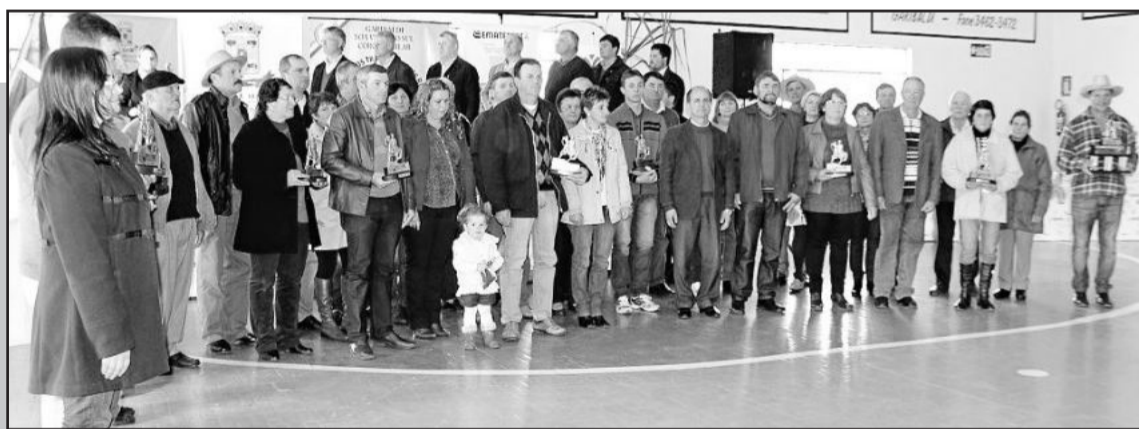
Cada uma das 19 comunidades teve seu representante homenageado