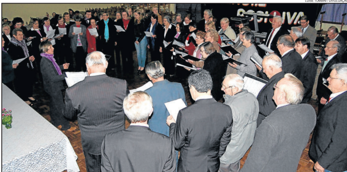
O grande coral de Imigrante

Mesmo com a noite fria do sábado à noite, oito corais de Imigrante reuniram-se no Centro Comunitário Evangélico de Arroio da Seca Baixa. Neste ano, o evento foi organizado pelo Coral Concórdia, em parceria com a Associação Cultural de Imigrante e a Secretaria Municipal de Educação, Cultura, Desporto e Turismo.