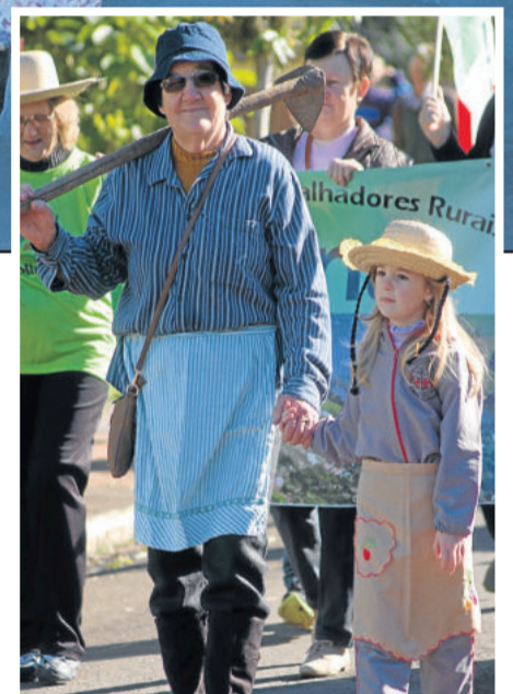
Trajados com roupa do dia a dia, colonos mostraram o seu orgulho, que passa de geração a geração

O evento foi coordenado pela Secretaria de Agricultura, Sindicato dos Trabalhadores Rurais, Emater/RS-Ascar e Conselho Municipal de Desenvolvimento Rural.