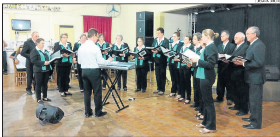
Coral Sete de Setembro de Ano Bom

panhados por um guia. Os organizadores recomendam que os visitantes estudem as fábulas antes da visita, para que os alunos já venham familiarizados com os personagens. O custo dessa viagem é de R$ 5 por aluno. No local haverá comercialização de lanches, bebidas, picolés e sorvete.