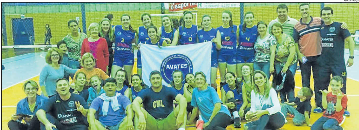
Equipe infantil contou com o apoio da torcida