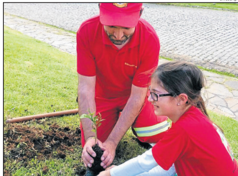
Cada aluno plantou uma árvore para finalizar os encontros