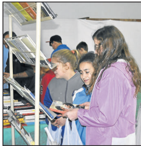
Comercialização de livros é um dos atrativos da Feira do Conhecimento