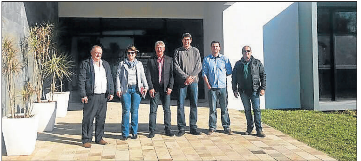
Representantes do Corsan visitaram o município

Normalmente, há uma certa demora para que estes buracos venham a ser repavimentados pela companhia. Também foram discutidos serviços burocráticos a serem feitos pela empresa no município. Ao final, os representantes da Corsan foram convidados pelo Executivo para conhecerem as instalações do novo Centro Administrativo de Paverama.