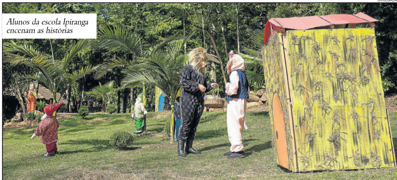
Alunos da escola Ipiranga encenam as histórias