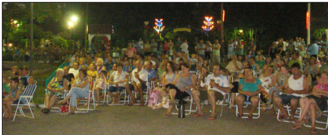
Bom público participou da confraternização

Colinas realizará uma extensa programação natalina denominada "Natal Luz e Vida 2011". A abertura das festividades ocorreu na terça-feira, dia 29, às 20h30min, na Praça dos Pássaros. Na ocasião, houve apresentação da Orquestra Municipal de Imigrante, que com seu repertório encantou o público presente com sucessos de Eron Machine, Queen, Rock anos 80 e outros vários estilos.