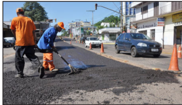
Aplicação de camada asfáltica na Av. Pasqualini