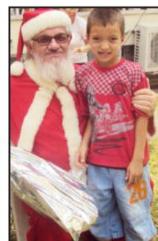
Papai Noel entregou presentes

cada um. E este ano agradecemos em especial à parceria com estes alunos, que proporcionaram uma festa diferente para nossa FundeF”, destacou.