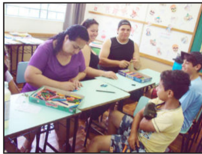
Pintura e desenho para despertar a criatividade

raíso também estavam bem coloridos com os belos trabalhos, feitos com as mãozinhas delicadas, desde o Berçário até o Jardim B. Os pais ainda tiveram a possibilidade de levar um texto, revista ou livrinhos para uma boa leitura em família, no final de semana.