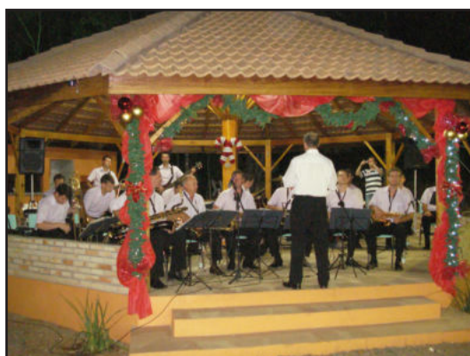
Orquestra Municipal de Imigrante apresentou-se