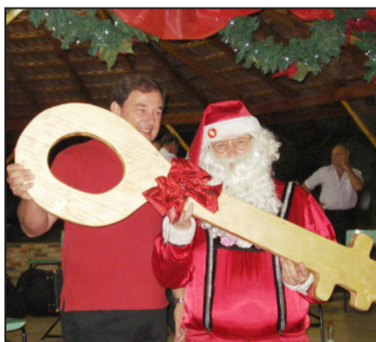
Prefeito entrega chave da cidade ao Papai Noel

* 24/12/2011 - sexta-feira - às 21 horas, confraternização de Natal na Sociedade Escolar 7 de Setembro de Linha Ano Bom.