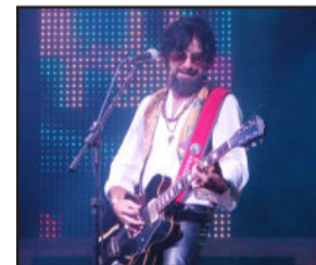
Raul Seixas Cover foi o show surpresa da noite