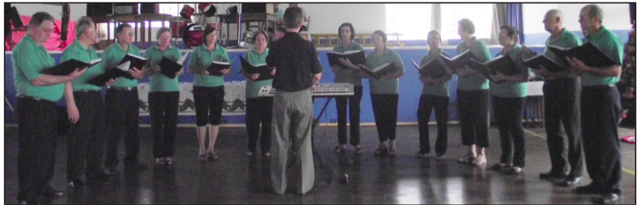
Mensagens através do canto coral