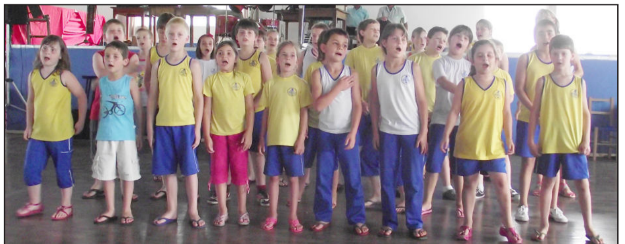
Alunos deixaram mensagem de Natal