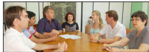
Repasse de recursos para Escola Infantil Girassol

O prefeito Renato Altmann ressaltou que a Administração Municipal recebeu vários pleitos de comunidades e reservou