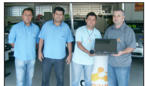
Sorteio do notebook foi ontem

Para premiar os clientes neste momento especial, a empresa realizou várias ofertas e promoções especiais na compra e troca de veículos durante o mês de aniversário. Todos clientes do mês concorreram ao sorteio de um notebook, em parceria com a Nova Compular Informática. O sorteio foi realizado ontem e o ganhador foi Arli de Costa, de Canabarro, Teutônia.