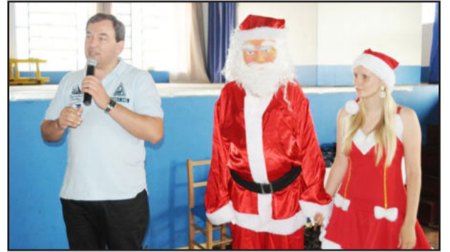
Chegada do Papai Noel na festa dos idosos

Houve também apresentações dos alunos do Turno Inverso, com uma linda mensagem de Natal aos idosos. O evento também teve a presença do Papai Noel, que distribuiu um presente para cada idoso. Na oportunidade, participantes e convidados aproveitaram para fazer compras na Feira de Natal, que ocorreu no mesmo local, com muitas coisas criativas produzidas pelos artesãos do Município.