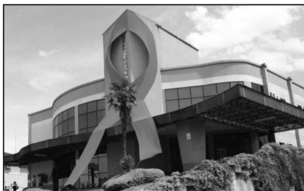
Laço Vermelho marca semana de mobilização contra a AIDS

amor e a infecção pelo HIV. O símbolo foi criado como forma de homenagear os mortos pela doença e também para ajudar na conscientização sobre a seriedade da epidemia.