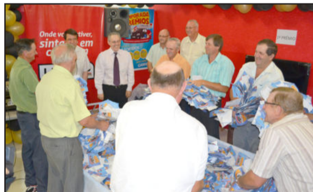
Sorteio foi realizado no Supermercado Languiru do Bairro Canabarro

O terceiro e último sorteio da Temporada de Prêmios Languiru 2011 será no dia 29 de dezembro, no Supermercado Languiru do Bairro Languiru. Serão seis prêmios, entre os quais um automóvel Fiat Novo Uno zero quilômetro, modelo 2012.