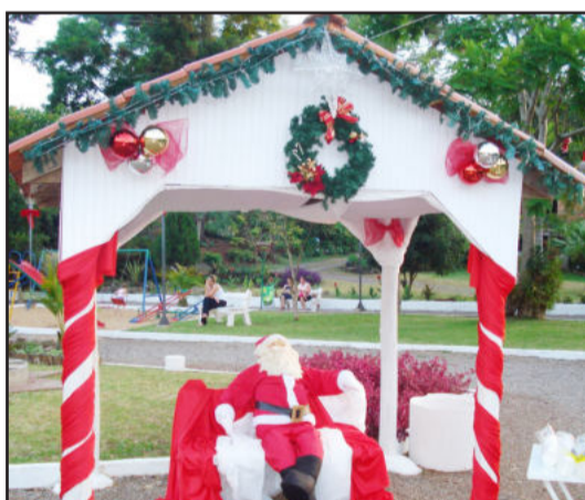
Bonita decoração na Praça dos Pássaros convida para o espírito natalino