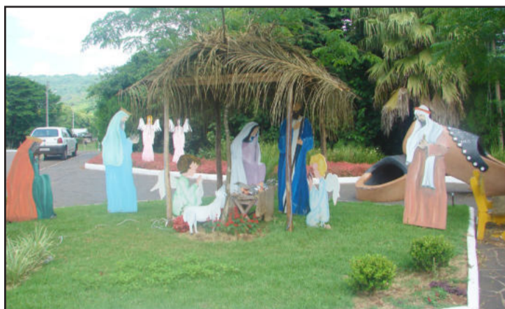
Presépios enfeitam as praças do município