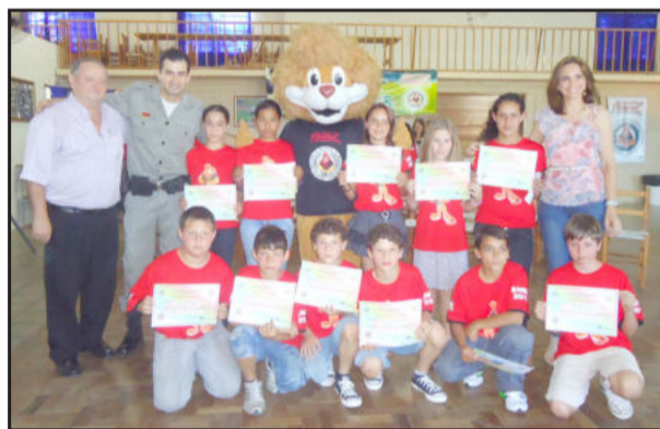
Estudantes aprenderam como resistir às drogas e à violência