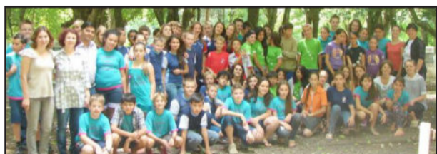
Líderes e vice-líderes das escolas municipais confraternizaram

Após a abertura do evento, as coordenadoras do encontro realizaram uma dinâmica para que os alunos refletissem e avaliassem seu desempenho e função enquanto representantes de suas turmas. Os alunos destacaram que esta função requer muita responsabilidade, ajudar aos outros, ouvir e dar exemplo. O evento se estendeu com um lanche coletivo, onde cada um trouxe sua refeição de casa, e depois houve um momento de integração entre os alunos. A entrega dos certificados de participação para os representantes das escolas encerrou o encontro.