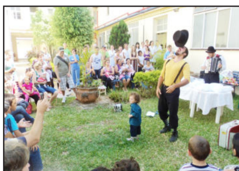
Festa de Natal da FundeF teve animação da Trupe Viajantes dos Sonhos