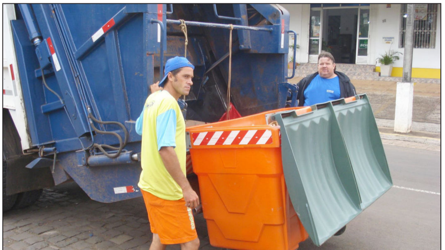
Coleta de lixo mecanizada, com contêineres, está em fase experimental em cinco pontos da cidade. Página 11