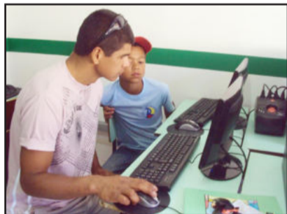
Trabalhos em áreas diversificadas

O evento contou com a presença da equipe da Secretaria de Educação, que prestigiou com entusiasmo os trabalhos realizados na Escola, fortalecendo a importância do vínculo familiar e da educação pelo Governo de Estrela.