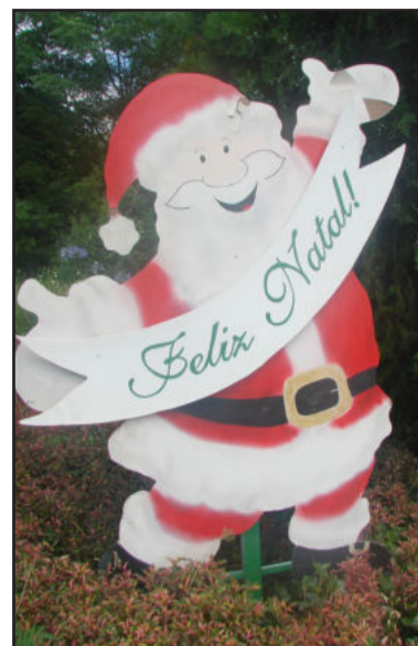
Papai Noel deseja um Feliz Natal aos visitantes de Westfália