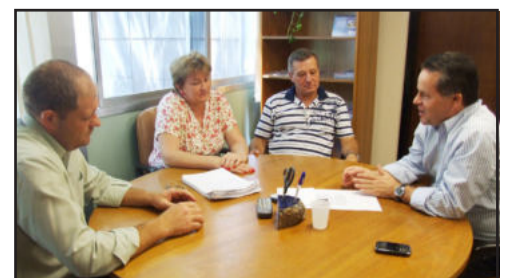
Encontro para tratar de necessidades de Imigrante

O peemedebista determinou de imediato que a assessoria providencie contato com a empresa para que seja encontrada solução. A presidente da Câmara colocou o Legislativo de Imigrante à disposição do deputado. "Se for necessário, trabalharemos na busca de recursos que viabilizem uma parceria com a Tim", informou a presidente da Câmara.