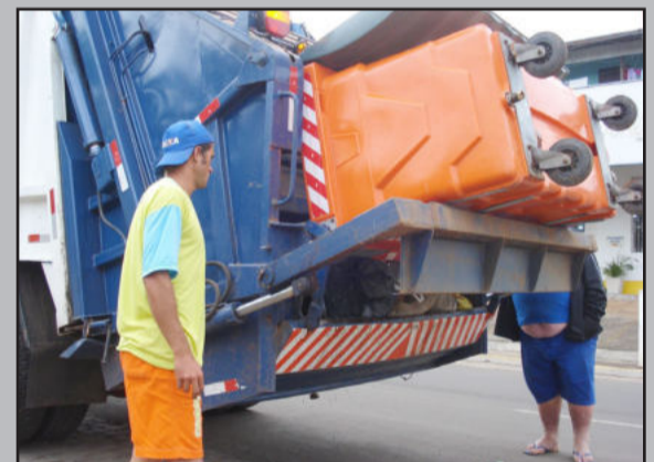
Coleta de lixo mecanizada está em fase experimental em cinco pontos da cidade