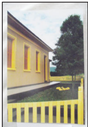
Terceira colocada no concurso