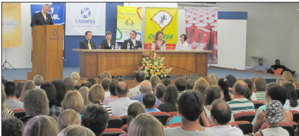
Mais de 400 pessoas participaram da cerimônia de lançamento do livro "Os Jovens Poetas de Lajeado"

Lajeado passa a contar com mais uma obra literária. Esta reúne publicações de 227 alunos de 31 escolas públicas e privadas dos ensinos Fundamental e