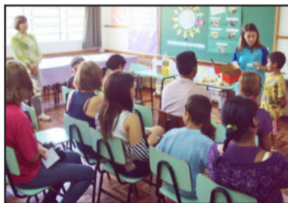
Pais puderam acompanhar os trabalhos realizados pelos filhos durante o ano