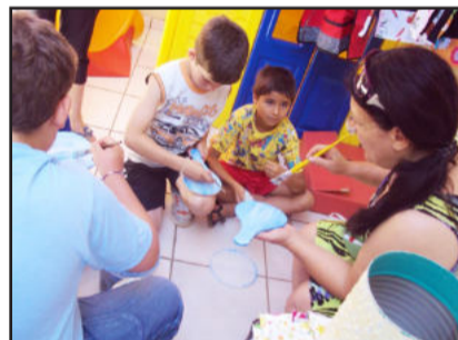
Atividades diferentes com as crianças