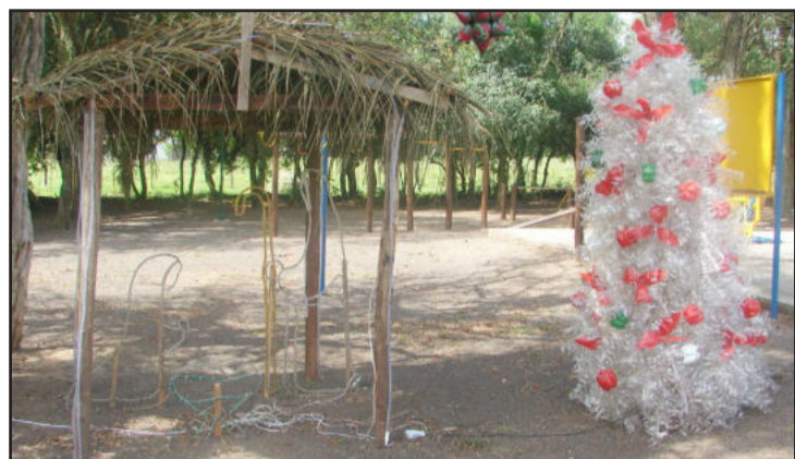
Presépio de pisca-piscas com uma árvore de Natal feita de garrafas Pet