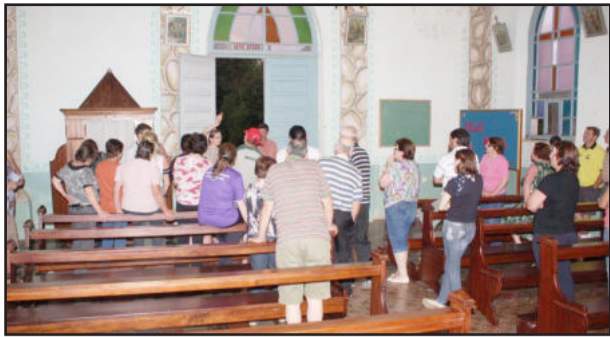
Comunidade analisou projeto no interior da igreja