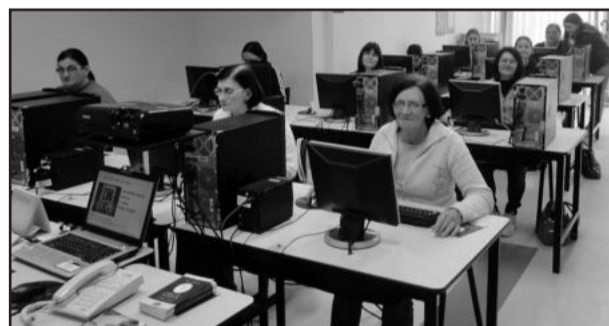
Telecentro Comunitário completa primeiro aniversário

O telecentro aceita inscrições para turmas que abrirão em 2012. As oficinas param de dezembro a março, enquanto o telecentro funciona normalmente para os usuários durante as férias. Mais informações no blog telecentrocarlosbarbosa.blogspot.com.