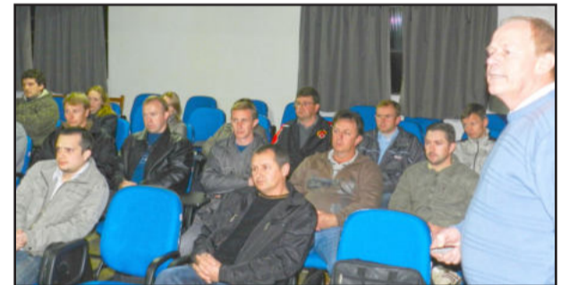
Técnicos da Certel Energia e da Cooperativa Languiru trabalharam em conjunto

O dimensionamento da carga em aviários climatizados, motores monofásicos/trifásicos e problemas que comprometem o funcionamento de equipamentos, como maus contatos