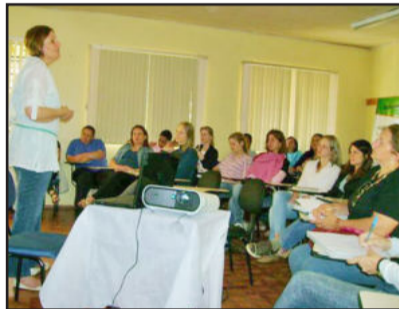
Capacitação de profissionais teve o foco em fitoterapia

No encontro, os profissionais de diferentes formações que compõem a equipe, dentre eles farmacêuticos, nutricionistas, dentistas, psicólogos, enfermeiros, técnicos