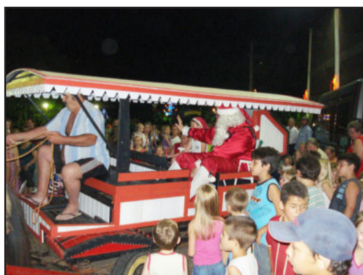
Papai Noel em meio à criançada