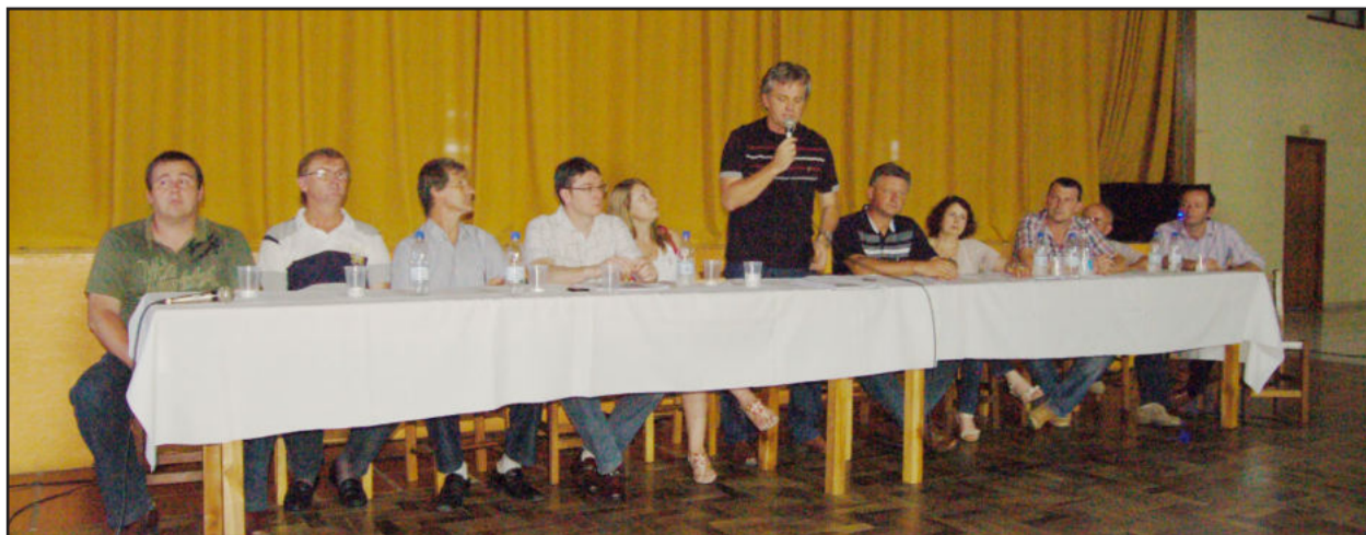
Administração Municipal realizou o 1º Encontro Estudantil