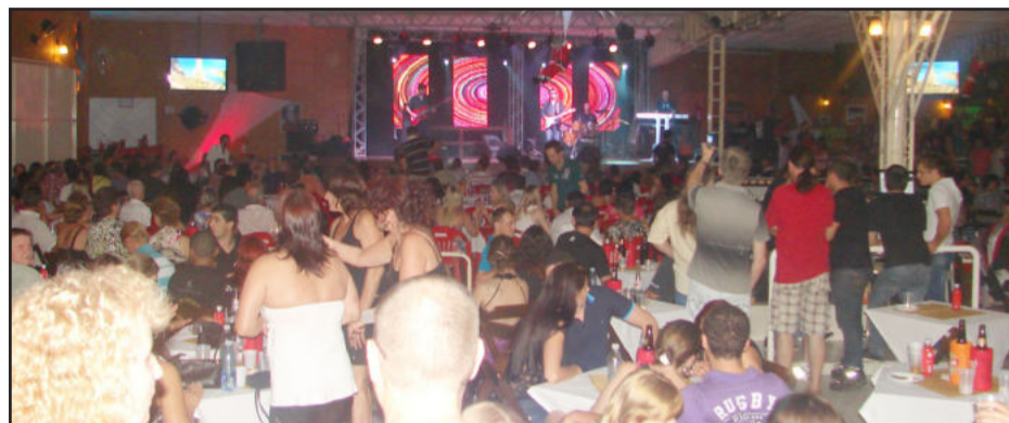
Músicos, familiares e fãs fizeram uma bela festa no Country Clube

Pelo terceiro ano consecutivo, o Country Clube de Lajeado realizou sua tradicional Festa do Músico, na noite de terça-feira, dia 29 de novembro. O evento reuniu muitos músicos, familiares e um grande número de fãs.