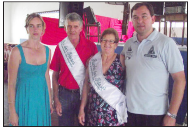
Rei e Rainha que representam o Município de Colinas