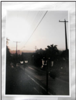
Fotografia que levou o 1º lugar