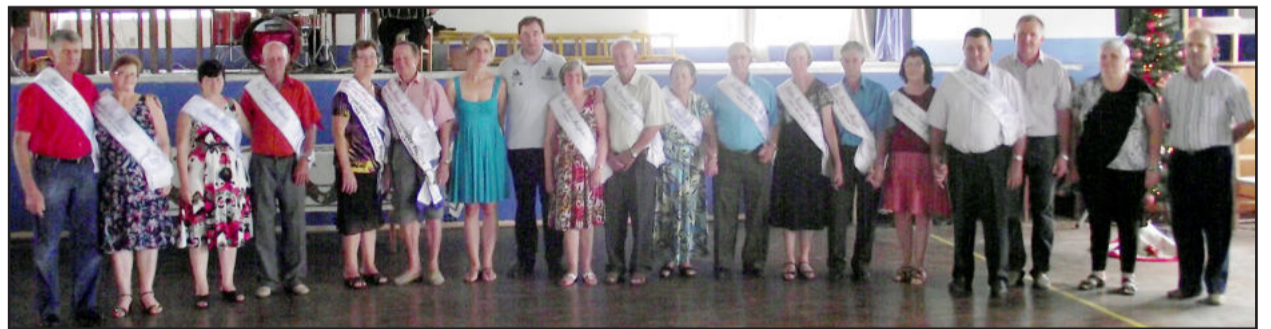
Novos reis e rainhas recebendo suas faixas