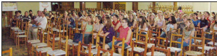
Estudantes puderam formular perguntas e opinar

A segunda parte do Encontro Estudantil, proposta pela Administração Municipal, consistiu na apresentação da forma como o recurso público é investido, ou seja, as obras, serviços e realizações efetuadas. O prefeito Renato Airton Altmann e o vice-prefeito Ariberito Magedanz explanaram sobre o equilíbrio do governo em todos os setores e