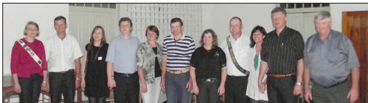
Comitiva de atiradores de 2011

Hoje, sábado, dia 3 de dezembro, a Sociedade Cultural e Recreativa Linha Clara realiza o tradicional Baile do Rei, evento que coroa os melhores atiradores do ano na modalidade do tiro ao alvo em carabina apoiada. Esta é a única entidade que mantém a atividade, herança da colonização alemã, no Vale do Taquari.