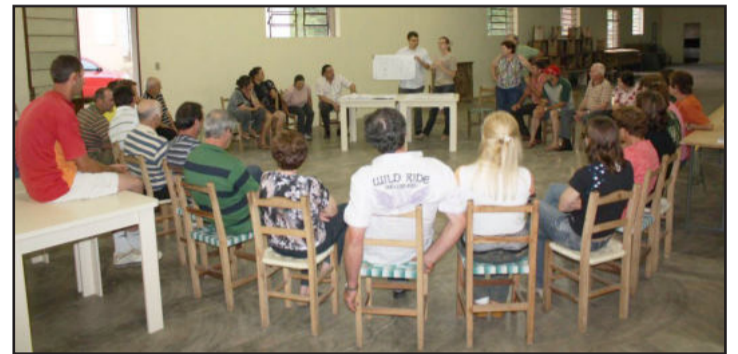
Projeto de restauração da igreja foi apresentado à comunidade

O encontro reuniu a grande parte das famílias da comunidade, ansiosas em conhecer o projeto. A equipe da empresa Squadro Engenharia e Arquitetura, que está concluindo o projeto, apresentou os principais detalhes da obra. Externamente, será realizada uma drenagem ao redor de toda a igreja, para solucionar um dos principais problemas que a construção enfrenta, que são as infiltrações através do solo. Toda a água do entorno será drenada para longe da estrutura. O teto