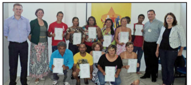
Alunos receberam certificado de Conclusão do Curso de Pedreiro Básico