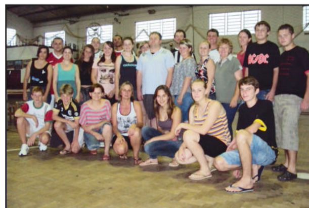
32 atores da comunidade estão ensaiando “Caminhos da Paz”

“O empenho é grande por parte do grupo para trazer a emoção através da arte neste Natal. Westfália conta com um cartão postal que é o seu Centro Administrativo. De fácil localização e com espaço para montagem de cenários e localização de público, o espetáculo Caminhos da Paz tem tudo para ser um sucesso”, destacou o secretário municipal de Educação, Cultura, Turismo e Desporto, Gustavo Sieben.