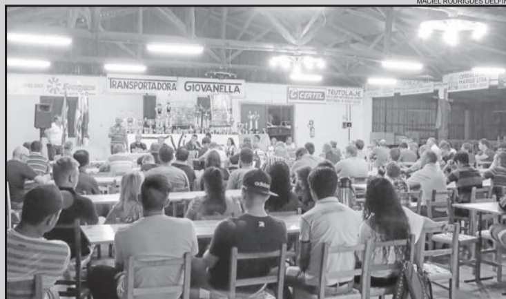
Lançamento reuniu autoridades municipais, dirigentes e atletas