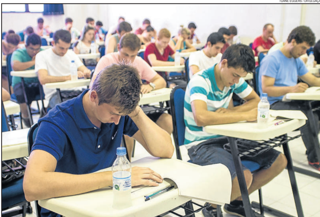
Prova única de redação abordou redes sociais