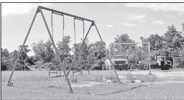
Às vezes, lixo vem junto com o material orgânico depositado

fica mal visado. Damos um ponto de referência e o pessoal diz que é lixo”, comenta o morador.