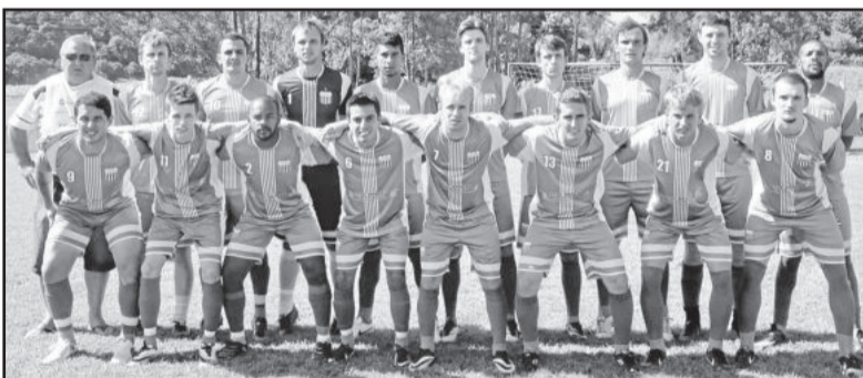
Ouro Verde, do Bairro Alesgut

Embora tivesse a missão de pontuar em casa, o União perdeu em seus redutos, enquanto que o Ouro Verde iniciou a competição com o pé direito.