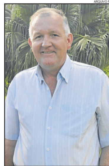
Prefeito de Colinas, Irineu Horst

O orçamento previsto para este ano é de R$ 14,4 milhões, um crescimento de quase R$ 1,5 milhão em comparação com 2014. Além da Educação e da Saúde, o segmento que receberá mais recursos será a Agricultura. A intenção é melhorar os projetos existentes e investir no aumento da produção, principalmente de suínos. “Sempre oferecemos treinamentos para os agricultores se capacitarem”, concluiu.