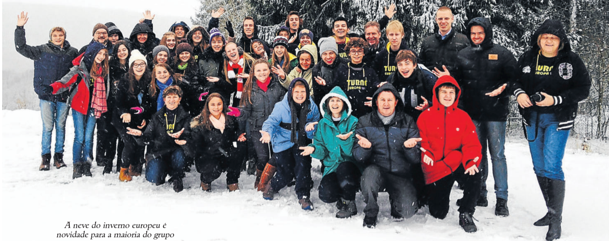
A neve do inverno europeu é novidade para a maioria do grupo

Já se passou a primeira semana da Turnê Europa 2015 do Conjunto Instrumental do Colégio Teutônia. O grupo, com 21 instrumentistas acompanhados de familiares e professores, embarcou no dia 25 de janeiro e levou a música brasileira, gaúcha e teutoniana para esquentar o inverno europeu.