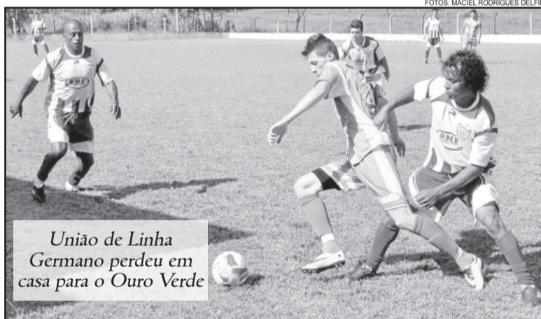
União de Linha Germano perdeu em casa para o Ouro Verde