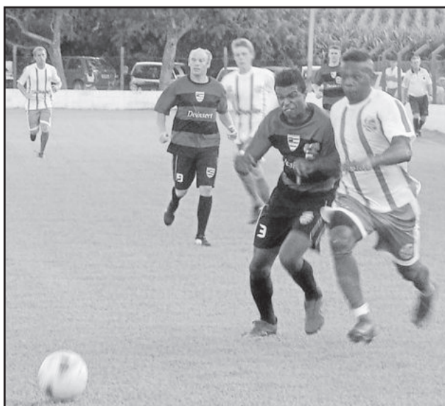
Juventude (branco) perdeu em casa para o Flamengo na estreia