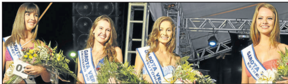
Quatro meninas foram eleitas e representarão municípios do Vale do Taquari em Sobradinho na próxima sexta-feira