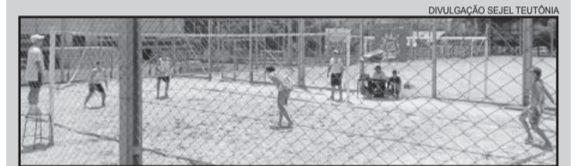
Jogos movimentaram a Associação Pró-Desenvolvimento de Languiru

A organização do certame foi do Sesc Lajeado, com apoio da Secretaria Municipal da Juventude, Esporte e Lazer de Teutônia.