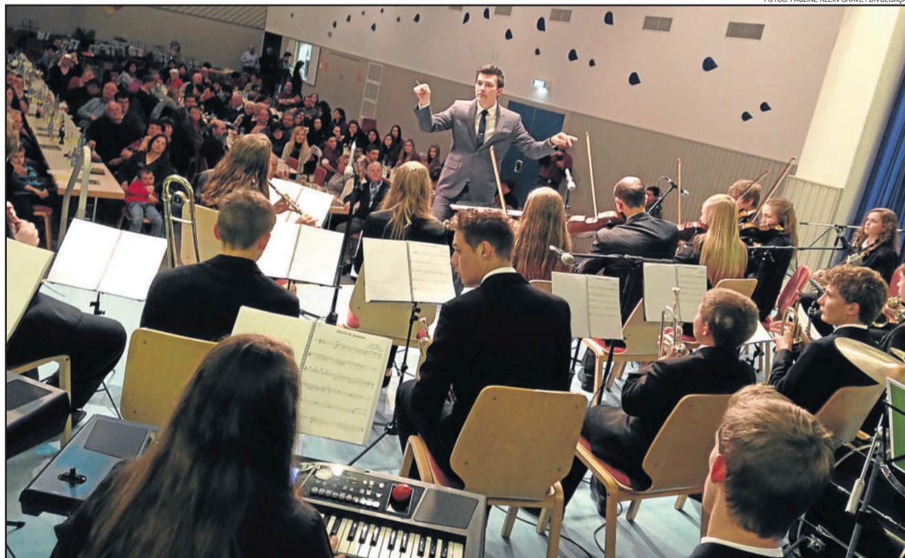
Roteiro iniciou pela cidade alemã de Hettenrodt, com os teutonenses sendo aplaudidos em todas as músicas