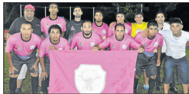
Kaxa Baxa chegou a mais uma semifinal do Abertão