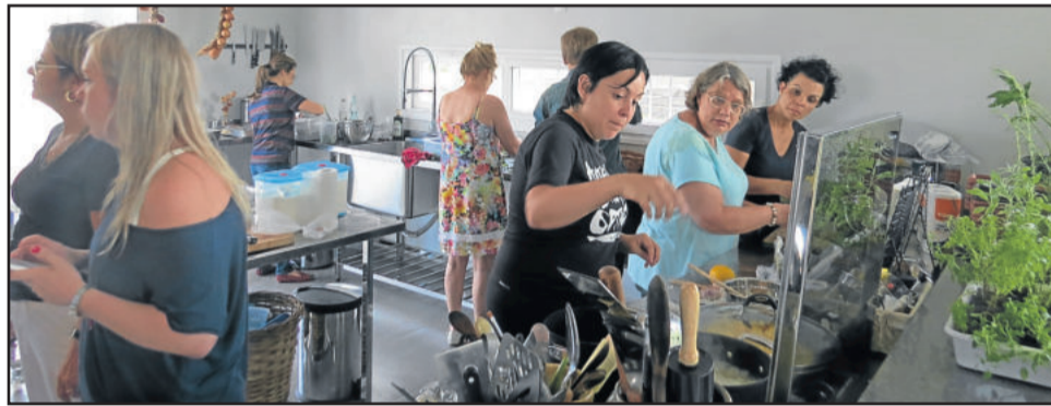
Turma com a mão na massa na cozinha