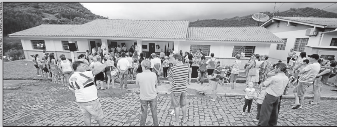
Salas foram inauguradas no fim da tarde de sexta-feira, dia 27

O município de Imigrante inaugurou, além da quadra coberta da Escola Arco-Íris, outra obra importante para a Educação: as salas de aula da Escola Santo Antônio, na sexta-feira, dia 27 de fevereiro.