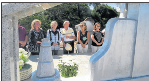
Brasileiros e alemães em volta do túmulo dos antecedentes