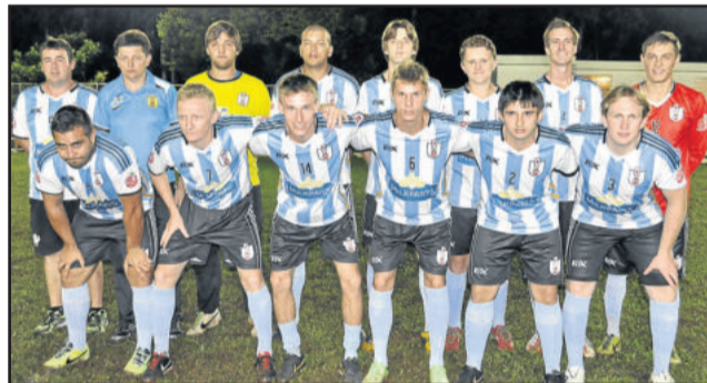
Saidera busca mais uma final no Força Livre

Próxima rodada será realizada amanhã, quarta-feira, dia 04, na Associação dos Funcionários da Cooperativa Languiru. Na sexta-feira, dia 06, também tem rodada, sendo que a partir de agora todas as partidas serão disputadas no campo 1.