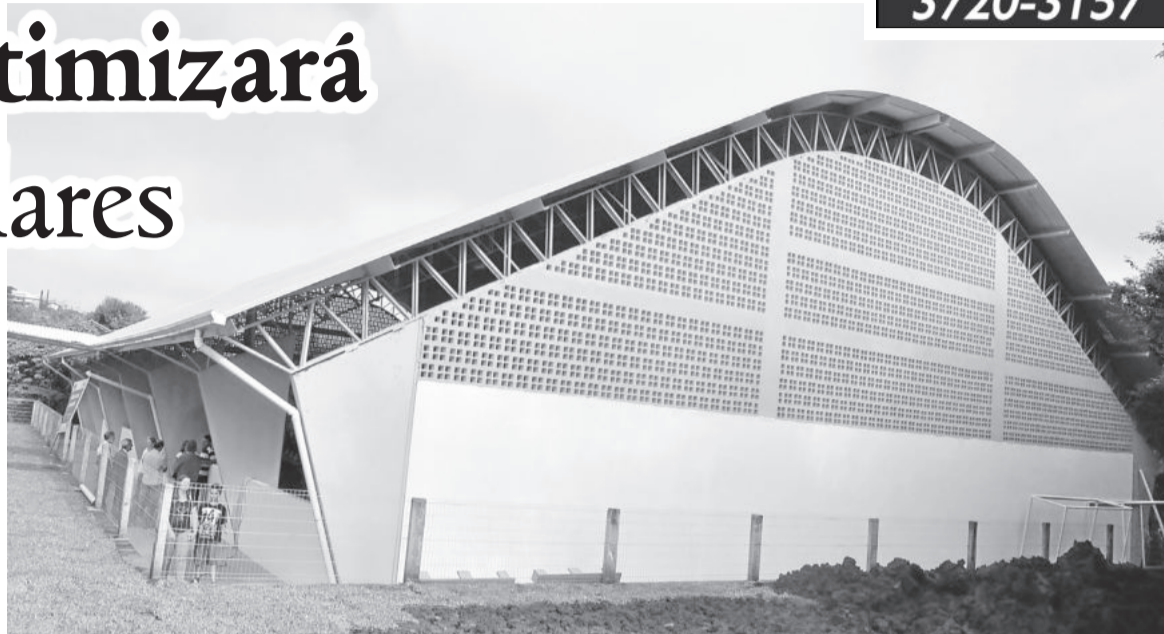
Quadra poliesportiva coberta era um sonho antigo da Escola Arco-Íris