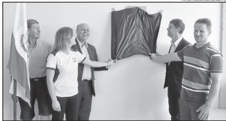
Inauguração da quadra coberta ocorreu na manhã de sábado