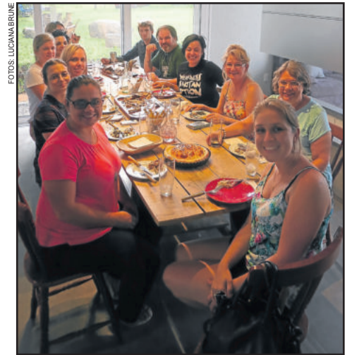
Participantes degustando os pratos