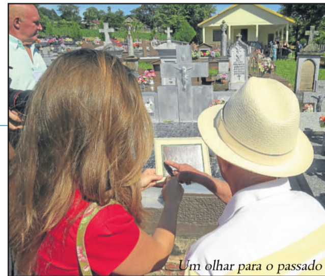
Um olhar para o passado