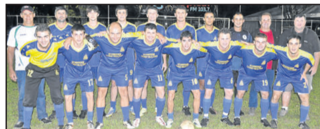
Amigos de Boa Vista venceu e conquistou classificação à semifinal