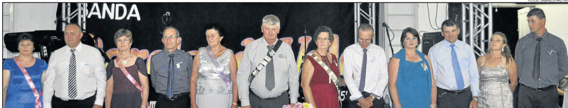
Corte 2014 do Tiro Rei