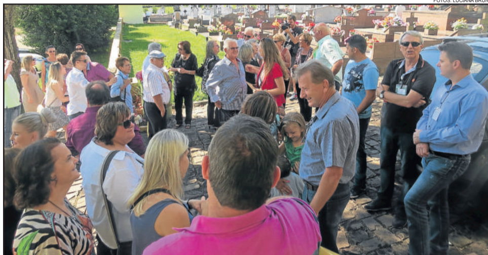
Recepção ocorreu no Cemitério da Boa Vista

A programação do encontro deste domingo iniciou no Bairro Boa Vista, com visita aos túmulos dos familiares e descendentes no cemitério da localidade. Foi