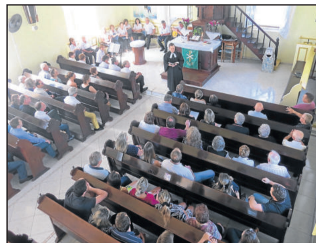
Culto foi realizado na Igreja de Boa Vista