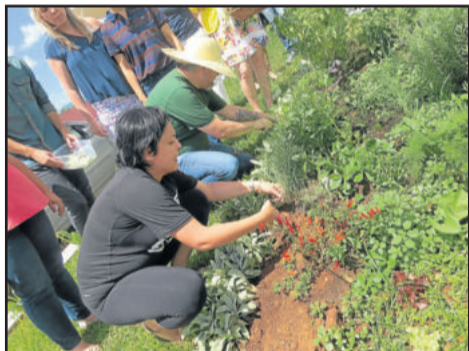
Colheita das plantas no jardim

A psiquiatra descobriu o gosto pela culinária por acaso, e aos poucos foi comprovando que esta, junto com a jardinagem, pode ser grande aliada, inclusive, no tratamento de seus pacientes, além de um maravilhoso lazer e prazer.