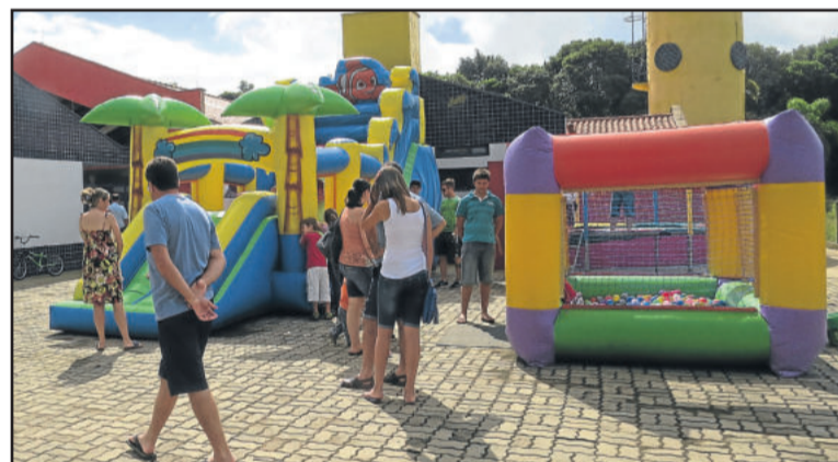
Crianças puderam se divertir nos brinquedos infláveis

A EMEI Pró-Infância de Paverama está em funcionamento desde a segunda-feira passada, dia 23, quando foi iniciado o ano letivo em todas as escolas.