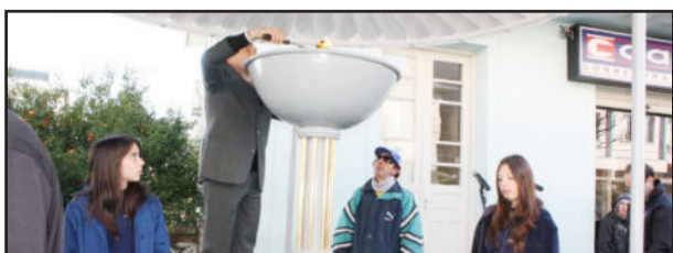
Prefeito acende a Pira da Pátria