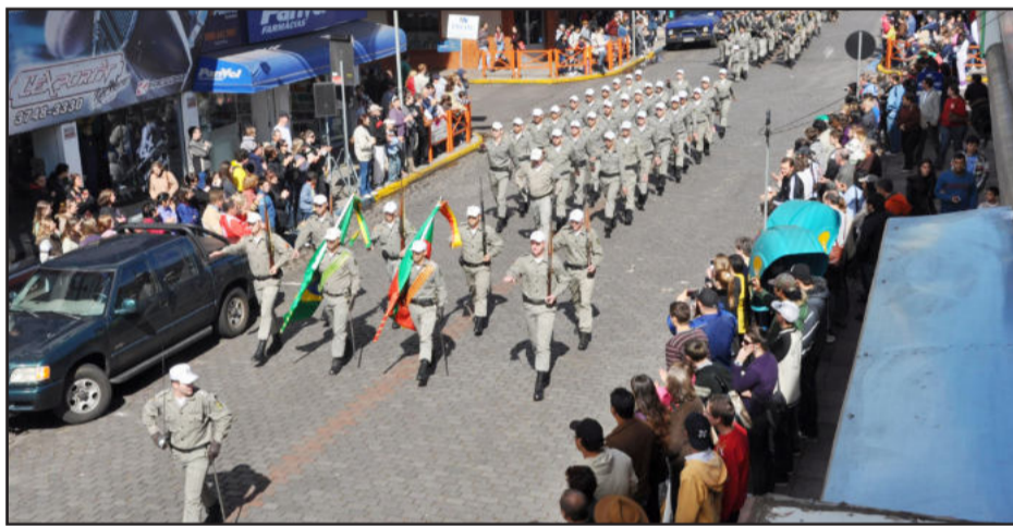
Desfile Cívico de Lajeado está previsto para hoje

Dispersão - Em direção à Avenida Benjamin Constant.