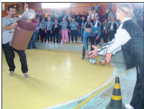
Integrantes do projeto na comunidade de Santana, em Fazenda Vilanova, fizeram demonstrações das atividades que desenvolvem

De acordo com a secretária da Saúde, Cidadania e Atenção Social, Luiza Helena César, as inscrições são gratuitas e devem ser feitas até o dia 8 de setembro, no Centro de Referência em Assistência Social (CRAS) de Fazenda Vilanova. Ele se localiza junto ao Centro de Saúde. Mais informações pelos telefones (51) 3613-1102 ou 8170-8054.