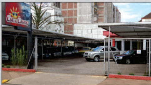
Loja Centro, 12 anos de tradição