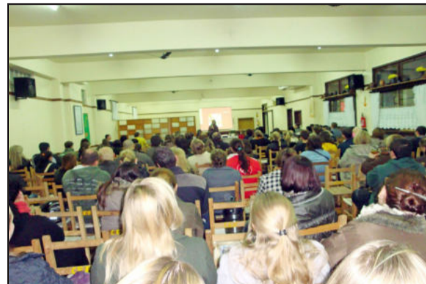
Debate sobre relacionamento entre pais e filhos