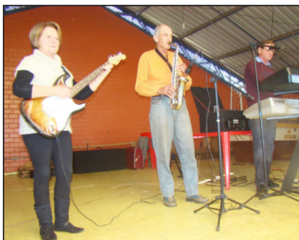
Bandinha Melhor Idade, de Teutônia, animou o Encontro de Vivências