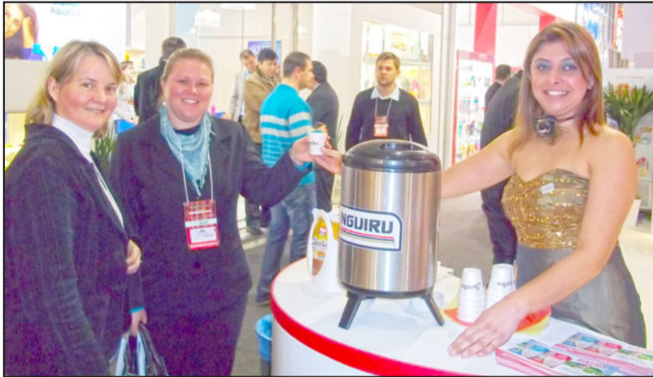
Chocolan foi um dos destaques no estande da Languiru