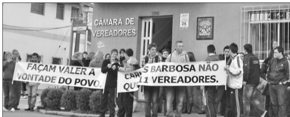
Protesto contra aumento do número de vereadores antes da Sessão ordinária

Vereadores contrariam opinião da maior parcela da população e aprova aumento do número de vereadores em Carlos Barbosa