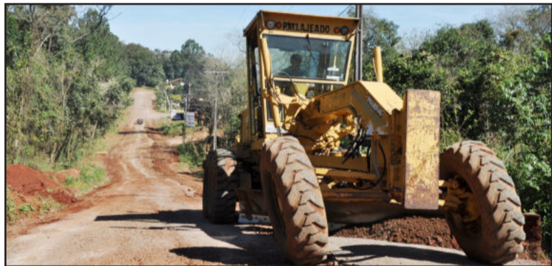
Rua Godwin Cremer foi uma das vias a serem recuperadas pela prefeitura