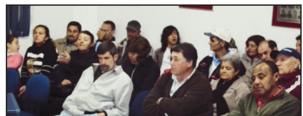
Secretário e prefeito (acima) tentaram explicar situação da falta de médicos. População e vereadores protestam