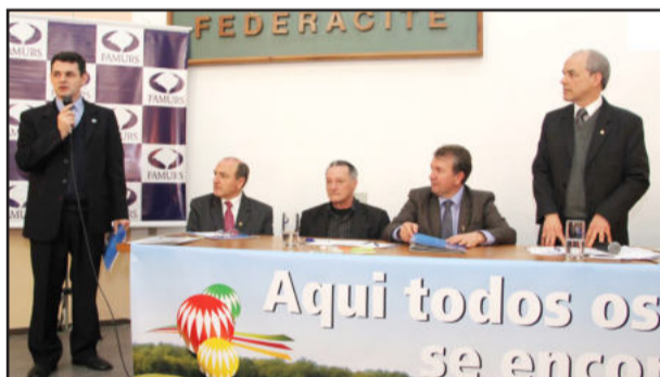
Encontro ocorreu na Expointer

Na quarta-feira, dia 31, a Federação das Associações de Municípios do Rio Grande do Sul (Famurs) recepcionou prefeitos na Expointer, em Esteio, para uma Assembleia Geral Ordinária. Um dos assuntos do encontro foi apresentado