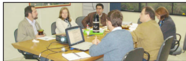
Encontro dos diretores ocorreu na sala de reuniões da CIC

Na oportunidade o grupo ainda definiu estratégias para envolver e buscar a associação de novas empresas teuto-nienses; estimular a participação dos diretores nos diversos conselhos municipais, incrementando a representatividade da CIC junto às lideranças políticas e à comunidade; temas para as próximas edições de almoços empresariais nos meses de setembro, outubro, novembro e dezembro; e sugestões de empresas e entidades a integrarem a programação de visitas técnicas promovidas pela CIC.