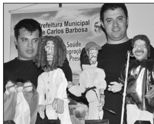
Bonecos da Gente na Conferência Juventude