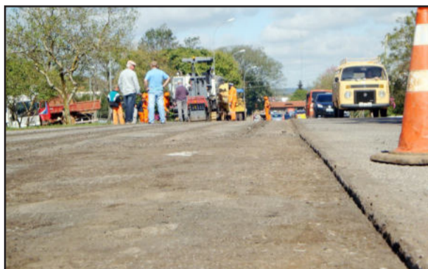
Prefeitura investiu cerca de R$ 20 mil na recuperação do trecho