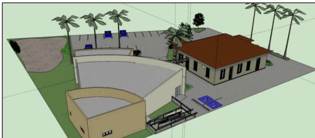
Município buscará recursos para o Centro Cultural Municipal