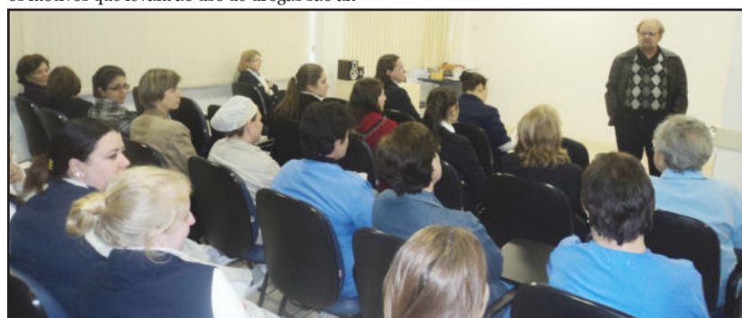
Katz enfatizou que os vícios são em virtude de ansiedade e outros fatores