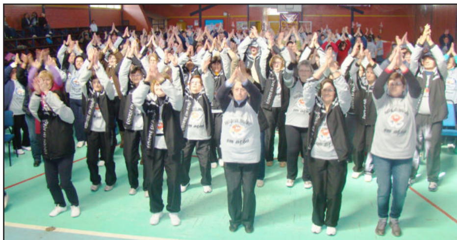
Integrantes de Fazenda Vilanova e Bom Retiro do Sul reuniram-se nesta quarta-feira

Cerca de 400 participantes dos projetos de ginásticas de Fazenda Vilanova e Bom Retiro do Sul participaram do evento