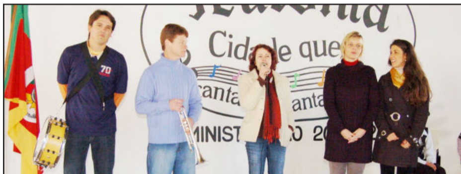
Inara (c) elogiou trabalho e chamou à frente os professores