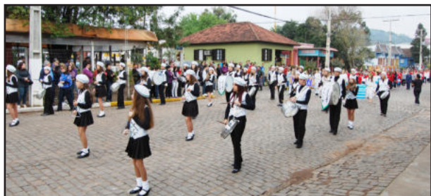
Em 2010, mais de 1.500 pessoas desfilaram pelas ruas de Paverama

Mais de 1.500 integrantes de 14 entidades participaram do desfile em 2010 e espera-se um número ainda mais expressivo para 2011.