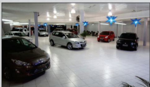
Loja São Cristóvão, mais ampla e moderna