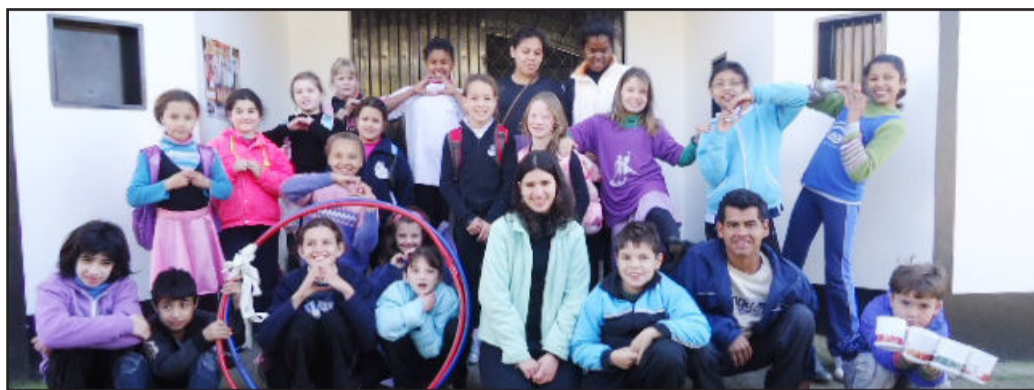
A diversidade APAE CEMEF e Alfredo em ensaio no Martin Luther

Este tema se refere a um projeto que existe no Centro Municipal de Ensino Fundamental Leonel de Moura Brizola - Cemef, que veio de um Programa 'A União Faz a Vida' do Sicredi. Ele fomenta a Educação Cooperativa e, segundo ele, acredita que a construção e a vivência de atitudes e valores de cooperação e cidadania contribuem para a formação de cidadãos capazes de empreender e criar. A "Colcha de Retalhos" mostra a diversidade de culturas do alunado do educandário. Cada aluno tem as suas características próprias e todos aprendem a respeitar essa pluralidade, trabalhando então a educação integral.