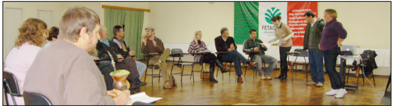
Palestra sobre Turismo Rural no STR

Na tarde desta segunda-feira, dia 29 de agosto, realizou-se a palestra de sensibilização para o Turismo Rural para interessados dos municípios de Teutônia e Westfália. A iniciativa é da Administração Municipal, através da Secretaria de Cultura e Turismo, e do Sindicato dos Trabalhadores Rurais (STR) de Teutônia, com extensão de base em Westfália. A palestra foi ministrada por profissionais do Serviço Nacional de Aprendizagem Rural (SENAR), na sede do STR, no Bairro Languiru.