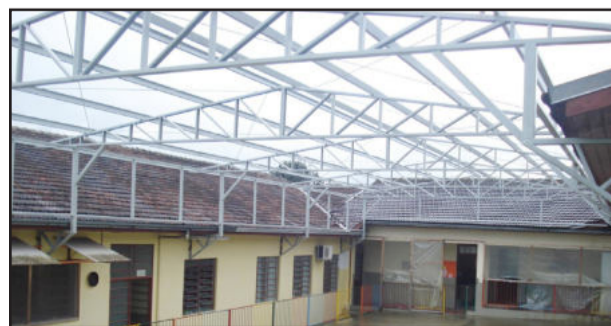
Obras de instalação de telhado já começaram

A Escola Azaléia iniciou as obras de instalação do telhado sobre a quadra do cercadinho. O local é usado pelas crianças para a brincadeiras, prática de esportes e atividades de educação física. Como o local era a céu aberto em dias de chuva as crianças ficavam sem poder usar o espaço. As obras de instalação do telhado iniciaram no último final de semana e devem estar concluídas nos próximos dias. Informações preliminares dão conta de que o investimento está sendo feito por recursos próprios do educandário.