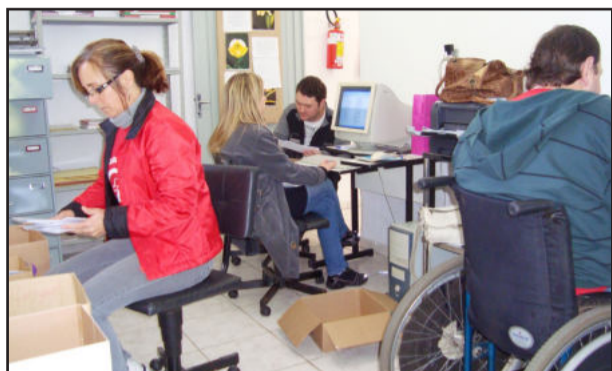
No Posto de Saúde do Bairro Alesgut também foi realizado mutirão para digitar prontuários

A Secretaria Municipal de Saúde continua a mobilização para o recadastramento de prontuários. Desta vez, o mutirão foi realizado para o cadastramento dos pacientes da Unidade Básica de Saúde do Bairro Alesgut. Nesta quarta-feira, dia 31 de agosto, cinco funcionários do Centro Avançado de Saúde (CAS) do Bairro Canabarro, da coordenação e da equipe administrativa, participaram do mutirão, juntamente com a equipe do Bairro Alesgut, para recadastrar, aproximadamente, 5 mil fichas.