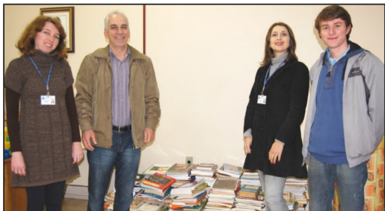
Biblioteca recebeu doação nesta terça-feira