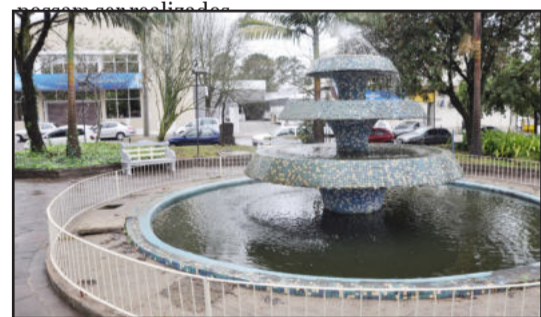
Chafariz da Praça Gaspar Silveira Martins foi recuperado pela prefeitura

mesmo nome. "Vamos instalar postes e tela de 6 metros de altura atrás das goleiras, para evitar que as crianças corram atrás da bola nas vias próximas ao espaço de lazer", afirmou Gisch. Contudo, ele lembra que o tempo precisa estar seco para que os serviços