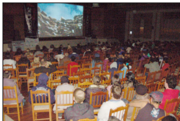
Público pôde assistir a dois filmes via Instituto Estadual do Cinema

A história acontece no interior do Rio Grande do Sul e gira em torno dos pequenos conflitos de adolescentes, deparando-se para ingressar no mundo adulto. Daniel tem 15 anos, uma namorada indecisa Mim, e um amigo cheio de problemas, Lucas. Daniel se comunica com o pai biológico, que vive num país do oriente, somente através