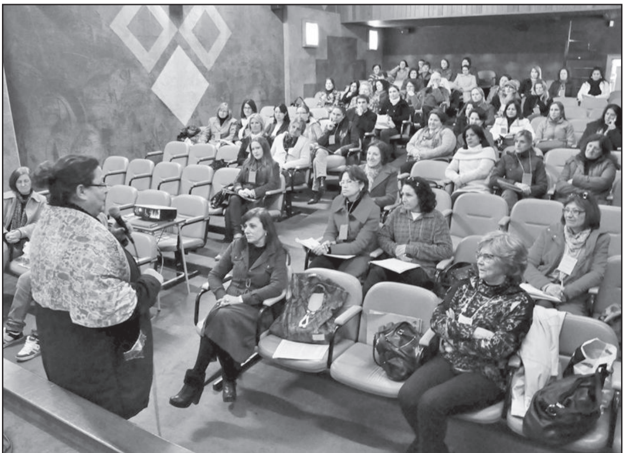
Conferência de Políticas Públicas para a Mulher reúne bom público