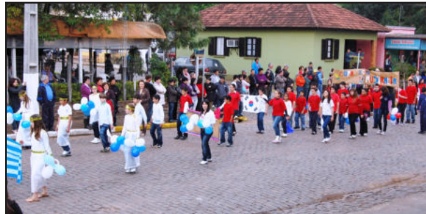
Colorido especial na homenagem à Pátria