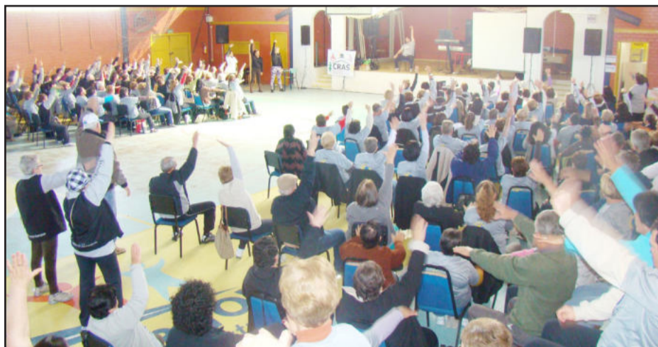
Cerca de 400 pessoas reuniram-se no Ginásio de Esportes do Centro

O Projeto Esporte em Ação, desenvolvido pela Administração Municipal de Fazenda Vilanova através da Secretaria da Educação, Cultura, Desporto e Turismo, foi responsável por realizar, na tarde desta quarta-feira, dia 31, a sétima edição do Encontro de Vivências.