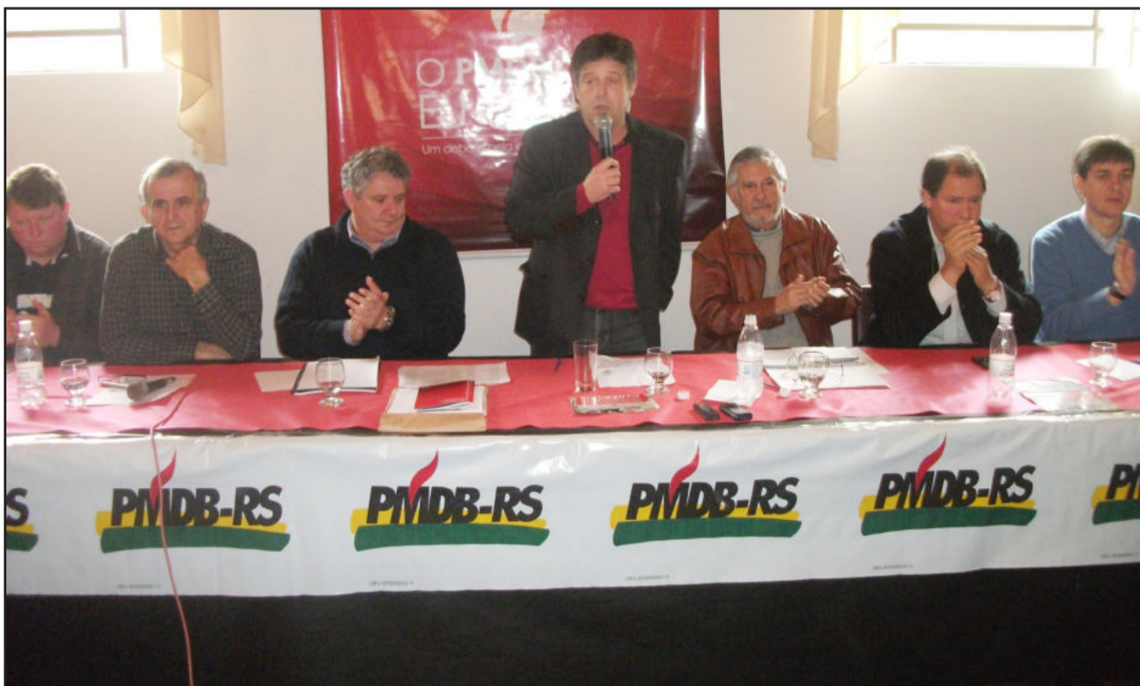
Encontro do PMDB em Arroio do Meio faz parte da estratégia de revitalizar e fortalecer a sigla

Além das análises político-partidárias, com avaliações do cenário estadual, os presentes debateram o projeto de Lei dos Medicamentos Genéricos Veterinários, incluído na Ordem do Dia da Câmara pelo deputado federal Alceu Moreira. Caso a proposição venha a ser aprovada, os gastos de produção para abate e também para cuidados com animais domésticos podem ser reduzidos entre 40% e 45%.