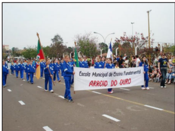
Desfile deve reunir mais de 7 mil estudantes

O desfile reunirá 38 entidades, com a participação de 7.635 alunos, 631 professores e 431 servidores e funcionários dos educandários do Município. O evento é realizado pela Prefeitura, por intermédio da Secretaria Municipal de Educação, com apoio dos educandários das redes estaduais e particulares.