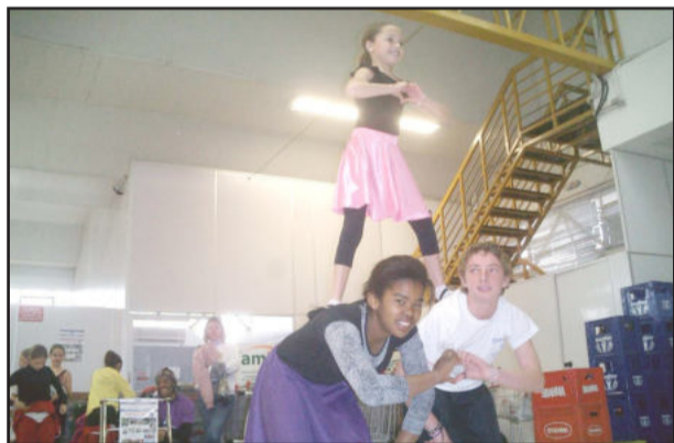
A diversidade na dança - coreografia Agita Hê CEMEF

Tudo isso e todos unidos pela arte e pela solidariedade. Assim é o Conexões 8. Esse ano beneficiando o Cemef e a Associação Regional Cultural e Artística de Teutônia - Arca.