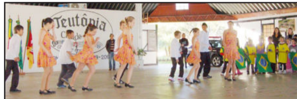
Escola Guilherme Sommer apresentou danças