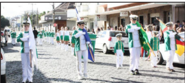
Escola Dante Grossi

Tanto na solenidade de hasteamento como na de arriação das bandeiras, são realizadas apresentações artísticas e culturais de entidades e escolas do município. Na manhã desta quinta, quem se apresentou foi a Escola Estadual de Ensino Médio Dante Grossi, através de sua banda. No dia 07 de setembro, a partir das 8 horas, acontece o Desfile Cívico, na Avenida Rio Branco e na Rua Buarque de Macedo.