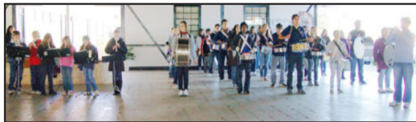
Banda Marcial da Escola Estadual Gomes Freire de Andrade encanta pela sincronia

"Vivendo as Diferenças" é o tema deste ano