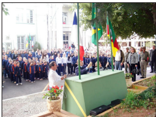
Abertura da Semana da Pátria

O evento contará com a participação de educandários das redes de ensino do Município. A programação se estende durante os próximos dias, com o hasteamento do pavilhão nacional às 8h30min e arriamento às 17 horas, junto à praça matriz.