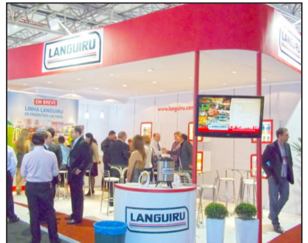
Estande da Languiru chamou a atenção pela estrutura

No espaço, cuja estrutura impressionou pelo moderno visual, os profissionais da área comercial atenderam os visitantes e conheceram suas necessidades. Da mesma forma, os clientes elogiaram o atendimento prestado pelas Centrais de Distribuição da Languiru no Estado. O destaque no estande foi a degustação do Chocolan, muito apreciado pelos visitantes e que pode ser consumido quente ou gelado.