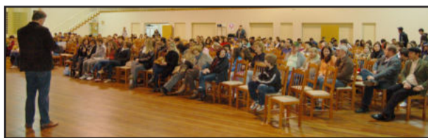
Bom público acompanhou as sessões de cinema em Teutônia

Esse curta metragem poderia ser classificado dentro do gênero terror psicológico. Uma mulher encontra-se dentro de um poço e não consegue ajuda para sair de lá. Não se sabe como ela foi parar lá e sua angústia contamina o espectador, principalmente em função da