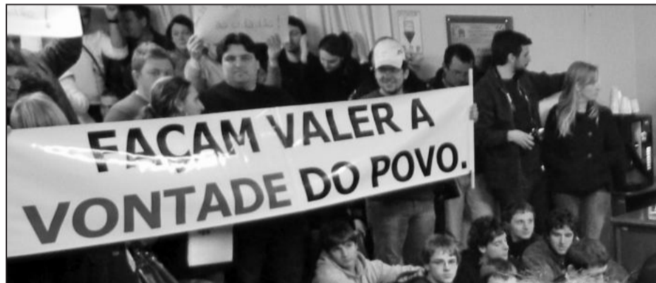
Manifestação dentro do Plenário

A proposta de elevar o número de vereadores em Carlos Barbosa, de 9 para 11, se concretizou nesta quarta-feira, dia 31 de agosto, conforme a Emenda Constitucional que estabelece o limite de parlamentares de acordo com a faixa da população. Em uma sessão ordinária considerada histórica para o município, a proposta foi aprovada em segundo turno com o apoio das bancadas do PP, PT, PC do B e DEM. Contrários a essa iniciativa, mantiveram-se o PMDB e o PDT.