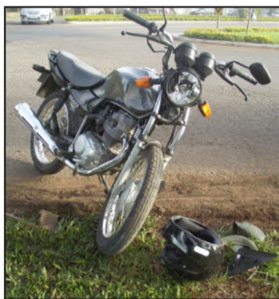
Moto trafegava na Via Láctea e colidiu na lateral do Celta