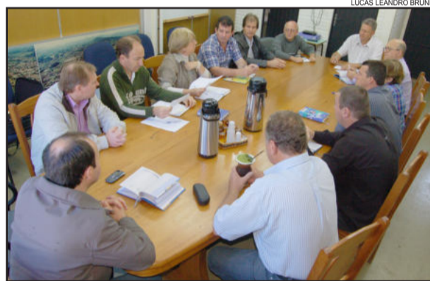
Reunião dos secretários abordou ações para fechar o mandato