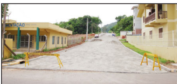
Pavimentação da Rua Ricardo Luersen no Bairro Languiru