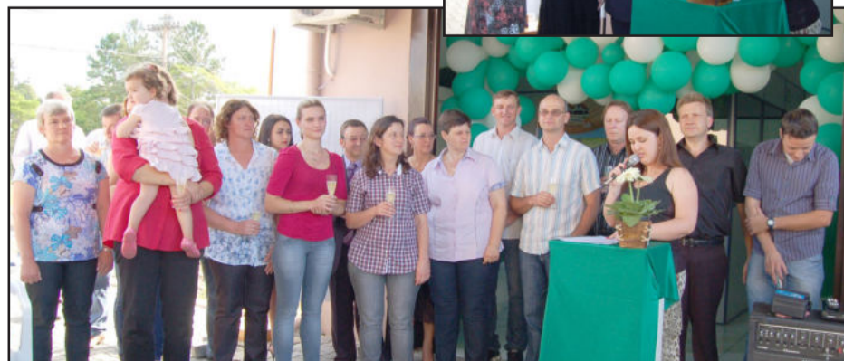
Equipe de colaboradores da Bella Luna