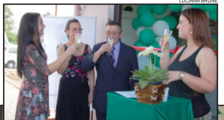
O brinde da família Immich