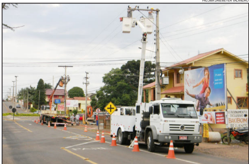
Equipe da Certel Energia trabalhou durante a manhã de sábado no local

O choque causou a falta de energia para casas e estabelecimentos comerciais desde o trevo da Via Láctea até as imediações da Rádio Popular e do Hospital Ouro Branco. Várias ruas ficaram sem energia elétrica durante quase 6 horas. Segundo informações de populares, o condutor do veículo, jovem de 22 anos, é natural de Novo Hamburgo e estaria a passeio na casa de familiares em Teutônia.