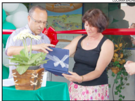
Entrega de uma placa da Amturvaes à Rota Germânica

Após a solenidade oficial, todos foram convidados para conhecer as instalações novas da empresa, podendo visitar a fábrica e também o ponto de venda, uma ampla loja que apresenta toda variedade de itens produzidos pela empresa no Município de Teutônia. Ao final, ocorreu um coquetel de confraternização para comemorar.