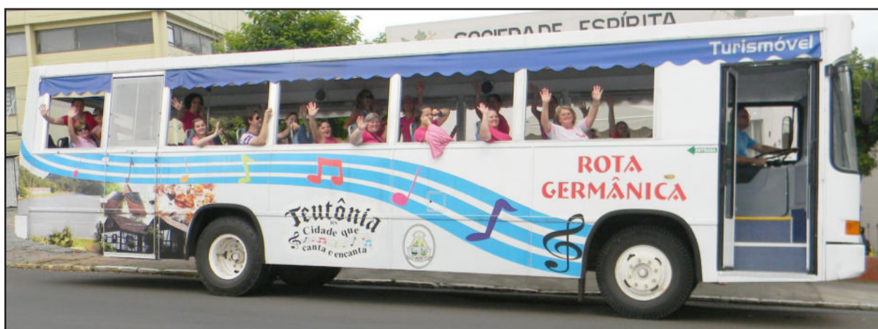
Turismóvel conduziu voluntárias de um bairro a outro