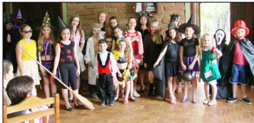
Crianças fantasiadas com trajés

Segundo as diretoras da Open Up Idiomas, ao estudarmos uma língua estrangeira, também devemos aprender a respeitar a cultura e as tradições desses países e este foi o objetivo da festa, além de promover a integração entre alunos e professores.