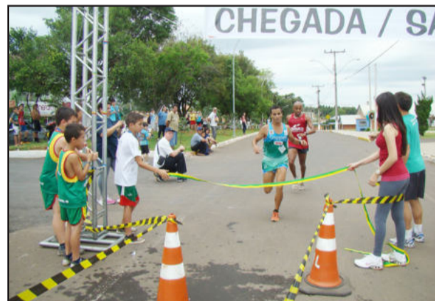
Disputa entre os corredores foi acirrada