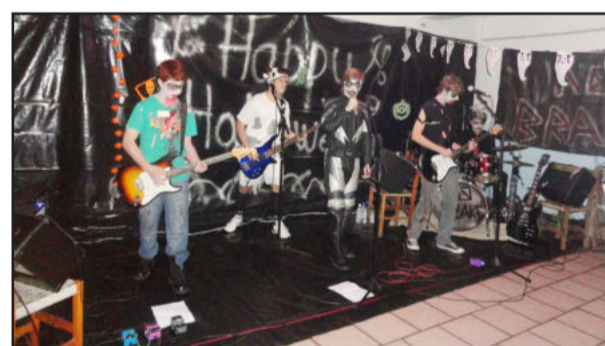
Banda NO BRAKE