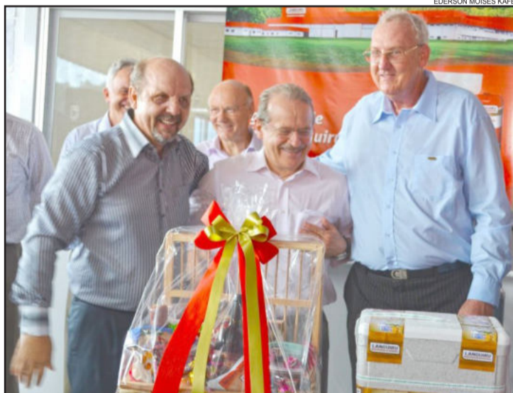
Governador ganhou uma cesta com produtos da Languiru

Na sexta-feira, dia 26 de outubro, a Cooperativa Languiru recebeu a visita do governador do Estado, Tarso Genro. O evento aconteceu no recém-inaugurado Frigorífico de Suínos da Languiru, localizado no município de Poço das Antas. O governador aproveitou a ocasião para conhecer a estrutura, os investimentos e o quadro social da Cooperativa.