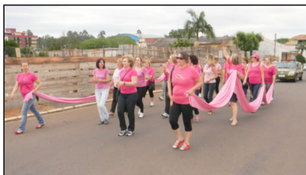
Integrantes da Liga Feminina pretendem conseguir, cada vez mais, a participação das mulheres