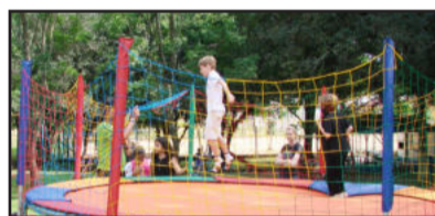
Todos puderam se divertir nos brinquedos