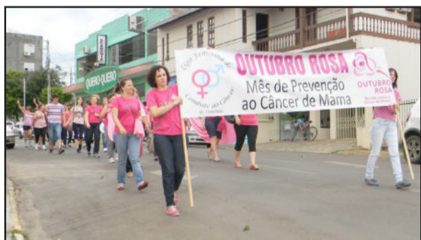
Muita animação marcou a caminhada de conscientização pelo Outubro Rosa

apresentar câncer de mama para 2012. A incidência vem aumentando nos últimos anos e algumas razões tentam explicar isso como o fato das mulheres engravidarem mais tarde, amamentam por menos tempo seus filhos, tem um maior índice de obesidade, ingerem mais bebidas alcoólicas e consomem mais alimentos industrializados, é o que alertam as voluntárias da LFCCT. Existem, ainda, os fatores de risco para o câncer de mama que estão ligados aos aspectos hormonais, genéticos e idade.