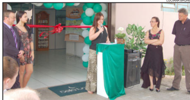
Solenidade comemorativa aos 11 anos da Rota ocorreu na Bella Luna