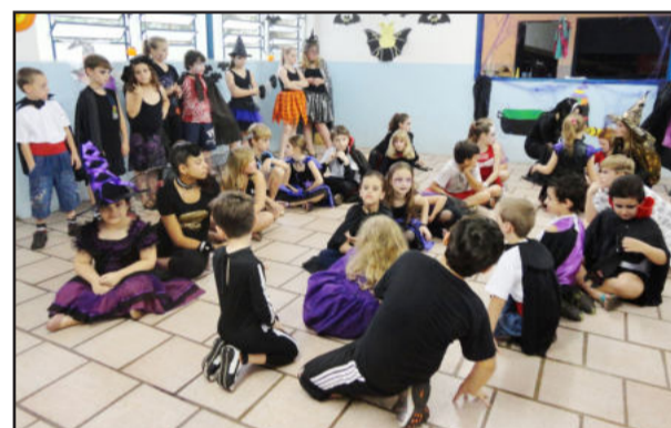
Crianças fazendo brincadeiras

A Wizard Teutônia realizou programação especial de Halloween, no sábado, dia 27 de outubro, com festa na Associação dos Funcionários da Elegê. De tarde iniciou às 16 horas para as crianças. Foram realizadas brincadeiras e também o tradicional Trick or treat, que é pedir doces nas casas. À noite a festa foi para os adolescentes e adultos, das 20h30min até a meia-noite. Além das brincadeiras de integração que divertiram a todos, teve animação da banda NO BRAKE. Todos estavam no clima, fantasiados a rigor para garantir o espírito da festa.