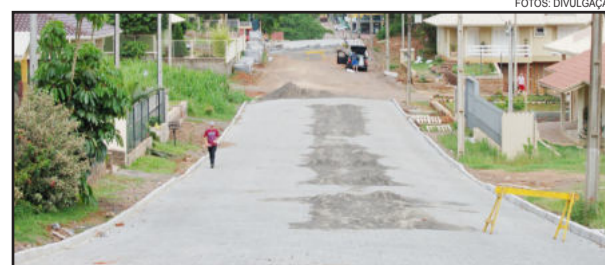
Período final das obras na rua que está liberada para o trânsito