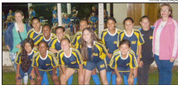
EEEM Nossa Senhora da Esperança levou a taça no Feminino