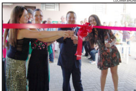
O corte da fita inaugural do novo prédio da empresa Bella Luna