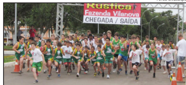
Largada das categorias Infantil