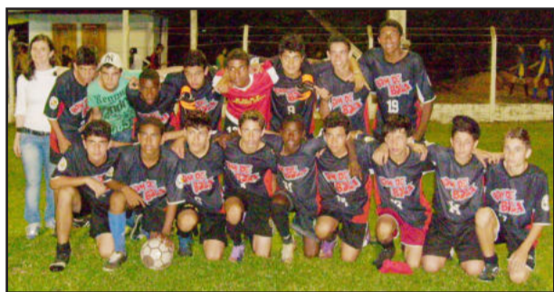
EMEF Menino Deus levou o título no Masculino

vou o título de campeã na categoria Masculino e vai para a final estadual. Na categoria Feminino, o título ficou com a Escola Estadual Nossa Senhora da Esperança, também de Santa Cruz do Sul. Esta etapa contou com 50 equipes (30 masculinas e 20 femininas) de 44 diferentes escolas, que representaram um total de 30 municípios. Foram 124 jogos e 1.000 participantes, entre alunos, professores, pais, familiares e organizadores. As partidas ocorreram nos campos de Esperança, Gaúcho, Ribeirense, Cruzeiro e Associação da Elegê.