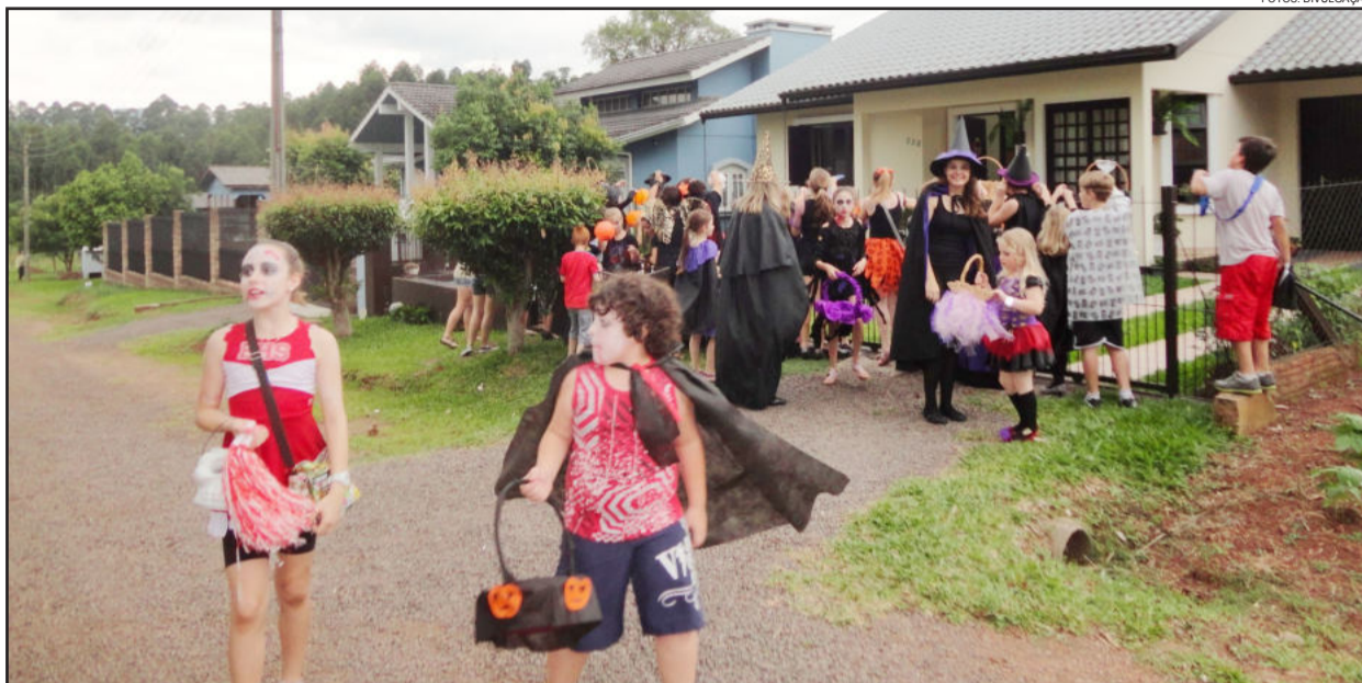
Crianças pedindo por "trick or treat" (travessuras ou gostosuras) nas casas

A Wizard Teutônia realizou programação especial de Halloween, no sábado, dia 27 de outubro, com festa na Associação dos Funcionários da Elegê. De tarde iniciou às 16 horas para as crianças. Foram realizadas brincadeiras e também o tradicional Trick or treat, que é pedir doces nas casas. À noite a festa foi para os adolescentes e adultos, das 20h30min até a meia-noite. Além das brincadeiras de integração que divertiram a todos, teve animação da banda NO BRAKE. Todos estavam no clima, fantasiados a rigor para garantir o espírito da festa.