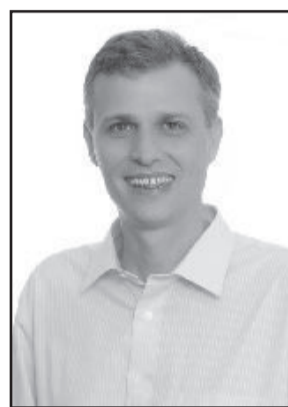
Prefeito: Carlos Rafael Mallmann

Passadas as eleições, o momento agora é de pensar em Estrela. Com esse propósito, o atual prefeito e o prefeito eleito de Estrela estiveram em reunião há alguns dias discutindo o futuro do município. E quando se fala em Legislativo eleito, Valmor ressalta que o Executivo terá um relacionamento bom com todos os eleitos na Câmara, independente de siglas partidárias. "Temos uma boa relação com a Câmara de Vereadores. A população nos deu a oportunidade de termos a maioria na Câmara, mas independente