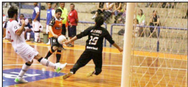
ACBF, de Sinoê, encara o Bento Futsal nesta terça

Após uma semana intensa de treinamento, a ACBF vai focada para o primeiro confronto que definirá um dos finalistas do Gauchão 2012. Se vencer fora de casa, o time laranja jogará por um empate em casa, na próxima semana. Na outra Semifinal, a disputa para a vaga na semifinal está entre o atual campeão do Gaúcho, CER Atlântico, Erechim, e a AGSL, São Luiz Gonzaga, no primeiro confronto entre as duas equipes, o Atlântico levou a melhor e venceu fora de casa, por 2x1.