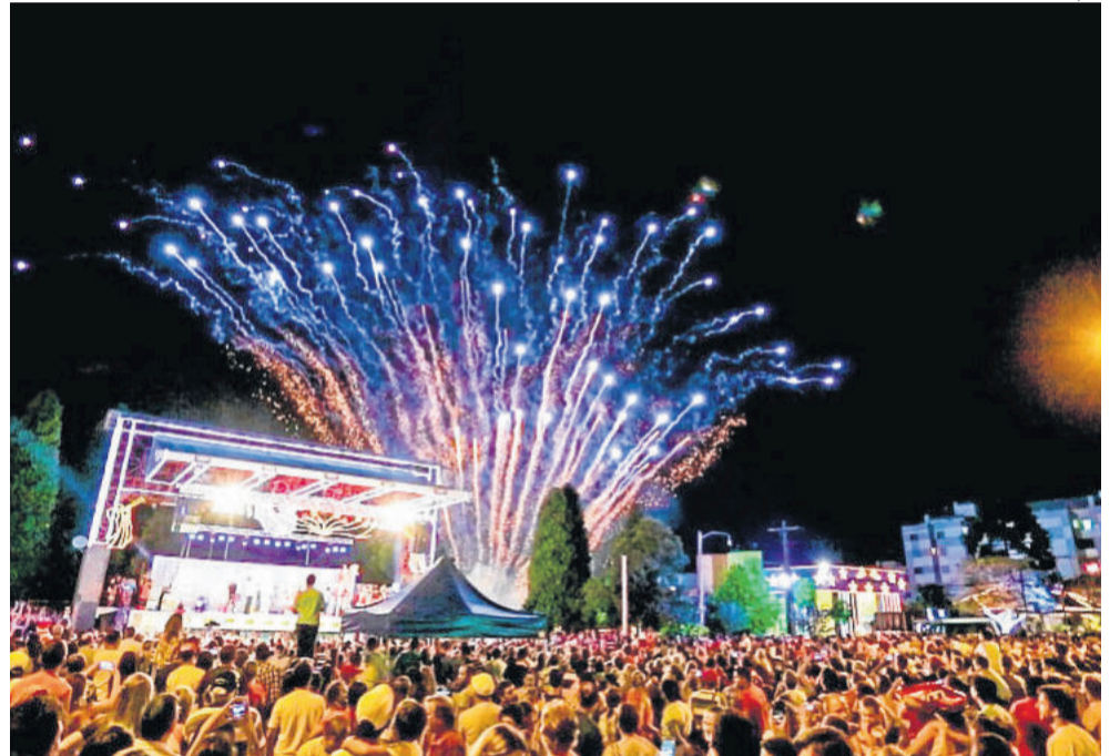
Shows e fogos de artifícios vão recepcionar a chegada de 2018 em Carlos Barbosa

Em caso de condições climáticas desfavoráveis, a Secretaria Municipal de Desenvolvimento Turístico, Indústria e Comércio, responsável pela realização do Show de Réveillon, informará as alterações do evento. O Show de Réveillon integra a programação do Natal no Caminho das Estrelas, que é realizado pela Administração Municipal, através da Secretaria de Desenvolvimento Turístico, Indústria e Comércio, e pelo Governo Federal, por meio da Lei Rouanet, tendo como proponente a S&S Eventos e patrocínio da empresa Tramontina, Cooperativa Santa Clara, Galvanotek e Construtora Käfer.