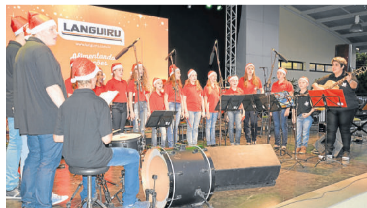
Show Musical Pro Cultura Paz abriu a noite de espetáculos

tal ainda está aberto, é graças ao apoio da comunidade, das prefeituras com as quais mantemos convênios e de cooperativas como a Languiru, a Certel e a Sicredi. Nesta noite especial, cada um de vocês também deu a sua contribuição”, afirmou.