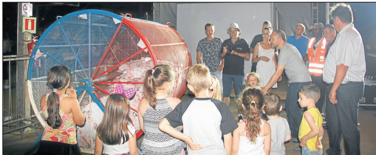
Sorteio do Estrela Premiada encerrou a programação do Natal em Estrela