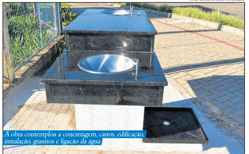
A obra contemplou a concretagem, canos, edificação, instalação, granitos e ligação da água