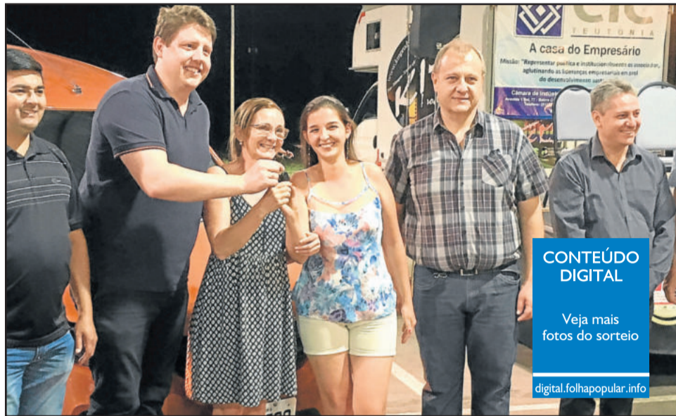
Mãe e irmã do ganhador estavam na plateia e receberam, simbolicamente, as chaves do carro