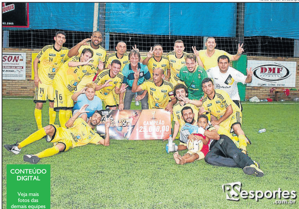
AABBOC de Canoas é bicampeã da competição