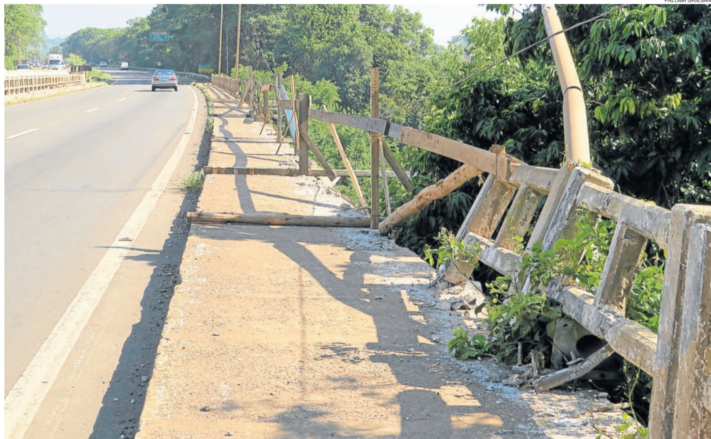
Estrutura frágil não oferece proteção suficiente em caso de novos acidentes

o órgão afirma que não há como dar um prazo exato para início e finalização das obras. “Mas a autarquia quer iniciar as obras o quanto antes, começando pela restauração dos guarda-corpos da ponte e, na sequência, executando os reparos na laje de passeio”, informa.