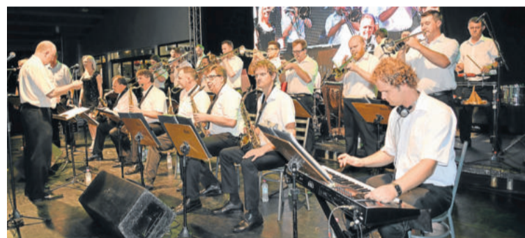
Orquestra de Teutônia empolgou o público com repertório variado, sendo aplaudida de pé