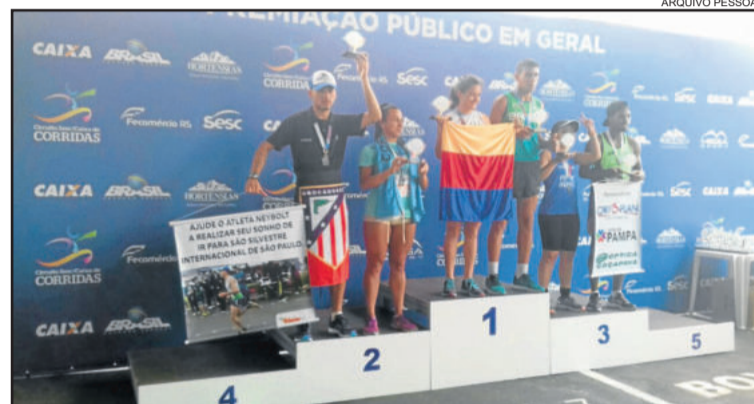
Neybolt foi vice na faixa etária do estadual