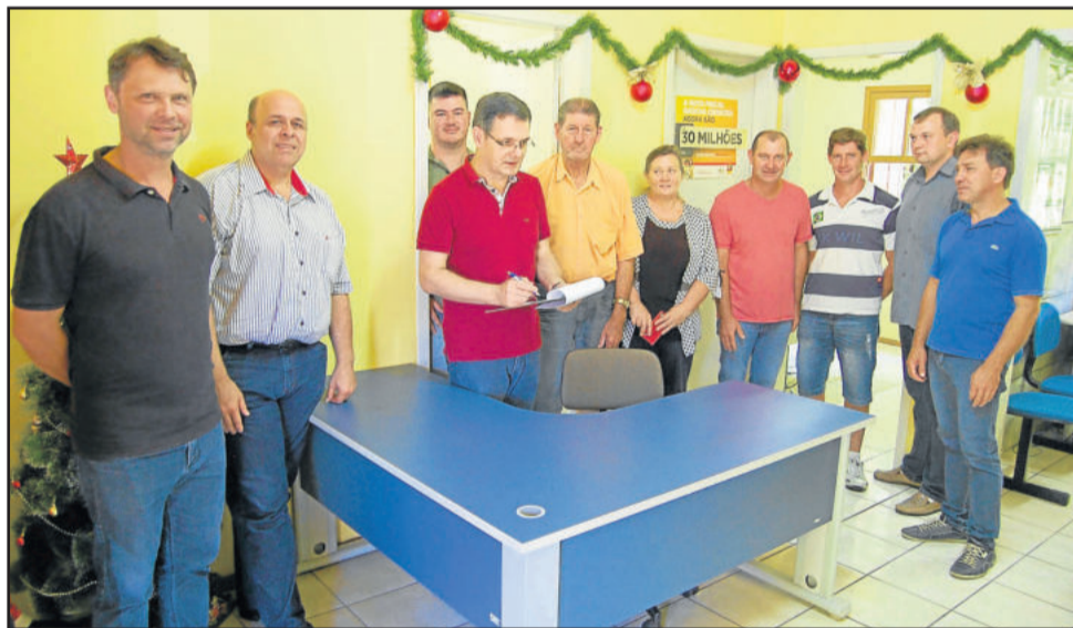
Sorteio de Incentivo à Produção Primária aconteceu no dia 26

A Administração Municipal de Imigrante realizou dois sorteios de fim de ano. O primeiro, realizado no sábado (23/12) foi o da Campanha de Incentivo à Arrecadação de 2017. O segundo, realizado na terça-feira (26/12) foi o da Campanha de Incentivo à Produção Primária. Confira os ganhadores: