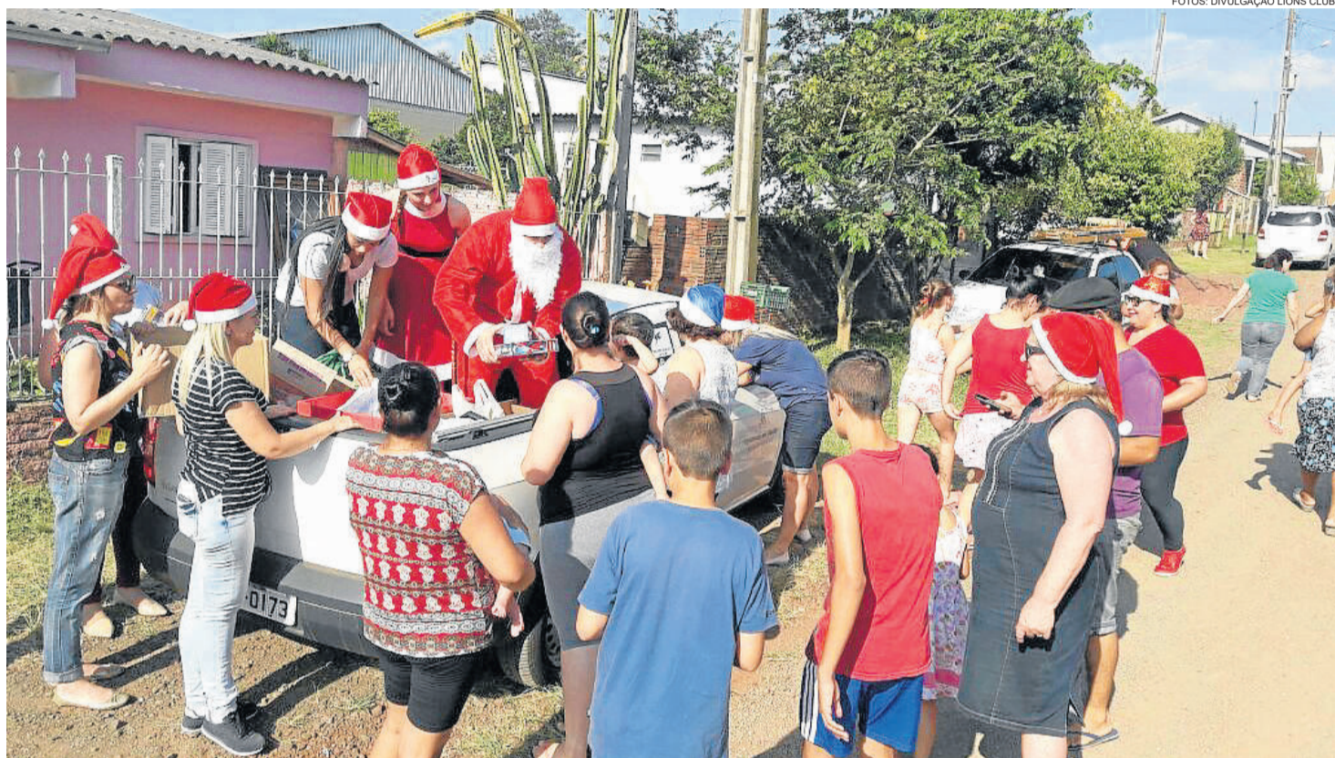
No Natal, distribuição de pacotes para famílias carentes de Teutônia

Ações ao longo do ano beneficiaram entidades, como lares de idosos