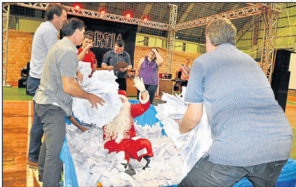
Sorteio da Campanha de Incentivo à Arrecadação foi realizado no dia 23