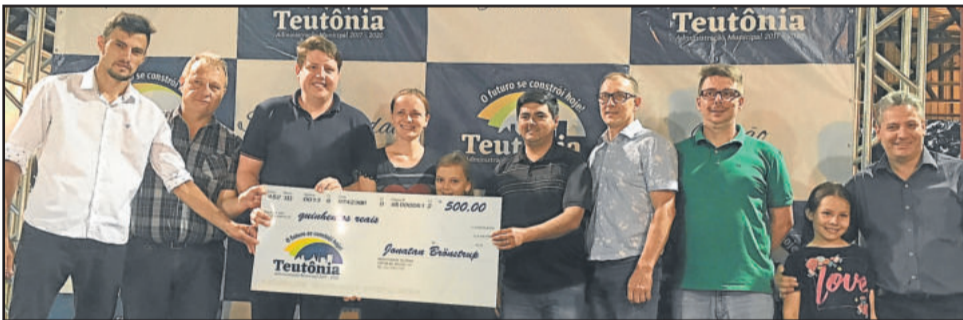
Vales-compras de 500,00 e 1.000,00 também foram sorteados

O evento de sorteio contou com as apresentações dos alunos dos Núcleos de Cultura – Projeto Gaita – e de Xepa. Teve brinquedos infláveis gratuitos para as crianças e sorteio de brindes entre os presentes.