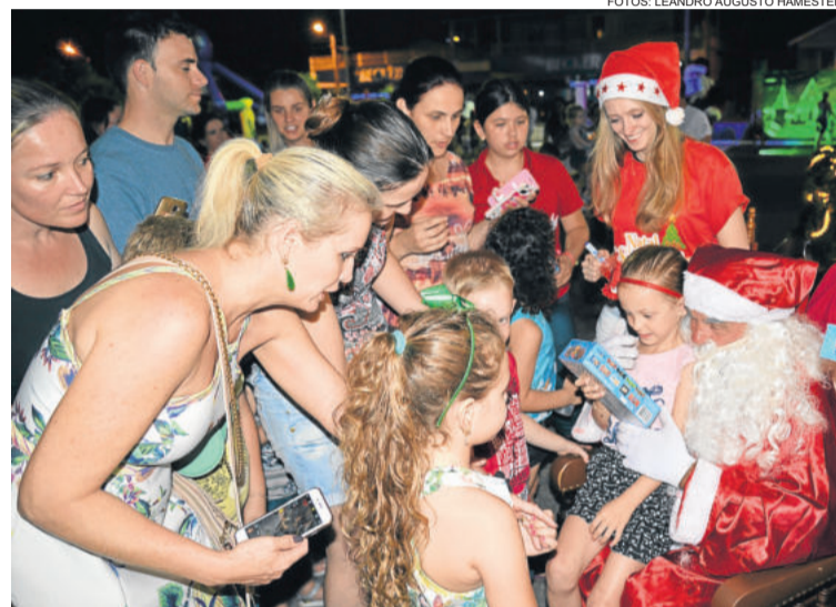
Chegada do Papai Noel, que distribuiu doces e pacotinhos de Natal, encerrou a programação