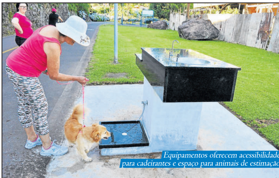
Equipamentos oferecem acessibilidade para cadeirantes e espaço para animais de estimação

adequado para animais de estimação. Stradiotti também ressalta que o governo se empenhou nesta obra, ofertando um equipamento de alta qualidade e pede a conscientização da comunidade para cuidar do espaço.