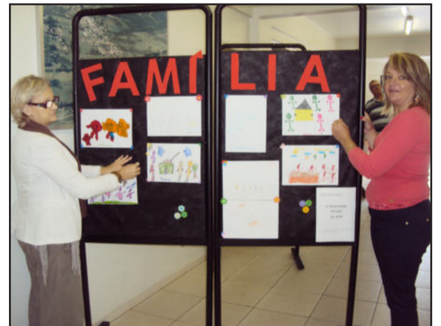
Trabalhos estão expostos na Prefeitura