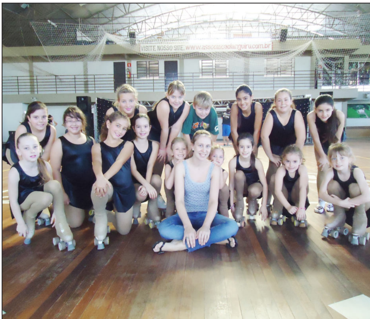
Grupo da Academia de Patinação Arte e Movimento no município de Teutônia