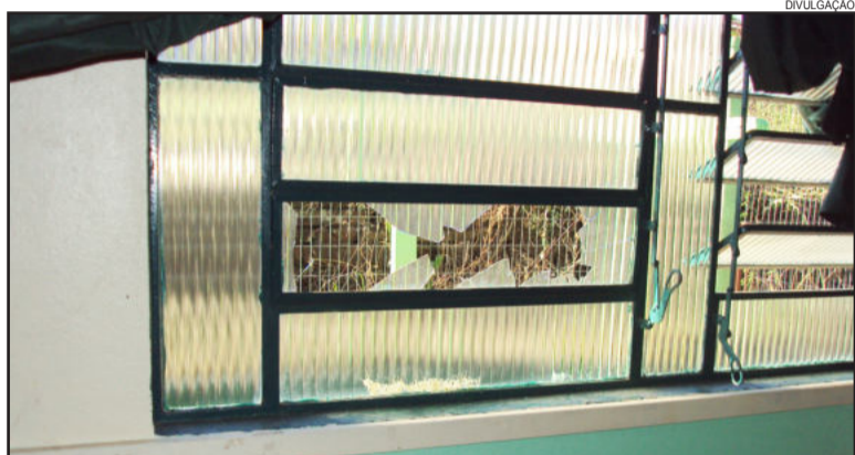
Vidro foi quebrado na Creche de Morro Bonito