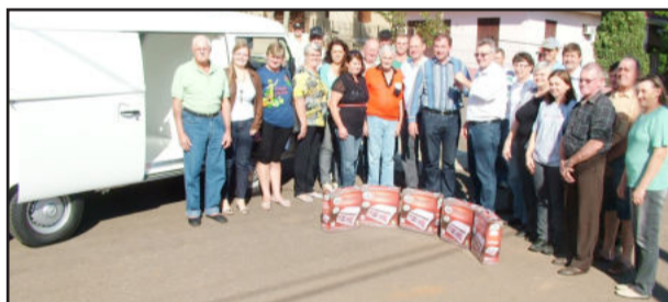
Comunidade recebeu o veículo, as balanças e as mesas com cadeiras