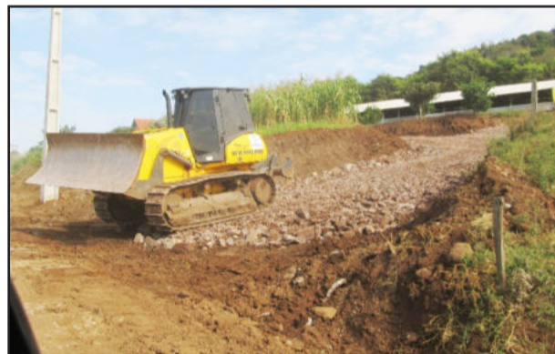
Acesso à propriedade da família Schmokel foi reformado