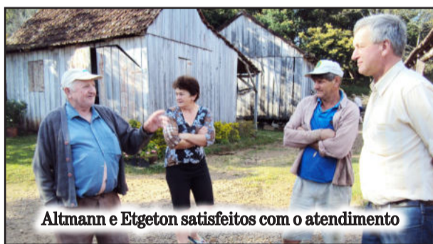
Altmann e Etgeton satisfeitos com o atendimento