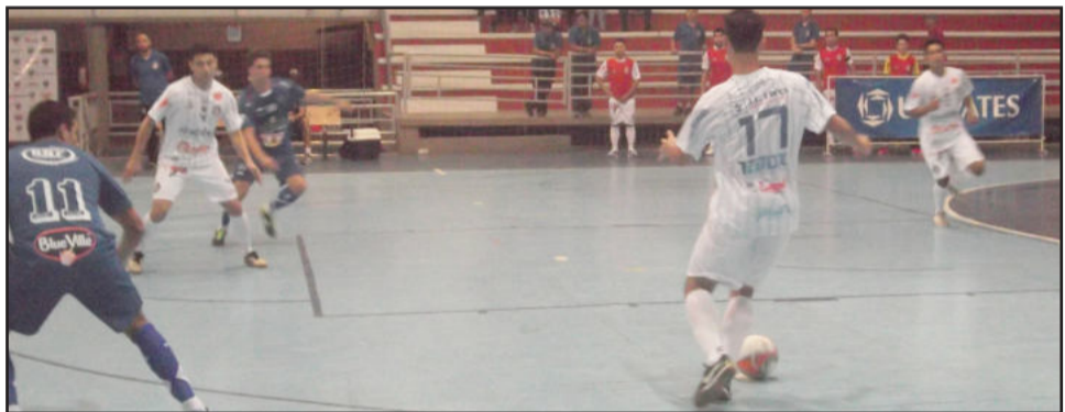
ALAF mandou no jogo do começo ao fim