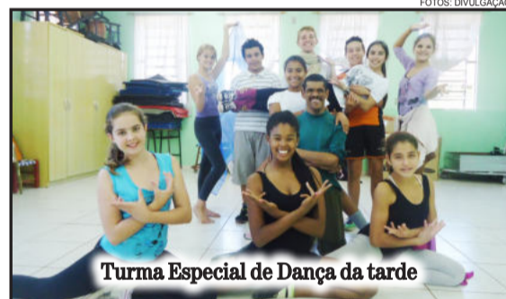
Turma Especial de Dança da tarde

"Se quer Dançar venha para cá se divertir, ser feliz ao nosso lado, para aprendermos juntos. Se gosta de Dançar venha para cá logo, aqui é o seu lugar, a gente acha um espacinho para você. Se o seu sonho é Dançar comece logo, pois nunca deixe seu sonho para trás e não perca essa oportunidade de ser feliz. A Dança pode ser tudo isso e muito mais."