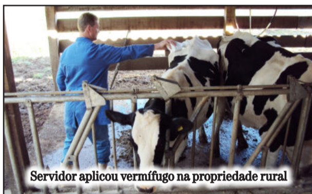
Servidor aplicou vermífugo na propriedade rural