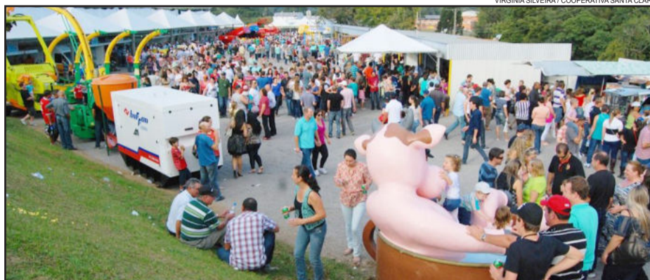
Parque de Exposições Expoclara