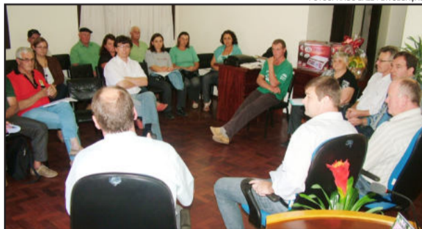
Encontro reuniu lideranças com o delegado federal do MDA