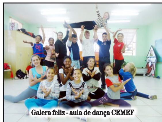
Galera feliz - aula de dança CEMEF