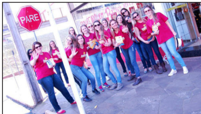
Candidatas auxiliando na divulgação da festa