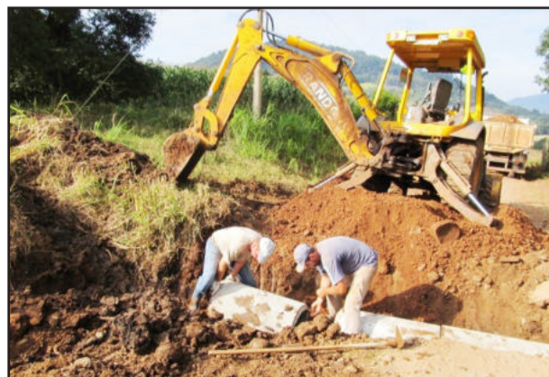
Bueiros foram colocados na estrada da Serrinha