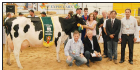
Grande Campeã Holandesa