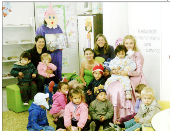
Hora do Conto procurou estimular a imaginação das crianças