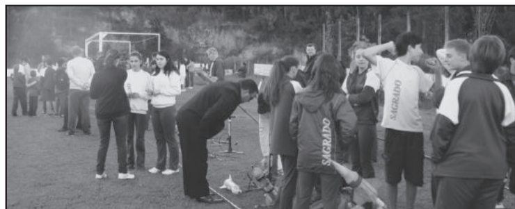
Alunos preparam-se para fazer o lançamento de foguetes