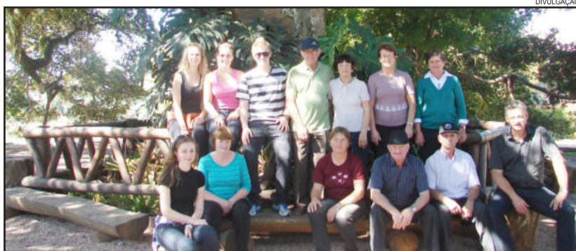
Empreendedores da Rota Germânica e Administração Municipal conheceram Quinta da Estância

Para os empreendedores do roteiro turístico, ter realizado essa troca de experiências foi de grande valia, pois proporcionou a