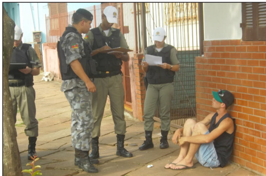
Dependentes químicos abordados por policiais responderam a um questionário feito pela BM