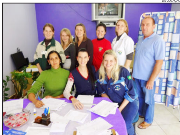
No último dia 20, equipes da UBS percorreram as comunidades do interior para imunizar os grupos prioritários

As pessoas portadoras de doenças crônicas precisam apresentar prescrição médica, ou cópia de uma receita atualizada, que comprove a sua condição. O documento deverá ser apresentado no dia da vacinação e ficará retido na unidade de saúde onde for realizada a vacina.