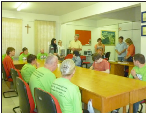
Apresentação ocorreu na Câmara de Vereadores

com orgulho do resultado que obtendo quanto a inclusão dos integrantes no cotidiano. "Eles fazem parte da comunidade ativamente e não sofrem aquele preconceito que marca. Trabalhos de forma lúdica, artes com temas do dia a dia, retratando a realidade individual dentro do lar, com as emoções e a família, fazem com que se desenvolvam e passem a se integrar, inclusive fazendo parte do mercado de trabalho", explicou.