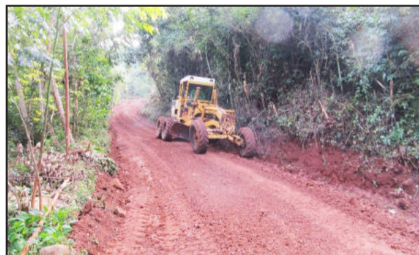
“Canto do Godóz” recebeu patrolamento