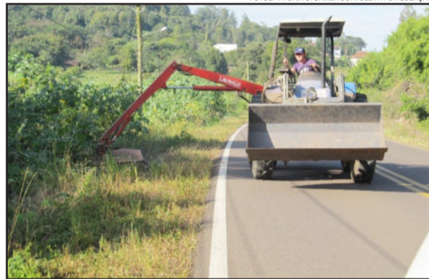
Vegetação na RS 129 foi roçada