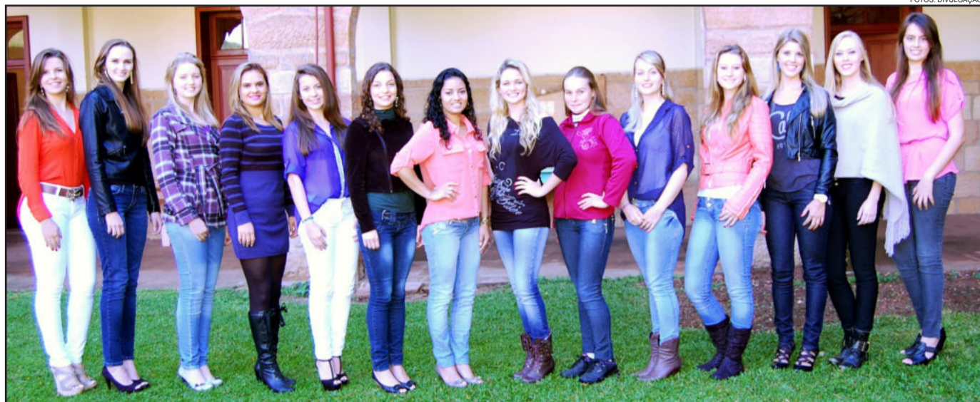
Candidatas que disputarão o título nesta sexta-feira