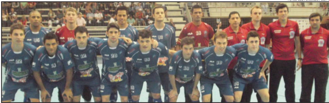
Em apenas 4 jogos, ALAF marcou 23 gols

Mas a equipe comandada por Giba não se abalou, e aos 13 minutos empatou a partida para a equipe da casa com Jamur, que bateu forte para deixar tudo igual: ALAF 1x1 AFUSCA.