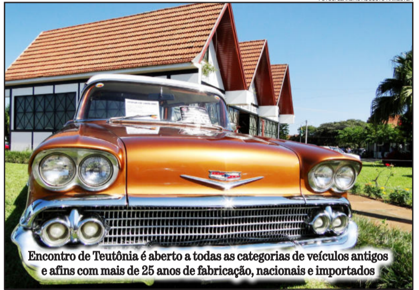
Encontro de Teutônia é aberto a todas as categorias de veículos antigos e afins com mais de 25 anos de fabricação, nacionais e importados

Na edição anterior, realizada em março de 2012, a programação reuniu cerca de 600 relíquias do milênio passado e