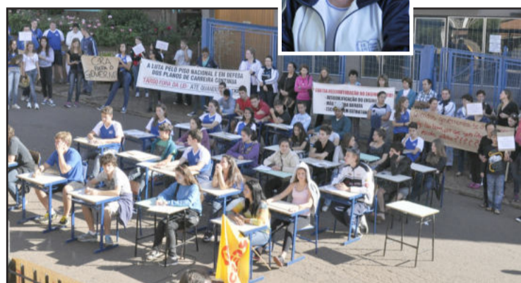
Grande parte dos alunos e professores da escola participou da paralisação na quarta-feira