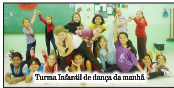
Turma Infantil de dança da manhã