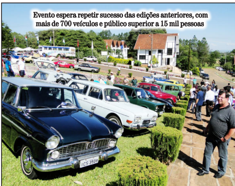
Evento espera repetir sucesso das edições anteriores, com mais de 700 veículos e público superior a 15 mil pessoas

Mais informações podem ser obtidas junto à CIC, pelo fone (51) 3762-1233. No site do evento ( www.carrosantigosteutonia.com.br ) também constam fotografias de edições anteriores, regulamento, ficha de inscrição, programação, notícias e contatos, inclusive com serviço de hospedagem de Teutônia e municípios vizinhos.