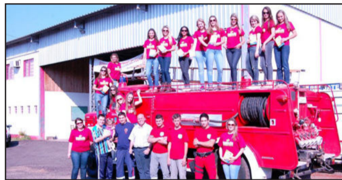
Diversas cidades da região receberam a visita da comissão e soberanas