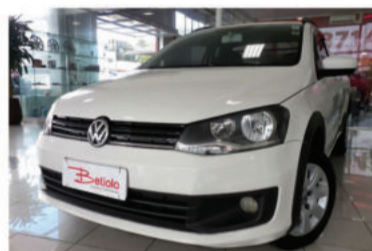
SAVEIRO TREND CE 1.6 MI 8V - 2014 Branco, 2 portas, Flex - IUL-1087.