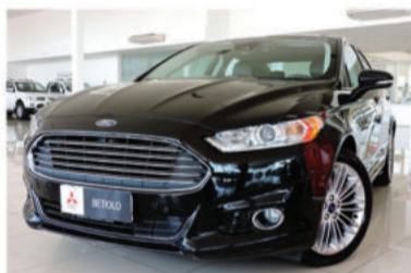
FUSION TITANIUM 2.0 ECOBOOST AWD - 2014 Preto, 4 portas, Automático, Gasolina - IVI-7503.