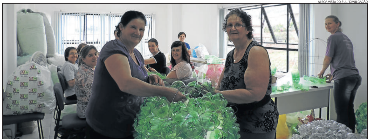
Grupo Fazendo Bonito já trabalha para confecção dos enfeites de natal