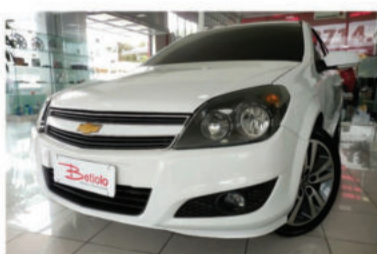
VECTRA GT 2.0 MPFI 8V - 2011 Branco, 4 portas, Flex - IRL-9554.