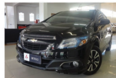
ONIX LT 1.4 MPFI 8V - 2013 Preto, 4 portas, Flex - IXX-3105.