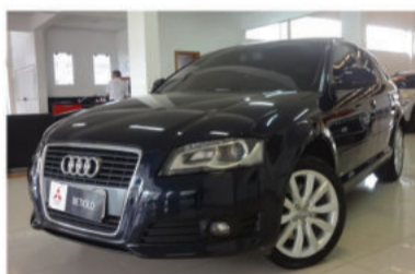
A3 SPORTBACK 2.0 16V TURBO - 2010 Azul, 4 portas, Gasolina - EMS-3447.