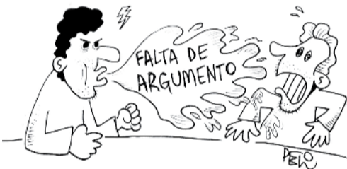
A MODA DO CUSPE