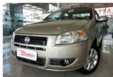
SIENA EL 1.4 - 2012 Bege, 4 portas, Flex - ISI-1433.