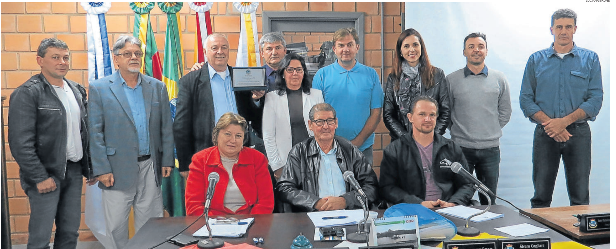
Homenagem foi feita pelos vereadores na sessão da Câmara de terça-feira, dia 26. IMIGRANTE > 3