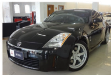
350Z 3.5 V6 24V - 2005 Preto, 2 portas, Gasolina, 40.000Km - FZK-0011.