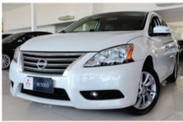
SENTRA SV 2.0 16V - 2014 Branco, 4 portas, Aut. / CVT, Flex - IVG-5966.