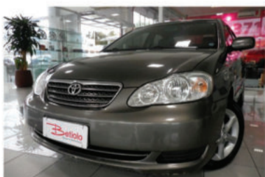
COROLLA XLI 1.8 16V - 2008 Cinza, 4 portas, Flex - DZB-0496.