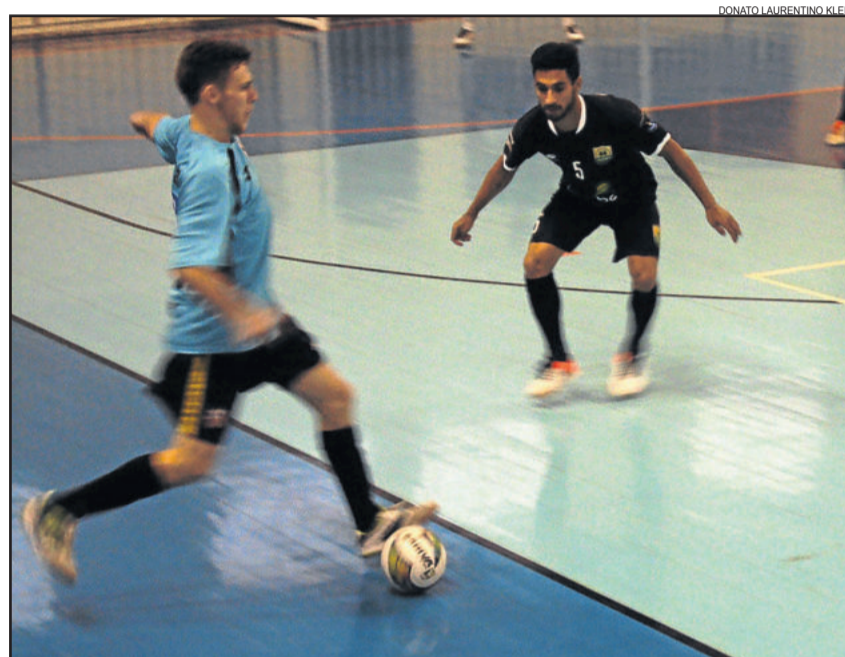
Vitória por 3x0 foi o penúltimo teste antes da estreia na Série Ouro

A direção da ASTF havia informado a realização de duas partidas amistosas diante da BGF de Bento Gonçalves. O jogo marcado para hoje, 30 de abril, em Teutônia está cancelado, por decisão da diretoria e da comissão técnica ao perceber o desgaste e o cansaço físico dos atletas. Somente um jogo deve ser realizado de forma amistosa entre as equipes. A princípio confirmado para o próximo sábado, dia 7 de maio, possivelmente em Bento Gonçalves.