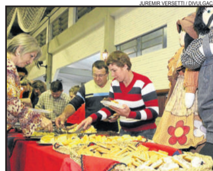
Evento resgata a cultura dos antepassados

A Associação Coral Vozes, de Imigrante, promove o Filó Italiano no dia 7 de maio (sábado), com início às 20 horas, tendo por local o Salão Paroquial de Daltro Filho. O evento tem o intuito de manter a tradições dos antepassados, promovendo um encontro de amigos, principalmente os