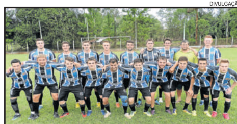
Esperança de Maratá tem um jogo a menos

O 2º turno da Copa Integração - Paverama, Brochier e Maratá - será aberto neste domingo, dia 1º de maio, com a disputa dos clássicos municipais, agora com mandos invertidos. Os duelos caseiros podem encaminhar vagas para a próxima fase da competição. A disputa entre Esperança x São Pedro, de Maratá, adiada em função do mau tempo no último feriadão, fica para o próximo dia 8 de maio.