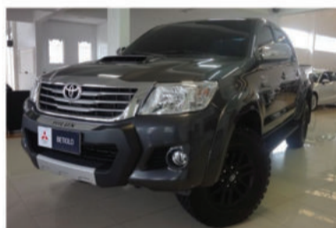
HILUX SRV 4X4 CABINE DUPLA 3.0 - 2015 Cinza, 4 portas, Automático, Diesel - IWC-4460.

*Promoção válida até o dia 31/05 ou enquanto durarem os estoques. Consulte o regulamento da promoção.