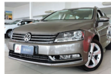
PASSAT VARIANT 2.0 TSI 16V 211CV - 2012 Marrom, 4 portas, Automático, Gasolina - ISL-4687.