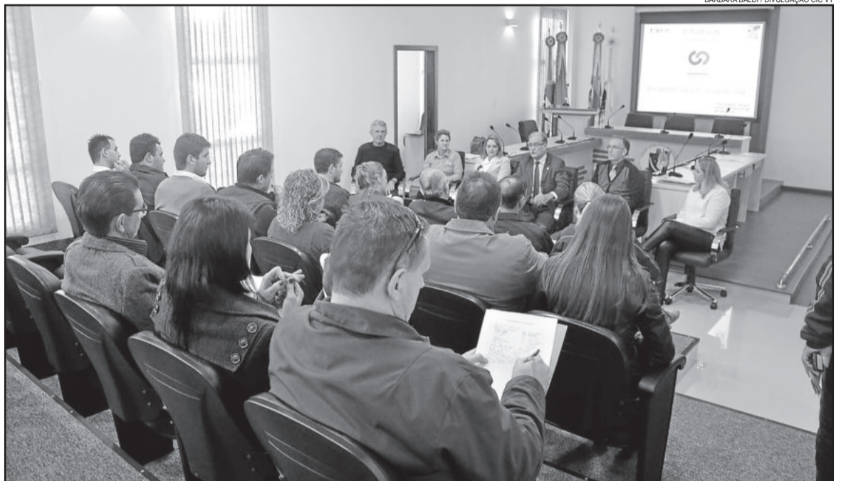
Melhorias na estrada entre Guaporé e Anta Gorda foram assuntos que marcaram a reunião da CIC VT