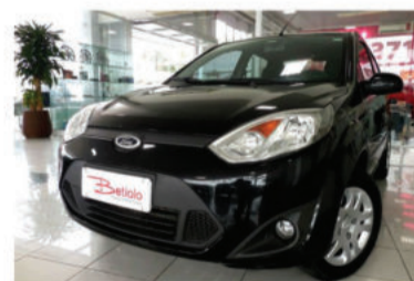
FIESTA CLASS 1.6 MPI 8V - 2012 Preto, 4 portas, Flex - ISX-9954.