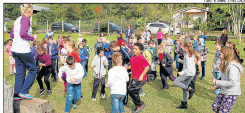
Dia do desafio deste ano será quarta-feira, dia 31