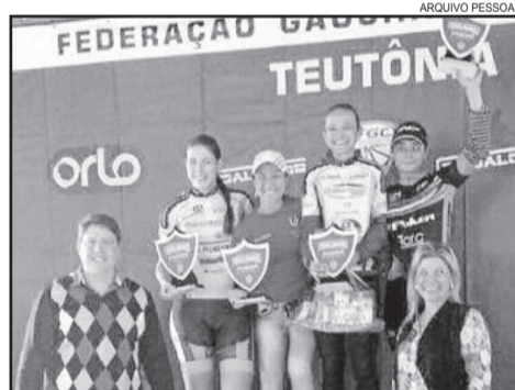
Vencedoras no Elite Feminino

A atleta ainda agradeceu o apoio da família e amigos e elogiou a organização do evento. “Foi motivadora pura. Parabéns a FGC e a Prefeitura Municipal de