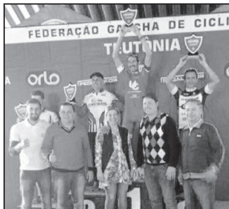
Birigui (c) foi o campeão na Categoria Master C

Sua filha e atleta, Priscila Corso, atual bicampeã estadual, também mostrou força na escalada em dire-