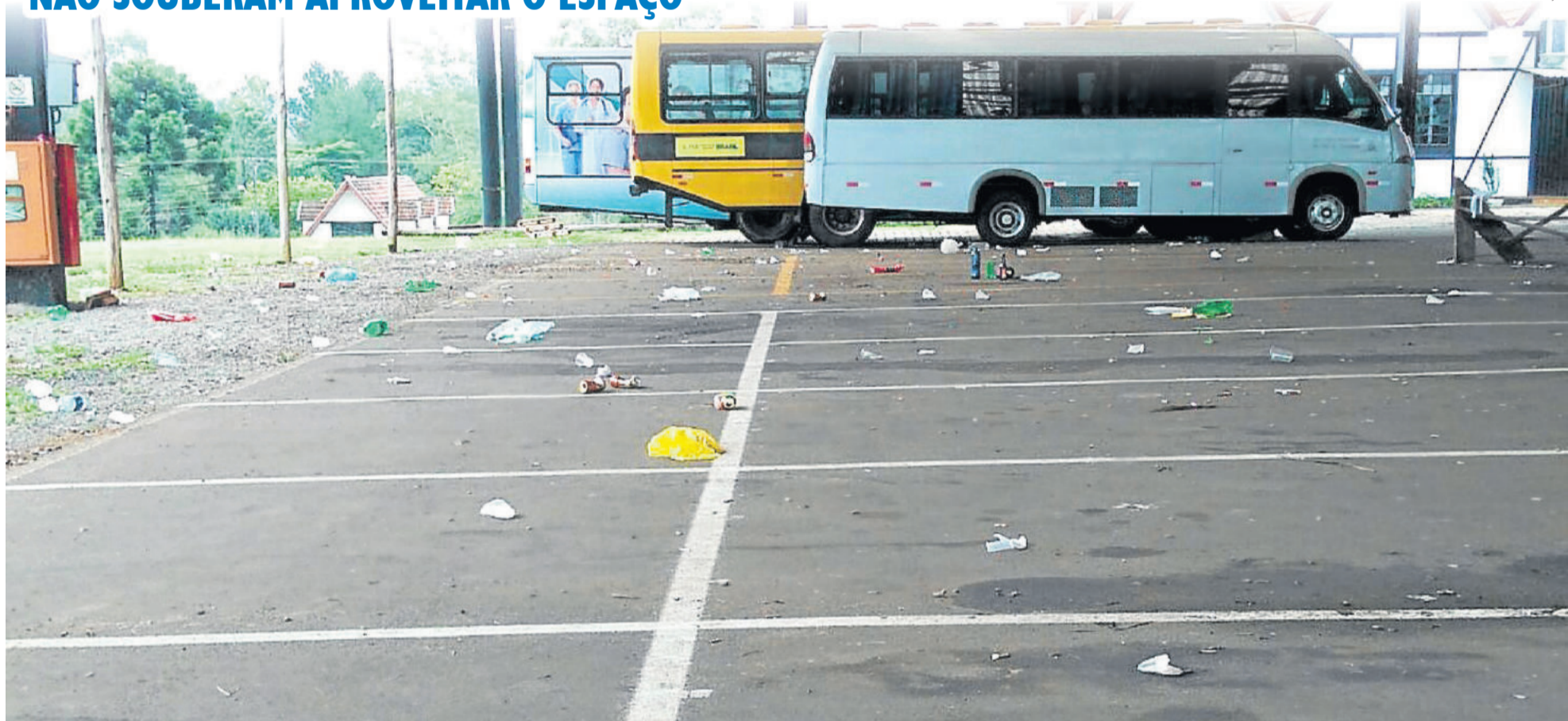
Redução de horário, limite de sinal de internet e aumento de vigilância serão atitudes após desrespeitos do último fim de semana. TEUTÔNIA > 4

Abertas inscrições para aulas gratuitas nos Núcleos de Cultura