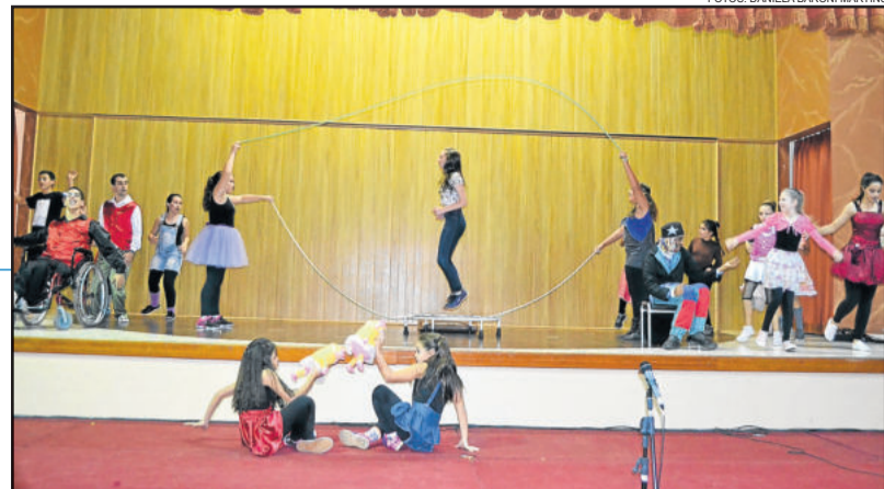
Danças e Ritmos do Cemef