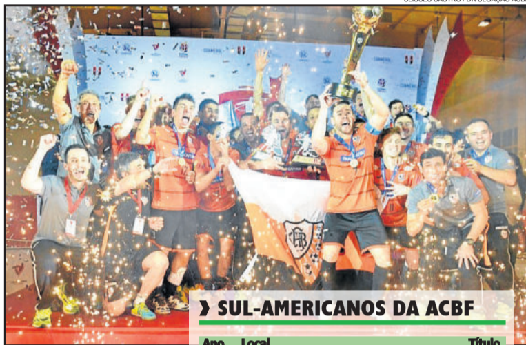
ACBF conquistou a Libertadores da América de Futsal