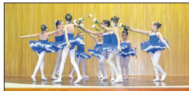
Ballet do Colégio Teutônia