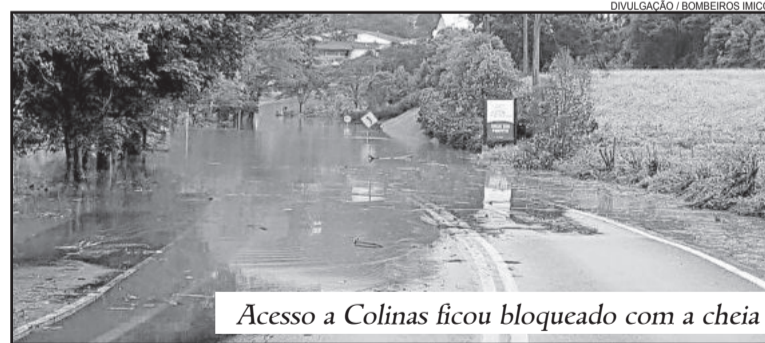
Acesso a Colinas ficou bloqueado com a cheia

Caso municípios queiram fazer doações de roupas, calçados, colchões, cobertores e alimentos, bem como rações para os cães, o local de entrega é o Parque do Imigrante, junto à base da Defesa Civil de Lajeado. Informações podem ser obtidas pelo fone 3982 1150.