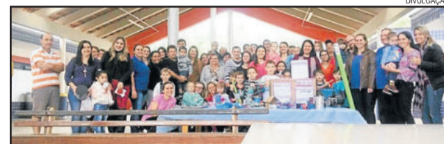
Atividade integrou a comunidade escolar

nâmicas para integrar as famílias. “A equipe da Proinfância Casa da Criança agradece a presença de todos nessa bela integração das famílias na escola”, destacou.