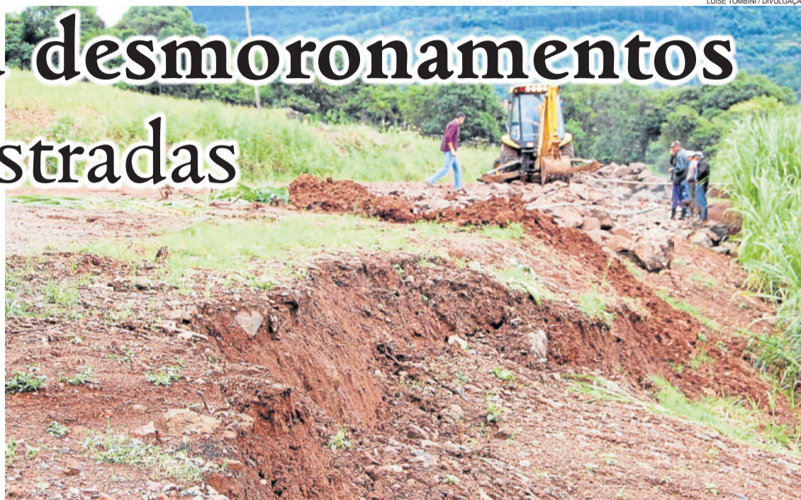
Desmoronamento ocorreu nas proximidades do Capitel Santo Antônio, em Vale da Harmonia

Os moradores podem comunicar a Secretaria de Obras e Mobilidade Urbana para comunicar sobre outros pontos que necessitem de manutenção decorrente, pelo telefone (51) 3754 1092.