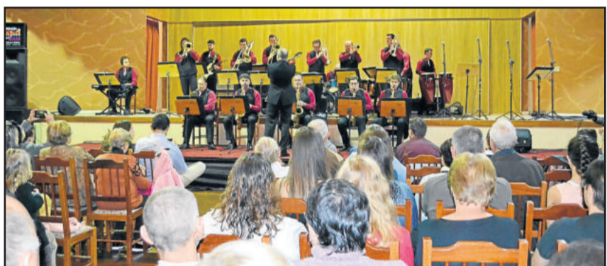
Orquestra de Teutônia