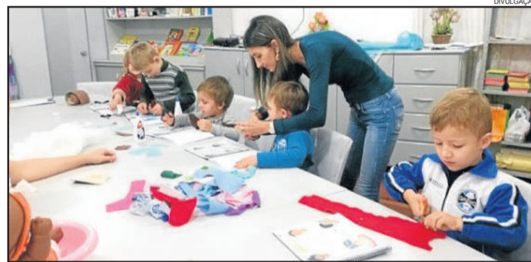
Crianças receberam livro de atividades com dicas de prevenção trabalhadas

Neste trabalho, cada criança recebeu um livro de atividades, que foi elaborado e personalizado com a ajuda das profissionais que acompanham o serviço, o qual se tornou um "livro sensorial" com todas as dicas de prevenção trabalhadas. O trabalho preventivo acerca deste tema é permanente nos diversos grupos de SCFV de crianças e adolescentes, bem como com suas famílias.