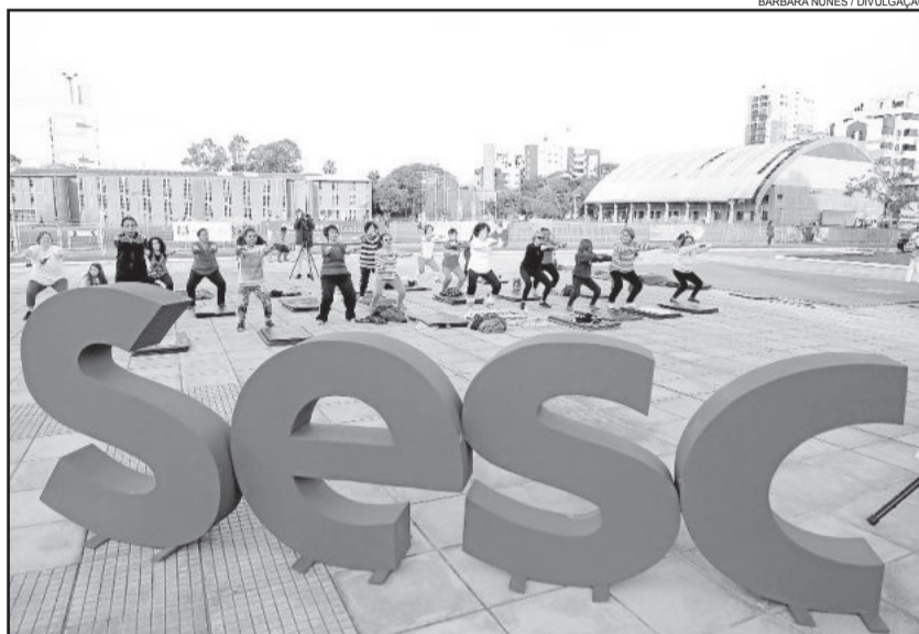
Proposta é fugir da rotina e praticar 15 minutos seguidos de uma atividade física

fundido mundialmente pela The Association For International Sport for All (TAFISA), entidade de promoção do esporte para todos, sediada na Alemanha. É uma campanha de incentivo à prática regular de atividades físicas em benefício da saúde.