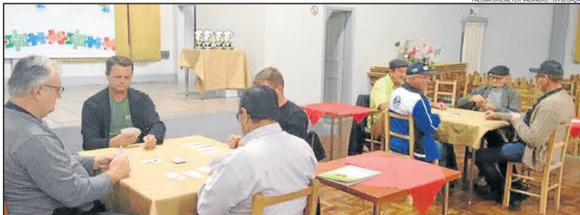
Campeonato mobilizou a comunidade westfaliana