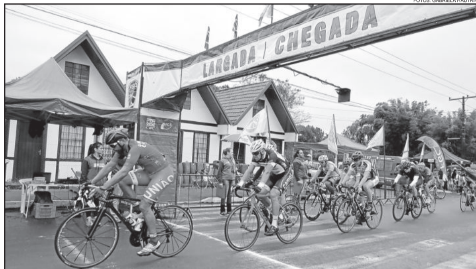
Provas contaram com a participação de atletas de todo o RS

Teutônia pelo grande evento, e aos atletas que deram um show. Fantástico, só quem foi pode descrever a emoção”, relatou. O foco agora, segundo Priscila, é a prova que será realizada na cidade de Encantadom no mês de junho. “Será também em duas etapas, escalada subindo a Lagoa de Garibaldi e um circuito na cidade”, explica a atleta.