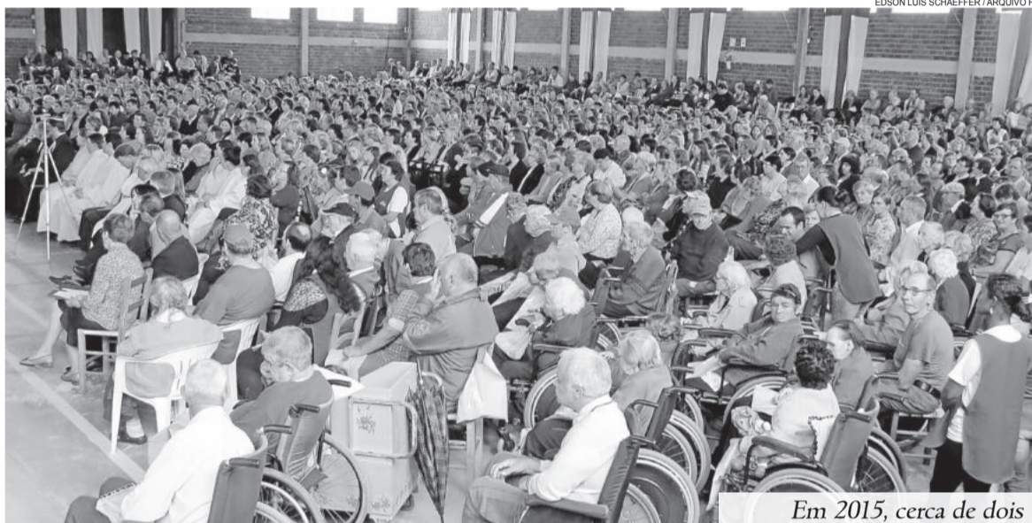
Em 2015, cerca de dois mil fiéis participaram do Dia Sinodal da Igreja

Após, às 14h30min, será realizado o lançamento da Campanha Vai e Vem 2017. “Essa é uma cam-