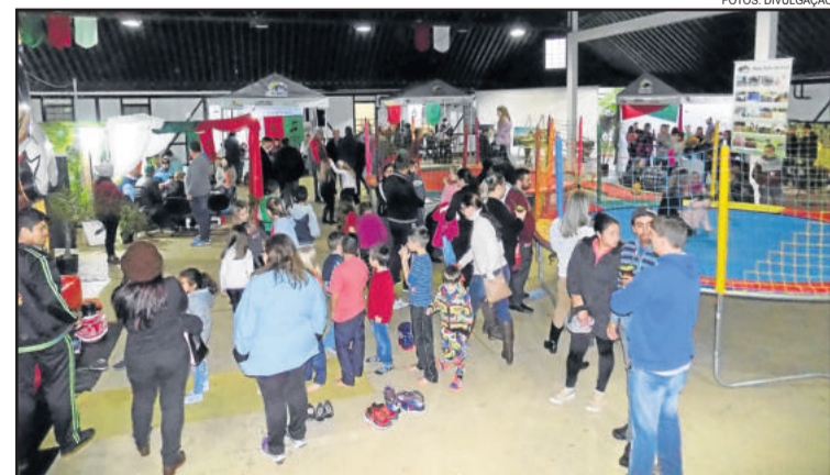
Público pode conferir diversos serviços