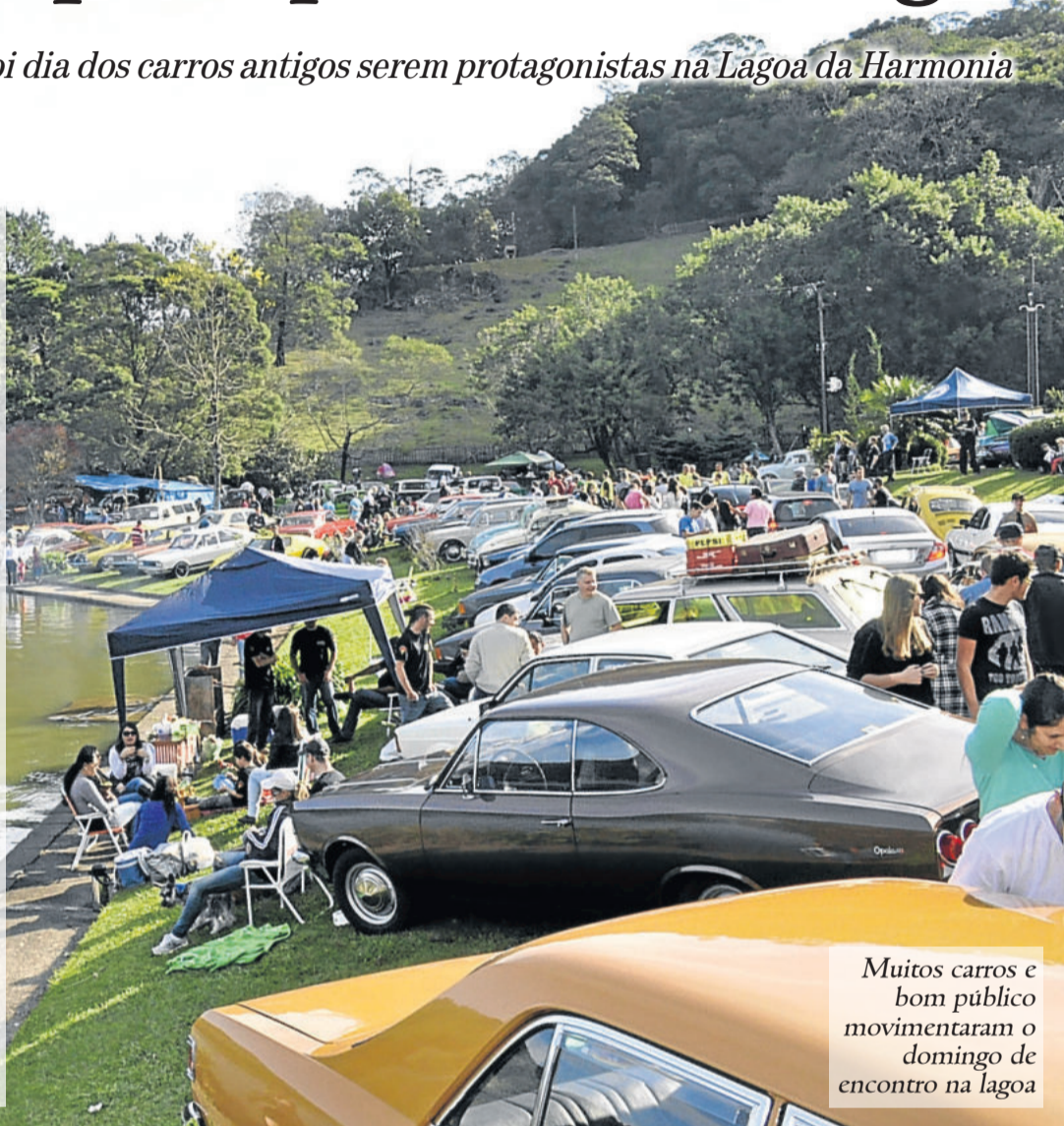
Muitos carros e bom público movimentaram o domingo de encontro na lagoa

A edição de 2015 é a segunda do encontro. A organização recebeu com alegria o sucesso do domingo e já planeja as ações futuras. “Cada ano vamos buscar melhorar os pontos fracos, que a gente vai avaliar com o grupo. E vamos continuar anualmente fazendo o evento”, conclui Haas.