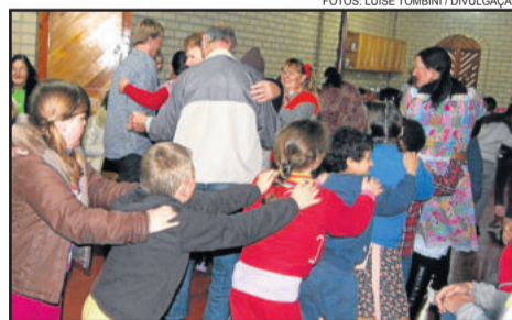
Integração foi realizada no dia 23

Nestes grupos participam crianças e adolescentes em situação de vulnerabilidade social, ou seja, fragilidade nos vínculos com a família e também com a sociedade. Eles são organizados em diferentes faixas etárias.