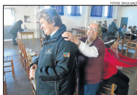
Dinâmica 'O cego e o anjo mudo'

Nós participamos com as danças 'Tango da Vitória', 'Street Dance' e 'Cristal e seus Bonecos' com a Turma Especial do CEMEF de dança; 'Rock Anos 60', dança integrativa com a turma de dança da Melhor Idade; e animamos o pessoal presente com a dinâmica de grupo 'O Cego e o Anjo Mudo' em dupla. No final dessa brincadeira, formou-se uma roda para que cada participante falasse o que sentiu, sendo cego ou mudo cuidador. As apresentações do CRAS de Paverama foram de canto, com instrumentos, e a professora também fez dinâmica de grupo. Para encerramento, cantamos o Parabéns para o grupo de PCD's do CRAS de Paverama e confraternizamos com um banquete de comes e bebes.