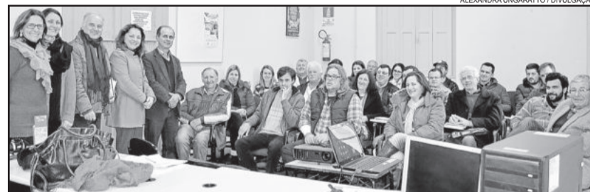
Produtores ecológicos estiveram reunidos no dia 24

O projeto está aberto a todos os interessados, incluindo produtores e proprietários de estabelecimentos que prezem pela alimentação ecológica, como lojas e restaurantes. A previsão de lançamento da rota é 2016.