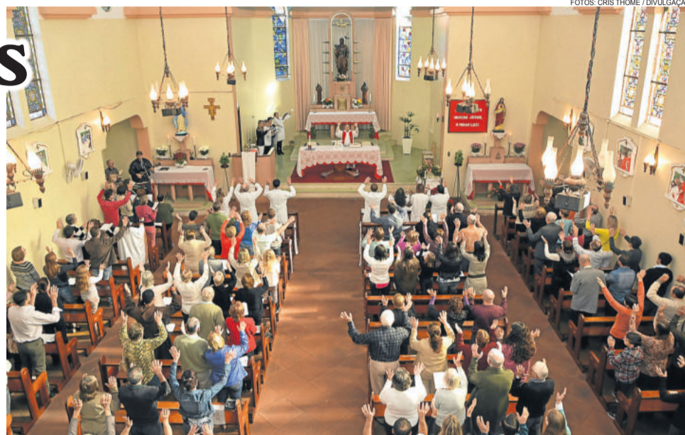
Procissão motorizada levou a imagem de São João Batista