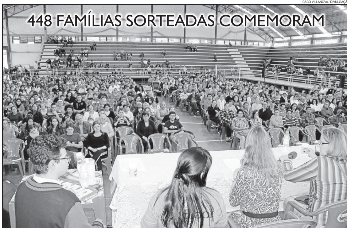
Ginásio lotado para o sorteio dos 448 apartamentos

Neste sábado, dia 27, mais uma etapa do processo de seleção das famílias que vão habitar os dois condomínios verticais, Novo Tempo I e II, realizou-se com organização e tranquilidade. Após a leitura do Edital, iniciou-se o sorteio dos 448 apartamentos. Emoção e alegria acompanharam a leitura dos nomes sorteados. A divulgação da lista, com os sorteados de hoje, ocorrerá nesta quarta-feira, dia 1º de agosto e, a partir dessa data, até o quarto dia útil, os recursos poderão ser encaminhados à Secretaria do Trabalho, Habitação e Assistência Social (Sthas).