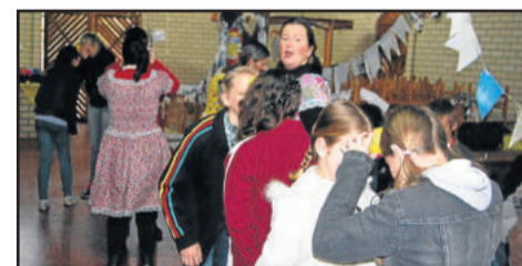
Meninas puderam fazer tranças