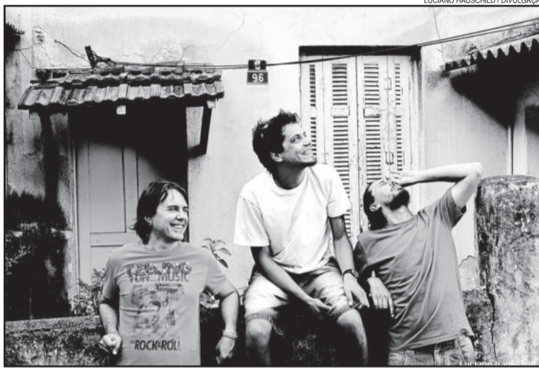
Maskavo fará show no dia 2 de outubro

No domingo (04), Leonardo Reis (voz e violão) se apresenta às 17h, seguido pelo grupo Vitrine Viva (pop-sertanejo), às 18h30. O destaque da noite será a banda Star Beetles - conhecida como um