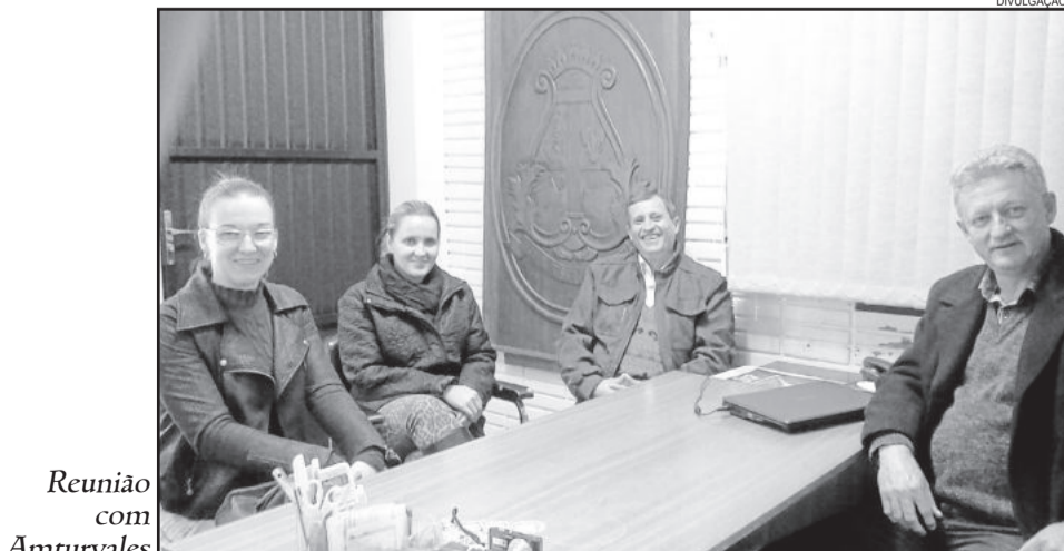
Reunião com Amturvales

Segundo os representantes da Amturvales, a entidade está empenhada em implantar um dos projetos mais importantes na área do turismo na região, que é o Projeto do Trem Turístico, oferecendo passeios no trajeto que interliga a região baixa e alta do Vale.