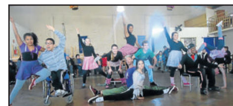
Danças Cristal e seus Bonecos, do CEMEF

Em nome do CEMEF e do Centro Cultural 25 de Julho, agradecemos pelo convite e parabenizamos pelo evento.