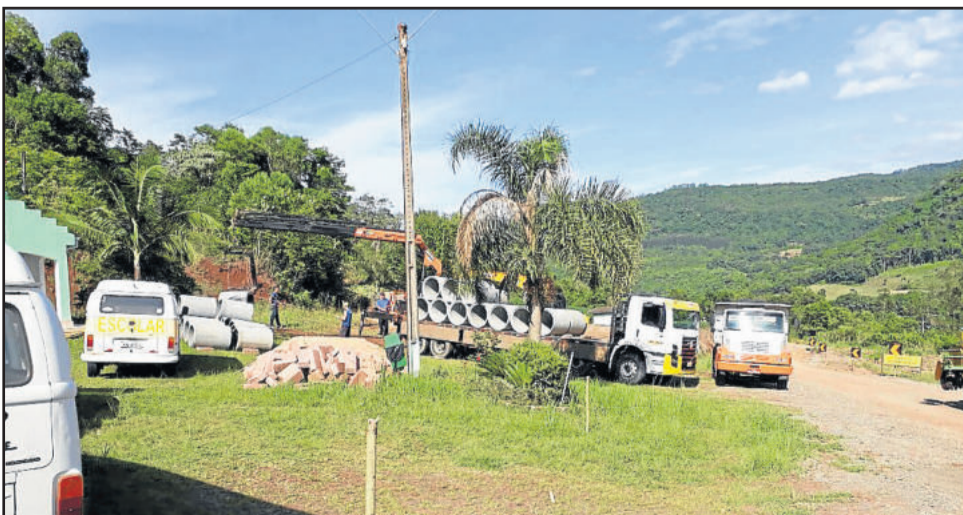
Trabalhos seguiram nesta segunda pela manhã

Os trabalhos de reestruturação do local iniciam pela canalização e questão de drenagem das águas.