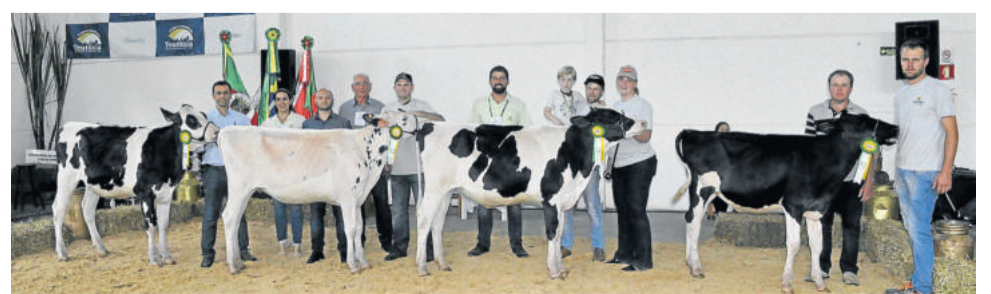
Vencedores do julgamento de terneiras