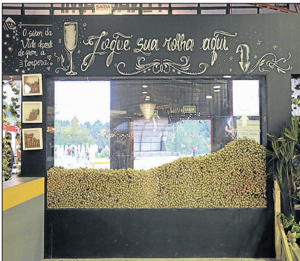
Foram abertas 30.500 garrafas de espumante durante os 15 dias de festa

O Sabrage Coletivo, que já integrou o Guinness Book, teve novo recorde de participantes em 2017. Neste ano, 388 pessoas participaram da ação. Em 2015, foram 365. O número de garrafas abertas em um golpe só em 2017 chegou a 380, sendo 222 por homens e 158 por mulheres. A divisão por categorias começou em 2015 e se repetiu neste ano, mostrando-se uma decisão acertada.