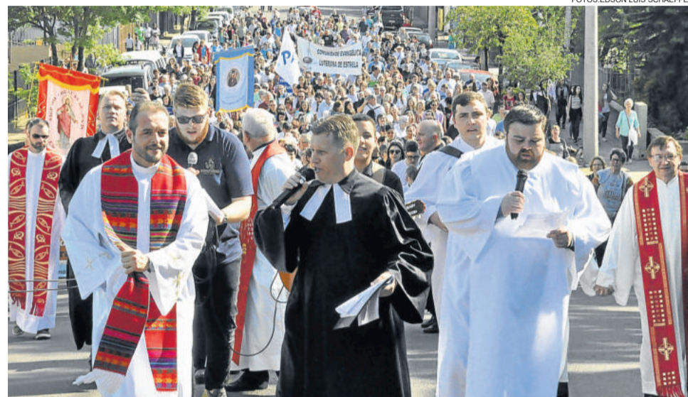
Católicos celebraram com os luteranos os 500 anos da Reforma em diversas cidades, como em Estrela no dia 1º de outubro

Segundo o bispo, junto com as alegrias a serem celebradas nas comemorações dos 500 anos da Reforma, se faz necessário também o reconhecimento das dores causadas mutuamente e a manifestação do pedido de perdão que luteranos e católicos devem uns aos outros. “Este pedido já foi manifestado oficialmente,