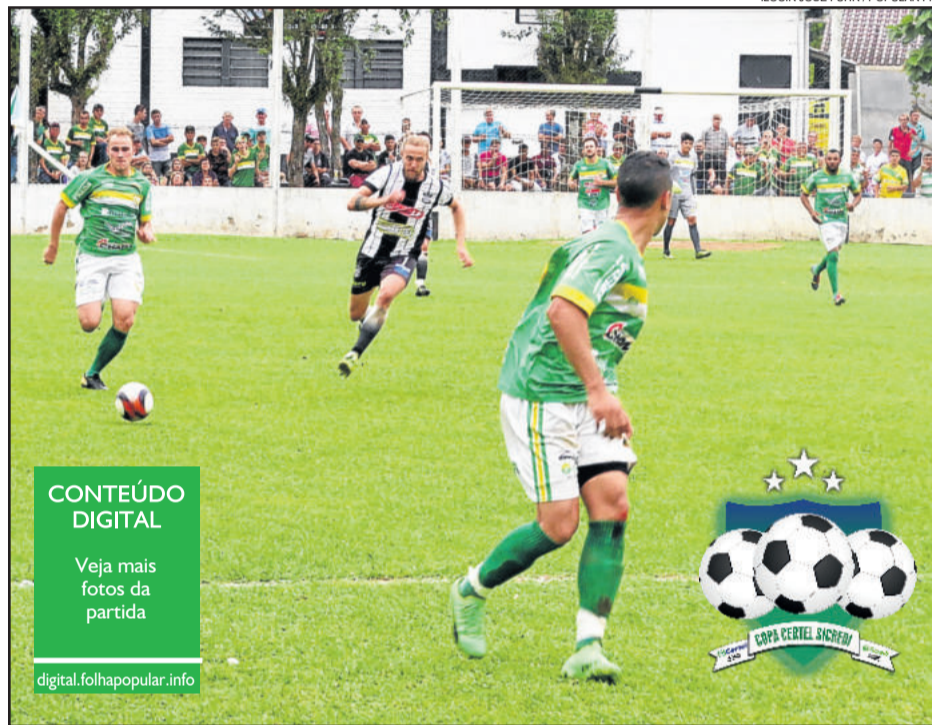
Palanque e ECAS fizeram bom jogo, que terminou empatado em 1 a 1

Após o meio-campo Fininho ser expulso, o Ecas tratou de se defender e o Palanque aumentou seu ímpeto ofensivo, criando chances para avançar no placar. Contudo, o escore não foi alterado. Final: Ecas 1x1 Palanque.