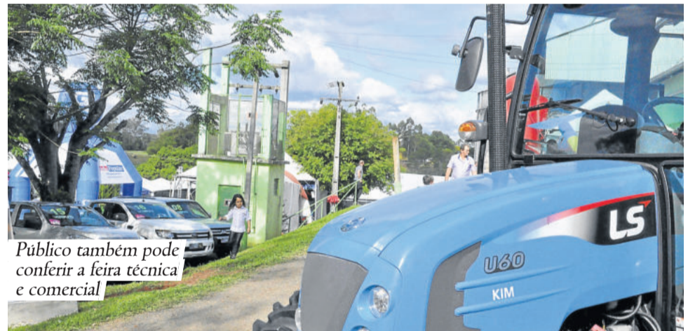
Público também pode conferir a feira técnica e comercial