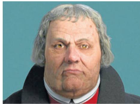
Reconstrução em 3D do rosto de Lutero, feita a partir da máscara mortuária do reformador

Outra marca importante da Reforma é a valorização da mulher. Lutero pregou sobre a igualdade perante Deus. Isso fez com que as mulheres se sentissem importantes e, apesar da submissão, elas não se calam e passaram a manifestar publicamente a sua fé.