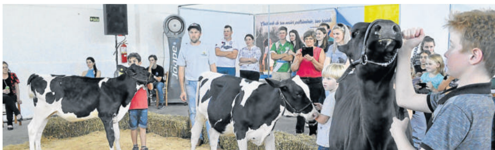
O melhor jovem puxador também foi escolhido durante o julgamento das terneiras