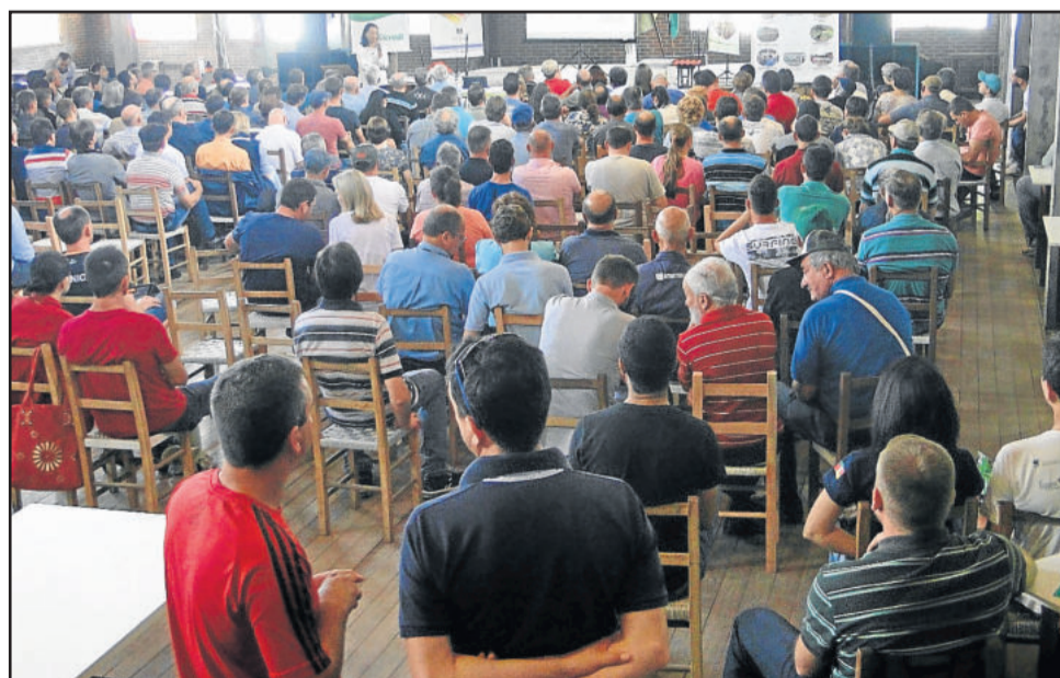
Cerca de 300 pessoas prestigiaram o seminário em Arroio do Meio

Sobre a florada, cita que é preciso observar itens como, qual é a florada principal, quanto tempo dura essa florada e questões referentes ao clima, enfatizando que o aprendizado é constante. Sobre manejo, defendeu que as colmeias com gavetas são as mais apropriadas. Abordou ainda o manejo de algumas variedades, citando a Guaraípo, Mandaçaia e a Jataí, que é uma abelha poderosa, com uma grande capacidade de produzir mel a qual se adapta bem em gavetas. Sobre a Mandaçaia, falou que esta espécie é de fácil manejo, e a exemplo da Jataí também é boa produtora de mel.