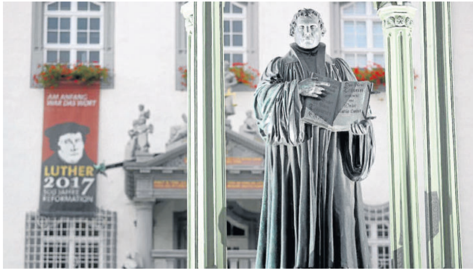
Memorial para Lutero em Wittenberg

> Influências ainda hoje: “Penso que, atualmente, temos muitas coisas que são frutos da Reforma Luterana e de movimentos que surgiram a partir da Reforma. Ela influenciou no modo de pensar e de agir de muitos países. No Brasil, a Igreja Luterana tem 1 milhão de membros e por isso não influencia tão