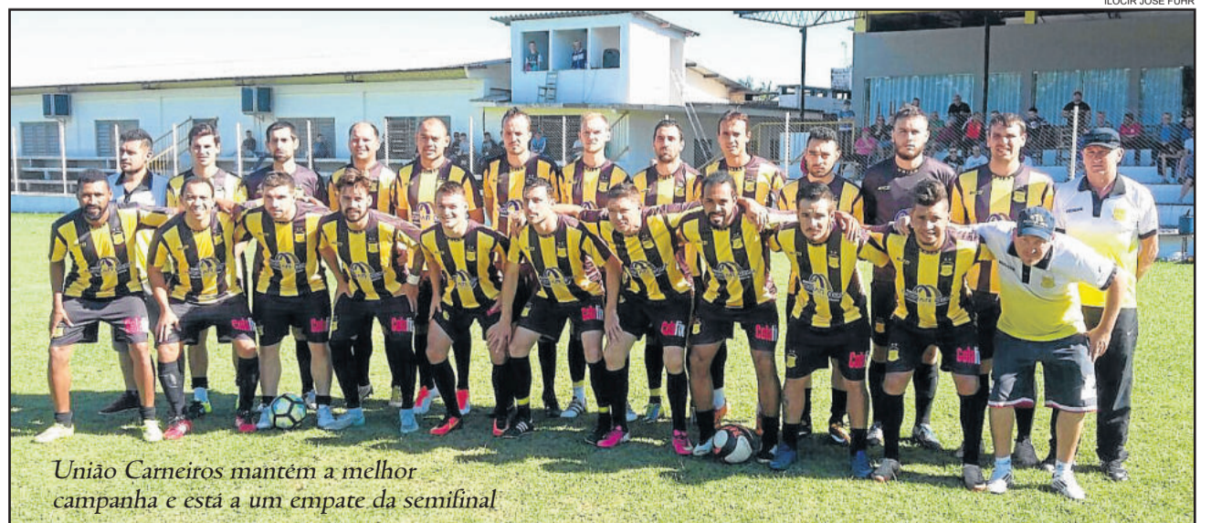
União Carneiros mantém a melhor campanha e está a um empate da semifinal