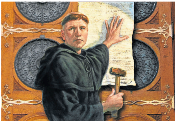
Reprodução de Lutero pregando as 95 teses

> Modo de celebrar: "As celebrações na época eram em latim, uma língua que ninguém entendia. Era o cumprimento de um rito que não se compreendia. Lutero, então traduz, a bíblia para a linguagem do povo. Ele não só traduz a bíblia, mas, também, a celebração, as músicas, para que as pessoas entendam na sua própria língua, para praticar aquilo que é pregado."