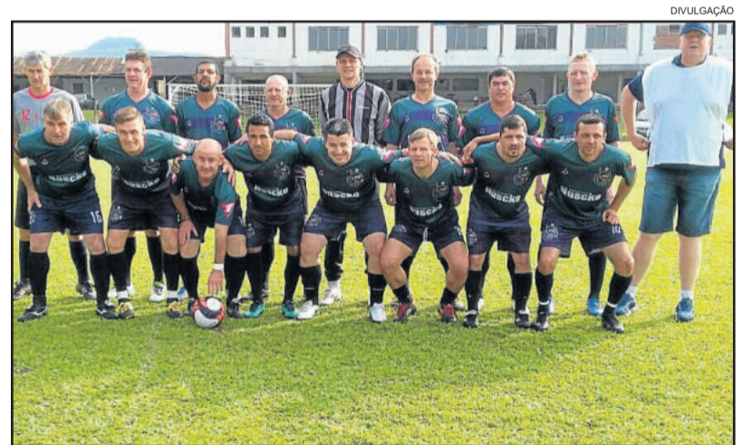
Gaúcho de Teutônia conquistou vaga às semifinais

Na manhã deste domingo (29/10), foram disputados os outros três jogos de volta. Em Teutônia, o Juventude foi eliminado pelo Pinheiros de Taquari, que venceu a partida por 2 a 1. Em Venâncio Aires, a ASSESPE confirmou sua classificação ao vencer o Arroio Alegrense por 3 a 0. E em Encantado, o União de Palmas superou o Estudiantes novamente por 1 a 0, garantindo a melhor campanha para a semifinal.