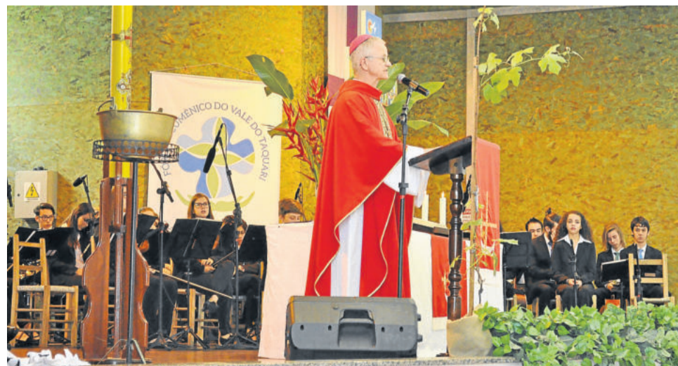
Bispo dom Aloísio Dilli

Dilli deseja que a divisão que havia aos poucos vá se transformando em união. “As pedras que no passado jogávamos uns contra os outros ou que serviram para erguer muros de separação entre nós, sejam agora usadas para erguer a casa comum que nos faça chegar à celebração conjunta da plena comunhão, ao redor da mesma mesa. Que a Trindade Santíssima, modelo de comunhão perfeita, seja nossa inspiração na busca conjunta para chegarmos à unidade de todos os cristãos, tão desejada por Deus e por todos nós. Agradecemos aos irmãos luteranos pelo convite de podermos celebrar juntos 500 anos, não de separação, mas de sermos agraciados juntos neste momento histórico”, destaca.