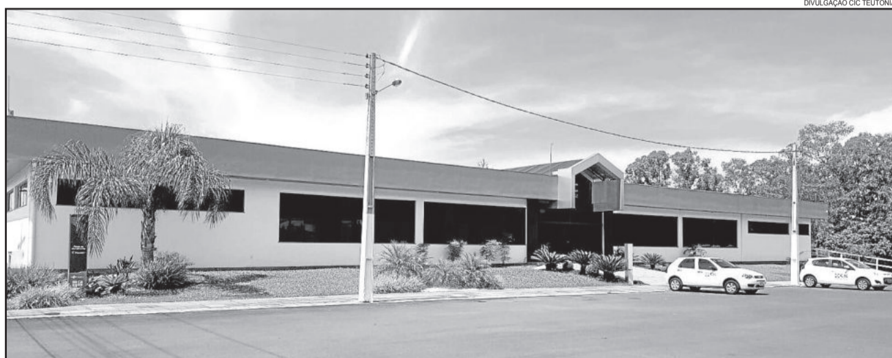
“A Casa do Empresário”, como é reconhecida a CIC Teutônia pelos seus associados, é referência regional e estadual em atuação

Desses associados, 268 (53,5%) são do ramo do comércio, 163 (32,53%) de serviços e 70 (13,97%) da indústria.