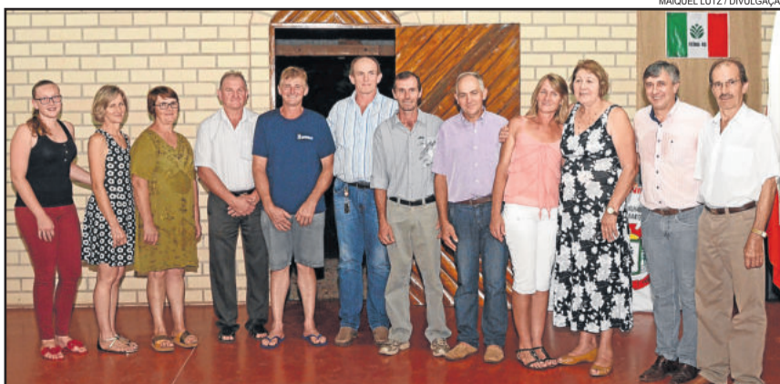
Nova diretoria foi empossada na noite da terça-feira, dia 29

tações, treinamentos e a missão de representar a entidade em nível regional e estadual. “Este será o foco mais importante, para poder avançar nas necessidades dos agricultores do Vale”, explica. Da mesma forma, prosseguirá auxiliando a unidade de Imigrante.