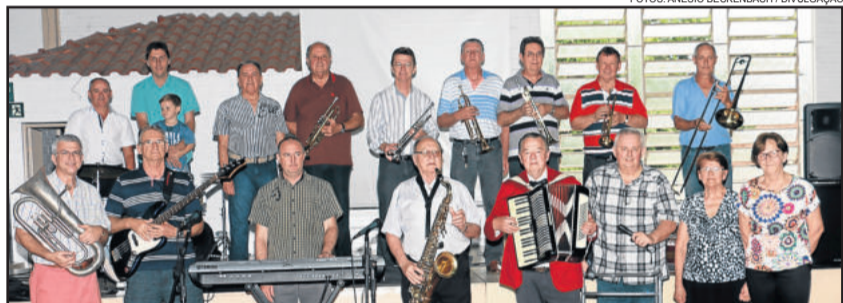
Encontro da Banda Maringá ocorreu no sábado

Histórias e momentos marcantes foram relembrados por um grupo de 30 ex-alunos do Colégio Teutônia, que se reencontraram na manhã de sábado, dia 26 de dezembro, após 20 anos. A maioria deles se formou Técnico em Agropecuária. Outros seguiram pela Contabilidade. Grande parte concluiu o então 2º Grau (Ensino Médio) e o Curso Técnico no Colégio Teu-