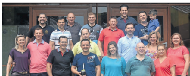
Alguns se reencontraram após 20 anos