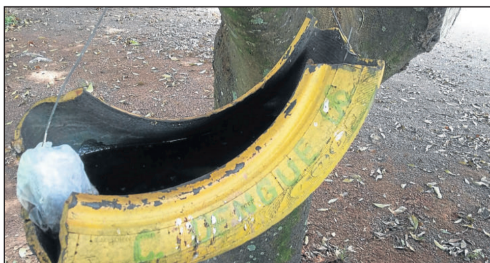
Armadilha onde foram encontradas as larvas

É importante ressaltar que a única forma de se contaminar é através da picada do mosquito. Ao realizar limpeza em recipientes com larvas, não há perigo de contaminação, segundo Cardoso. A equipe da Visa mantém a população teutoniense em alerta e trabalha intensamente para que não surjam mais focos da larva ou casos de doenças provocados pelo mosquito Aedes Aegypti , como por exemplo: Dengue, Zika Vírus e Chikungunya.