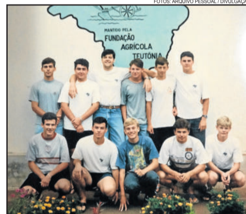
Alguns integrantes da turma em 1995