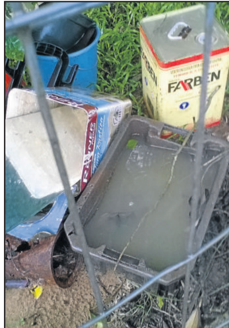
Água acumulada em terreno vazio

grandes recipientes, e que na maioria das vezes não recebem os cuidados necessários e ficam abertos, tornando-se um local apropriado para o mosquito.