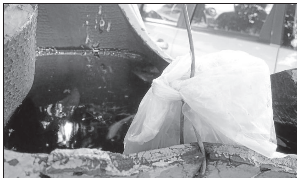
Locais úmidos e com sombra são propícios para criação de larvas