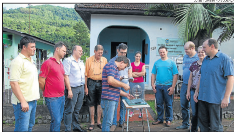
Sorteios das Campanhas de Incentivo à Arrecadação Fiscal e Produção Primária foram realizados ontem, dia 30

Mais informações podem ser obtidas junto à Secretaria ou pelo telefone (51) 3754 1001, em horário de expediente.