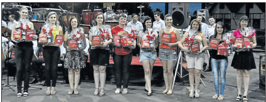
Representantes de empresas vencedoras da Campanha 'Neste Natal, Deixe sua Vitrine Legal'