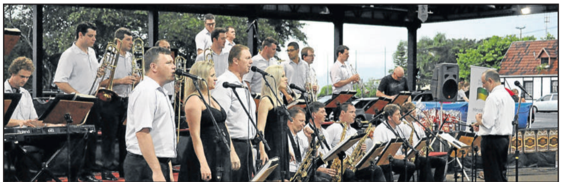
Orquestra Municipal de Teutônia se apresentou na noite do evento

Junto com a Campanha Nota Fiscal dá Prêmios aconteceu a Campanha "Neste Natal Deixe sua Vitrine Legal", com o objetivo de incentivar o comércio a decorar seus estabelecimentos e embelezar a cidade. Entre 40 empresas, os jurados avaliaram o capricho, decoração e criatividade dos participantes e premiaram as 10 melhores, entregando um certificado de empresa destaque e uma cesta de Natal para cada representante. As empresas vencedoras foram: Bella Luna Aromas; Agrocenter Languiru, do Bairro Languiru; Supermercado Languiru também do Bairro Languiru; Cristal Jóias; Natural Center - Produtos Naturais; Ótica Lauro do Bairro Canabarro; Loja Motivos; Telsoni; Teutoluz e Wessel Material de Escritório, do Bairro Languiru.