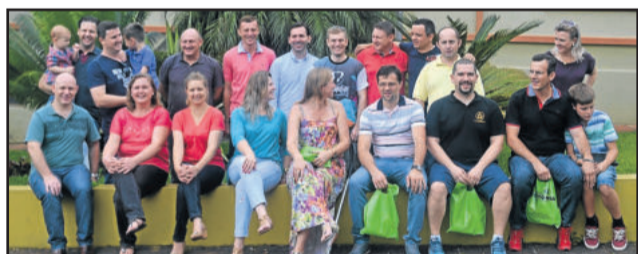
Primeiro encontro foi no Colégio Teutônia

Sorrisos, lágrimas, abraços e emoção também fizeram parte deste encontro que iniciou com visita ao Colégio Teutônia na manhã de sábado. Quem não passou pelo educandário desde então percebeu a transformação da estrutura; ficaram im-