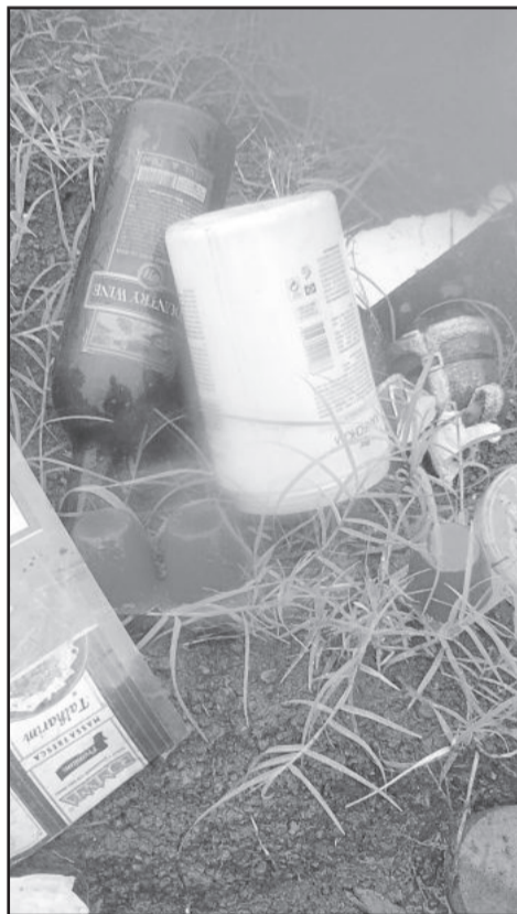
Lixo encontrado próximo ao local das larvas na Rua Duque de Caxias

Outro grande problema, segundo Cardoso, é em casas onde moradores costumam armazenar água da chuva em