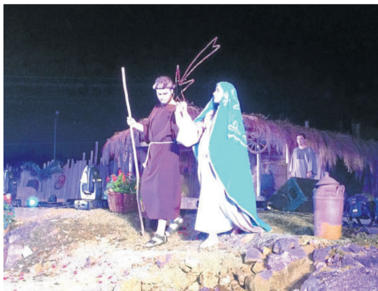
Teatro contou a história do nascimento de Jesus