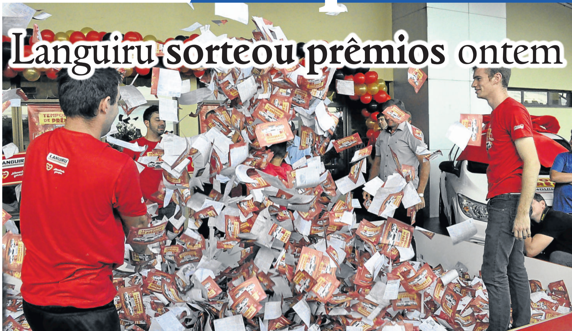
Segundo sorteio foi realizado ontem. Onyx foi para Arroio do Meio e Montana sai para Estrela. TEUTÔNIA > 2

PRESENÇA DE LARVAS MANTÉM VISA EM ALERTA