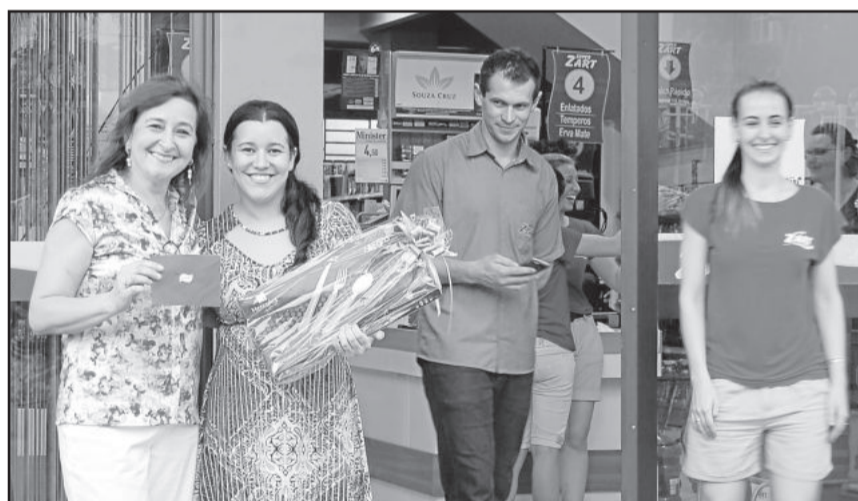
Equipe do Zart também proporcionou brindes aos clientes presentes ao sorteio

Durante a realização do sorteio de prêmios, diante do Super Zart de Languiru, os clientes presentes também foram agraciados com brindes oferecidos pelo supermercado em parceria com fornecedores.