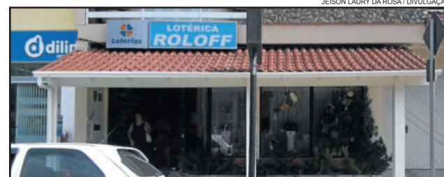
Lotérica Roloff, anexo a Loja Neko Calçados