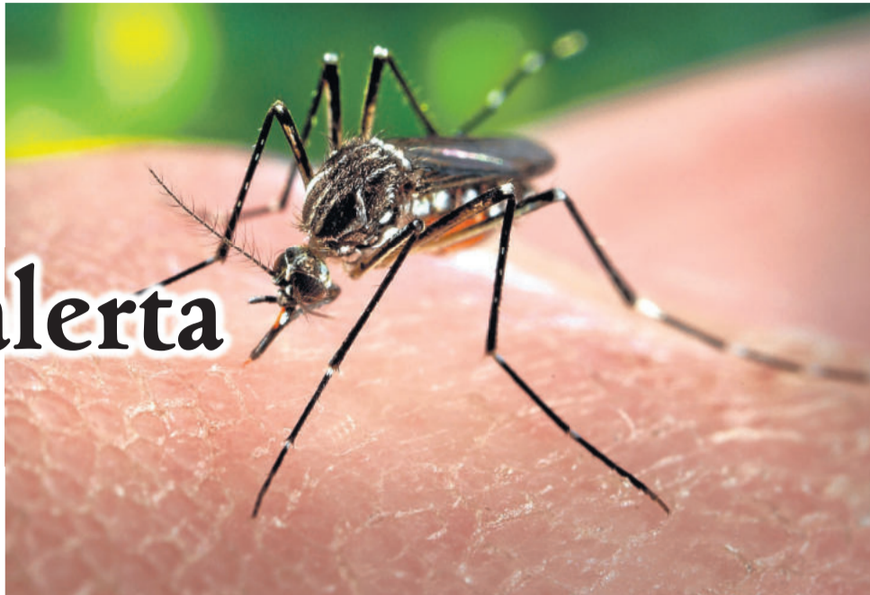
Mosquito Aedes Aegypti é transmissor de três doenças principais