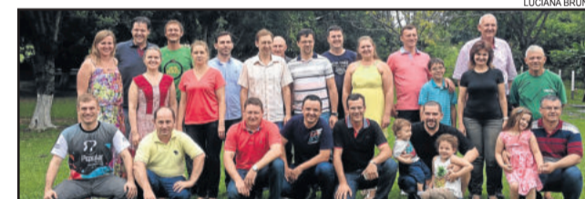
Famílias dos ex-alunos se reuniram na Associação de Funcionários da Languiru