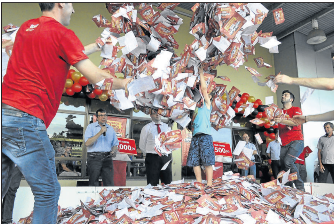
Mais de 1 milhão de cautelas participaram da promoção

A cada R$ 70,00 em compras nos Supermercados Languiru, nas lojas Agrocenter Languiru, nos Postos de Combustíveis Languiru, no Frigorífico de Aves (somente pessoa física) e na Fábrica de Rações (somente pessoa física), o cliente recebeu uma cautela para concorrer aos prêmios. No cupom, além de preencher os dados pessoais, o cliente assinava a resposta para a pergunta "Quantos anos a Languiru completa em 2015?".