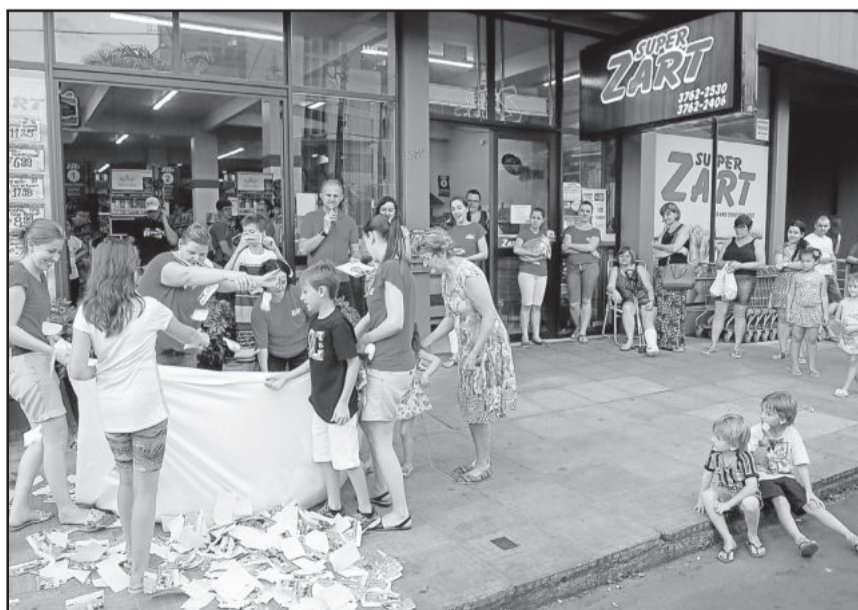
Super Zart sorteou 16 prêmios nesta segunda-feira