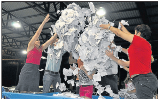
Mais de 900 cautelas participaram do sorteio