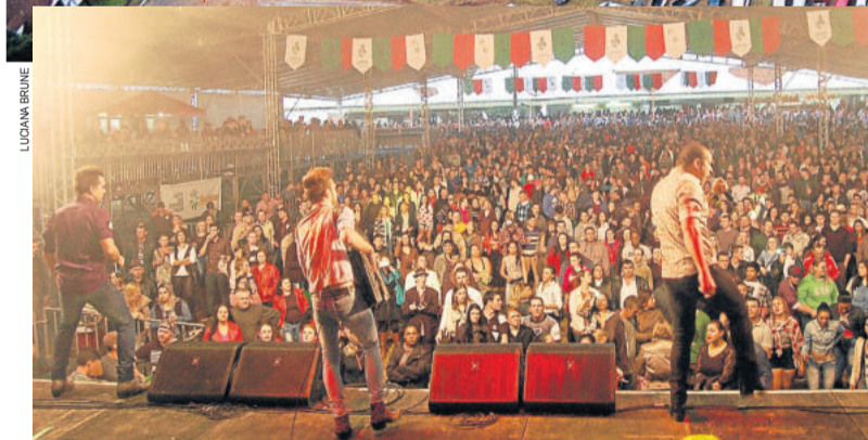
Apesar de não atingir o público projetado, organização avaliou evento com positividade. No domingo, Festa da Família (foto ao lado) lotou a arena de shows. TEUTÔNIA > 8 A 17

TRABALHO VOLUNTÁRIO NA BILHETERIA BENEFICIARÁ ENTIDADES