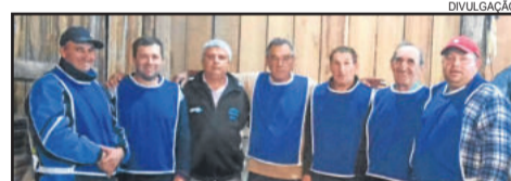
Cabriúva venceu e se classificou para as semifinais do municipal de bocha

foi disputada ponto a ponto. Após, os donos da casa assumiram as atitudes da partida, vencendo por 48 x 28.