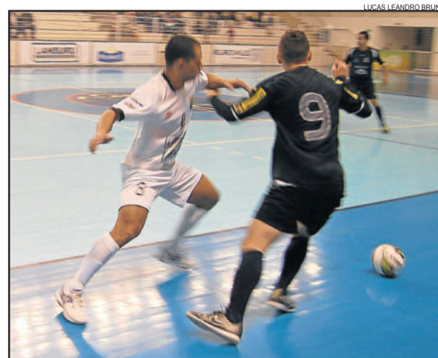
ASTF tentará a reabilitação em Santa Cruz, dia 6