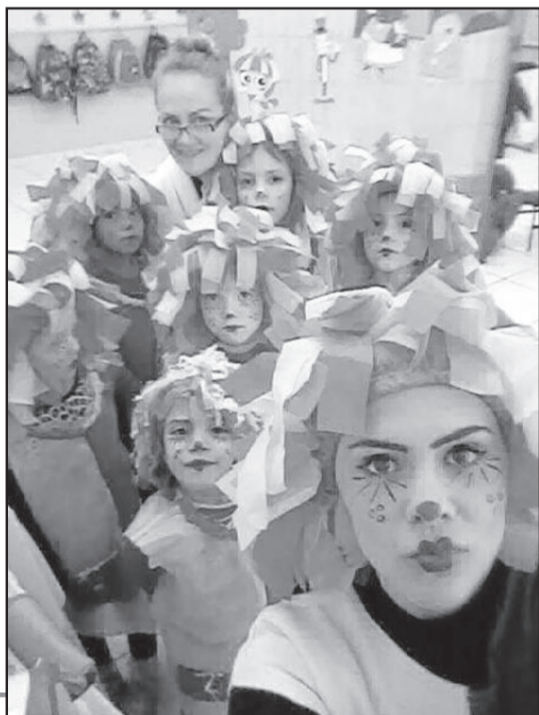
Sítio do Picapau Amarelo foi trabalhado por alunos do 1º ano da tarde

tão importante em um turno inverso ao da escola de origem, nas vivências das crianças em geral. Os demais grupos também estão realizando atividades com seu clássico e, além de ampliar seus conhecimentos, estão tendo momentos de entretenimento, além de aprendizagens de atitudes e procedimentos de práticas da paz, importantes na sociedade atual.