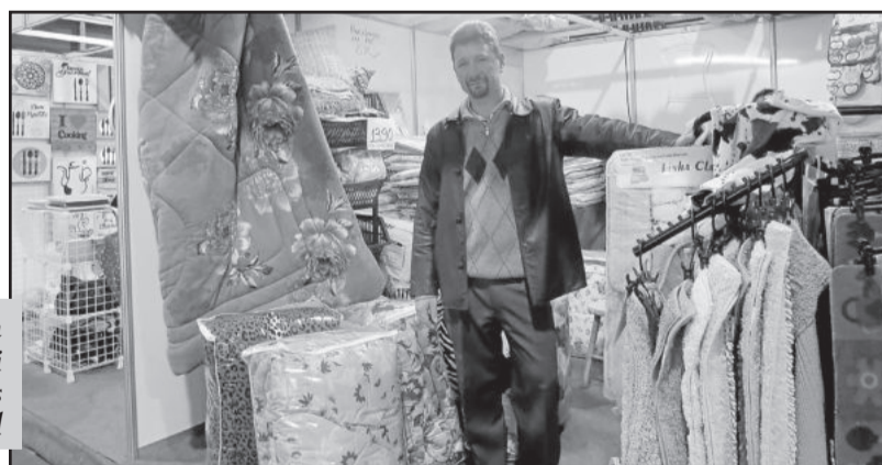
Loja Gabbati de Caxias do Sul