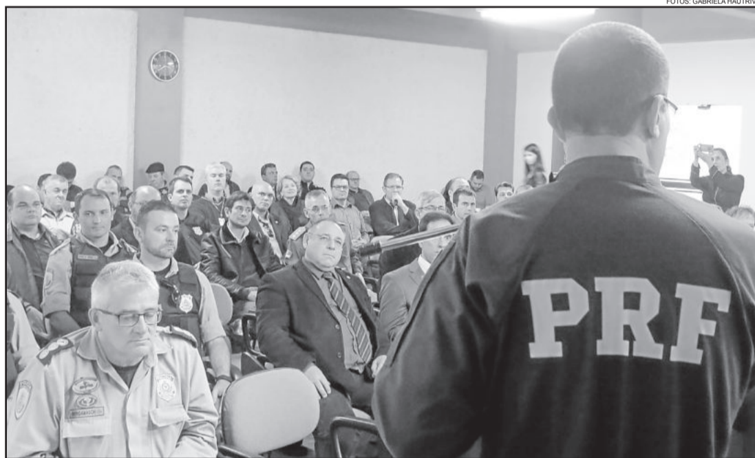
Autoridades policiais da região marcaram presença na cerimônia