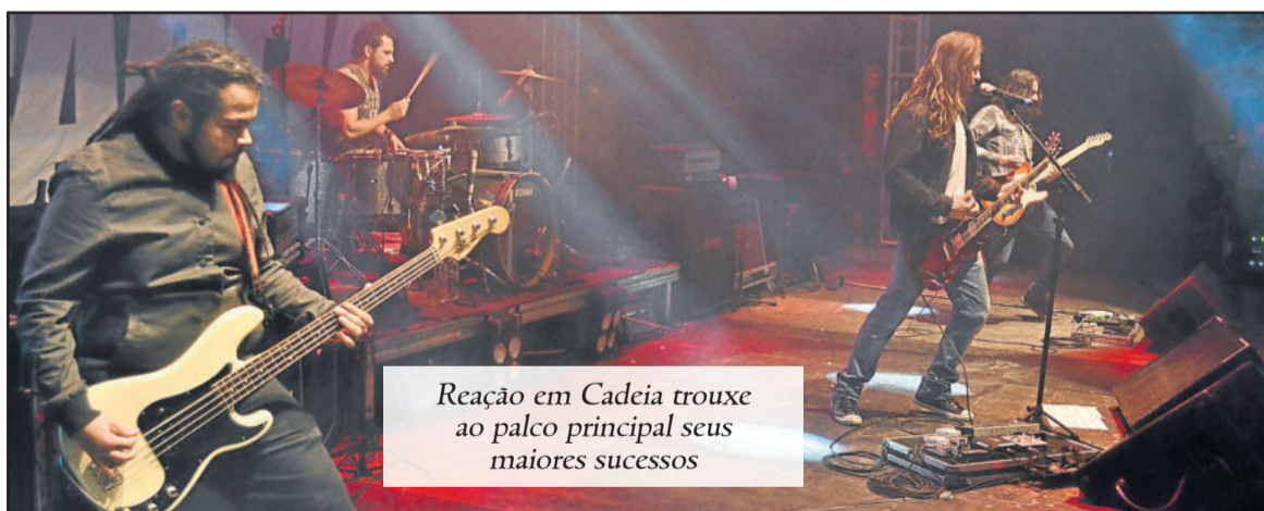
Reação em Cadeia trouxe ao palco principal seus maiores sucessos