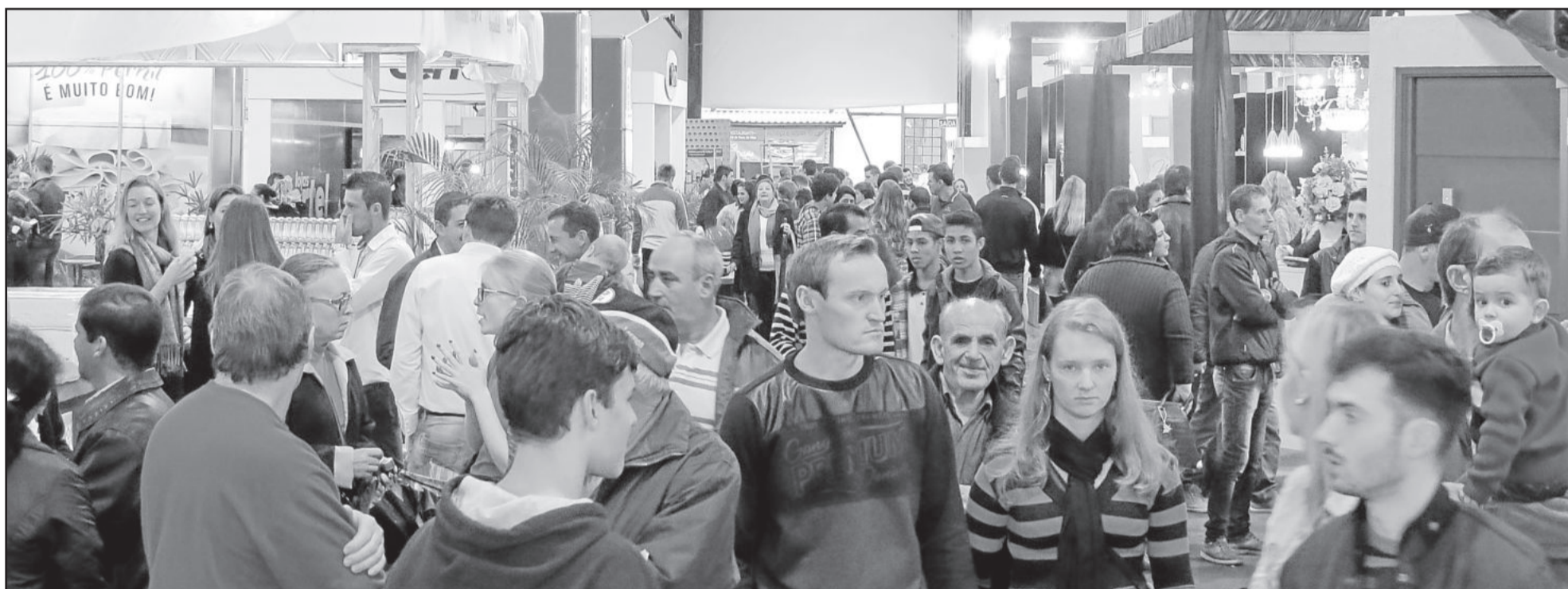
No domingo, área dos expositores também ficou lotada

Expositores de fora esperavam vender mais. CIC realiza pesquisa e deve divulgar resultados para os expositores