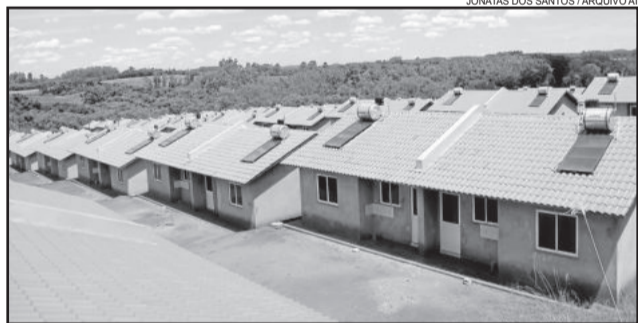
Beneficiários vão escolher as casas do Nova Morada