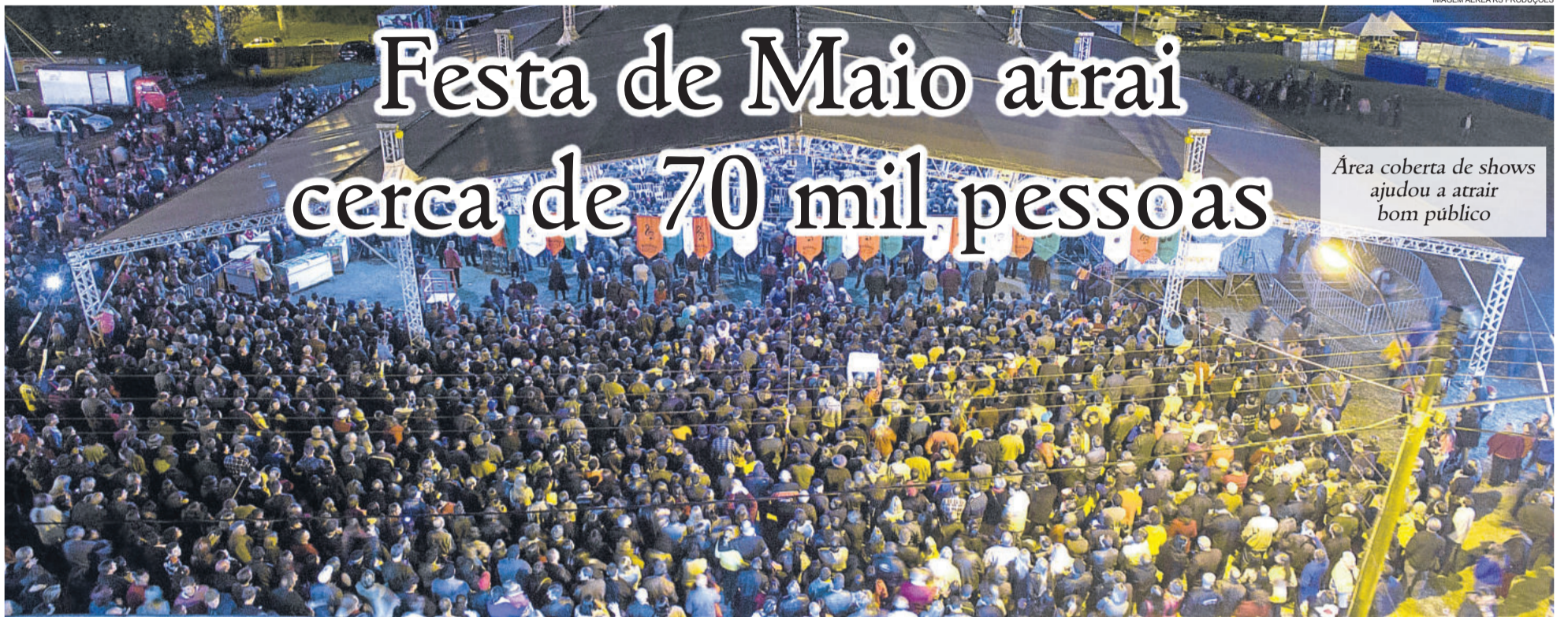
IMAGEM AÉREA RS PRODUÇÕES

Área coberta de shows ajudou a atrair bom público