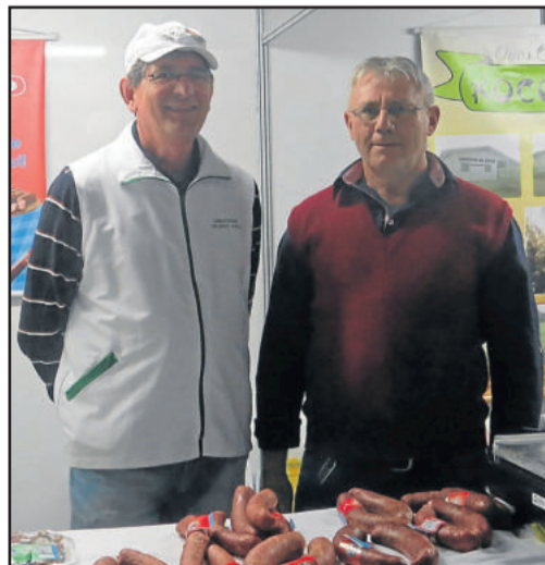
Expositores da Kolonie Haus