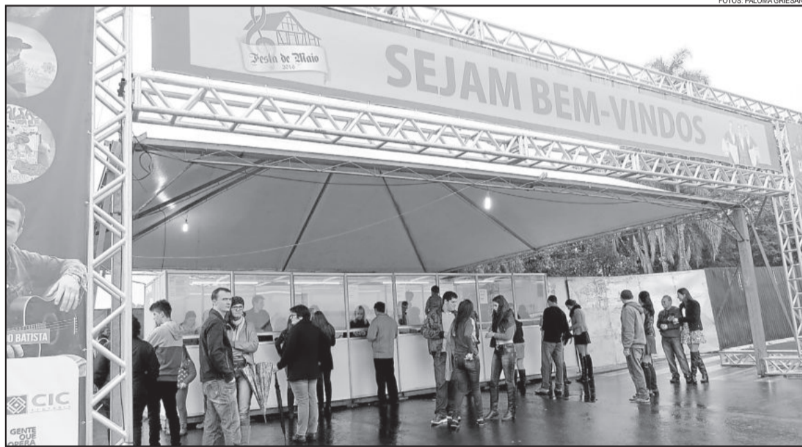
Coordenação da logística da bilheteria foi feita pelo Rotary Clube