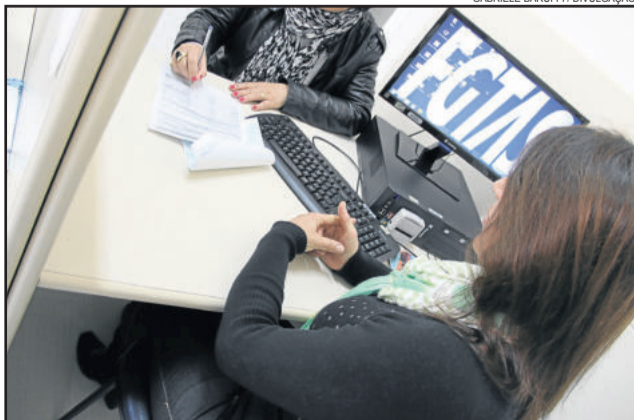
Sine estará fechado em virtude de uma convocação para treinamento