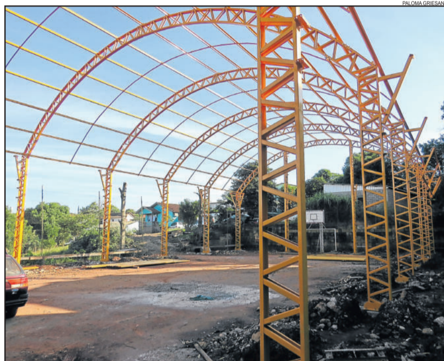
Estrutura da quadra coberta começa a ganhar forma

A última ação realizada foi a venda de meio galeto com saladas, ação que deve se repetir. “A escola faz isso para arrecadação de fundos. Vamos fazer em duas etapas, porque não conseguimos fazer todo um trabalho por causa da paralisação que acabou atrapalhando. Mas vamos fazer uma segunda etapa, já agradecendo as pessoas que contribuíram”, pontua o diretor.