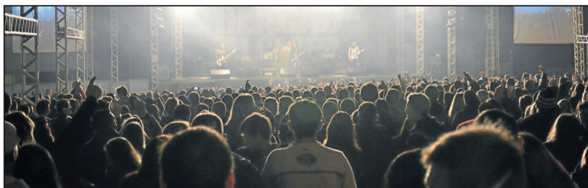
Grande público prestigiou o show