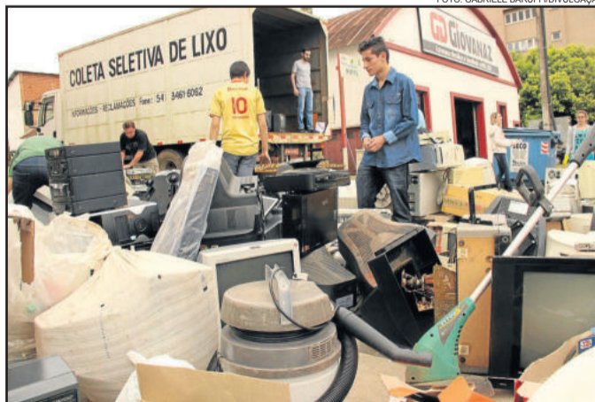
Coleta será feita em frente à sede da Secretaria

Em comemoração ao Dia Mundial do Meio Ambiente, a Prefeitura de Garibaldi, por meio da Secretaria Municipal de Meio Ambiente, realiza no próximo sábado, dia 4 de junho, a Coleta de Resíduos Eletrônicos. A ação acontece das 8 horas às 11h30min, em frente à sede da Secretaria, na Rua Heitor Mazzini, nº 55, no Centro.