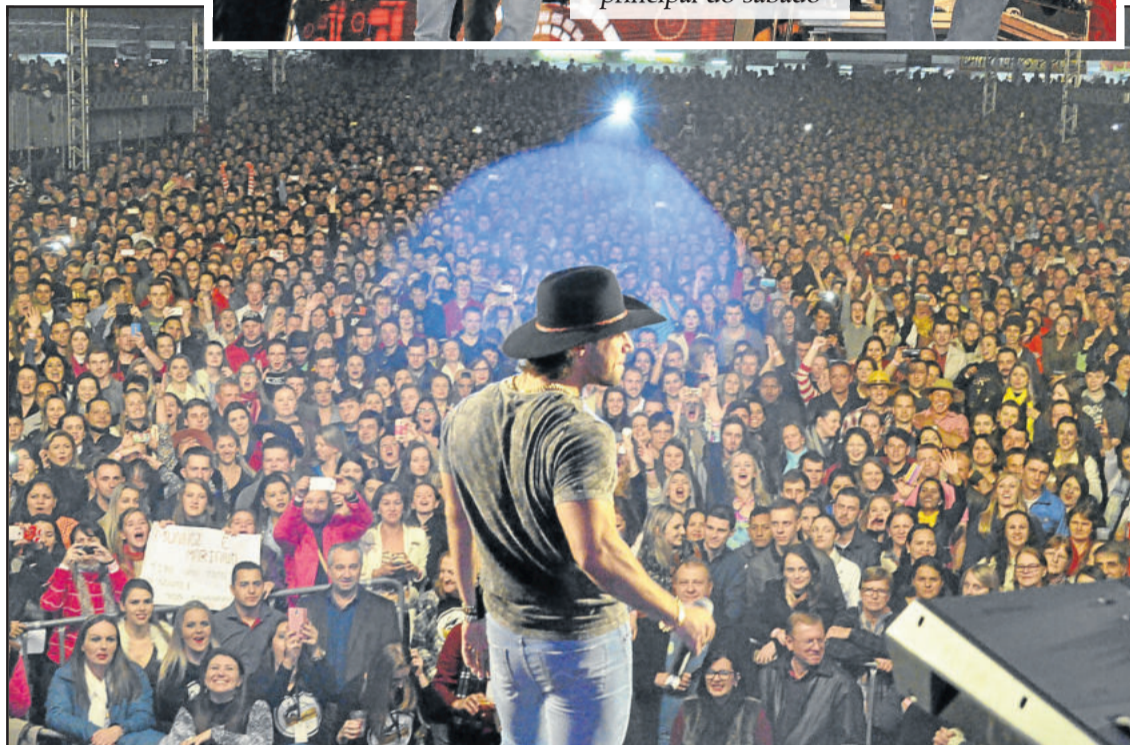
Mais de 11 mil pessoas prestigiam a dupla Munhoz e Mariano