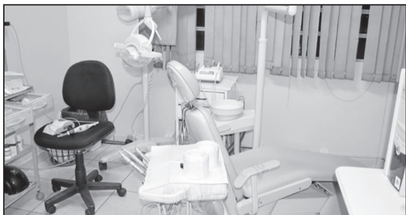
Recursos do Legislativo foram utilizados para melhorias no ambiente odontológico e na pintura

“Com os recursos escassos, temos que priorizar os atendimentos à população. O remanejo de valores, também acaba gerando dificuldades em outras secretarias, porque ao invés de investirem em projetos e obras, precisam ser encaminhados para o atendimento na saúde”, explica.