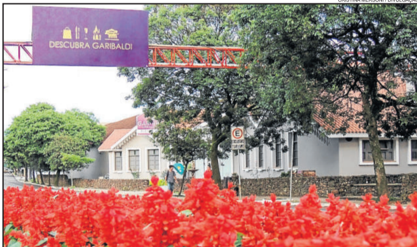
Dia do Meio Ambiente é celebrado no dia 5 de junho