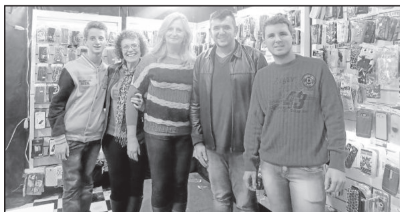
Loja Assessorios e Cia