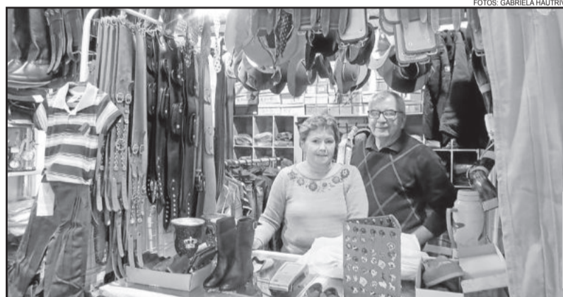
Estande com produtos tradicionais gaúchos

Ao todo, mais de 200 lojistas e empresários marcaram presença na Festa de Maio 2016. O público visitou os espaços internos e externos do Centro Municipal de Eventos (Pavilhão Multiuso) desde às 18h da quarta-feira, dia 25, até as 18h do domingo, dia 29.