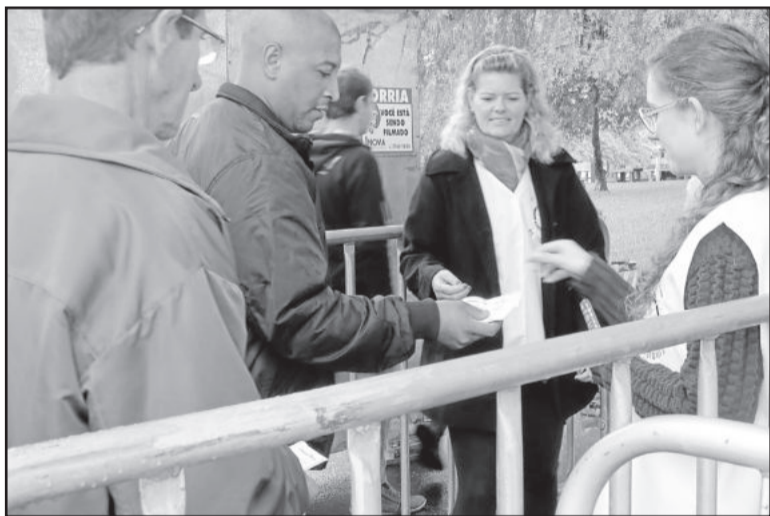
Voluntários fizeram a cobrança nos dias de festa