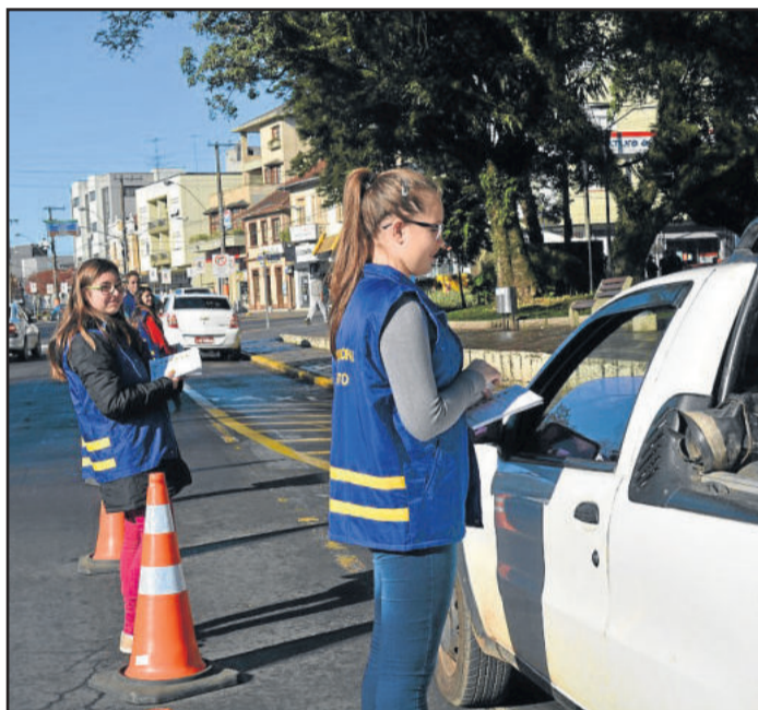
Evento contou com a participação do Conselho Municipal da Juventude, que distribuiu panfletos informativos

Amarelo e o laço que identifica a campanha. Além disso, o Portal na entrada da cidade ganhou bandeiras de cor amarela. Também circularam pela cidade ônibus escolares e do transporte coletivo urbano adesivados com o tema da campanha.