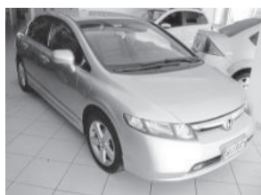
Civic LXS 4P R$ 39.900,00