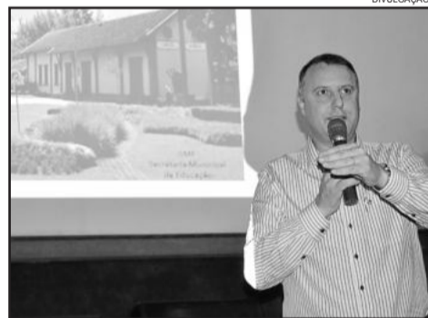
Plano foi apresentado durante reunião