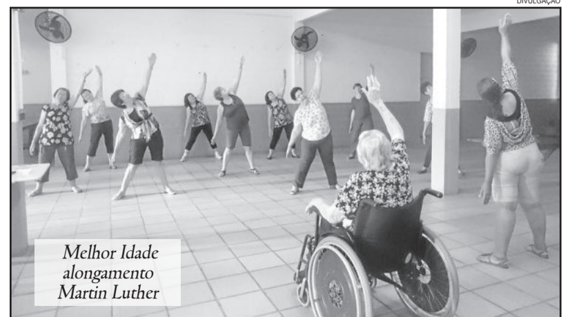
Melhor Idade alongamento Martin Luther