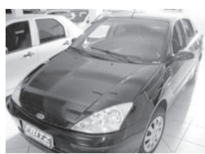
Focus Sedan 1.6 R$ 24.900,00

Aberto de segunda a sexta das 8h às 18h30min. Sem fechar ao meio dia e nos sábados das 8h às 16h.