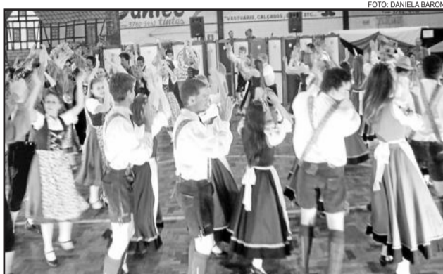
Diversas atrações serão apresentadas durante o evento

O convite é vendido antecipadamente, custa R$ 35,00 por pessoa e pode ser adquirido até esta quarta-feira, dia 5: em Westfália com Élio Dahmer (51 - 3762-3838) e no Comércio de Bebidas de Jaime Grave (51 - 3762-4879); em Teutônia, na Ótica Lauro de Languiru (51 - 3762-1337), Ótica Lauro de Canabarro (51 - 3762-7359) e LH Arquitetura (51 - 3762-2591); em Estrela, na Ótica Lauro do Centro (51 - 3720-2205) e Ótica Lauro da