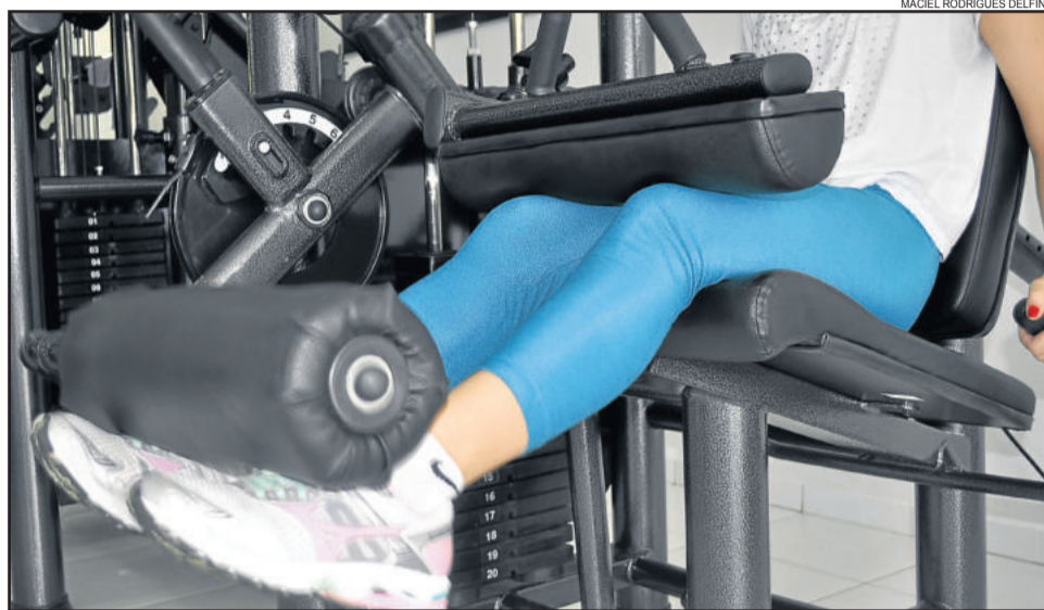
Fortalecimento muscular é importante para prevenir lesões nos joelhos

Com o tempo, a cartilagem responsável pelo amortecimento do joelho começa a desgastar. Além da cirurgia,