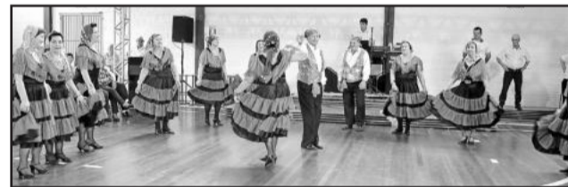
Baile da melhor idade (foto acima). Entrega de bombom aos idosos presentes (foto ao lado).

participam regularmente dos grupos de terceira idade gerenciados pelo Centro de Convivência de Idosos Giuseppe Garibaldi, mantido pela Prefeitura Municipal. Mas a estimativa é de que no mínimo 1,6 mil sejam envolvidos diretamente, através de atividades esporádicas.