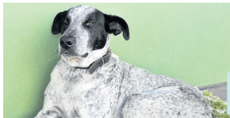
Floquinho é amigo de crianças e adultos

Depois de permanecer um período no Município, o cachorro ficou desaparecido por um bom tempo. Até que surgiram as primeiras fotografias na rede social Facebook.