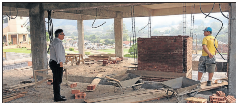
Prefeito Marasca acompanha de perto as obras

Contratação de empresa para a prestação de serviços no regime de empreitada por preço global, compreendendo material, mão de obra e equipamentos, para a construção de uma quadra poliesportiva coberta, com vestiário, na Rua Henrique Uebel, esquina Rua Henrique Krabbe, nº 371, Bairro Centro, numa área total de 980,40 m², incluindo material e mão-de-obra. Empresa Construtora Edil Ltda., valor de R$ 509.946,90.