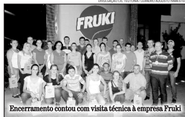
Encerramento contou com visita técnica à empresa Fruki

Dividido em oito módulos, o curso destacou liderança e mudança organizacional, planejamento estratégico, gestão do cliente e do mercado, gestão de pessoas, informação, conhecimento e benchmarking, cidadania e responsabilidade socioambiental, gestão de processos, métodos e ferramentas de melhoria contínua, além de visita técnica à empresa Fruki, de Lajeado, no encerramento.