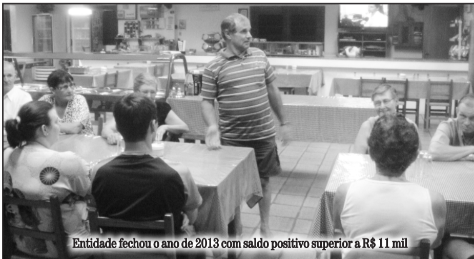
Entidade fechou o ano de 2013 com saldo positivo superior a R$ 11 mil