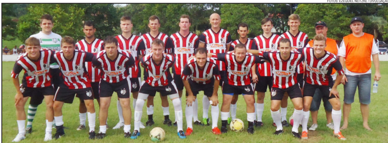
Cruzeiro foi derrotado em casa e está na lanterna da competição