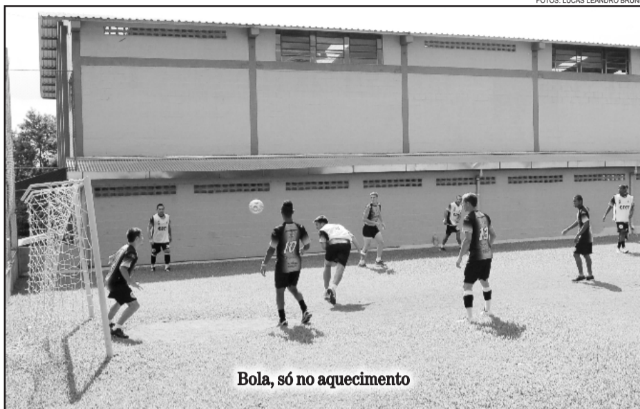
Bola, só no aquecimento