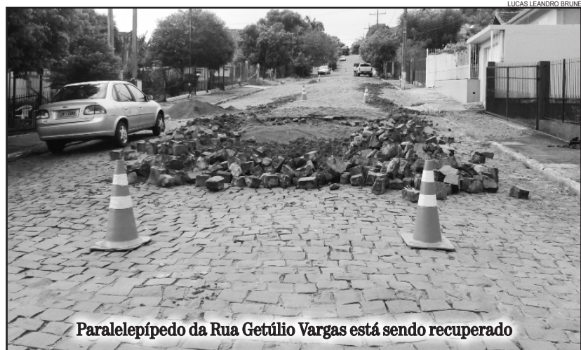
Paralelepípedo da Rua Getúlio Vargas está sendo recuperado

A Administração Municipal de Teutônia, através da Secretaria Municipal de Obras, também tem a missão de zelar pela manutenção das vias existentes. E na área urbana, o Município iniciou nas últimas semanas a recuperação de um trecho da Rua Getúlio Vargas, no Bairro Languiru.