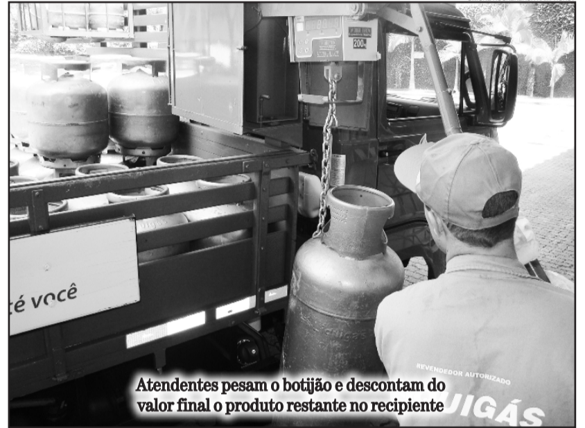
Atendentes pesam o botijão e descontam do valor final o produto restante no recipiente

da em residências, que o adotam no lugar do botijão de 13 quilos. A ArcoGás tem sua sede no Bairro Santo André, em Lajeado, e sua atuação abrange 46 municípios da região. A empresa é a maior distribuidora de Liquigás do Rio Grande do Sul.