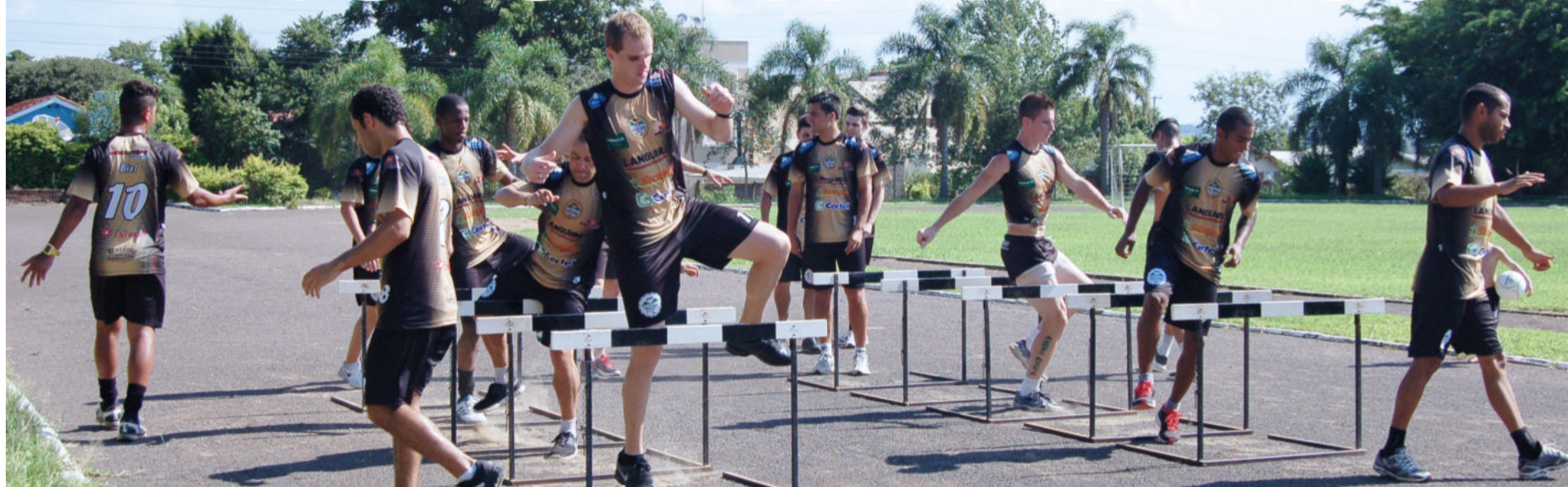
Ontem, grupo de atletas esteve na academia e treinou na pista atlética do Colégio Teutônia. Esta e a próxima semana serão de intenso trabalho físico. Página 13