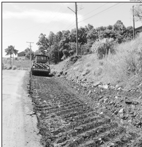
Ciclovía dará mais segurança no trânsito