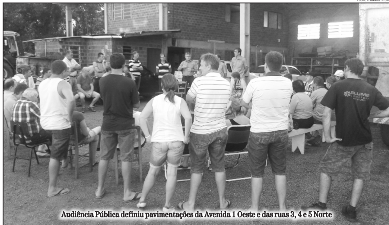
Audiência Pública definiu pavimentações da Avenida 1 Oeste e das ruas 3, 4 e 5 Norte