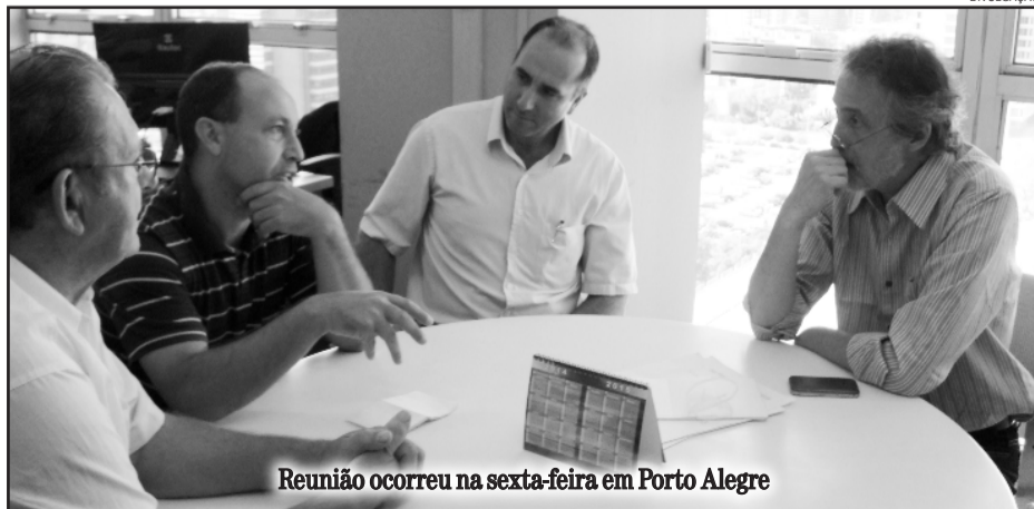
Reunião ocorreu na sexta-feira em Porto Alegre

des, irão fazer a análise. Após isso, virão a Paverama para ver a viabilidade de recuperação do mesmo. Caso contrário, será estudada a possibilidade de perfuração de um novo poço artesiano.