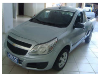
Montana LS 1.4 R$ 29.900,00