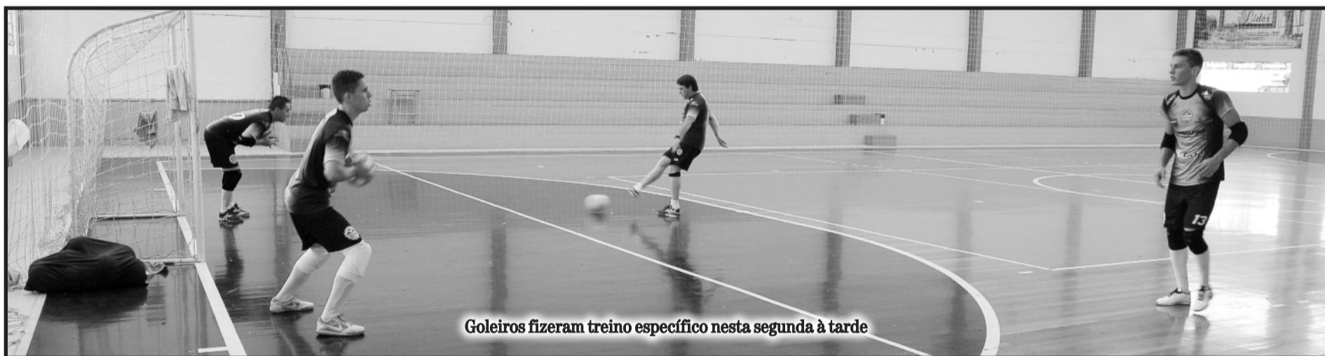
Goleiros fizeram treino específico nesta segunda à tarde