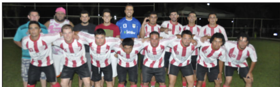
Kaxa Baxa venceu a segunda partida e é líder da Chave F