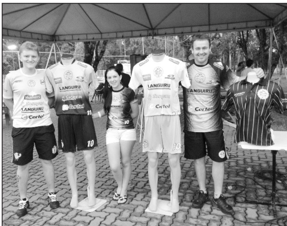
Camisetas foram apresentadas durante o Aberto de Verão

A principal alteração no uniforme principal de jogo é a inversão do branco e do dourado na camiseta, ficando o dourado na parte inferior. A segunda camiseta contempla o preto na parte inferior e passa para o dourado na metade superior, também com degradê.