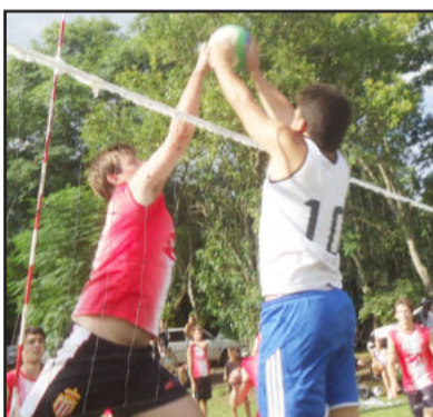
No Vôlei, semifinalistas estão definidos