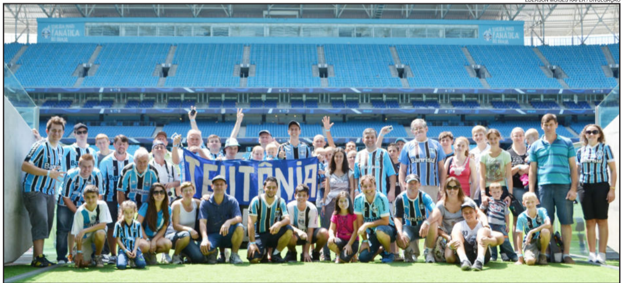
Consulado Gremista de Teutônia levou mais de 110 gremistas para conhecerem a Arena do Grêmio