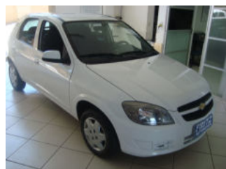
Celta LT 1.0, 4P R$ 26.900,00

Aberto de segunda a sexta das 8h às 18h30min. Sem fechar ao meio dia e nos sábados das 8h às 16h.