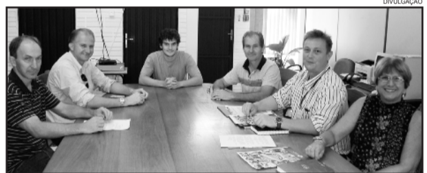
Reunião sobre Lei Geral das Micro e Pequenas Empresas

O Município vai criar um Agente de Desenvolvimento, que pode ser o próprio secretário de Indústria e Comércio, bem como designará um agente administrativo do quadro efetivo (concurso) para dar andamento aos trabalhos. Na Prefeitura, o trabalho é facilitar o trâmite burocrático, com o acompanhamento do passo a passo para a abertura, ampliação e encerramento de empresas da linha MEI, ME e EPP.