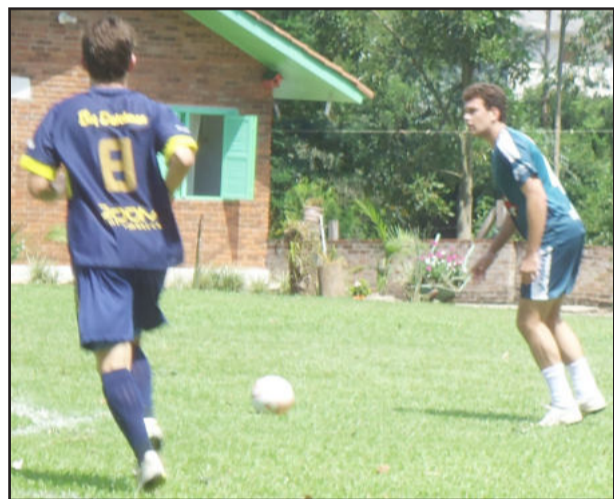
No Futebol Sete, oito melhores foram conhecidos

Você pode votar acessando a página da Aemaso no facebook: facebook.com/aemaso