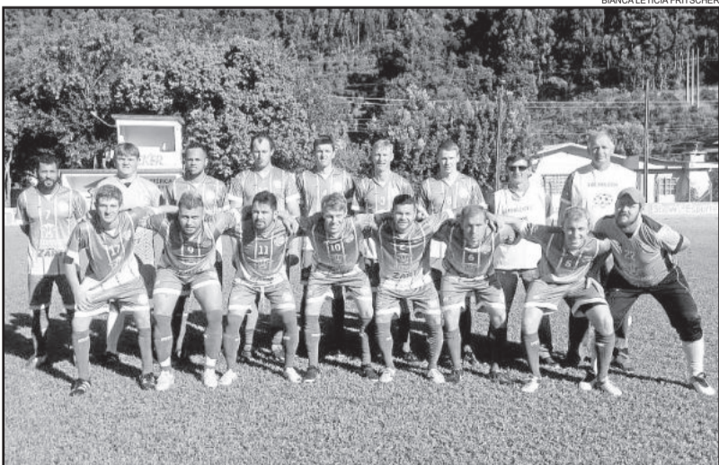
Juventude da Westfália