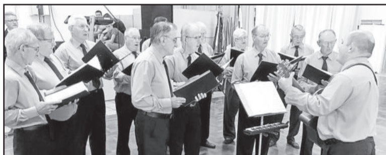
Coro de Homens General Canabarro (Teutônia) atinge 149 anos neste ano

seus 140 anos neste ano. Outros corais centenários também participaram do encontro.