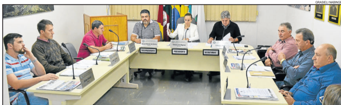
Vereadores baixaram para estudo um projeto que implanta o Plano Municipal de Saneamento Básico

De acordo com o Poder Executivo, a contratação a ser feita será temporária até a realização de concurso