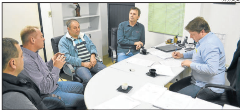
Contrato de repasse dos recursos para a ACAT foi assinado ontem pela manhã