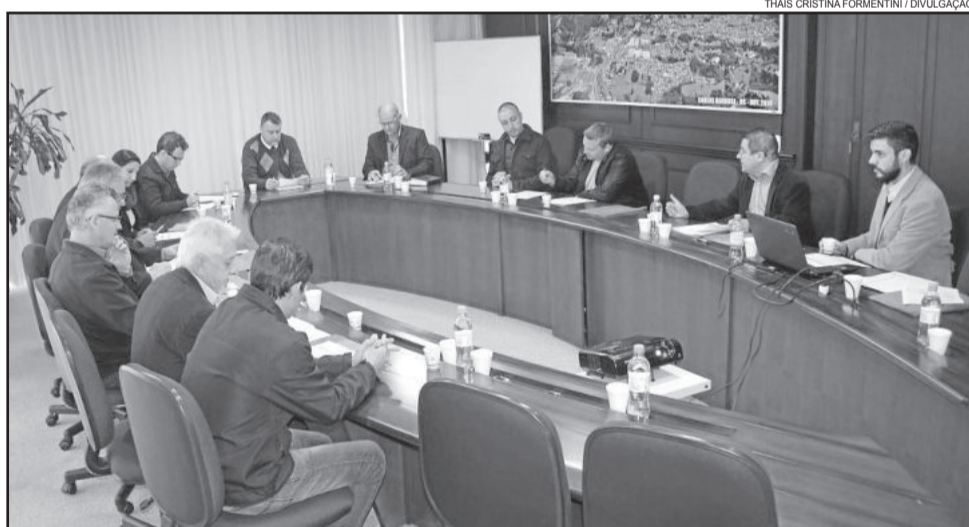
Encontro reuniu representantes da Serra Gaúcha