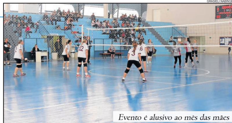
Evento é alusivo ao mês das mães

será no dia 20 de maio, às 13h30, no Ginásio Municipal de Esportes. Mais informações podem ser obtidas pelo telefone (54) 3462-8269.