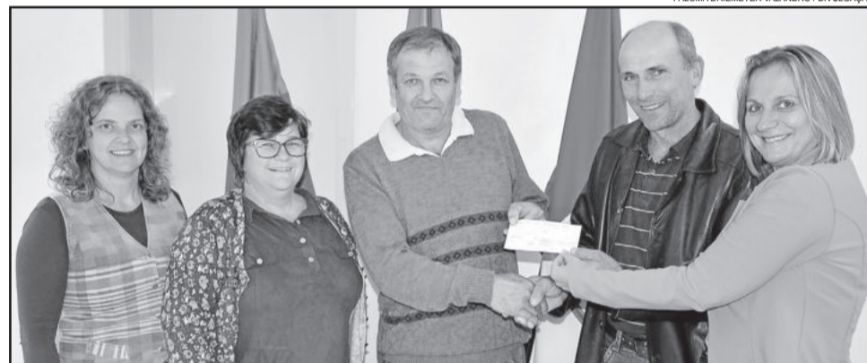
Cord (c) recebeu o cheque do subsídio no dia 25 de abril