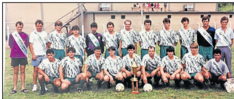
11 Amigos, campeão da Taça da Amizade de 1993, um dos primeiros títulos em competições oficiais