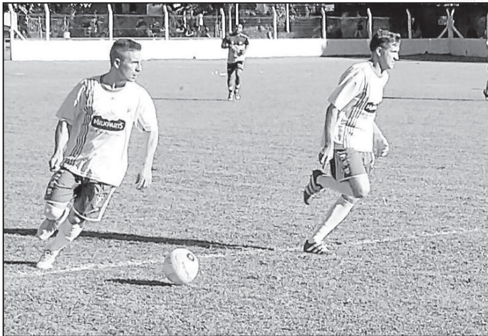
Palmeiras está a um empate das semifinais

Apesar da conversa de intervalo, o Ecas não conseguiu reagir com eficácia. Criava jogadas, mas pecava na finalização. O segundo gol do Palmeiras foi marcado somente aos 8 minutos da etapa final. O atacante Titi recebeu a bola na entrada da grande área e, de biquinho de chuteira, concluiu por cobertura, sem chances ao goleiro Fausto.