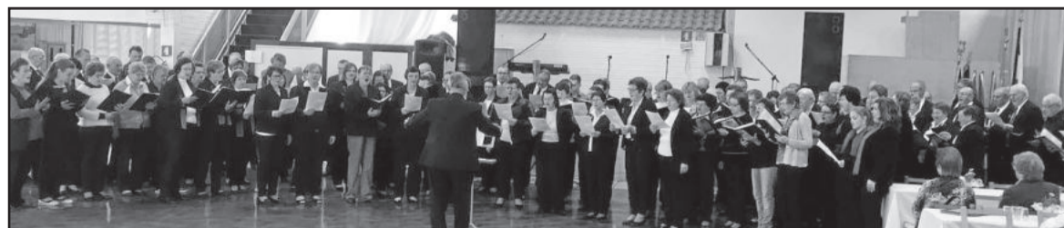
Grande coral misto