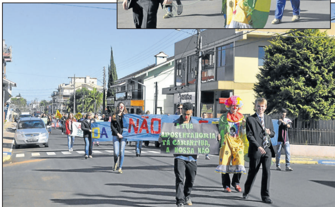
Mobilização mostrou a insatisfação à Reforma da Previdência