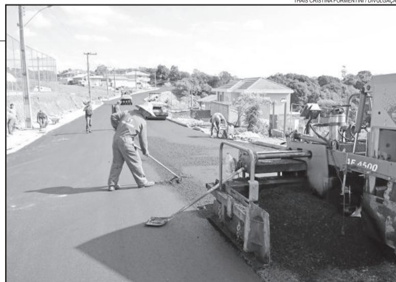
Entre as melhorias estão drenagens, galerias e pavimentações

esta tarde. Além da drenagem, galeria, pavimentação e sinalização, a obra contempla a construção de passeio público em toda extensão do asfalto, que é de 280 metros. No total, serão investidos aproximadamente R$1 milhão e 500 mil nas obras, oriundos de recursos federais.