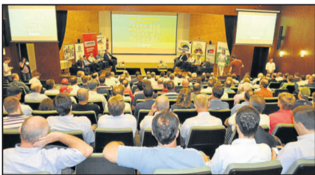
Lançamento do projeto ocorreu na tarde de ontem

Rua Dom Pedro II, nº 2266, Bairro Canabarro, Teutônia/RS (51) 3762-8077 e (51) 99638-1093