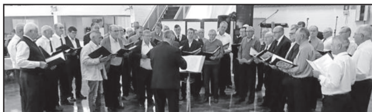
Grande coral de homens