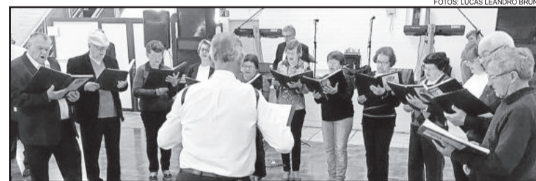
Coro Misto Aliança de Linha Frank (Westfália) completa 140 anos de atividades em 2017