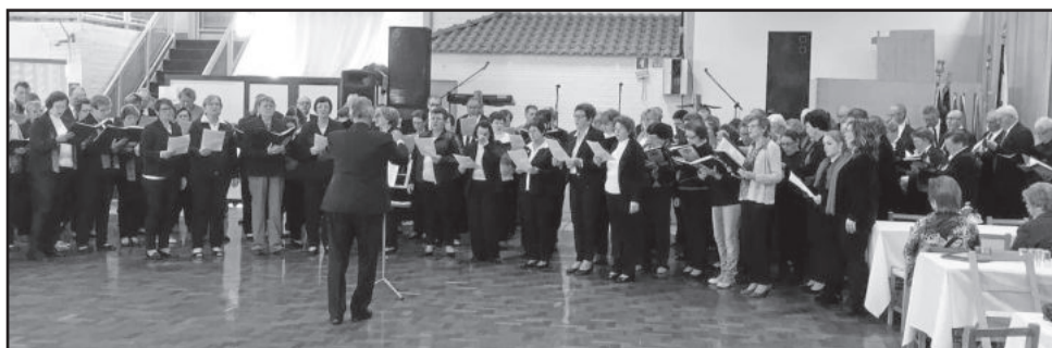
Regentes vislumbram dificuldade de sobrevivência de corais sem o repasse público