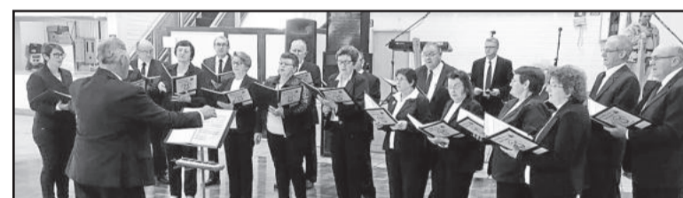
Coro Misto Ouro Branco, anfitrião do evento