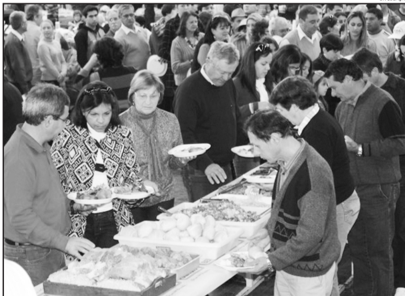
Este ano acontece o 27 o Festival Colonial Italiano

Tudo que diz respeito à preservação dos usos e costumes das diferentes etnias devem ser respeitados como um direito humano, tão importante e imprescindível como os demais.