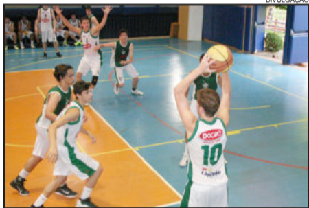
Docile/Ceat/Bira entra em quadra às 20 horas de hoje

As categorias de base do Ceat/Bira nas modalidades Voleibol e Basquete contam com o patrocínio da Prefeitura Municipal de Lajeado, Perfeysom, Univates, Docile, Fruki, Lojas Wessel e Unimed. São apoiadores o Show dos Esportes, Kikão Lanches, Restaurante Prêmios e Restaurante Nápoli.