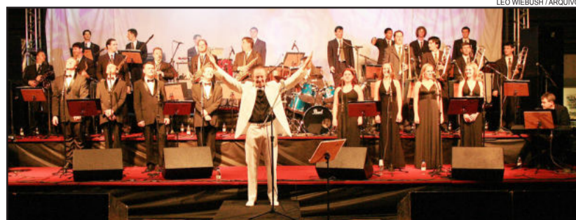
Orquestra de Teutônia

Esse projeto moderno e diferenciado está sendo possibilitado através de financiamento da Secretaria de Estado da Cultura e Pró-Cultura RS, com patrocínio