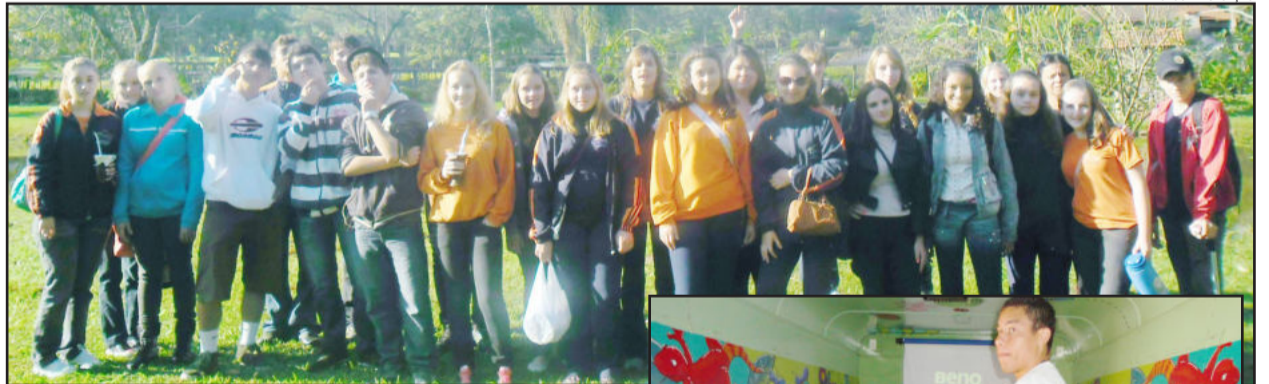
O Ensino Médio Politécnico realizou visita de estudos ao Jardim Botânico de Lajeado

Os alunos da Escola Estadual de Ensino Médio Colinas desenvolveram, durante o mês de maio, diversas atividades ambientais.