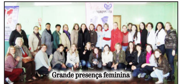
Grande presença feminina