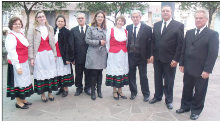
Grupo de Cantorias Stella D'Itália