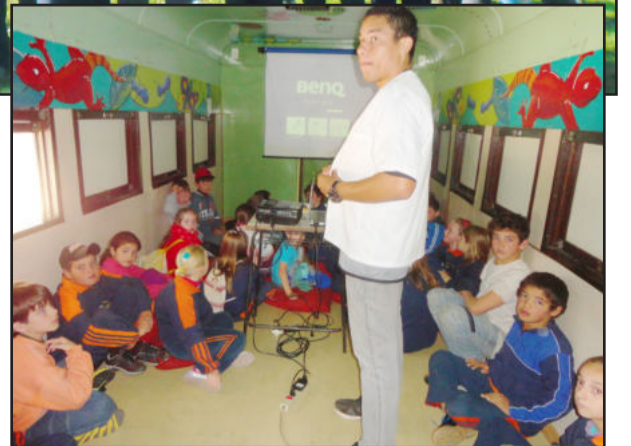
Alunos das séries tiveram palestra no Vagão Ambiental, em Roca Sales

Já os alunos do Ensino Médio Politécnico realizaram uma visita de estudos ao Jardim Botânico de Lajeado, com o objetivo de desenvolver um trabalho de interdisciplinaridade e a construção de vínculo do conhecimento com a realidade da vida. Na visita os alunos tiveram oportunidade de passear por trilhas de interpretação ambiental com áreas de regeneração, cascata e espécies nativas,