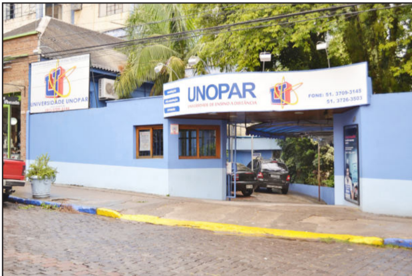
Polo Universitário Lajeado