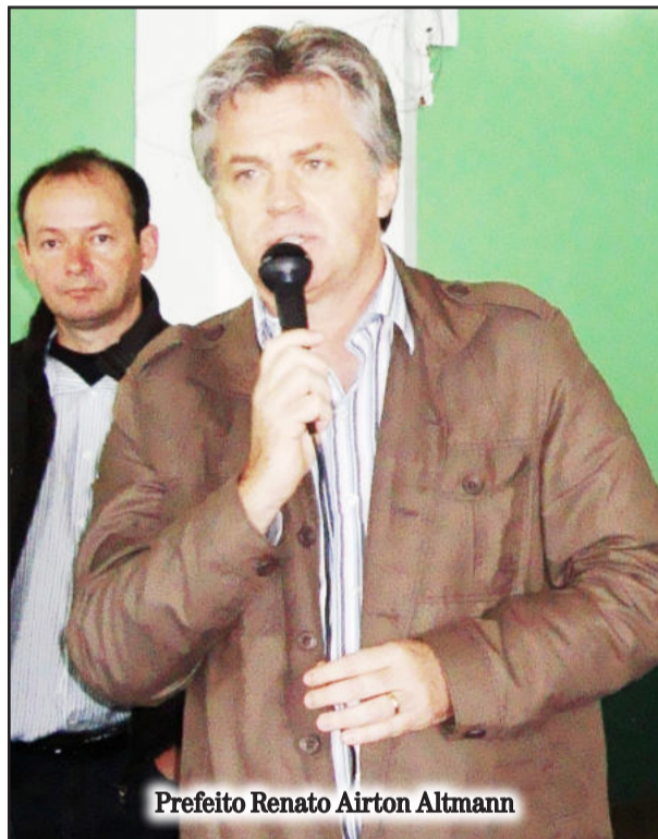
Prefeito Renato Airton Altmann