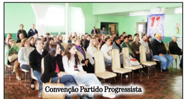
Convenção Partido Progressista