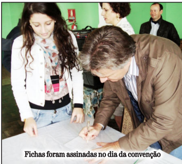
Fichas foram assinadas no dia da convenção