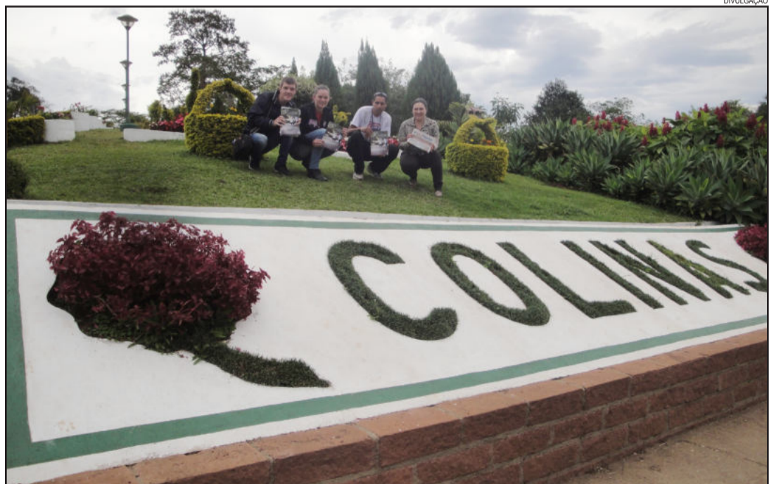
Caravana Popular em Colinas