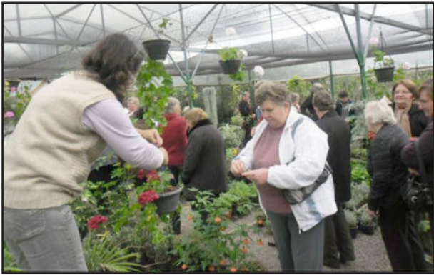
Uma das atividades foi a visita à floricultura local

No dia 22 de maio, a Associação de Mulheres Colinas (AMC), com o apoio da Emater/RS-Ascar e Prefeitura de Colinas, promoveu uma tarde diferente em homenagem às mães. As atividades buscaram valorizar a cultura local e promover a integração da comunidade, contribuindo para a consolidação da atividade locais, principalmente com as áreas do artesanato, da gastronomia e floricultura e, ainda, estimular a participação da comunidade na inserção do turismo no município.