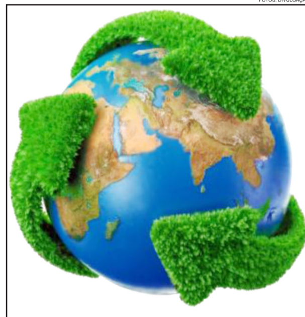
Dia Mundial do Meio Ambiente será comemorado em vários países