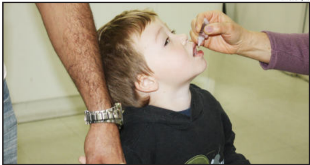
Vacinação contra a poliomielite

A Secretaria da Saúde de Garibaldi está integrada a Campanha Nacional de Vacinação contra Poliomielite, a ser realizada no período de 08 a 21 de junho. Mais uma vez, a população Garibaldense está convocada a vacinar as crianças de 06 meses a menores de cinco anos. As Unidades Básicas de Saúde estarão abertas durante todo o dia neste sábado, 8 de Junho, e também as unidades móveis estarão circulando pelo interior do município conforme o roteiro abaixo.