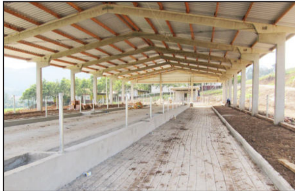
Galpão/ Espaço de 818 m 2 comporta 80 vacas

O confinamento recebeu os animais na terça-feira, dia 28 de maio. Hoje, o espaço conta com aproximadamente 40 animais, porém, a meta é atingir 66 vacas deitadas e 80 durante as refeições, alcançando dois mil litros de leite. A ordenha é realizada duas vezes ao dia, às 6 e às 17 horas. A produção será repassada à empresa Laticínios Steffenon, de Boa Vista do Sul. Com o resultado, a família será a maior produtora de leite de