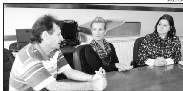
Vereadores discutem sobre a construção de posto de saúde

O presidente da comissão ficou encarregado de marcar um horário com o Prefeito, para que possam expor sua ideia.