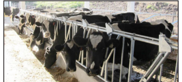
Hoje, o espaço conta com aproximadamente 40 animais