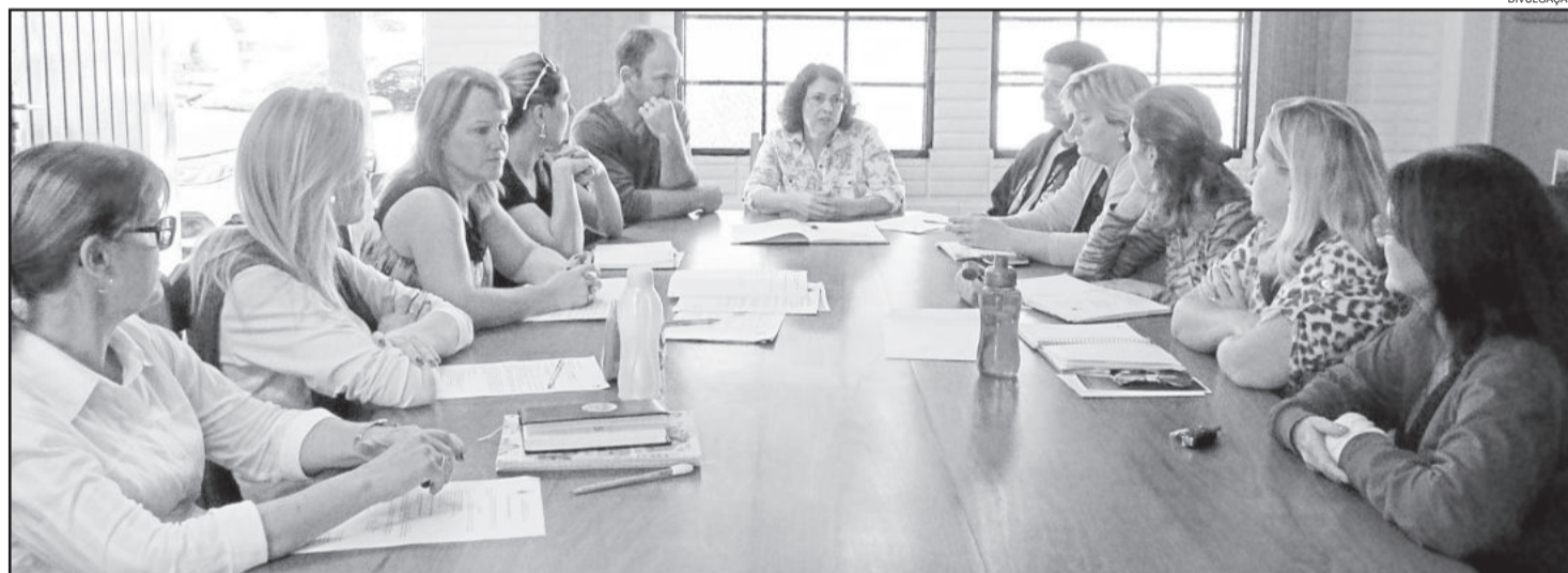
Reunião de planejamento com representantes de todas as escolas municipais

cidadania, além de agregar na pontuação do PIT - revertendo em pontos ao município. A cada semestre, o Grupo Municipal de Educação Fiscal presta contas a Secretaria da Fazenda do município e esta, por sua vez, presta contas ao Estado. A prestação de contas, referente às escolas, ocorre por meio da apresentação organizada dos projetos e trabalhos desenvolvidos nos educandários, os quais servem como comprovação da execução do Programa em Teutônia.