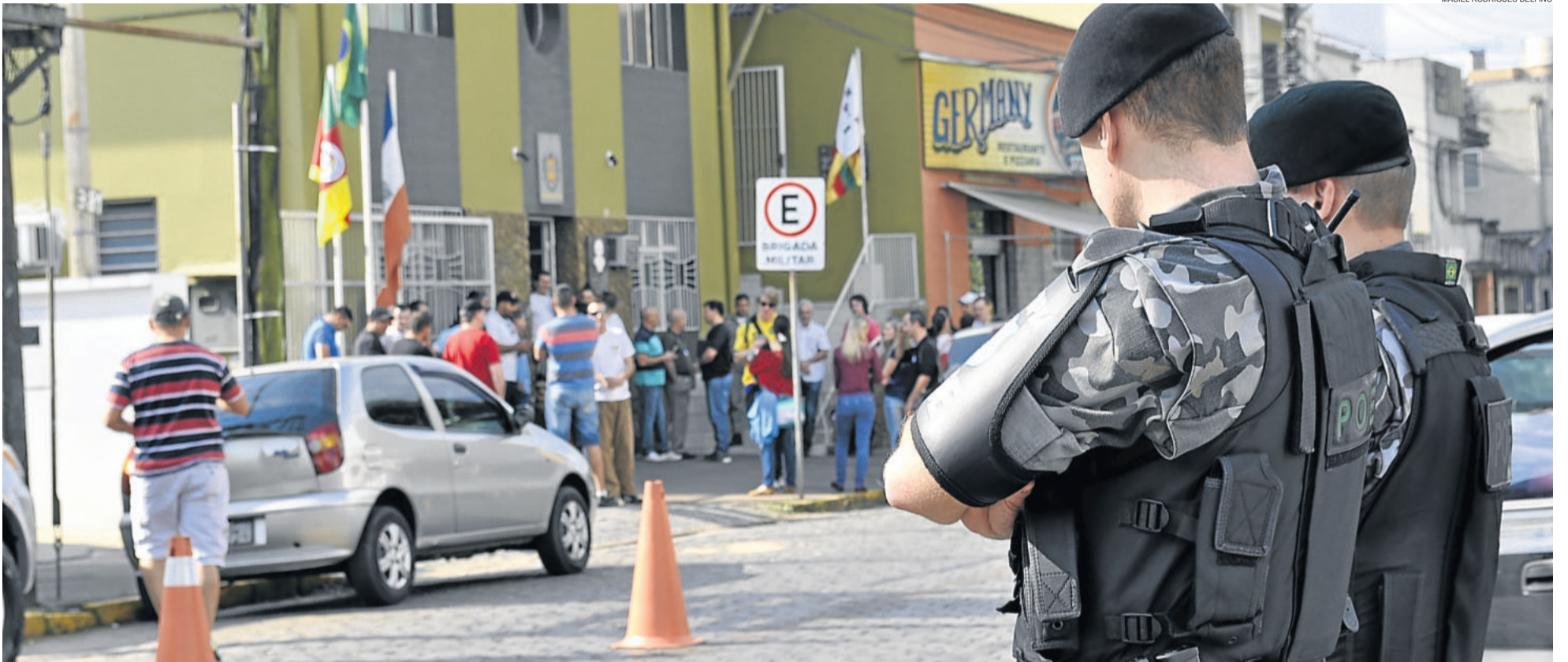
Segurança e educação são afetadas no Estado. Em Lajeado (foto), por exemplo, 13 viaturas estão paradas e alguns policiais atuam a pé. REGIÃO > 4 E 5