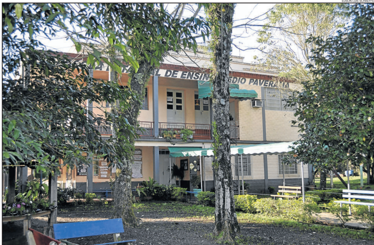
EEEMPA atenderá aos alunos em horários diferenciados

no Facebook informando que entre os dias 4 e 17 de agosto, até ordem contrária, o horário de aulas será reduzido para três horas por turno, conforme os seguintes horários: pela manhã, das 7h30min às 10h30min; à tarde das 13 horas às 16 horas; e à noite das 19 horas às 22 horas.