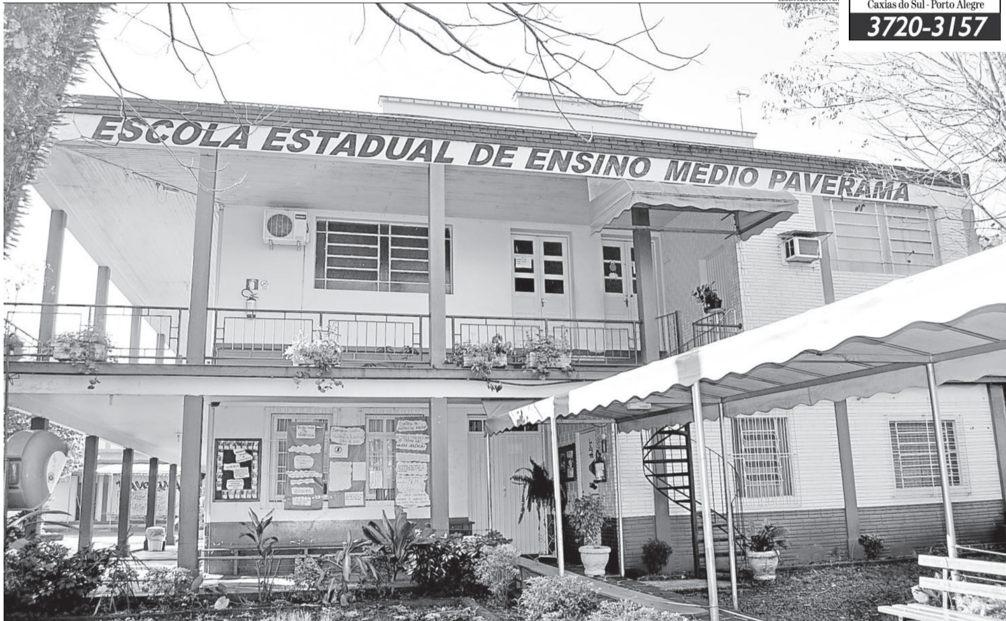
Educandário completa 46 anos de ensino público em Paverama no dia 16