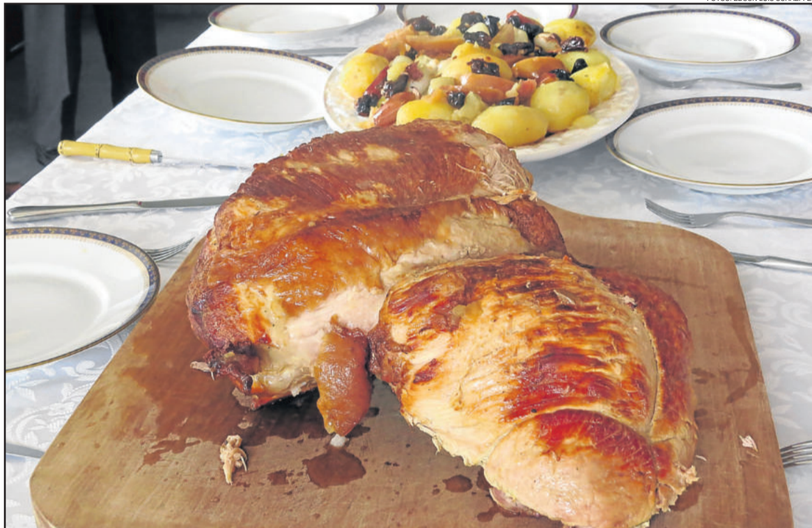
Schweinebraten é o prato típico de Teutônia

O prefeito, Renato Airtton Altmann, destacou que o prato típico é um complemento na questão turística de Teutônia. “Muitos municípios têm as suas próprias características já pré-estabelecidas. A comissão toda está de parabéns em estar definindo o Schweinebraten como prato típico, que tradicional e histórico no nosso município. O prato típico é importante para que Teutônia possa se tornar referência e ser mais um atrativo turístico para o desenvolvimento do nosso município”, enalteceu.