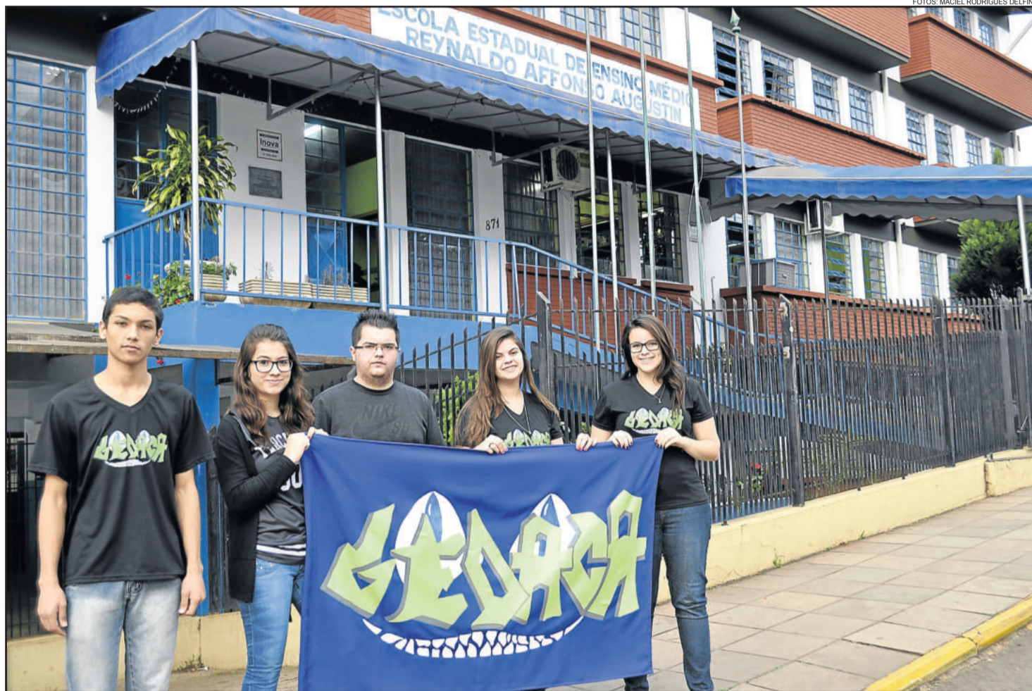
Integrantes do Gedaca orientaram alunos do Augustin a ficarem em casa