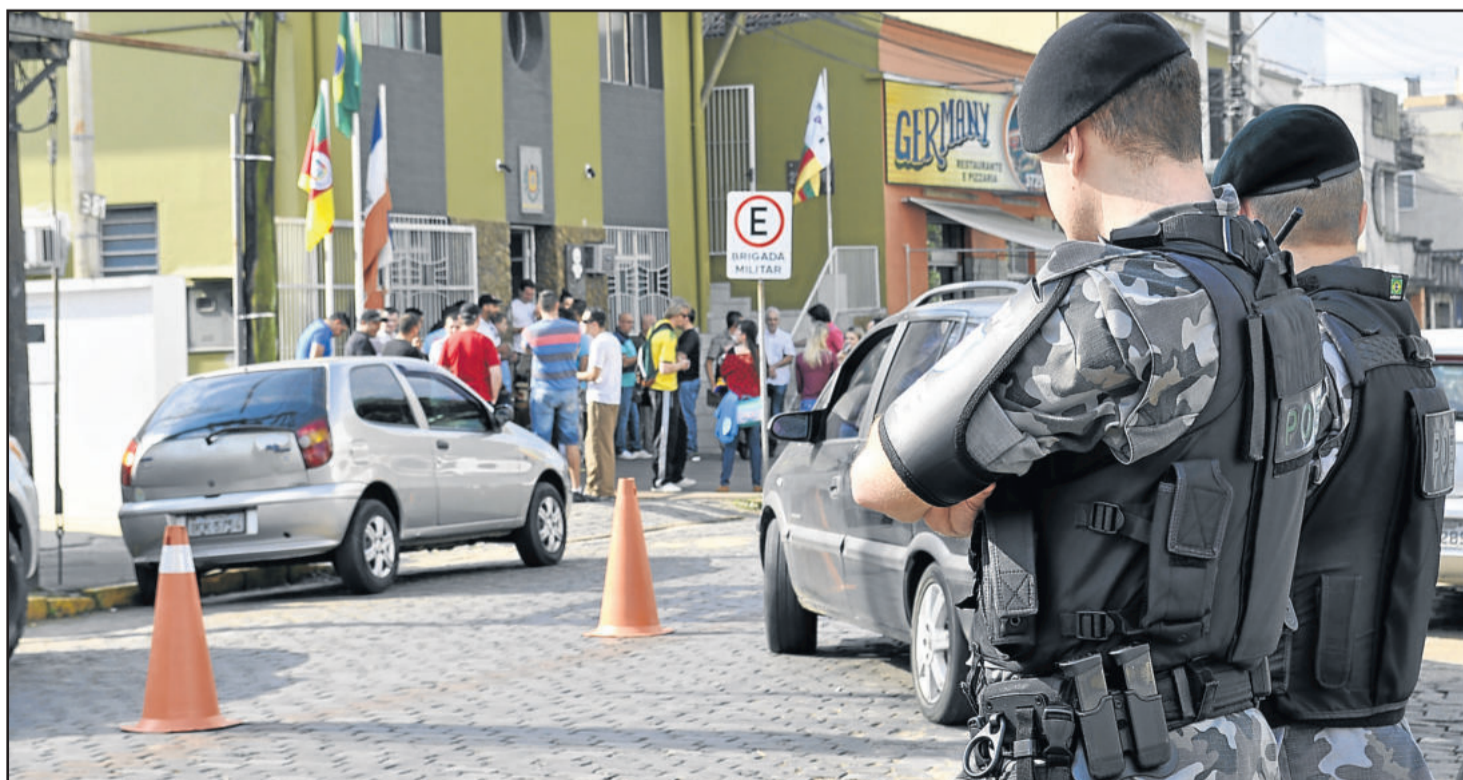
Em Lajeado (foto), alguns policiais atuam a pé pelas ruas da cidade

Para o dia 18 de agosto, está prevista uma Assembleia Geral dos Servidores Estaduais. As reivindicações e manifestações acontecerão em Porto Alegre, em frente ao Palácio do Piratini. Nesse dia não haverá aula na rede estadual de ensino.