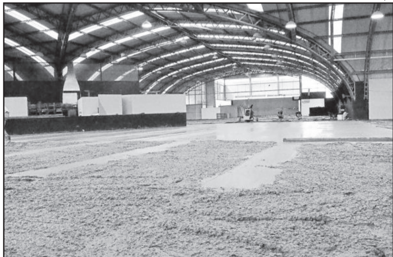
Piso do Parque Fenachamp passou por melhorias