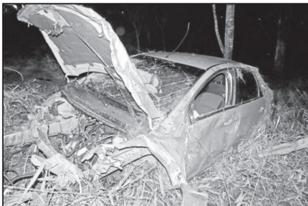
Focus de Boa Vista do Sul capotou na Rota do Sol

O condutor do Uno, de 30 anos, alegou ter dado pane nos freios de seu automóvel. No entanto, ao verificar o sistema, a Polícia Rodoviária Estadual de Teutônia constatou que o veículo estava com o licenciamento vencido. Além disso, o motorista apresentava sinais de embriaguez. Foi aplicado o teste do etilômetro, que acusou 0,43mg de álcool por litro de ar expelido. O registro foi feito na Delegacia de Polícia de Pronto Atendimento de Bento Gonçalves. Ninguém ficou ferido.