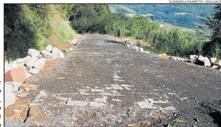
Depois de finalizado o acabamento, o trecho estará liberado

A colocação do material visa melhorar o acesso dos moradores da comunidade e de todos que necessitam passar pelo local.