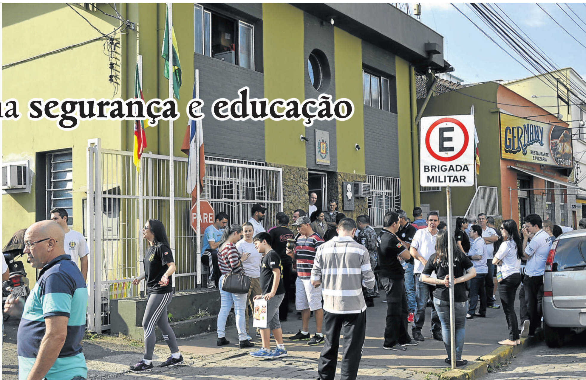
Servidores estaduais da segurança se manifestaram na tarde de ontem