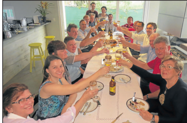
Comissão se reuniu no sábado para degustar o Schweinebraten