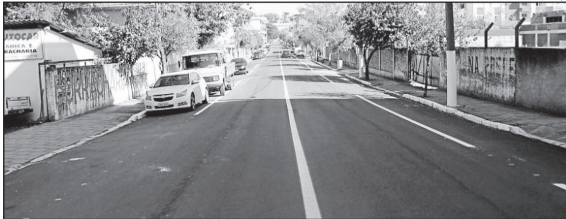
Avenida Presidente Vargas finalizada

A Administração Municipal solicita aos motoristas que trafegarem pelos locais onde estão sendo realizadas obras, para que diminuam a velocidade e aumentem a atenção. Lembre-se, algumas obras causam transtornos, porém os transtornos de hoje possibilitarão o conforto de amanhã.