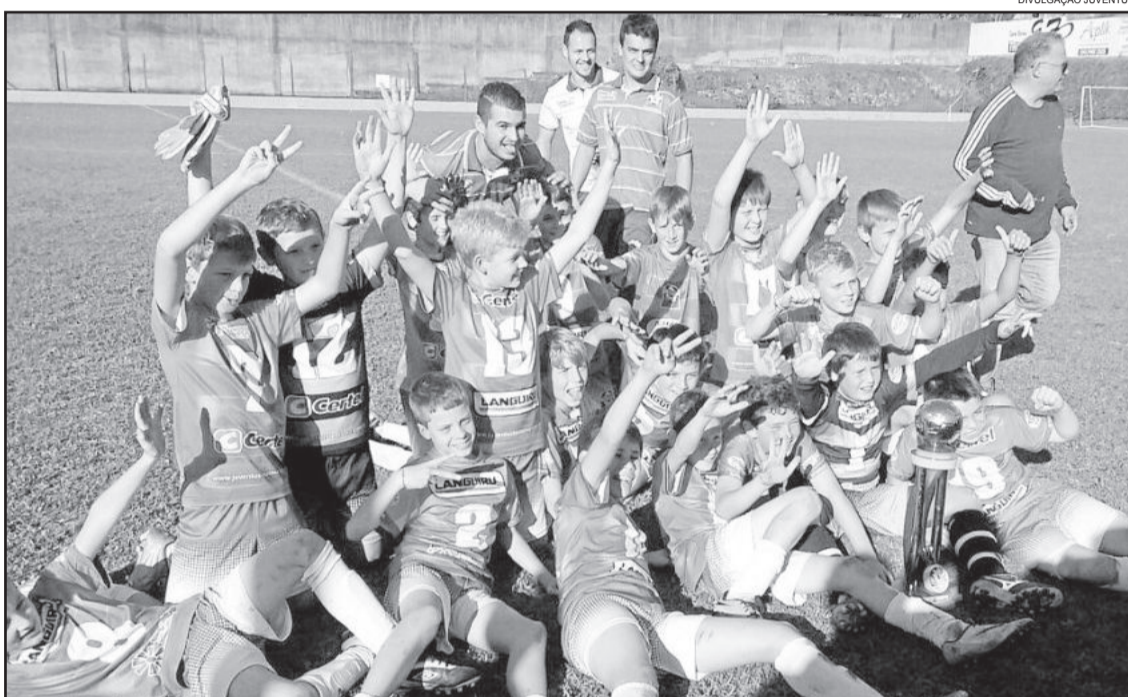
Sub-11 da Juventus deu o título da Brazil Cup como presente de aniversário

Mais informações podem ser obtidas no site www.juventusteutonia.com.br ou www.brazilcup.com.br