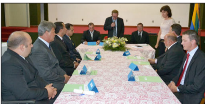
Vereadores também foram empossados