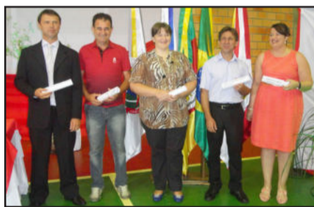
Secretários municipais apresentados à comunidade