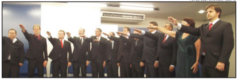
Momento do juramento dos vereadores eleitos

Schmidt falou ainda que pretende implantar um projeto para diminuir a epidemia do crack, que vem se alastrando em Lajeado e em todo o Vale do Taquari. O prefeito eleito entende que a questão das drogas é um tema relevante e que não pode ser desenvolvido e coordenado por um só poder. "É preciso ouvir o Ministério Público, o Poder Judiciário como um todo e ouvir também instituições já existentes que trabalham o tema e a sociedade como um todo, bem como as famílias envolvidas na questão. Precisamos criar novas alternativas em relação a esse tema, que é extremamente preocupante, que desintegra famílias e que preocupa