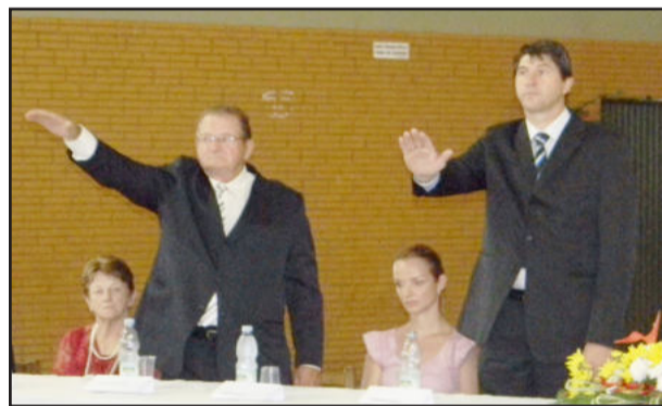
Prefeito (d) e vice-prefeito fizeram o juramento de posse