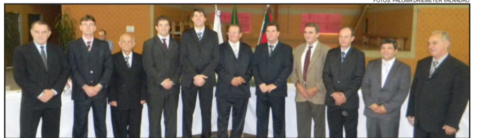
Novos representantes do Executivo e Legislativo de Paverama