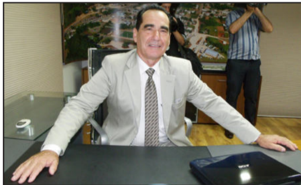
Dornelles quer a regularização fundiária para Fazenda Vilanova continuar se desenvolvendo