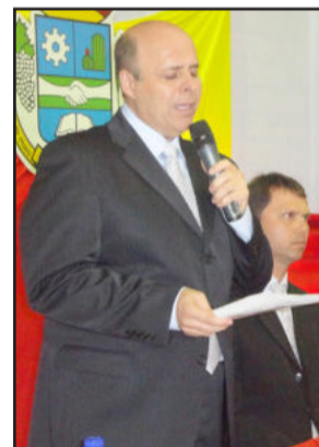
O prefeito em seu primeiro discurso oficial