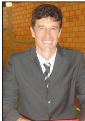
Demari é o presidente da Câmara