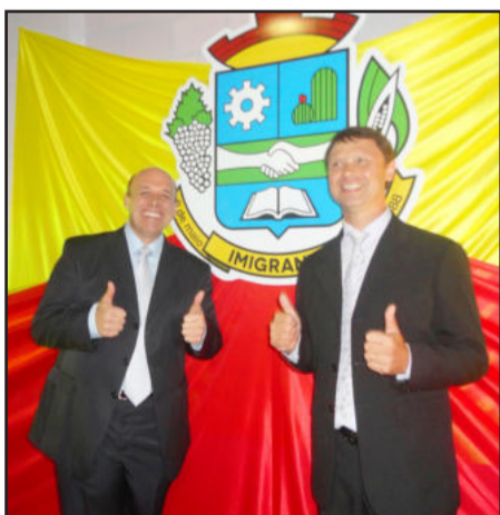
Prefeito e vice prontos para trabalhar