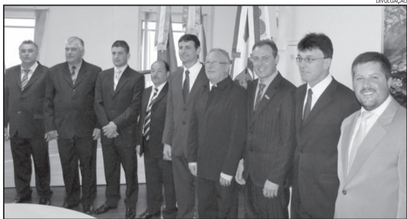
Vereadores garibaldenses para pleito dos próximos quatro anos