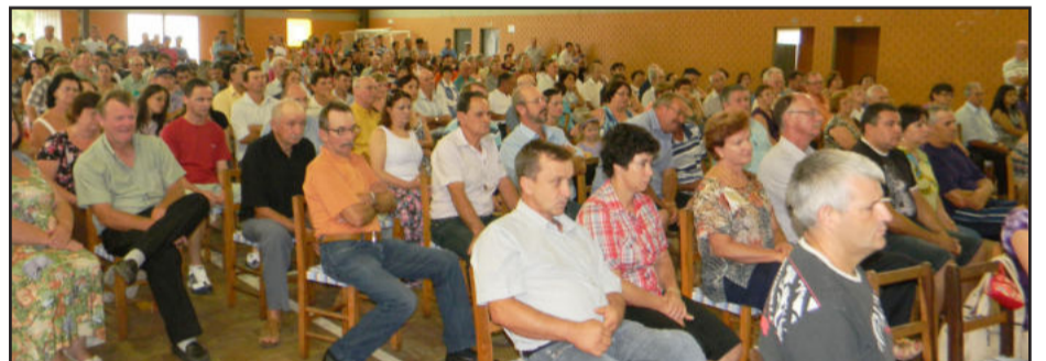
Grande público acompanhou a posse dos eleitos