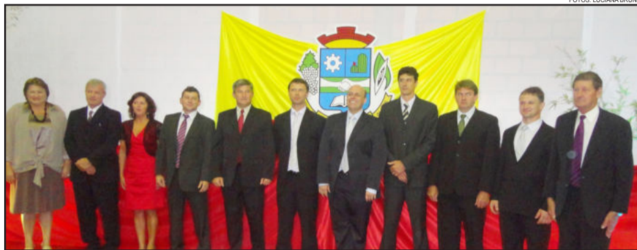
Prefeito, vice e vereadores empossados