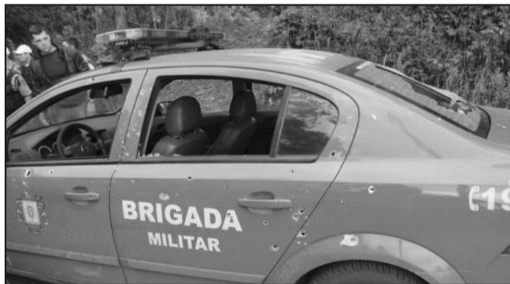
Viatura foi alvejada por tiros