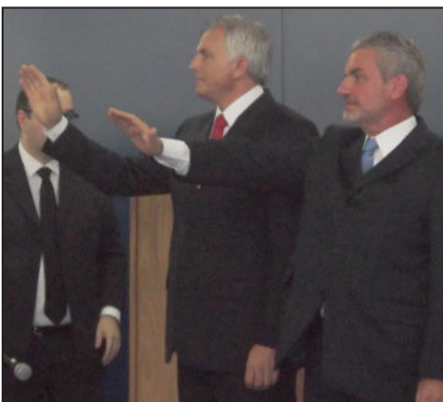
Momento do juramento do prefeito e vice-prefeitos de Lajeado