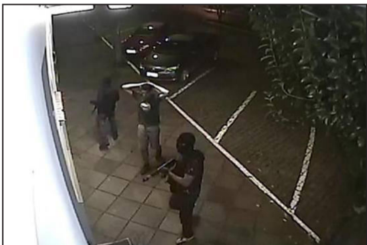
Refens serviram de escudo humano na ação dos bandidos

Cotiporã é considerada pacata e de janeiro a novembro de 2012 foram registrados 23 furtos, dois roubos e oito delitos relacionados a armas. A quadrilha que protagonizou o assalto na cidade era conhecida da polícia pelo uso de dinamite para roubos a comércios e bancos no interior do Estado.