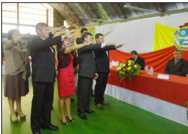
Juramento de posse dos vereadores