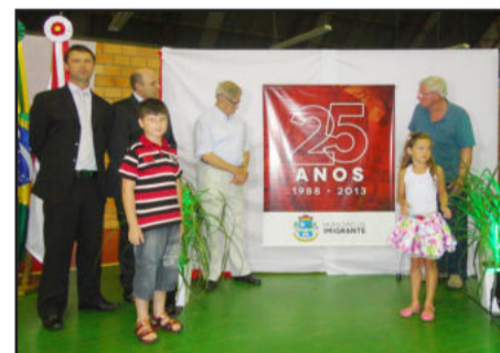
Descerramento do selo alusivo aos 25 anos