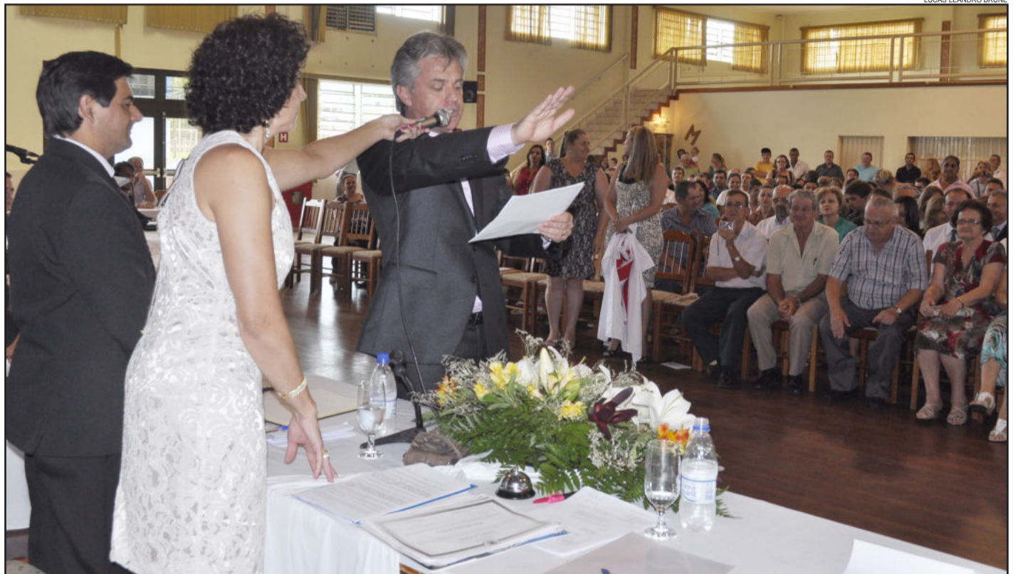
LUCAS LEANDRO BRUNE

Prefeitos, vice-prefeitos e vereadores tomaram posse na segunda e terça-feira. Todos já anunciaram suas prioridades no exercício do mandato. Na foto, prefeito reeleito de Teutônia, Renato Airton Altmann, presta compromisso de posse perante à Câmara de Vereadores e ao público da sessão solene. Cobertura das posses nas páginas 4, 6, 7, 8, 9, 10, 11, 12, 13, 15, 16 e 17