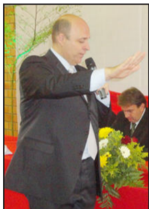
Kaplan no juramento de posse