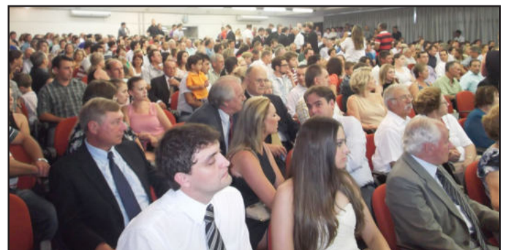
Auditório do prédio 7 da Univates lotou para a posse dos eleitos