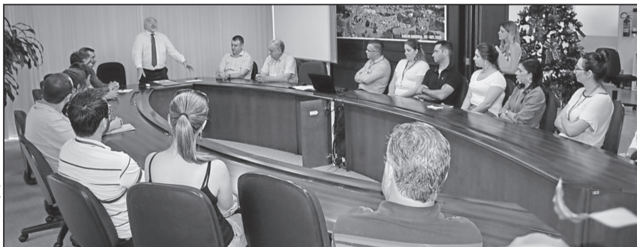
Ato de assinatura foi realizado no gabinete do Executivo