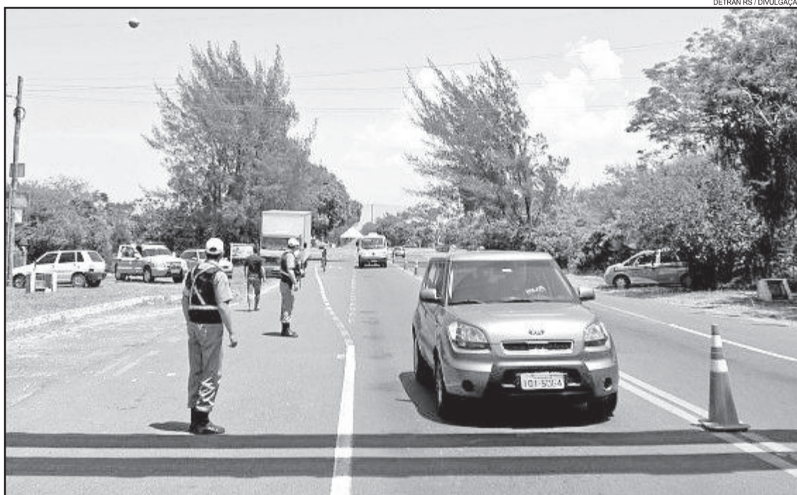
Operação Viagem Segura de Ano Novo teve trabalho intenso dos órgãos de fiscalização

Média diária de óbitos ficou abaixo da média de operações anteriores