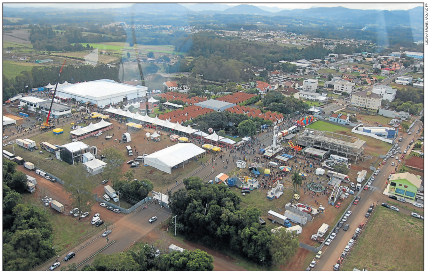
Imagem aérea da Festa de Maio de 2014

Outro fato que faz com que o empresário adquira um estande, segundo ela, são os shows nacionais, que assegura bom público. “Atrai expositores de outros municípios e isso é muito positivo”, destaca. Neste ano, a diretoria, da CIC decidiu manter o mesmo preços dos estandes praticados em 2014. O objetivo é não ser injusto com ninguém, explica a secretária. “Sabemos da crise que muitas pessoas enfrentaram e por isso tomamos a decisão. Isso fez com que muitas pessoas nos procurassem e lo-