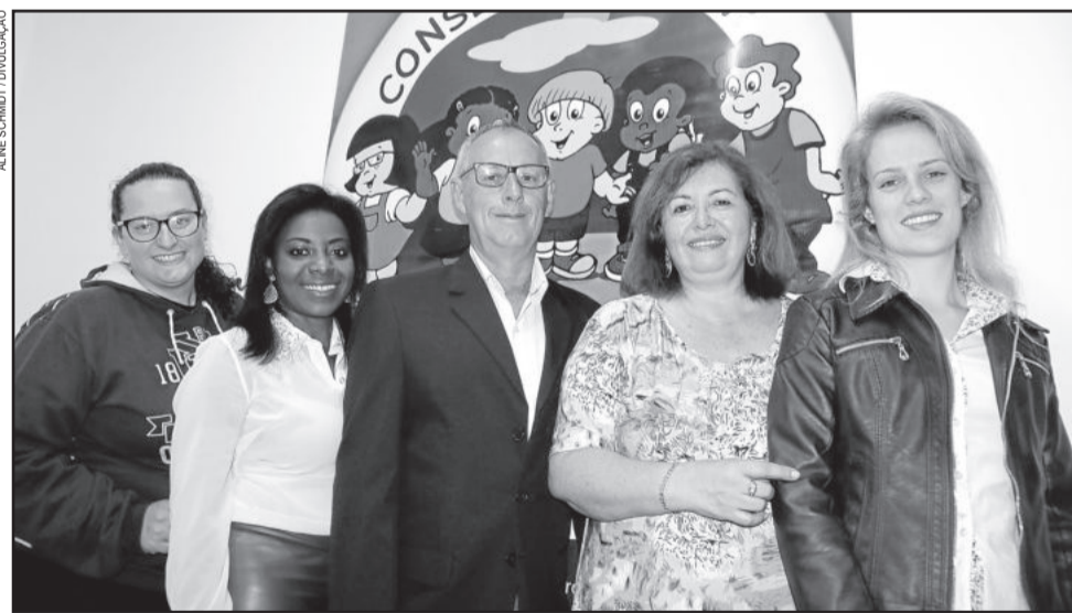
Conselheiros Tutelares serão diplomados no dia 8

cinco suplentes, eleitos no dia 4 de outubro de 2015, para a gestão 2016/2019. O evento inicia-se às 9h, com a presença de autoridades.