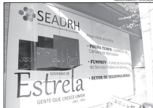
Posto para confecção de identidade funciona junto ao Poupa Tempo