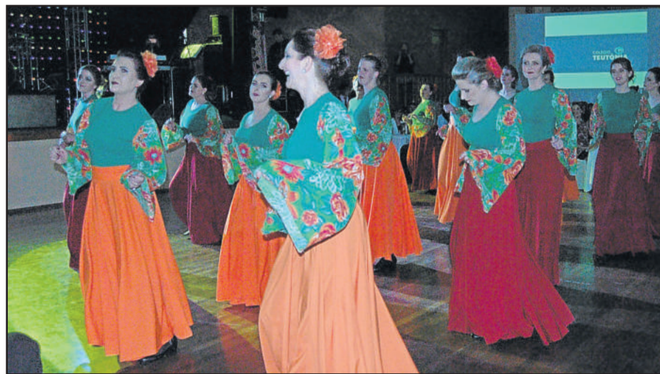
Professoras também entraram no clima de descontração e apresentaram uma dança