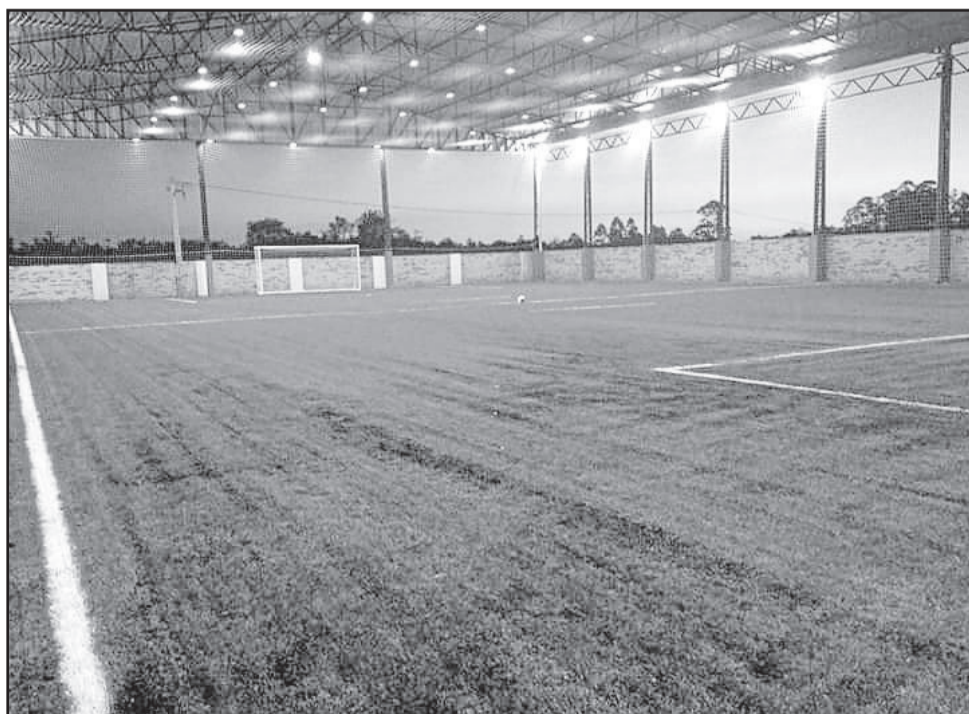
Quadra de gramado sintético

As inscrições para a competição já estão abertas e as vagas são limitadas. Os interessados em participar do campeonato devem entrar em contato pelos números (51) 9610-8992 ou (51) 9900-4818. O valor da inscrição para a categoria Master é R$ 1.300,00 por equipe. No Força Livre o valor é de R$ 2.600,00 por equipe.