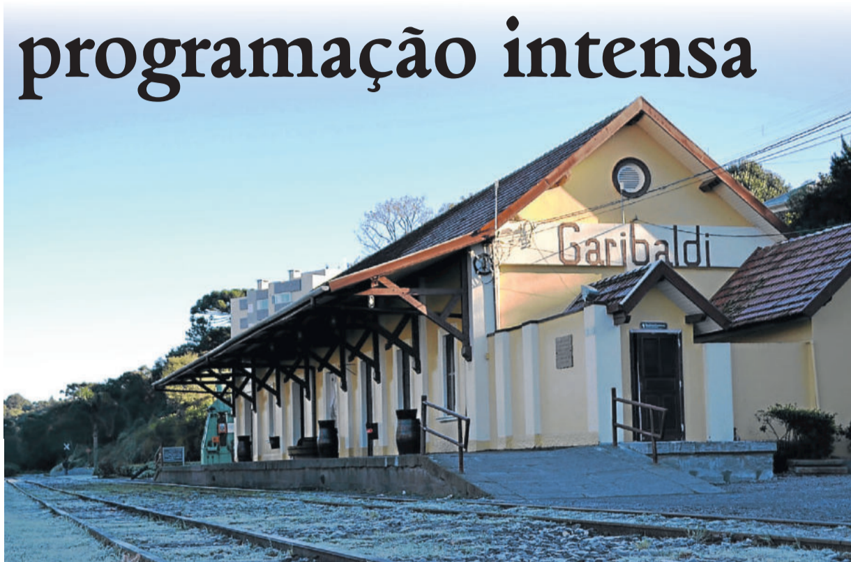
A estação mais fria do ano promete encantar moradores e turistas

A programação é organizada pela Prefeitura de Garibaldi, por meio da Secretaria de Turismo e Cultura, e promovida em parceria com as entidades e trade turístico municipal, com o apoio do Sindicato de Hotéis, Restaurantes, Bares e Similares de Garibaldi (SHRBS) apoia. Mais informações pelo telefone (54) 3462-8235.