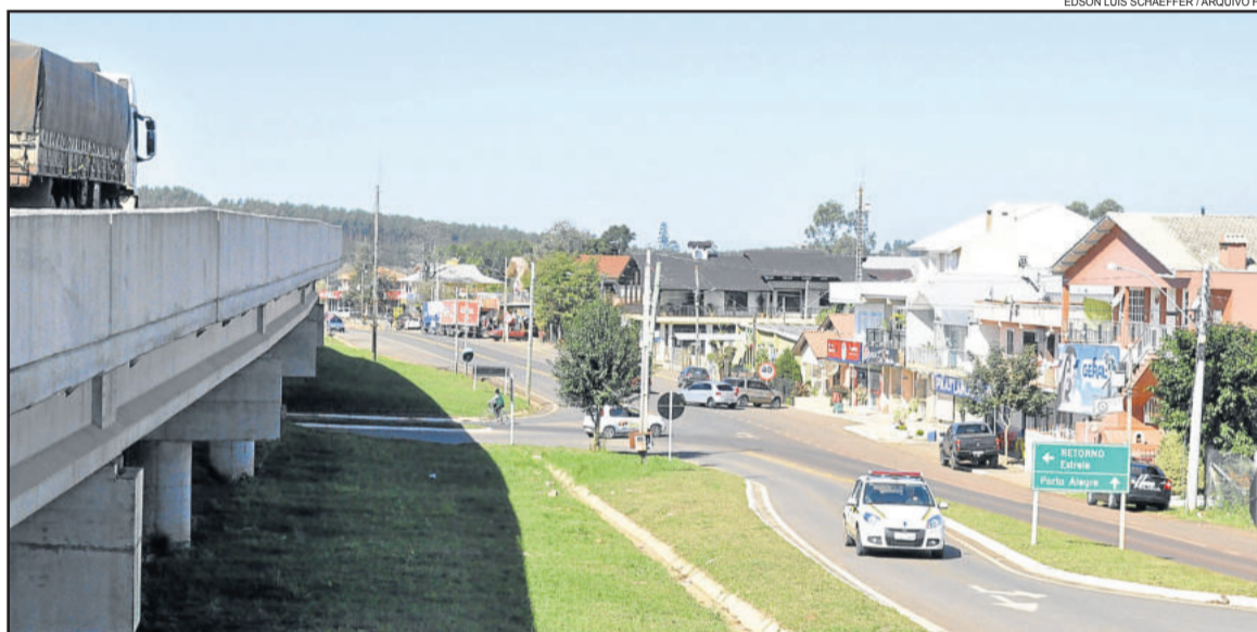
Comunidade quer a reabertura do posto da BM no Município