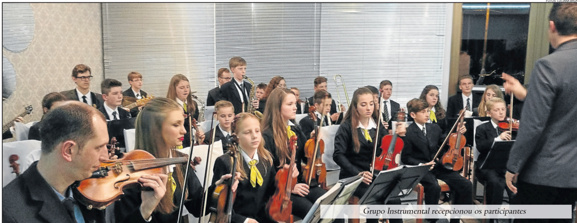
Grupo Instrumental recepcionou os participantes