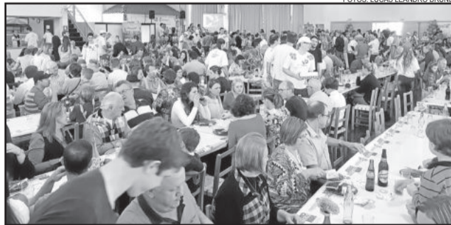
Cerca de 600 pessoas almoçaram no evento