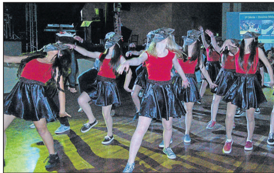
Alunos realizaram apresentações de dança

Após a janta, ocorreram as tradicionais apresentações de danças dos estudantes do CT, envolvendo as turmas do 9º ano do Ensino Fundamental à 3ª série do Ensino Médio, com a participação especial e apresentação de professoras e funcionárias do Colégio Teutônia. Clássicos dos Menudos, Mamonas Assassinas, Roupas Nova, Domínio, ABBA, Village People, Michael Jackson, Rolling Stones e Cumbia empolgaram o público, que aplaudiu de pé as performances. Por fim, teve início o baile, com animação da Banda Cassino.