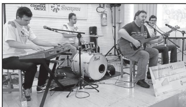
Músicos voluntários fizeram a animação do almoço