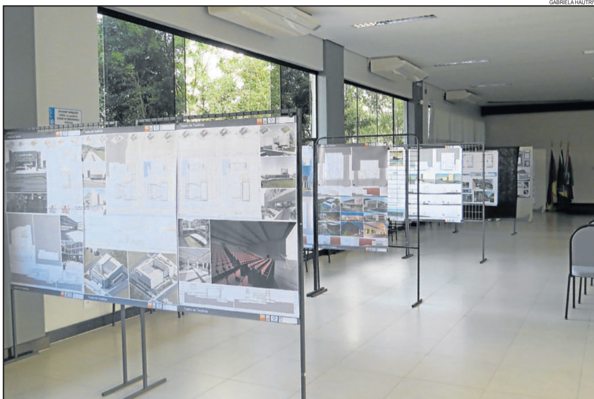
Material ficará exposto até sexta-feira, dia 8, no auditório da CIC Teutônia. Votação popular inicia hoje