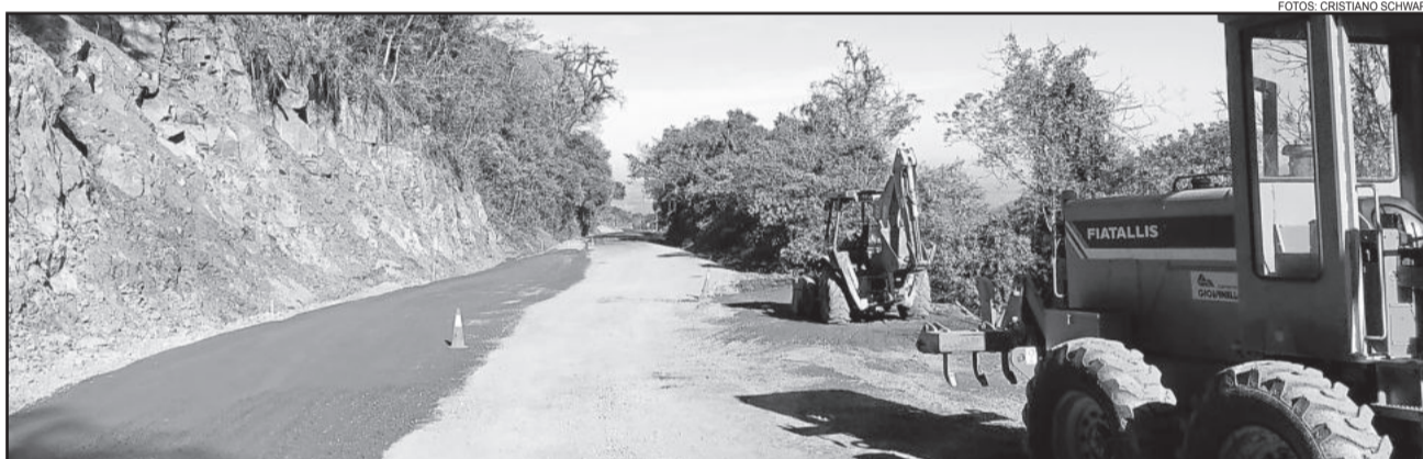
Trecho que desmoronou está sendo recuperado