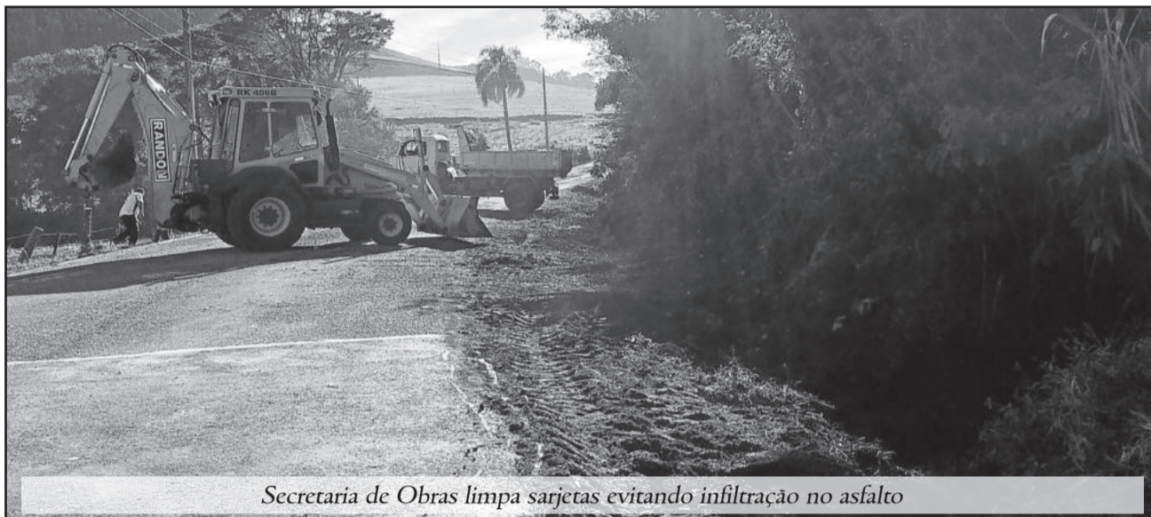
Secretaria de Obras limpa sarjetas evitando infiltração no asfalto

Parte dos recursos: BRDE (Banco Regional de Desenvolvimento Extremo Sul) num total de R$ 500.000,00