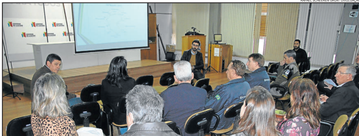
Primeira etapa consiste no diagnóstico regional

O Conselho de Desenvolvimento do Vale do Taquari (Codevat) iniciou o trabalho para elaborar o plano estratégico para os próximos 10 anos da região. A primeira etapa do processo é formatar um diagnóstico regional a partir da matriz FOFA (forças / oportunidades / fraquezas / ameaças) nas áreas econômica, social, ambiental, de infraestrutura e institucional.