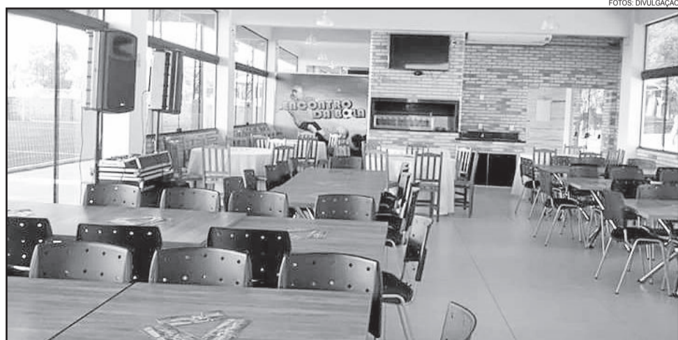
Estrutura interna do Encontro da Bola