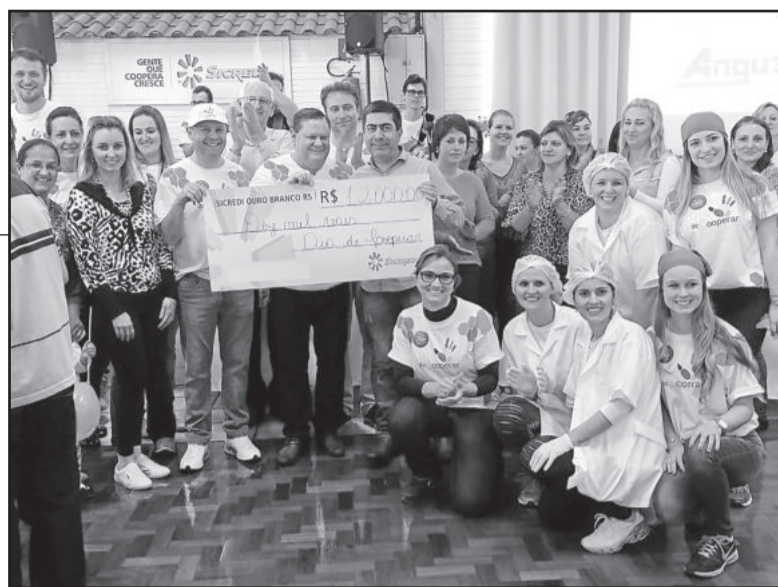
Almoço beneficiou a APAE de Teutônia com R$ 12 mil