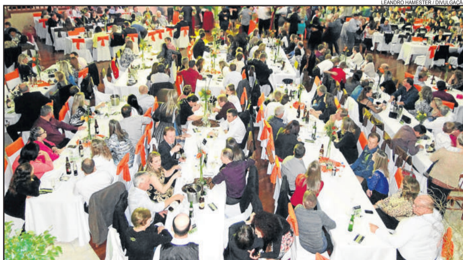
Público lotou as dependências do evento