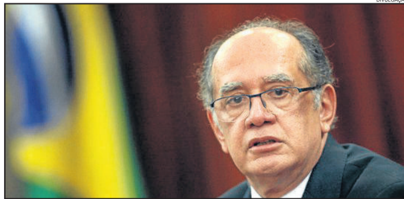
Ministro Gilmar Mendes, presidente do TSE

No que se refere à proibição das doações eleitorais por pessoas jurídicas, o presidente do TSE declarou acreditar que a evolução no processo de prestação de contas eleitorais e a criação de um sistema de inteligência da Justiça Eleitoral servirá para coibir a ocorrência de práticas ilícitas, como o caixa-dois e a manipulação de números de CPF para