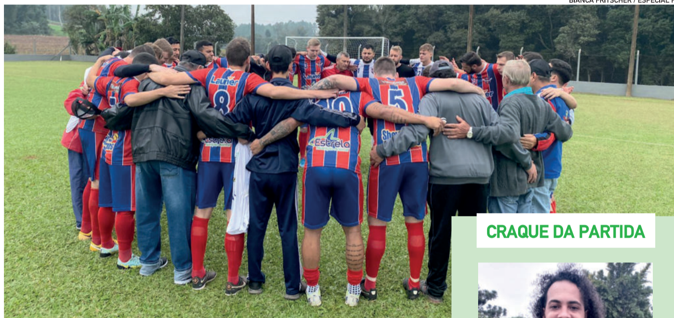
BIANCA FRITSCHER / ESPECIAL FP