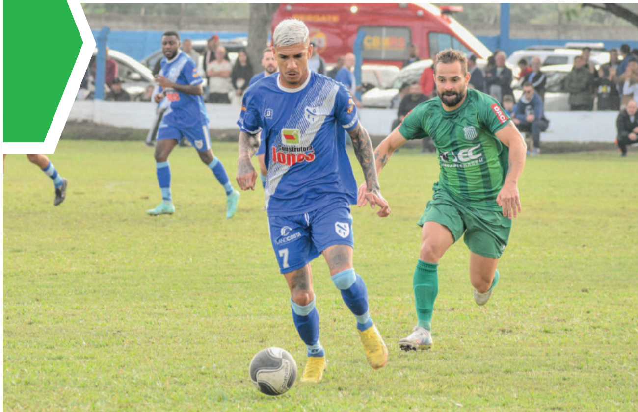
Título foi definido nos pênaltis