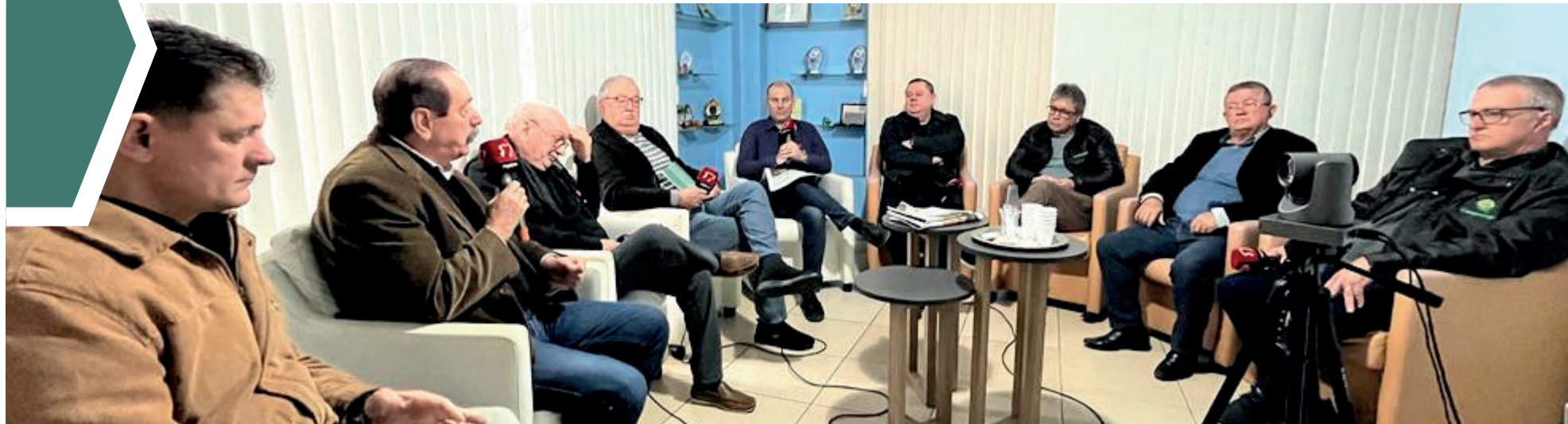
Tema foi abordado durante o Dia Internacional das Cooperativas, no sábado (1º/7)