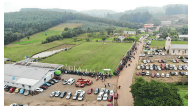
Grande público esteve presente no campo do Gaúcho de Macega