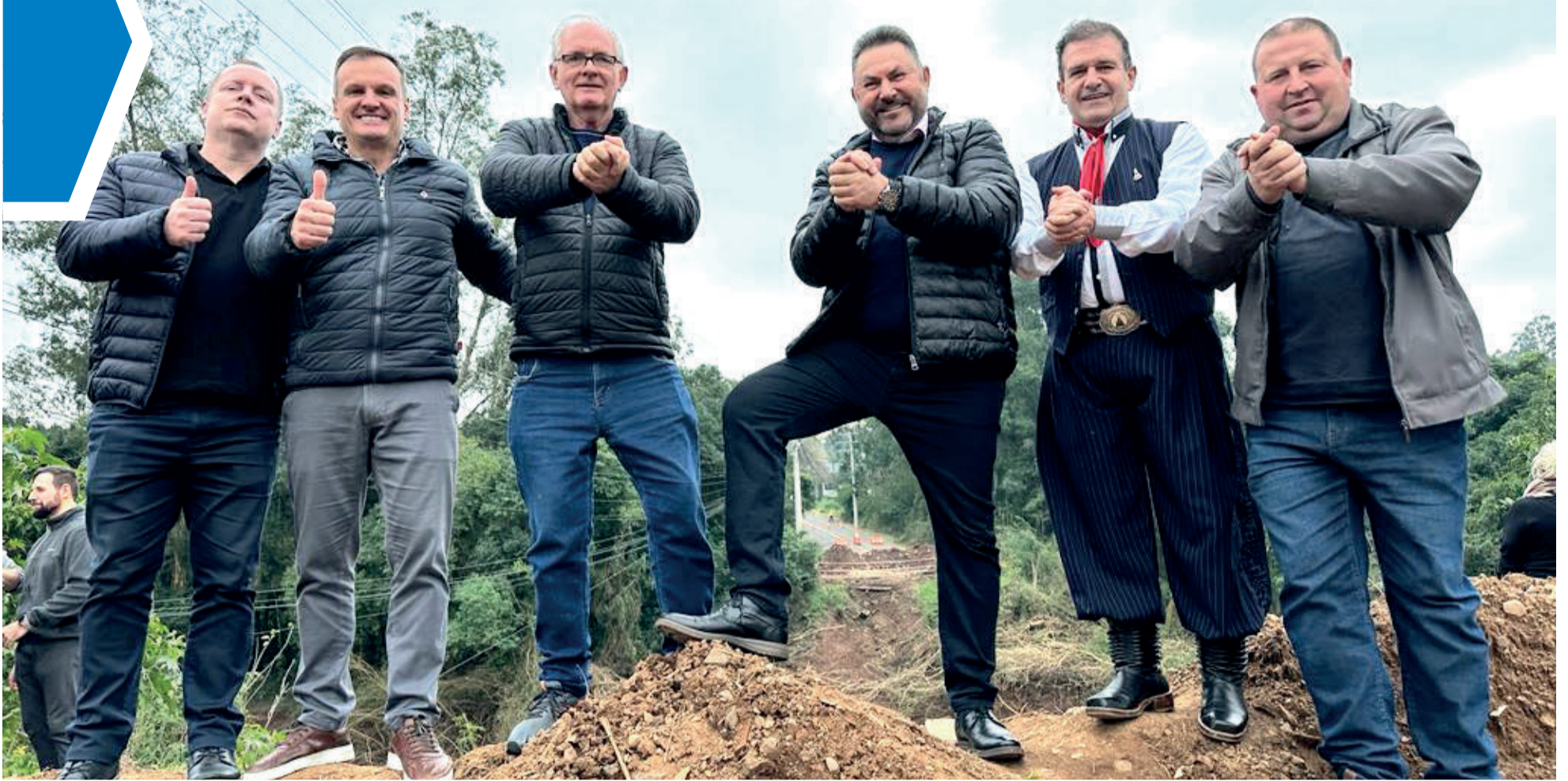
Ordem de início da obra foi assinada no sábado (1º/7) e contou com autoridades locais, regionais e nacionais