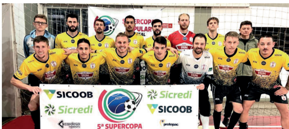
Westfália empatou com o Celtic Teutônia no primeiro jogo