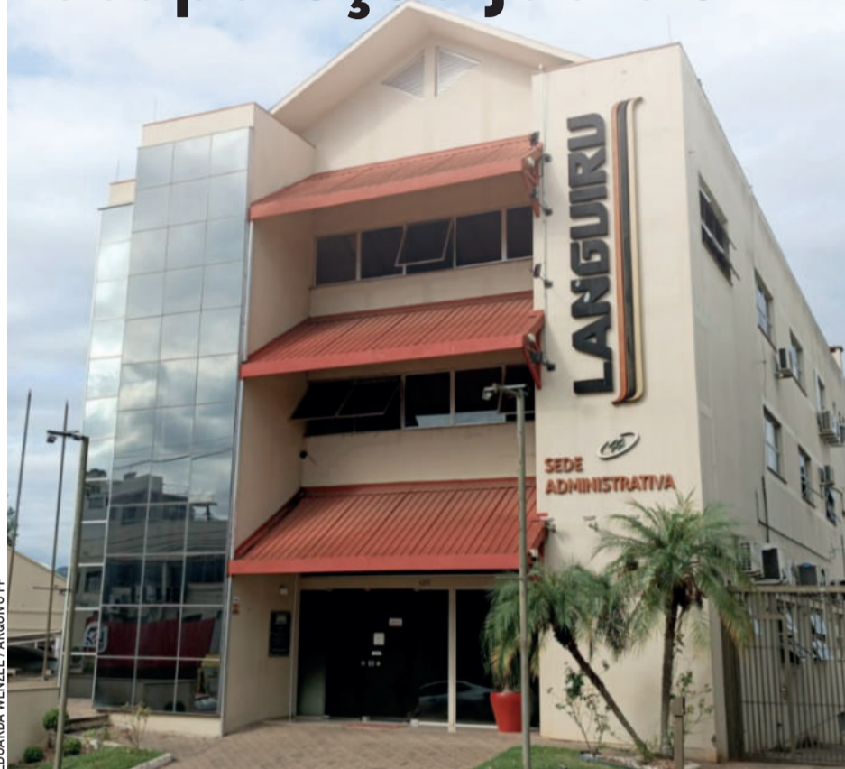
EDUARDA WENZEL / ARQUIVO FP