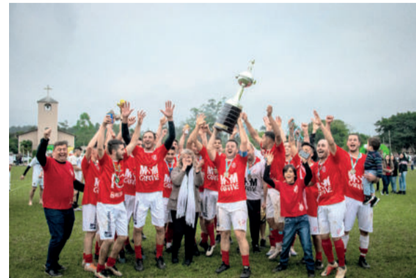
Juventude comemorou a conquista fora de casa