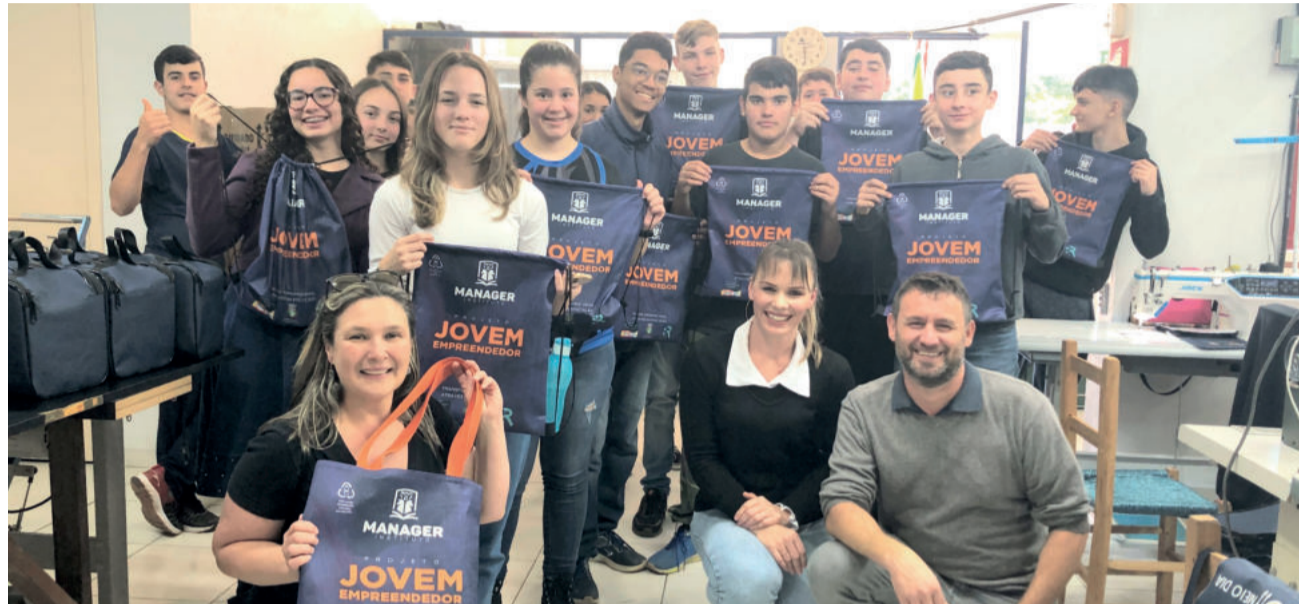
Empresa presenteou estudantes com bolsa personalizada