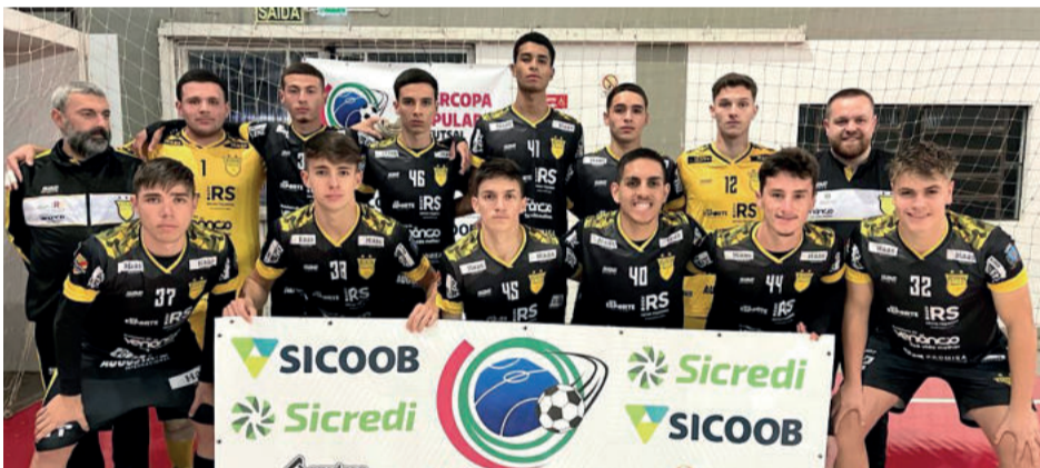
Assoeva Sub-20 de Venâncio Aires soma uma goleada