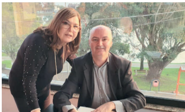
Convidados saíram como o livro Espelho D'água autografado