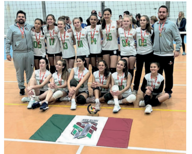
Categoria Mirim ficou com o título da Série Ouro