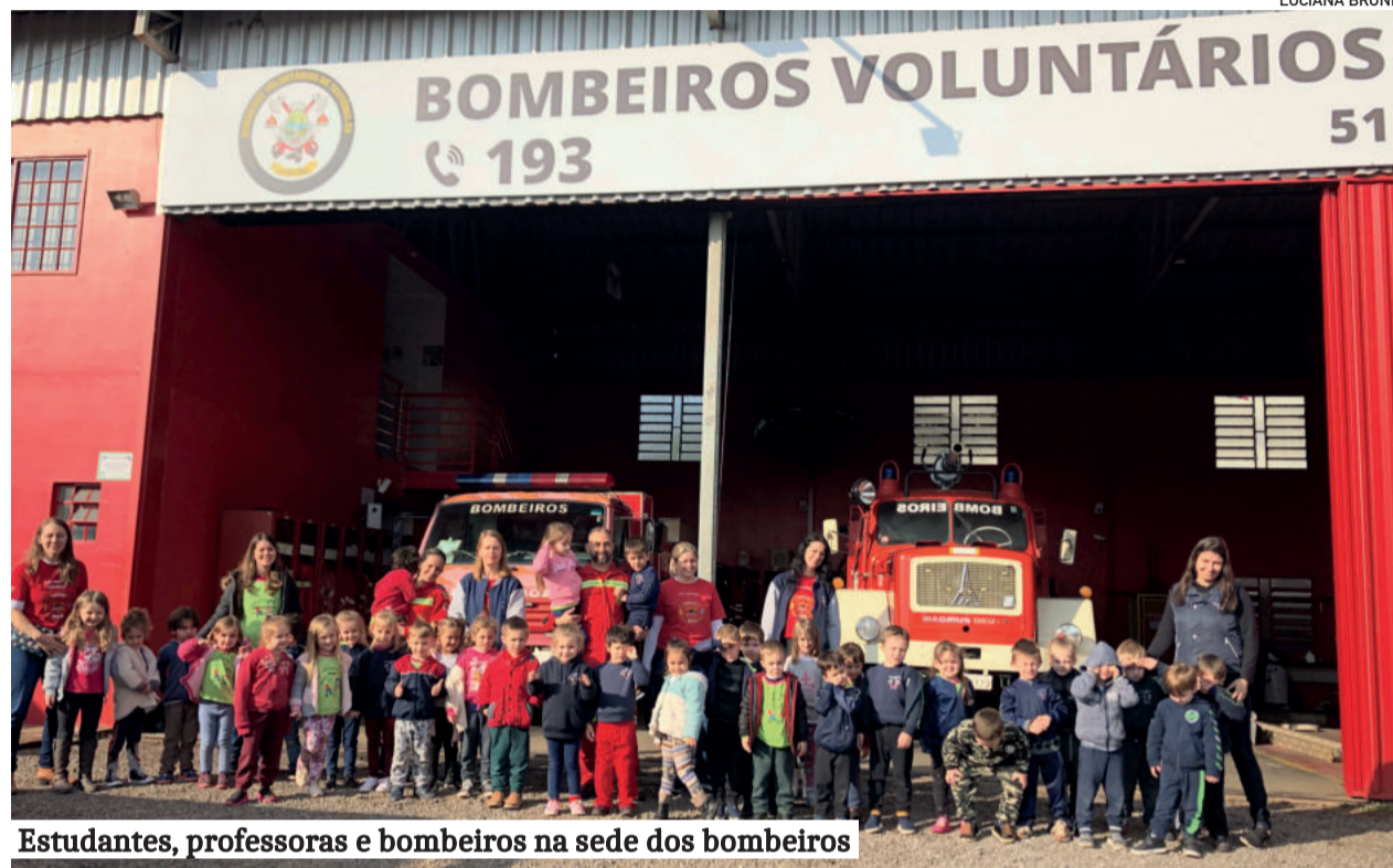
Estudantes, professoras e bombeiros na sede dos bombeiros