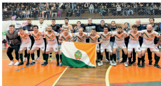
Harmonia está a um empate do título inédito

O jogo de volta acontece nesta sexta-feira (7/7), em Harmonia. A seleção mandante está a um empate de conquistar o título inédito, já que bateu na trave duas vezes em edições anteriores. Paverama precisa da vitória no tempo normal para levar o jogo para a prorrogação, no qual joga pela vantagem do empate por ter a melhor campanha na primeira fase.