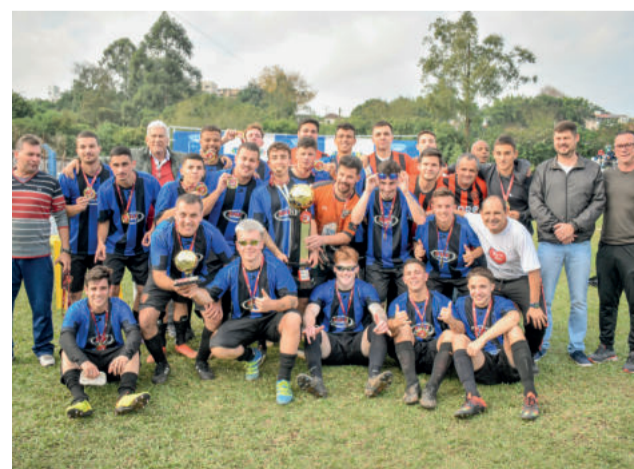
Furacão campeão Aspirantes