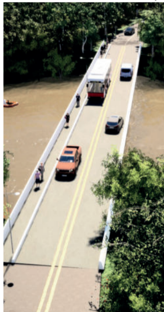
Estrutura terá calçada de passeio com 1,2 metro