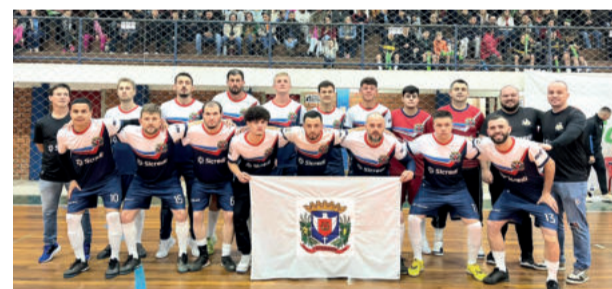
Paverama precisa vencer no tempo normal para levar para prorrogação