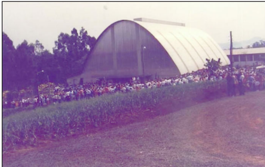
Ginásio Ernani Júlio Sippel, inaugurado em 03 de dezembro de 1989, por muitos anos considerado um dos maiores e mais modernos ginásios de esportes do Vale, local que segue recebendo eventos esportivos e culturais da comunidade em geral

Outro importante capítulo no histórico de investimentos foi a construção do prédio da Educação Infantil, inaugurado no dia 22 de maio de 2004. Construído em forma de castelo, a obra surgiu a partir da necessidade de criar um ambiente identificado com os anseios e o imaginário das crianças, enfatizando o brincar e o conto de fadas, tomados como ponto de partida para a construção do real.