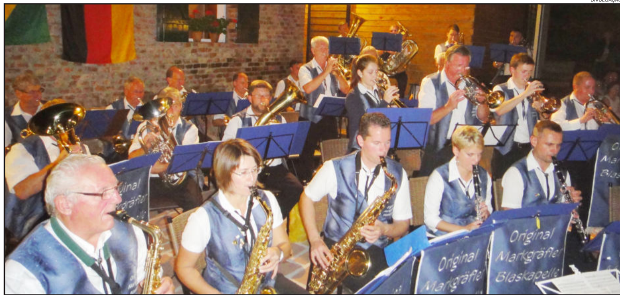
Orquestra Original Markgräfler Blaskapelle

A comunidade de Colinas prestigiou com muita empolgação a apresentação da Orquestra Original Markgräfler Blaskapelle, da cidade de Steinstadt, que fica bem ao sul da Alemanha. O evento ocorreu no pátio da Casa de Pedra do Morreto, junto à Rs 129, no dia 30 de outubro, à noite.