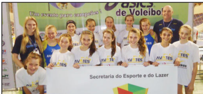
Time mirim ficou com o 12º lugar na Taça Paraná