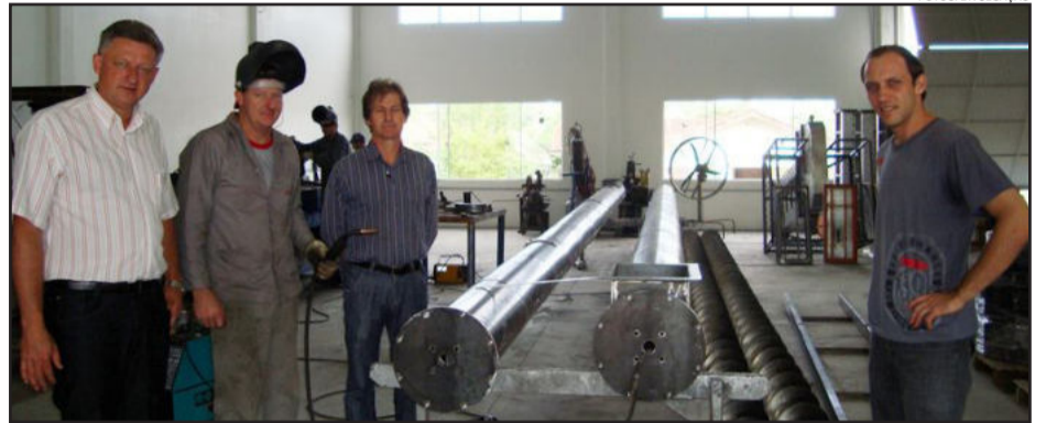
Tecnobach atua no setor metalúrgico