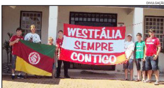
Colorados de Westfália mobilizados pela equipe