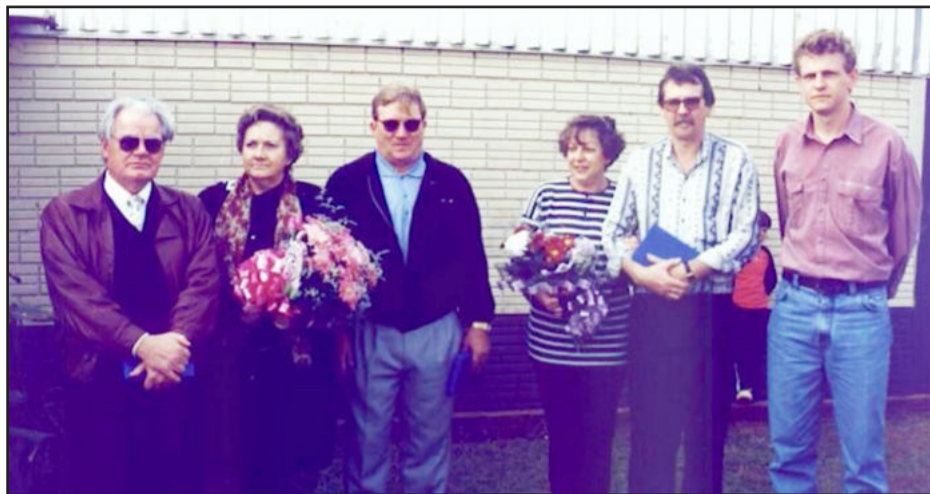
Em outra ocasião, ex-diretores também já haviam sido reconhecidos pela sua dedicação à CNEC/IECEG

ços possibilitou avanços, com terreno doado pela Comunidade Evangélica Redentor, do Bairro Canabarro. E assim, no dia 13 de outubro de 1968 foi lançada a pedra fundamental da nova estrutura escolar. Já na década de 70, com o envolvimento da comunidade escolar, foi concluída a obra de construção do prédio.