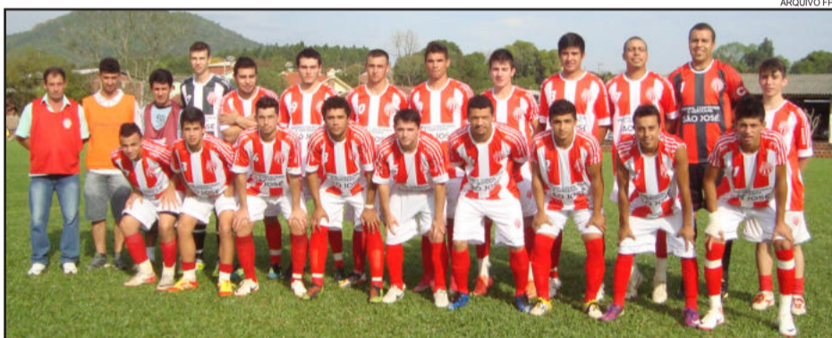
Atlético Gaúcho tem a melhor campanha antes do início desta nova fase

Ribeirense e Ouro Verde jogaram em casa e com um empate se garantiram na fase seguinte, tudo por conta da vitória que obtiveram no primeiro jogo. Quem também se classificou diante de sua torcida foi o Atlético Gaúcho, que venceu ao Avante.