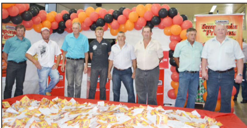
Membros dos conselhos de Administração e Fiscal acompanharam o sorteio

Além deste, ainda serão realizados mais três sorteios: o segundo no Supermercado Languiru do Bairro Canabarro, Teutônia, dia 13 de novembro; o terceiro no Supermercado Languiru de Bom Retiro do Sul, dia 30 de novembro; e o quarto e último sorteio no Supermercado Languiru do Bairro Languiru, Teutônia, no dia 28 de dezembro. Ao todo são 14 prêmios, entre televisores de led, vale-compras de R$ 500,00, R$ 750,00 e R$ 1.000,00, uma moto CG 125 Fan KS zero quilômetro, e uma caminhonete Fiat Strada Fire 1.4, flex, zero quilômetro. Todos os cupons contemplados num sorteio participam dos sorteios seguintes.