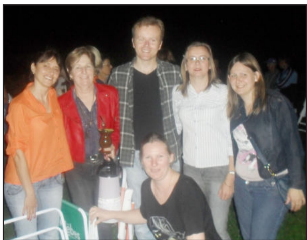
Público aproveitou o momento de integração