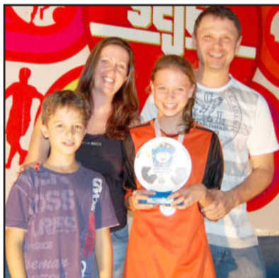
Família Porsche comemora a conquista no esporte