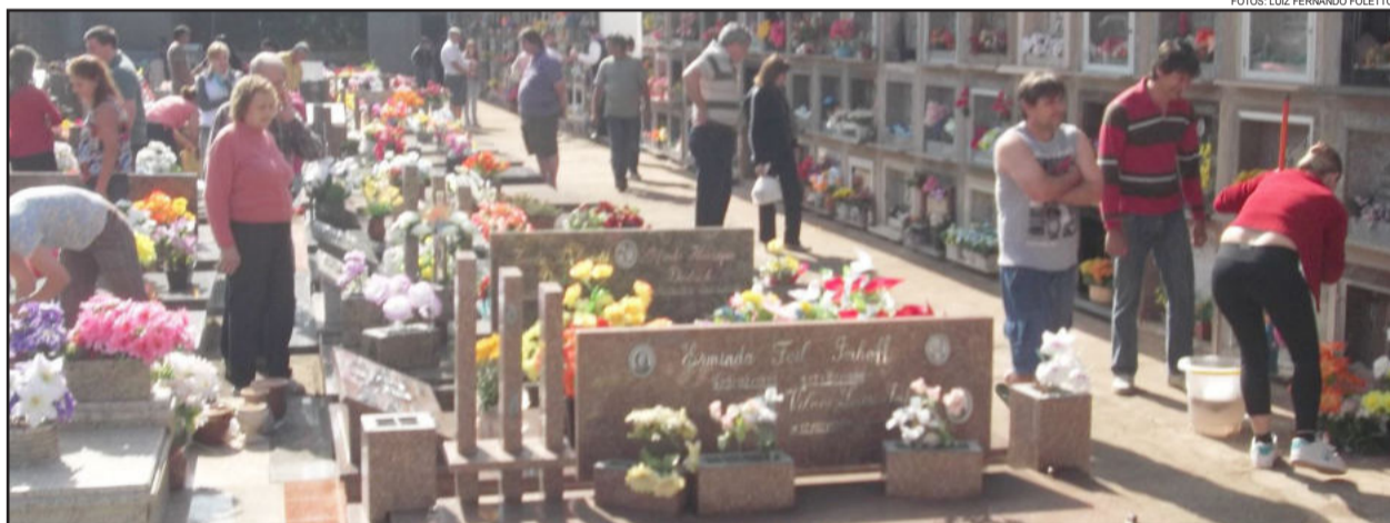
A maioria das pessoas aproveitaram a parte da manhã para ir ao cemitério

A sexta-feira de Finados foi de tempo bom para as pessoas visitarem os entes queridos que já se foram em todos os cemitérios da região. Em Lajeado, cerca de 3 mil pessoas foram ao Cemitério Católico do Bairro Florestal, o maior da cidade, para prestar homenagens.