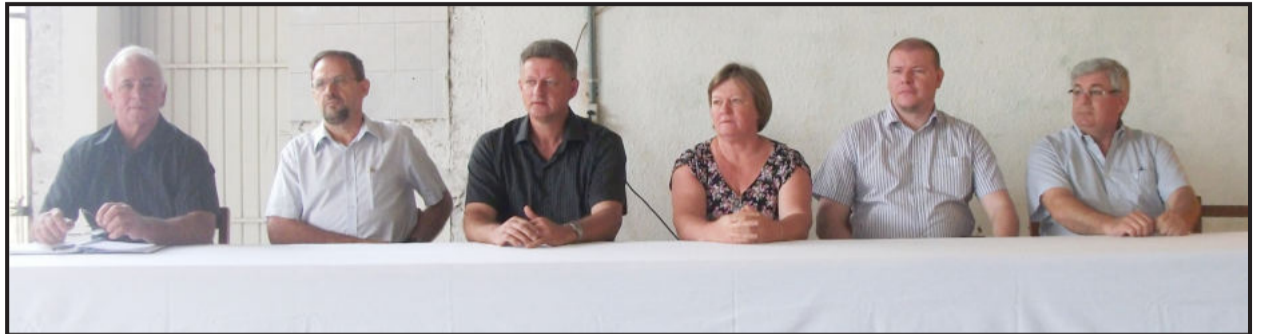
Autoridades estiveram presentes ao evento

A Cooperativa Adroindustrial São Jacó (Cooperagri), de Teutônia, comemorou no sábado, dia 03 de novembro, 5 anos de trabalho e cooperação junto com seus associados. Nesta data especial, muitas autoridades se fizeram presentes para homenagear a cooperativa por mais um aniversário.