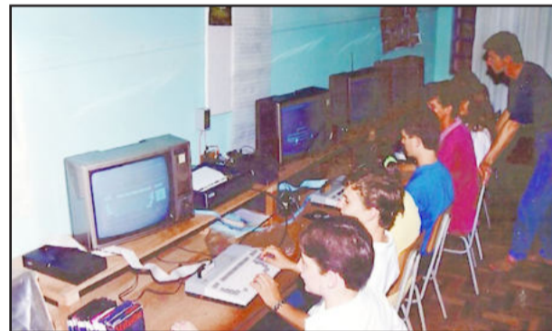
Na área da informática, a CNEC/IECEG foi primeira escola teutoniense a implantar computadores, isso no ano de 1985

Ao longo deste meio século, a CNEC/IECEG já teve outras nomenclaturas. Já foi Ginásio Comercial Canabarro, Escola Evangélica General Canabarro, Escola Cenequista General Canabarro, Escola Cenequista de 1º e 2º Graus General Canabarro e, em 1999, em virtude das mudanças nas leis de ensino, foi denominada de Escola Cenequista de Ensino Médio General Canabarro. Passados mais quatro anos, em 19 de março de 2003 o Conselho Estadual de Educação autorizou o funcionamento dos cursos Técnico em Administração, Normal com Aproveitamento de Estudos e Normal Nível Médio. Com o ingresso nesse novo patamar na área da educação, a escola recebe a nova denominação que vigora até os dias de hoje: Instituto de Educação Cenequista General Canabarro.