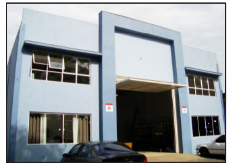
Tecnobach está instalada desde setembro no Bairro Teutônia