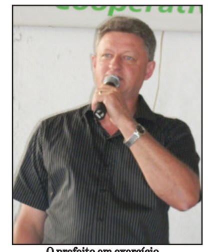
O prefeito em exercício Ariberto Magedanz

Também esteve presente no evento o vice-prefeito, no cargo de prefeito, de Teutônia, Ariberto Magedanz, que falou em nome da Administração Municipal e aproveitou o momento para cumprimentar a Cooperagri pelos 5 anos de fundação. "Nós, que nos intitulamos a 'Terra do Cooperativismo', sabemos que o sucesso e o desenvolvimento do nosso município de Teutônia deve-se, em grande parte, ao cooperativismo. E, aqui na São Jacó, temos um exemplo bem prático disso, onde as pessoas se reuniram e, a 5 anos atrás, fundaram a Cooperagri. Então, estou aqui para deixar o nosso abraço e também colocar a Administração Municipal à disposição, como sendo uma das parceiras deste grande projeto. A São Jacó está de parabéns por ter organizado um grupo de agricultores para fundar a cooperativa", parabenizou Ariberto Magedanz.