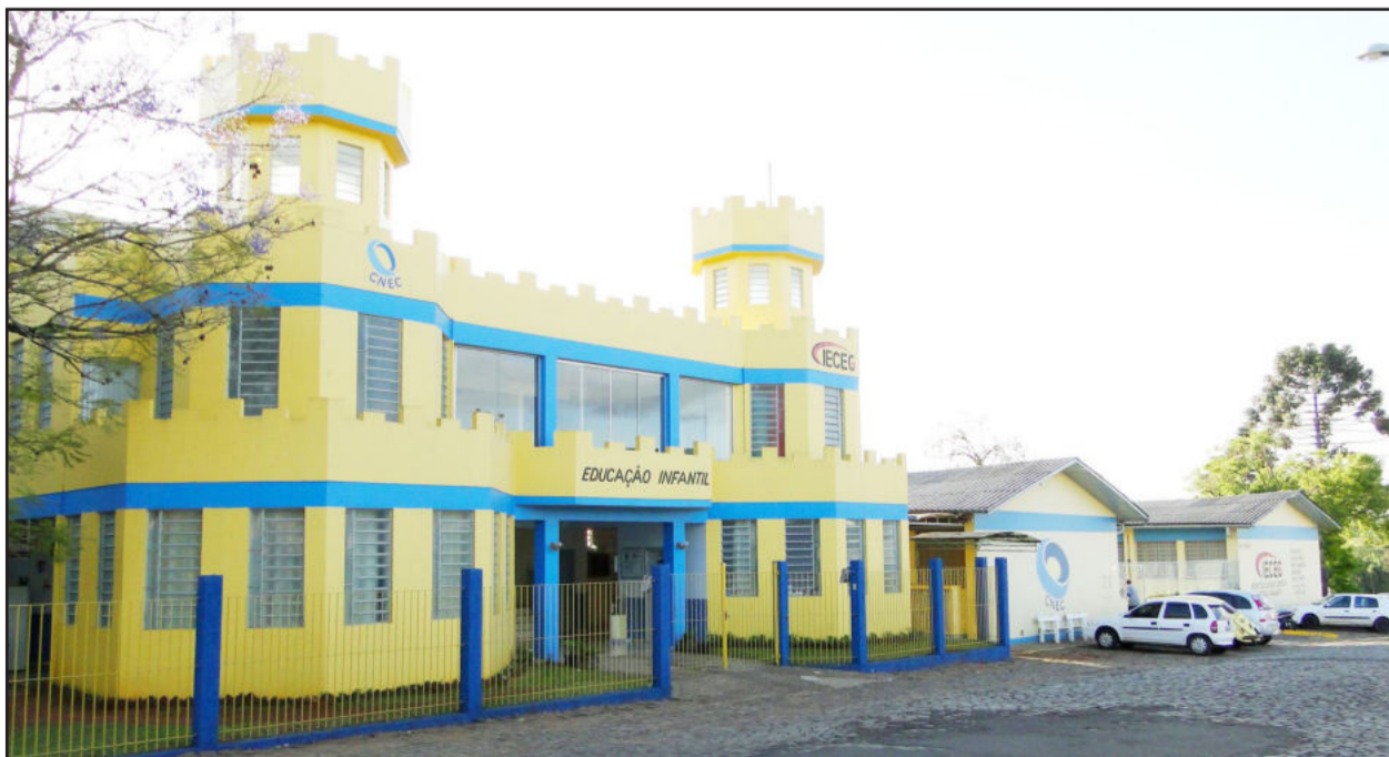
Fachada atual da escola no Bairro Canabarro, com o Castelo da Educação Infantil e acesso principal às salas de aula e Secretaria