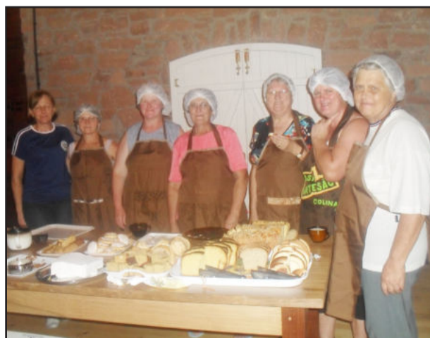
Elas cuidaram da culinária