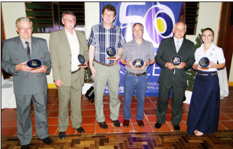
Ex-diretores e atual diretora homenageados no Jantar-Baile de 50 anos

O dia 09 de novembro é uma data mais do que especial para o Instituto de Educação Cenequista General Canabarro (IECEG), de Teutônia. Neste dia, o educandário integrante da Campanha Nacional de Escolas da Comunidade (Rede CNEC) completa suas “bodas de ouro”. São 50 anos de história e de Compromisso com a Educação.