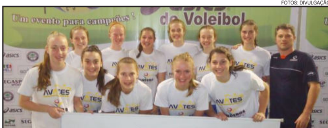
Com a categoria infanto-juvenil veio a melhor colocação da Avates na competição em 2012, o 5º lugar

O CML representará o Rio Grande do Sul na Olimpíada Nacional, na cidade de Cuiabá, de 28 de novembro à 4 de dezembro com a equipe de 15 à 17 anos.