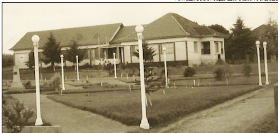
Primeiras salas de aula foram instaladas em prédio cedido pela extinta Escola Evangélica General Canabarro