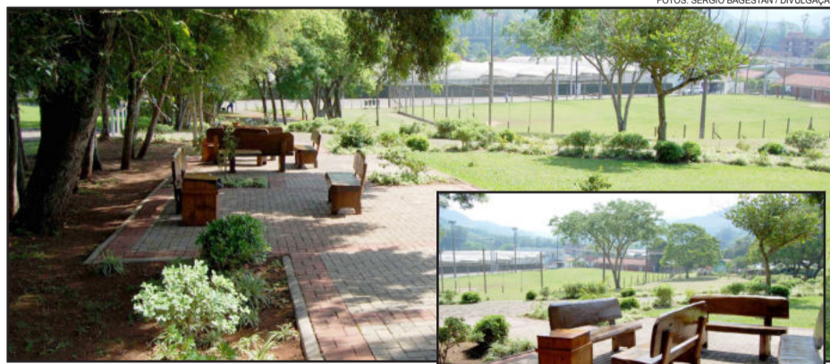
Local é aprazível com muita sombra

No final do ano de 2011 o local recebeu excelente público que prestigiou o Espetáculo Natalino, programação que deverá se repetir no próximo dia 23 de dezembro.