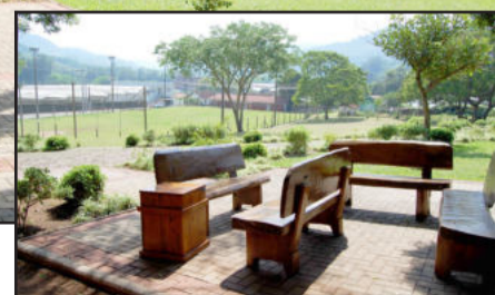
Praça Municipal é elogiada pelos turistas