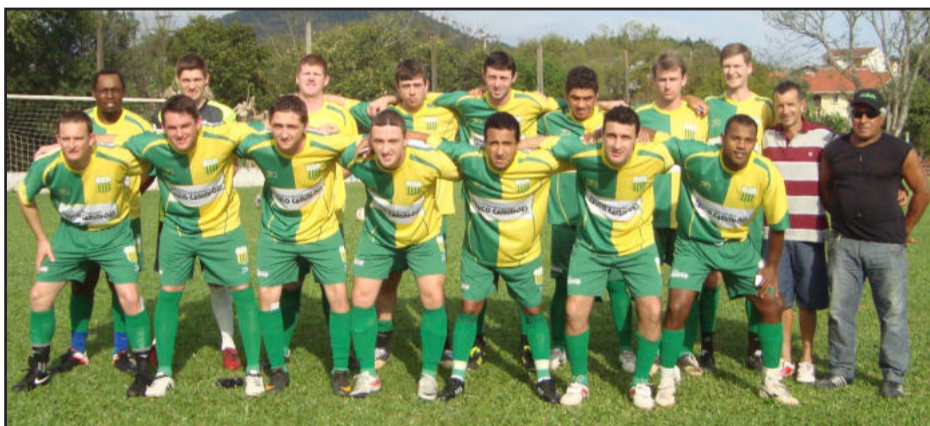
Ouro Verde conquistou vaga às quartas-de-final com um empate em casa