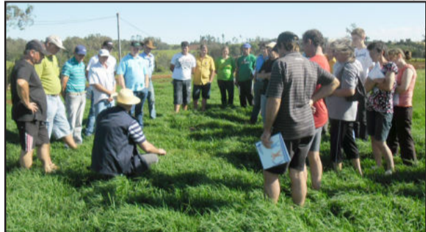
O encontro também possibilitou demonstrações práticas, como o manejo adequado da pastagem