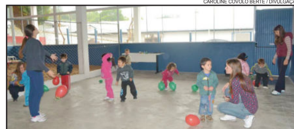
Inscrições para EMEIs estão abertas até o dia 23