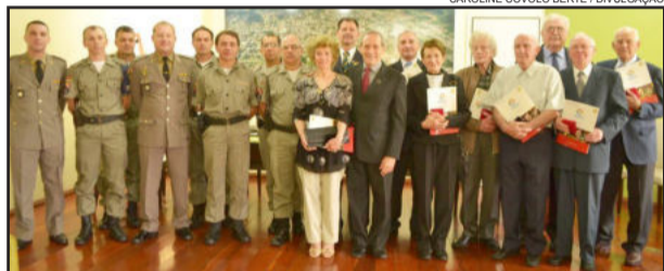
17 personalidades que se destacam na história do município foram homenageadas