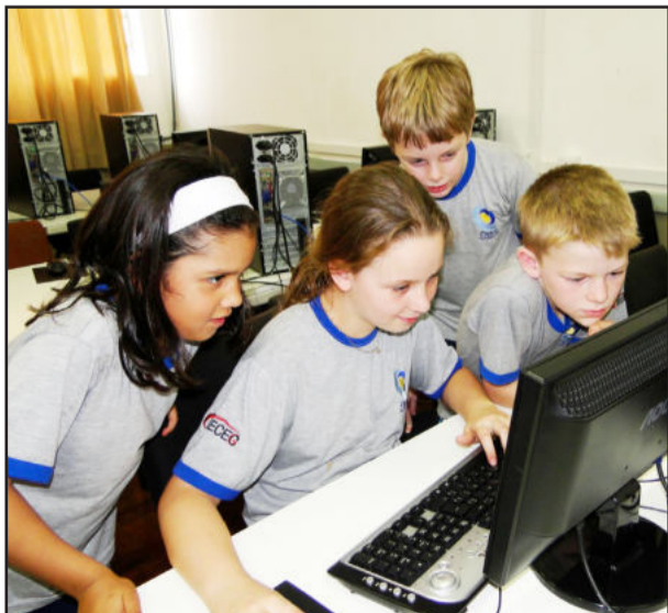
Em 50 anos, muitas melhorias, com destaque para a evolução tecnológica

Importante capítulo no histórico de investimentos foi a construção do prédio da Educação Infantil, inaugurado no dia 22 de maio de 2004