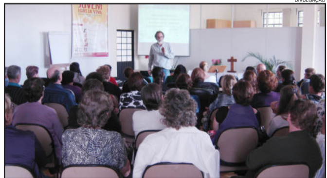
Grupos de Saúde Comunitária do Vale do Taquari trabalharam boas práticas com abelhas