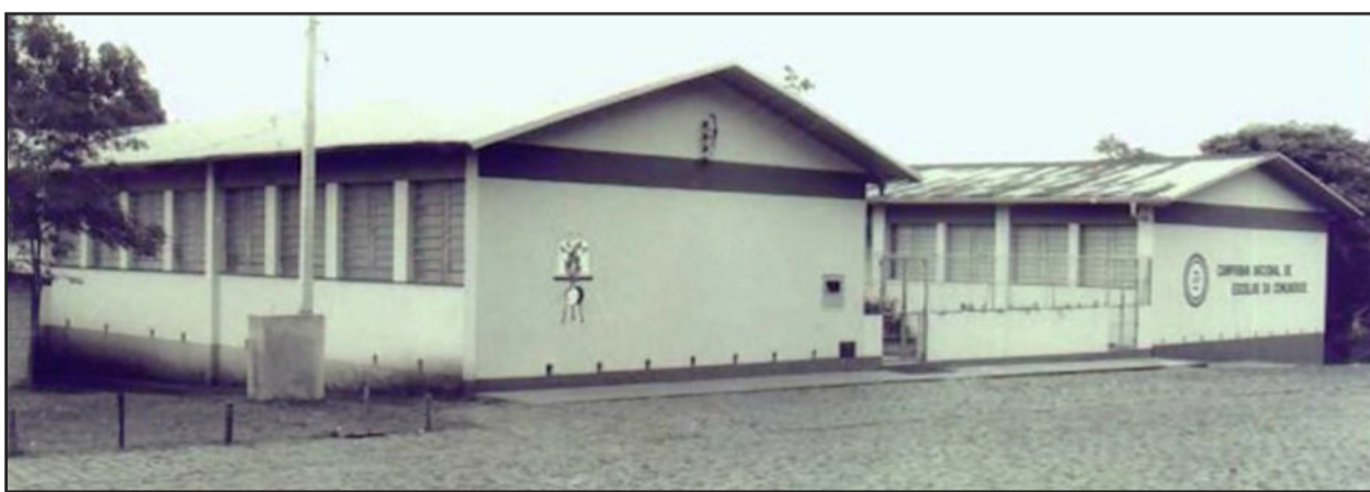
Antiga fachada da escola, local onde ainda hoje está sediada a CNEC/IECEG