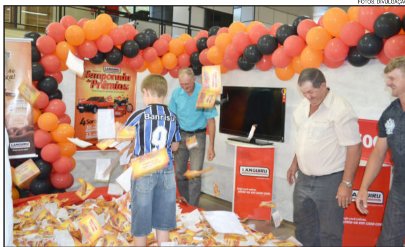
Mais de 540 mil cautelas concorreram neste primeiro sorteio

Em seguida, foram conhecidos os primeiros contemplados da campanha.