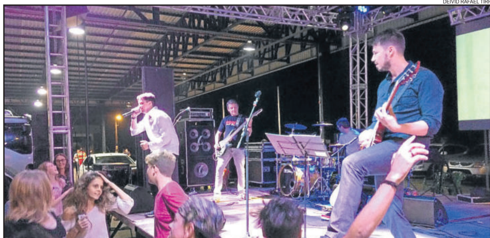
Rock and Beer