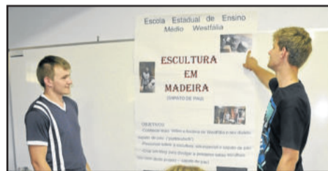
Estudantes do 3º Ano do Ensino Médio apresentaram seus projetos à comunidade escolar

Quando os jovens chegam ao Ensino Médio, é criado um mapa conceitual com diversos eixos de pesquisa. É através dele (mapa) que os jovens se identificam com alguma área em específico e iniciam o estudo, que tem uma duração de três anos.