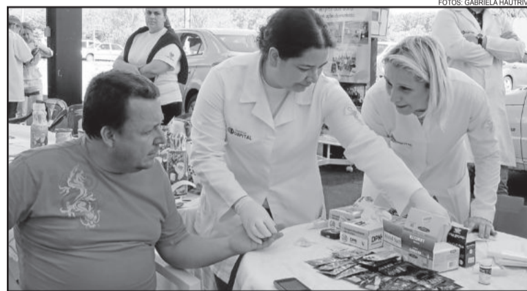
HOB ofereceu serviços durante o evento