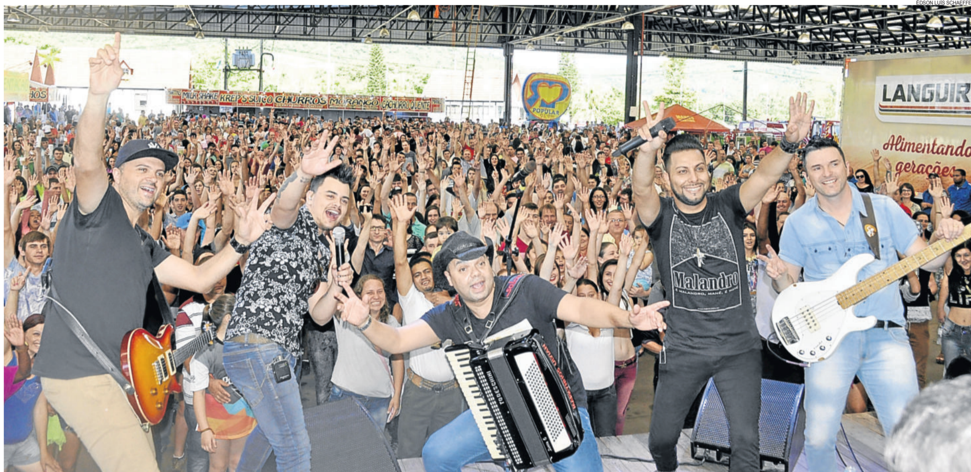
Evento ocorreu sábado e domingo, dias 3 e 4, no Pavilhão Multiuso, junto ao Centro Administrativo de Teutônia. Tchê Garotos (foto) foi uma das atrações no segundo dia de festa. TEUTÔNIA > 6 A 9