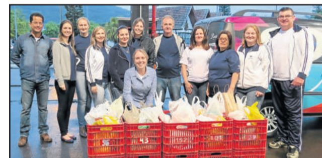
Equipe de voluntários do HOB recebeu doações e ofereceu mutirão de saúde

Ela também acredita que esse seja o momento de agradecer a comunidade por toda a ajuda. “Com certeza temos que agradecer a comunidade que ajuda o Hospital Ouro Branco, que tem passado por esse momento tão difícil”, conclui.