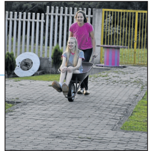
Disputa de carrinho de mão com sapato de pau foi uma das atividades que integrou os estudantes das demais séries