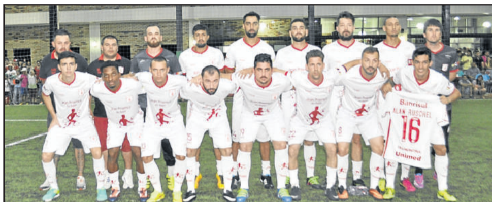
Malditos, de Sapucaia do Sul, começaram ganhando, mas tomaram a virada