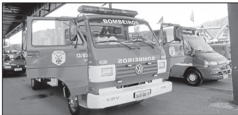
Bombeiros Voluntários marcaram presença com veículos e parte da estrutura de trabalho