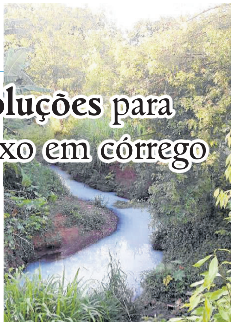
Moradores relatam cheiro ruim e água branca no córrego