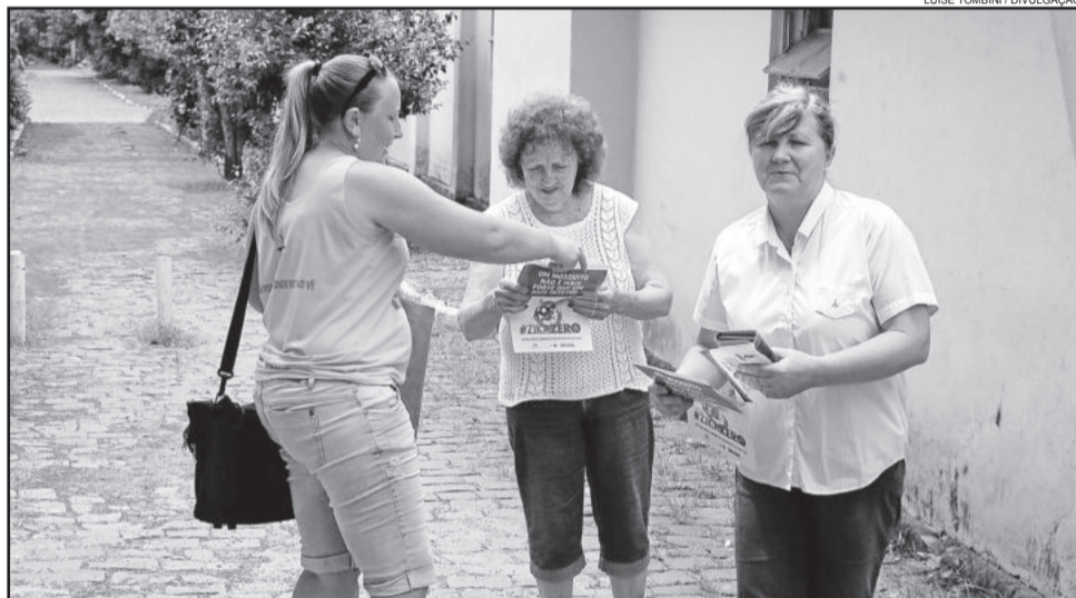
Agente de Saúde orienta população de Imigrante, que registrou larvas do aedes