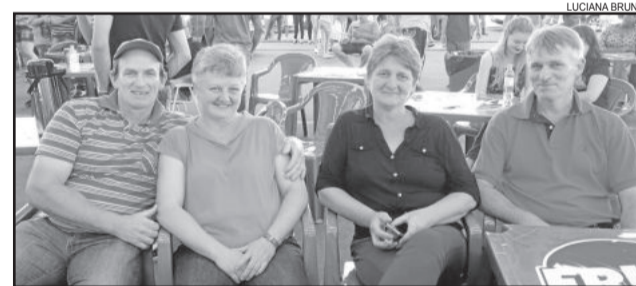
Casais de Imigrante, de Linha Imhoff e Castro Alves, prestigiando o Natal do Povo