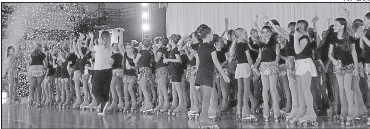
200 atletas participaram das apresentações

Estiveram presentes no evento, grupos de Teutônia, Poço das Antas, Lajeado e Arroio do Meio