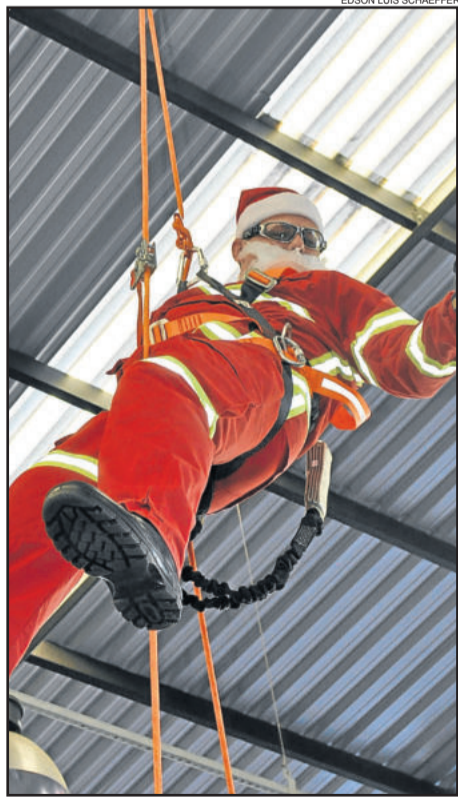
Papai Noel desceu de rapel para receber o carinho das crianças no Natal do Povo