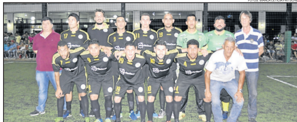
AABBOC goleou na final e ficou campeã da 1ª Copa Encontro da Bola