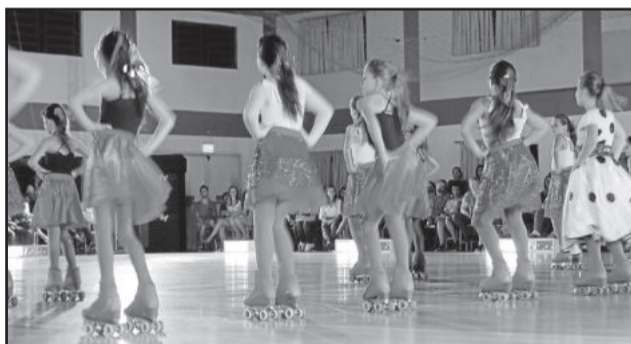
Evento mostrou as habilidades e talentos dos patinadores

(IECEG/ CENEC), apresentou duas turmas, uma infantil e outra juvenil. O Colégio Teutônia levou 18 meninas para as apresentações, além de uma turma de Poço das Antas, que iniciou as atividades esse ano. Outros 40 atletas vieram das cidades de Lajeado e Arroio do Meio.