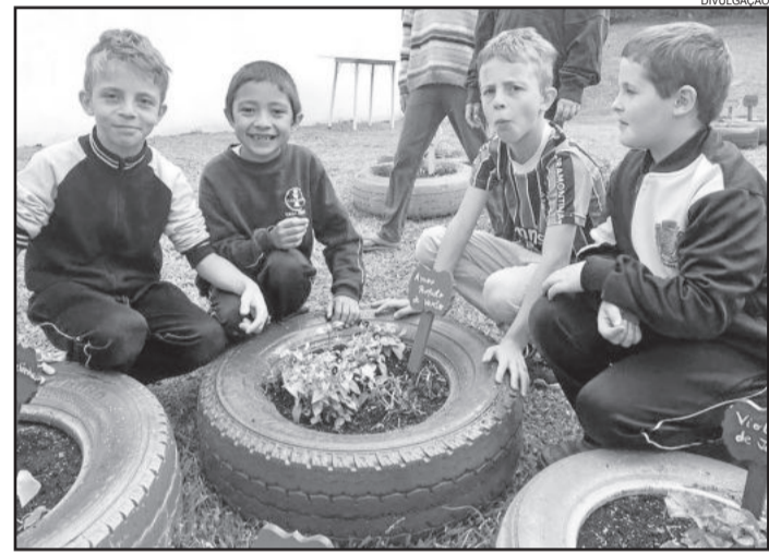
Crianças usuárias do Cras interagem nos canteiros