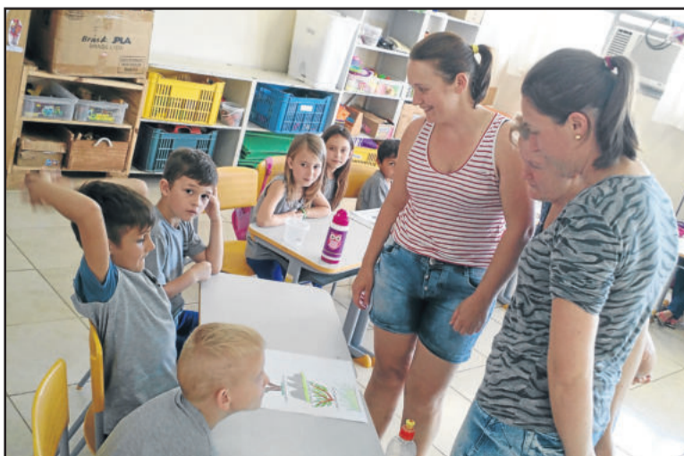
Alunos apresentaram projetos à comunidade escolar

O projeto Jovem Cientista foi desenvolvido desde o início deste ano nos quatro educandários. Nas demais escolas, os resultados também foram apresentados.