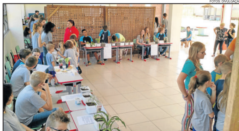
Projeto Jovem Cientista foi desenvolvido durante o ano