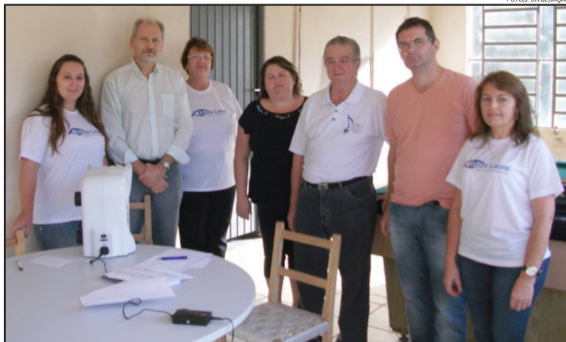
Equipe da Ótica Lauro, de Estrela, presidente e vice-presidente do IHU e autoridades municipais estiveram presentes na realização do teste de visão