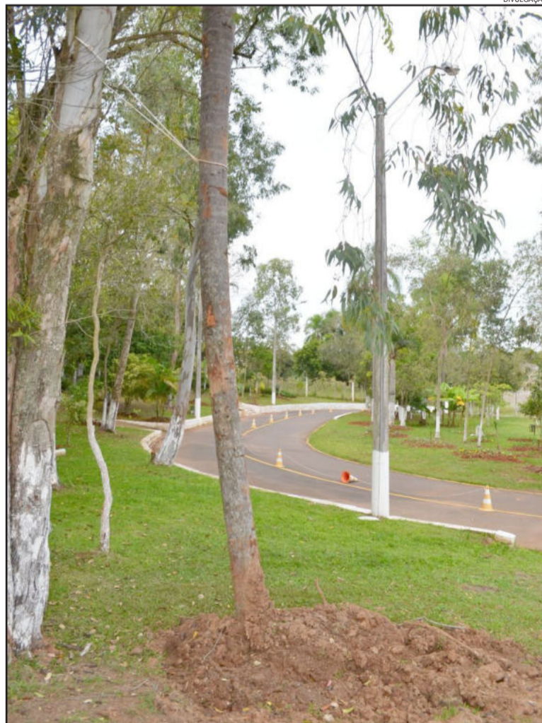
Árvores estão sendo transplantadas para o Parque Pôr do Sol

Para que as obras do PAC 2 em Bom Retiro do Sul sigam os padrões de sustentabilidade e respeito ao meio ambiente, a Secretaria de Agricultura e Meio Ambiente, em parceria com a Secretaria de Obras, Viação, Urbanismo e Trânsito e a Conpasul - empresa que está realizando parte das melhorias -, realizou o transplante de árvores que estavam dentro da área das obras no Bairro São Francisco. As árvores retiradas foram transplantadas para o Parque Pôr do Sol.