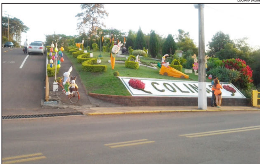
Os enfeites ficarão expostos para visitação até o dia 14 de abril

Além disso, neste fim de semana, hoje e amanhã, domingo, ocorre a Feira do Artesanato na Praça dos Pássaros. Será uma oportunidade das pessoas conhecerem o que é produzido artesanalmente pela comunidade de Colinas e comprar peças diferentes e exclusivas para decoração e diferentes utilidades para o lar, além de inúmeras sugestões que podem ser usadas como presente, para diferentes ocasiões.