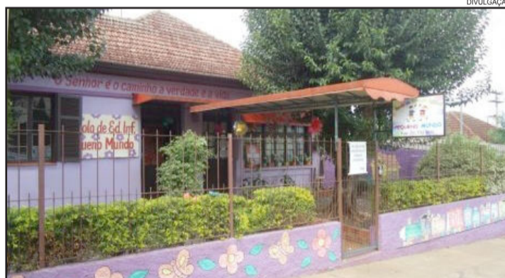
Escola Pequeno Mundo

Qualquer pessoa interessada em auxiliar pode contatar a escola. As professoras necessitam, principalmente, de recursos financeiros para viabilizar a proposta e construir esta brinquedoteca móvel. O contato da Escola de Educação Infantil Pequeno Mundo é 3762-8632.