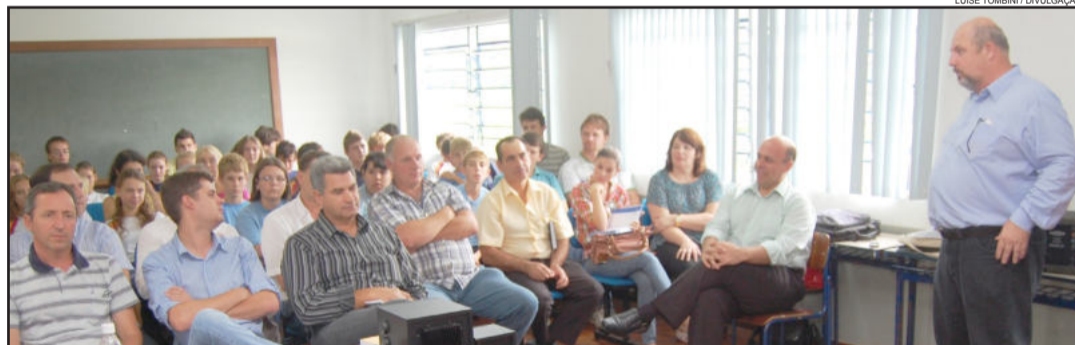
Encontro foi organizado pela Administração Municipal de Imigrante e ocorreu na Escola Estadual 25 de Maio

Além de Imigrante, estiveram presentes representantes dos municípios de Boa Vista do Sul, Progresso, Roca Sales, Lajeado, Taquari, Westfália, Arroio do Meio e Fazenda Vilanova. Também participaram estudantes de escolas do município.