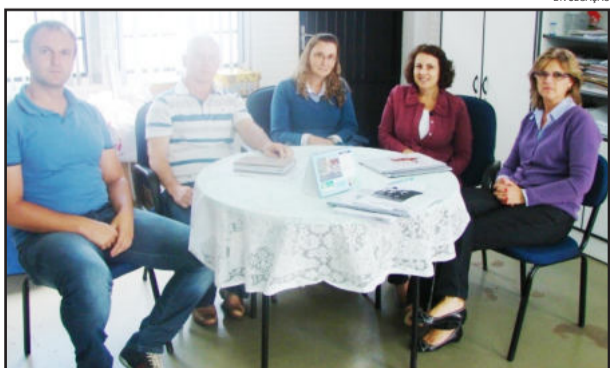
Comitiva de Roca Sales conheceu trabalhos de Teutônia na área da Educação

O encontro serviu para a troca de experiências e realidades de cada município na área da educação. Roca Sales obteve referências positivas de Teutônia e a equipe veio buscar informações do Proinfância, do EJA, do turno inverso e do plano de carreira.