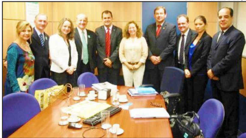
Prefeito integrou a Comitativa do Turismo do RS participando de reunião com o Secretário Nacional de Programas e Desenvolvimento do Ministério do Turismo, Fábio Mota

Conforme Keller, Crivella parabenizou a Administração Municipal pela criação do programa e colocou-se à disposição para conhecer a realidade do setor no município de Colinas. Participaram ainda da reunião os prefeitos de Doutor Ricardo, Poço das Antas, Boa