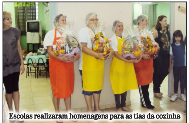
Escolas realizaram homenagens para as tias da cozinha