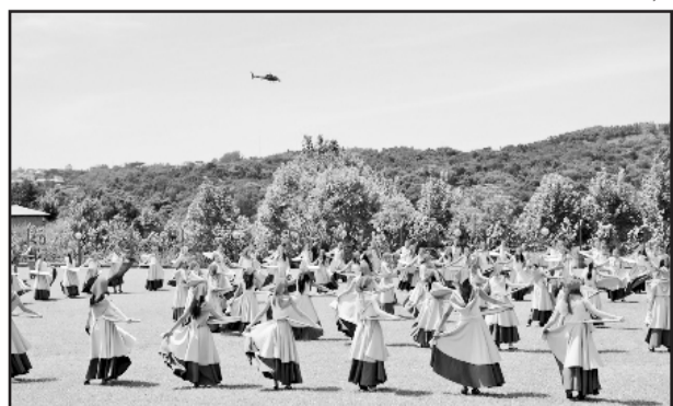
Ensaio está em andamento para uma boa performance

Bento Gonçalves é a única cidade do Sul do país a participar desta segunda edição do quadro, ao lado de Coruripe (AL), Cruzeiro do Sul (AC), Botucatu (SP), Guarapari (ES) e Corumbá (MS). As cidades participantes serão divididas em confrontos que vão decidir o prêmio de R$ 100 mil para a Pastoral da Criança local. O vice leva R$ 25 mil para a mesma instituição. O vencedor é definido pela votação do público por telefone, SMS e pelo site do Faustão.