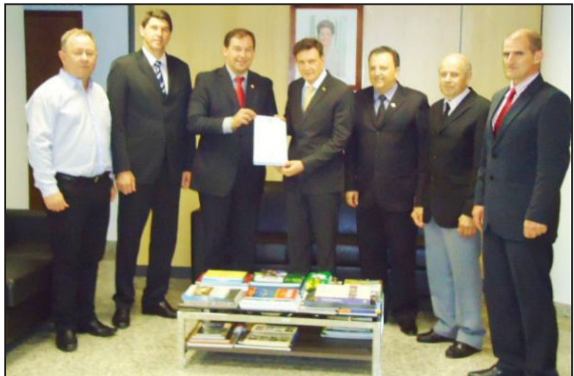
Ministro do MPA, Marcelo Crivella, recebeu comitiva regional