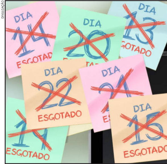
Não há mais ingressos para o Rock in Rio 2013

Em pouco mais de 4h de vendas, todos os ingressos para os sete dias do Rock in Rio 2013 já haviam sido vendidos. A venda iniciou às 10h desta quinta-feira, dia 04, pela internet e às 14h15min do mesmo dia a produção do evento anunciou que todos os ingressos estavam esgotados.