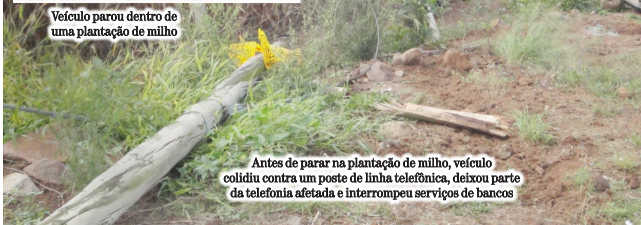
Antes de parar na plantação de milho, veículo colidiu contra um poste de linha telefônica, deixou parte da telefonia afetada e interrompeu serviços de bancos