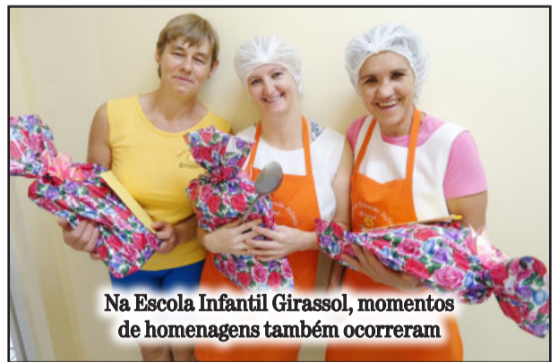
Na Escola Infantil Girassol, momentos de homenagens também ocorreram