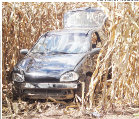
Veículo parou dentro de uma plantação de milho