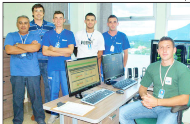
COG monitora hidrelétricas da cooperativa