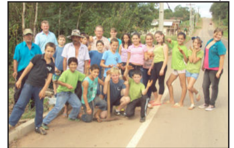
Secretário, Professores, Servidores e Alunos envolvidos no projeto