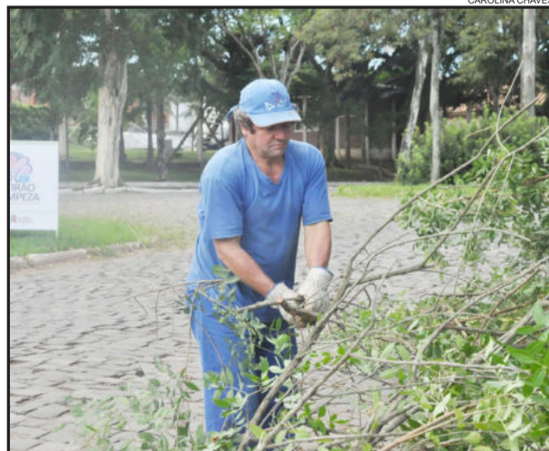
Cerca de 30 funcionários da Seaab trabalham no local