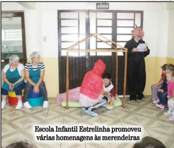
Escola Infantil Estrelinha promoveu várias homenagens às merendeiras