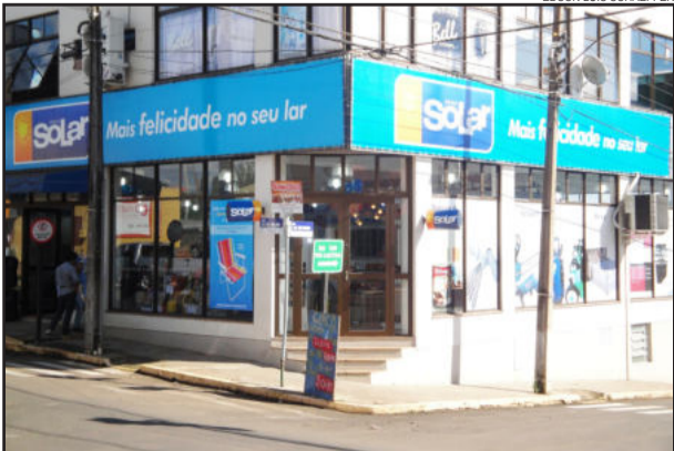
Loja Solar reinaugurou ontem, anunciando ofertas para marcar a data