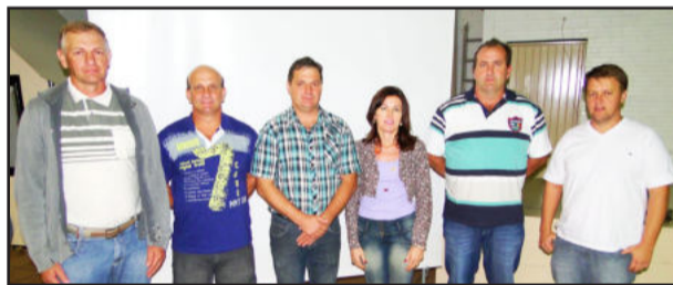
Conselho Fiscal eleito

Quanto à destinação das sobras líquidas colocadas à disposição da assembleia no valor de R$ 526.896,76, ficou