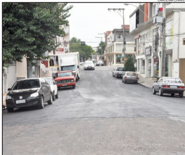
Sosur utilizou 15 toneladas de asfalto na renovação da Rua Carlos Fett Filho