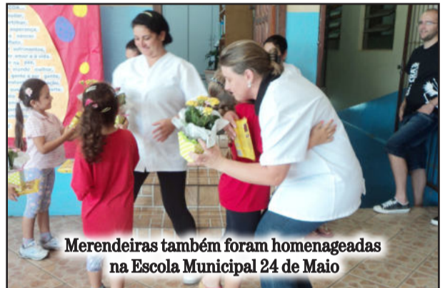
Merendeiras também foram homenageadas na Escola Municipal 24 de Maio