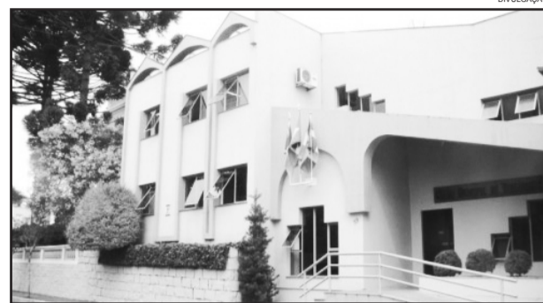
Legislativo pretende ampliar a transparência