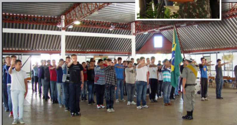
Cerca de 90 jovens fizeram o juramento à bandeira