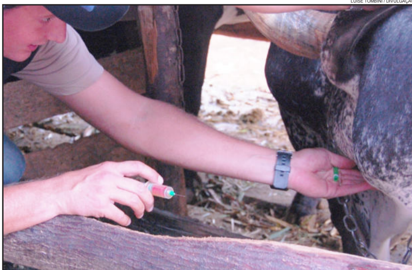
Testes de brucelose e tuberculose foram realizados na manhã de quarta-feira, dia 3

ações como esta, que tem por finalidade verificar a eficácia da vacinação contra febre aftosa. A Secretaria da Agricultura de Imigrante reforça a importância de man-