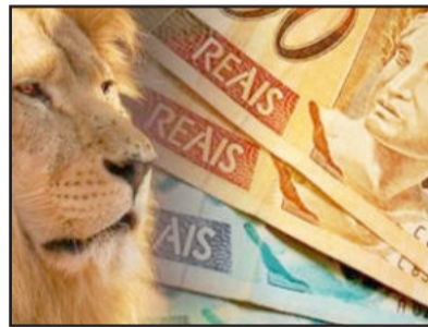
Renda deve ser declarada até o dia 30 de abril

Apesar dessas restrições, o secretário da Receita Federal, Carlos Alberto Barreto, estima que cerca de cinco milhões de contribuintes já devem fazer sua declaração por meio de um dispositivo móvel. O Fisco espera receber cerca de 26 milhões de documentos este ano. "Embora