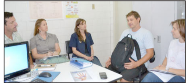
Reunião definiu ampliação do programa Viver Melhor

Nos próximos dias, o programa vai realizar uma enquete para descobrir o que mais agrada, o que pode ser melhorado e o que os participantes gostariam de ter a mais no projeto. "Essa é uma maneira de garantir a satisfação dos nossos in-