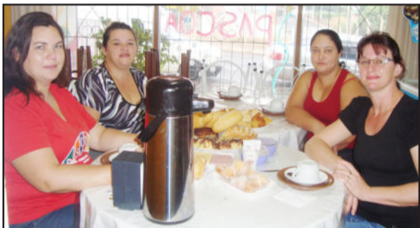
Merendeiras da EMEF Guilherme Sommer tomaram café da manhã na padaria