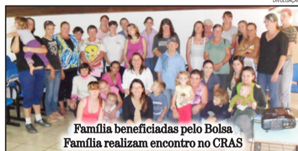
Família beneficiadas pelo Bolsa Família realizam encontro no CRAS

Conforme o Ministério do Desenvolvimento Social e Combate à Fome, o Bolsa Família possui três eixos principais focados na transferência de renda, condicionalidades, ações e programas complementares. A transferência de renda promove o alívio imediato da pobreza. As condicionalidades reforçam o acesso a direitos sociais básicos nas áreas de educação, saúde e assistência social. Já as ações e programas complementares objetivam o desenvolvimento das famílias, de modo que os beneficiários consigam superar a situação de vulnerabilidade.