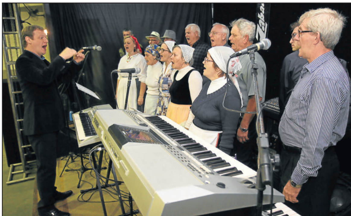
Evento será no Salão Paroquial de Daltró Filho