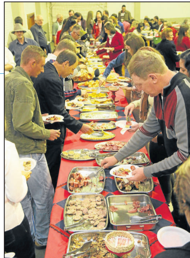
Diferencial do evento é a gastronomia, com alimentação durante a noite toda

O diferencial do evento é a gastronomia, com alimentação disponível durante toda a noite, e a oportunidade de provar algumas delícias da culinária, como polenta frita, queijo, copa, salame, lombo de porco, salsichão, crostolli, cuca, pien e saladas diversas.