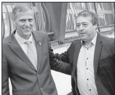
Prefeito Rafael Mallmann (c) recebeu o Ministro do Trabalho