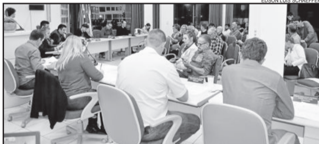
Apenas dois projetos do Executivo estiveram na pauta

Os vereadores voltam a se reunir no dia 11 de maio, às 18h30min.