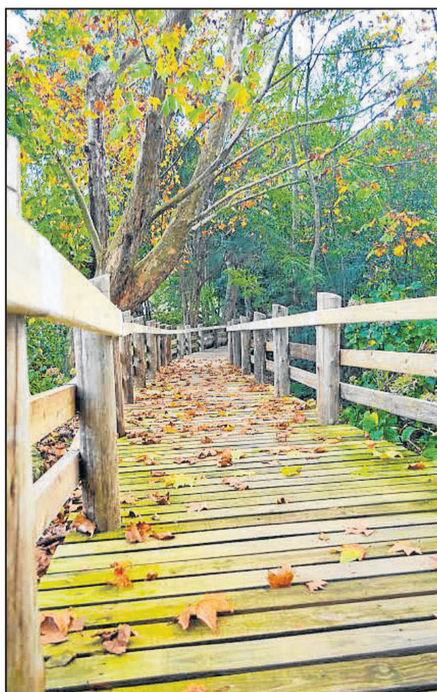
Passeio da Barragem vai ser um dos pontos de limpeza

A iniciativa busca conscientizar a população da importância do descarte correto de materiais como garrafas pet, latinhas, vidros, pneus, roupas, calçados e outros. Muitos destes resíduos são encontrados nos locais. Em caso de instabilidade do tempo, o mutirão será transferido para o dia 13 de maio.