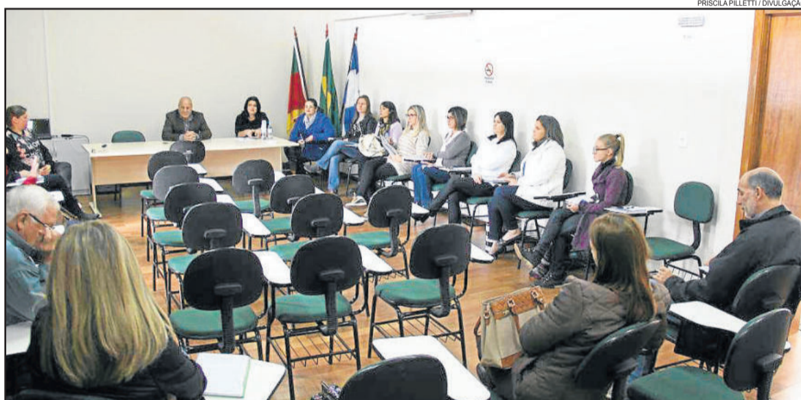
Evento está marcado para o dia 20 de maio

A campanha Faça Bonito é uma ação do Comitê Nacional de Enfrentamento da Violência Sexual contra Crianças e Adolescentes, com o objetivo de mobilizar a sociedade para o dia nacional de combate, 18 de maio. A campanha tem como símbolo uma flor amarela, em referência aos desenhos da primeira infância, além de associar a fragilidade de uma flor à de uma criança.