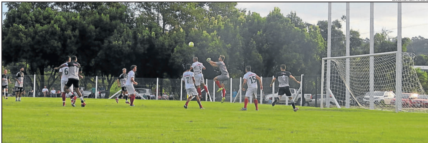
Atual bicampeão ECAS (calção preto) joga em Linha Paissandu e precisa da vitória

E em Westfália, o Fluminense tenta surpreender uma das melhores campanhas: o Boavistense. Como perdeu o jogo de ida, o tricolor necessita da vitória para ir aos pênaltis. Ao Boavistense, repetir bons jogos e buscar o empate serão necessários para ser semifinalista no ano de estreia nesta competição.