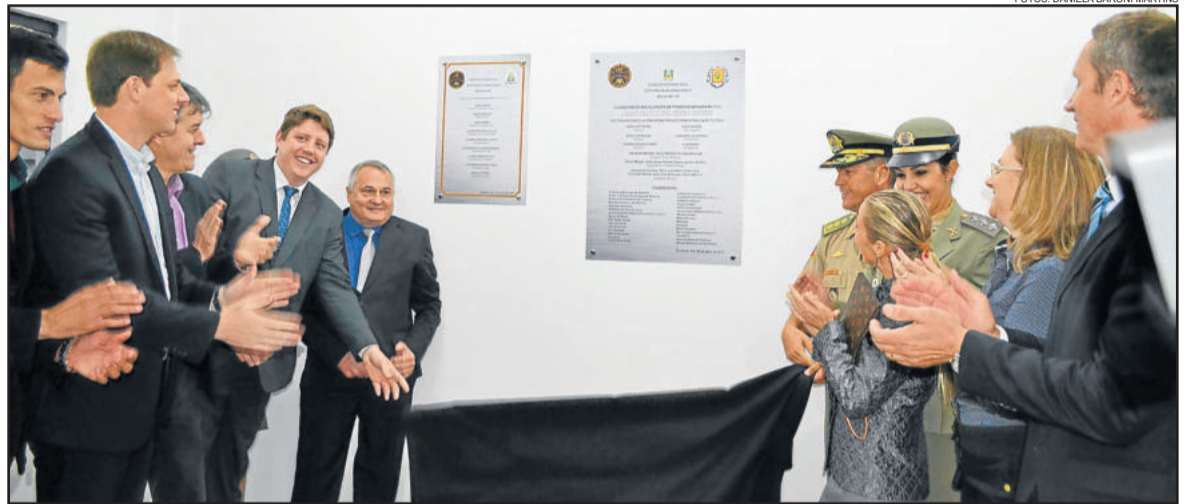
Local foi inaugurado no dia 26 de abril

Ele acrescenta que as instalações estão ocorrendo aos poucos, e que a ideia é que sejam concluídas até o final deste mês de maio,