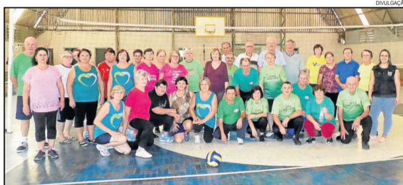
Grupo tem mais de 30 integrantes

Os encontros iniciam às 13h30 e acontecem no Ginásio Ernani Júlio Sippel, ao lado do IECEG. Integrantes dos grupos da melhor idade podem participar do projeto, que é oferecido de forma gratuita.