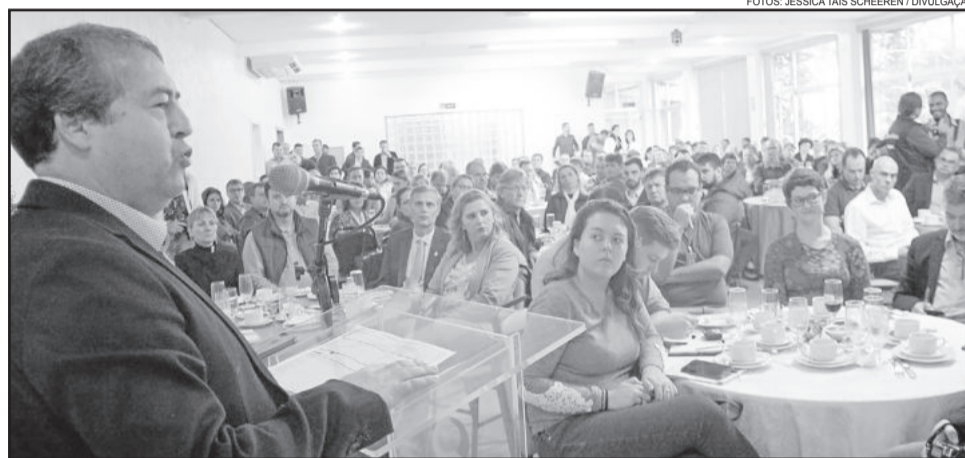
Ministro por mais de uma vez arrancou aplausos dos presentes com suas colocações

Segundo o ministro do Trabalho Nogueira, a proposta está baseada em três eixos: consolidação de direitos; segurança jurídica; gera-