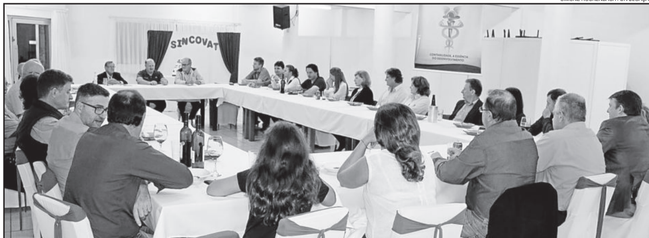
Associados, membros da diretoria e ex-presidentes prestigiaram evento de aniversário