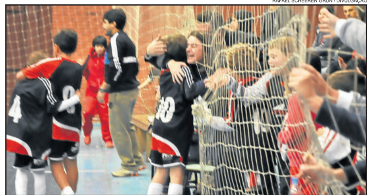
29ª edição do Campeonato Piá de Lajeado promete muita emoção