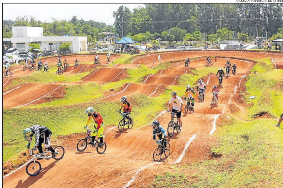
Mais de 160 atletas de todo o Estado devem disputar até 30 provas na pista de Estrela

Conforme os organizadores, atletas federados que estiverem por Estrela já poderão treinar no sábado à tarde, das 15h às 17h. Os treinos oficiais serão no domingo, das 10h às 12h. As provas iniciam às 13h e devem se estender até as 16h. " Fizemos algumas modificações na nossa pista. Com o auxílio da Secretaria de Obras, conseguimos algumas cargas de terra para melhorar nosso traçado. Aumentamos, por exemplo, nossos paredões. Temos a pista mais travada do Estadual, o que possibilita muitos pegadas, ultrapassagens, e por isso temos que ter bons paredões e sempre buscar melhorias, o que só deixa tudo ainda mais disputado", explica.