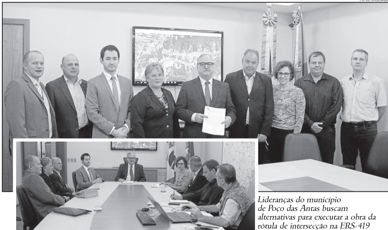
Lideranças do município de Poço das Antas buscam alternativas para executar a obra da rótula de intersecção na ERS-419