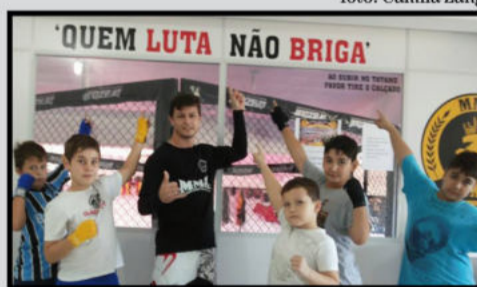
Galerinha aprendendo desde cedo: Quem luta não briga