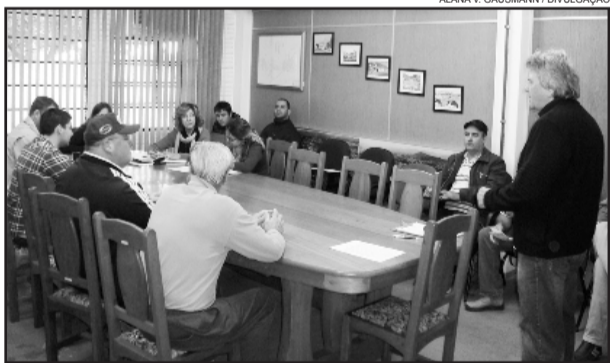
Município realizou novo leilão de máquinas e veículos

LOTE 08 - Retroescavadeira marca Randon, diesel, cor amarela, 2009/2009, placa IPX 1240.