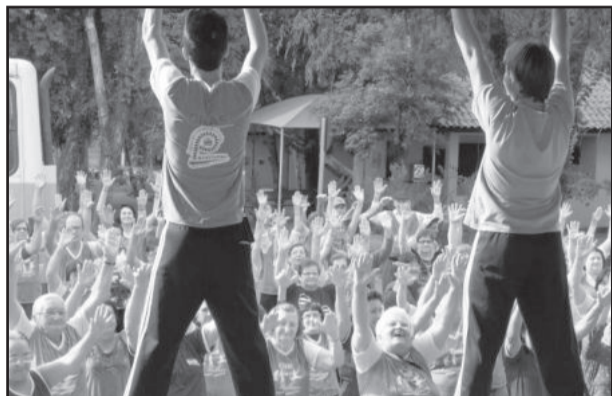
Atividade culminou com atividades no Parque 13 de Abril