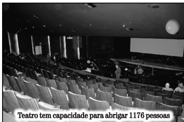
Teatro tem capacidade para abrigar 1176 pessoas