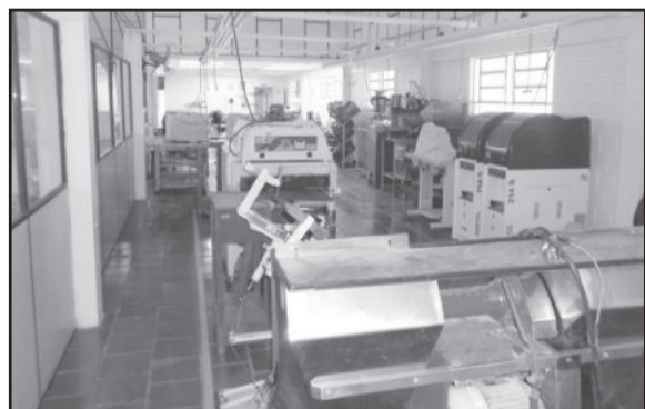
Uma mini fábrica é montada para o aprendizado prático dos jovens

A engrenagem fabril precisa mover-se para gerar resultado econômico