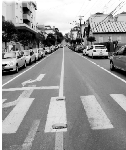
Avenida Rio Branco

Já foram demarcadas as ruas: General Osório, Jacob Ely, Presidente Vargas, João Pessoa, Buarque de Macedo - entre a Independência e o trevo do Grillo, Vicente Dal Bó - Independência até o São Francisco, acesso Norte e Agostinho Mazzini.