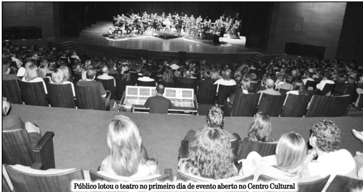
Público lotou o teatro no primeiro dia de evento aberto no Centro Cultural