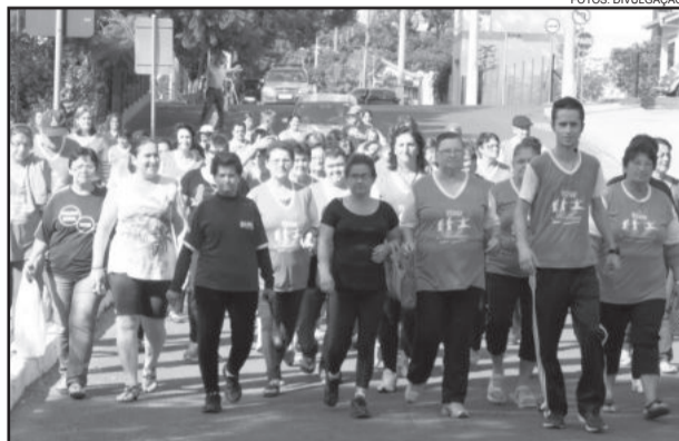
Grupo percorreu algumas ruas da cidade