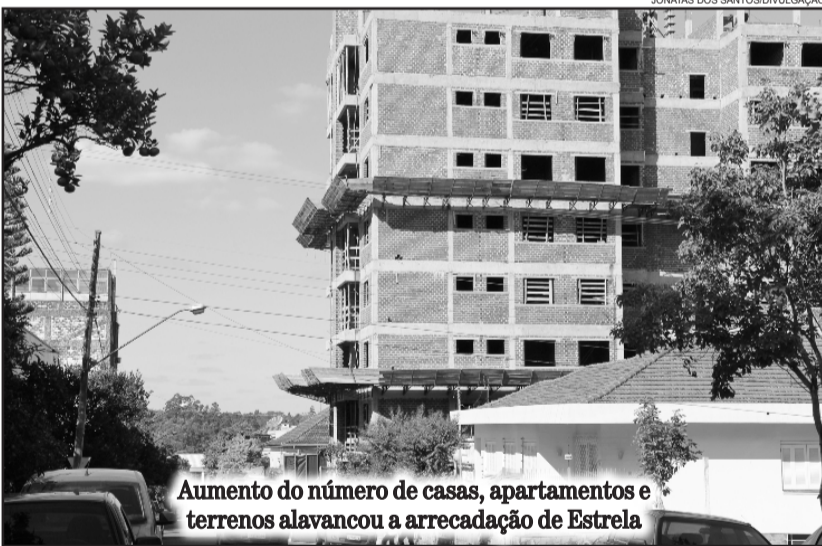
Aumento do número de casas, apartamentos e terrenos alavancou a arrecadação de Estrela

O ascensão cadastral é uma evolução na economia, considera o secretário. Segundo ele, o IPTU é reinvestido no município. Estrela foca hoje em Saúde e Educação. “A lei exige inves-