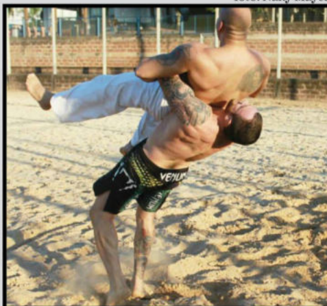
Mão de Pedra perfeito no suplé