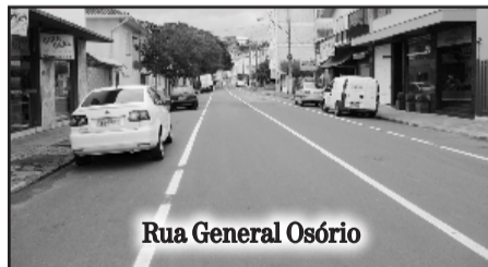
Rua General Osório