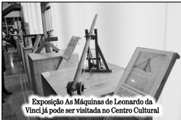
Exposição As Máquinas de Leonardo da Vinci já pode ser visitada no Centro Cultural