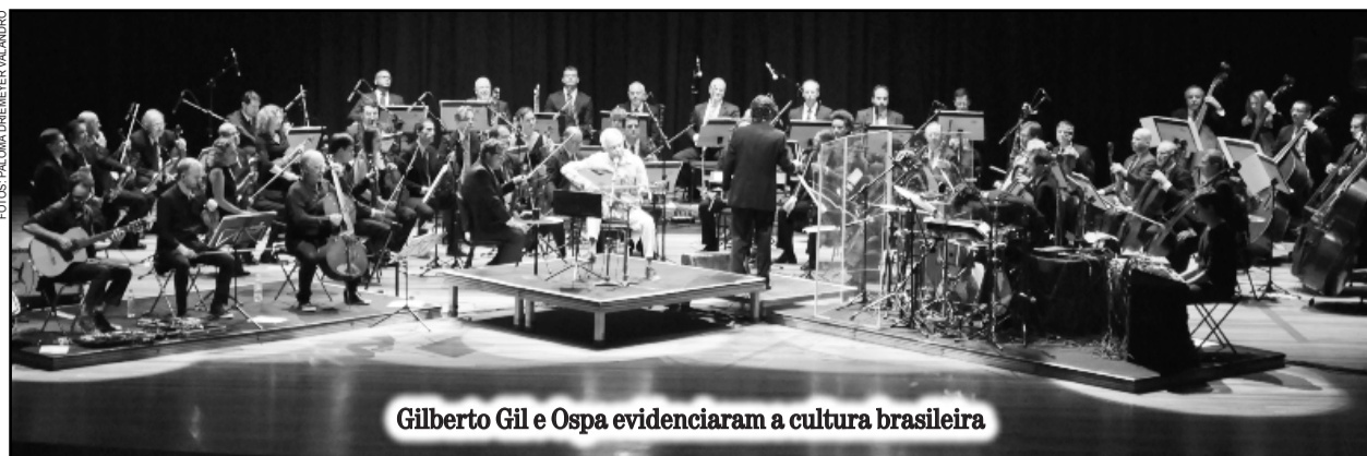
Gilberto Gil e Ospa evidenciaram a cultura brasileira