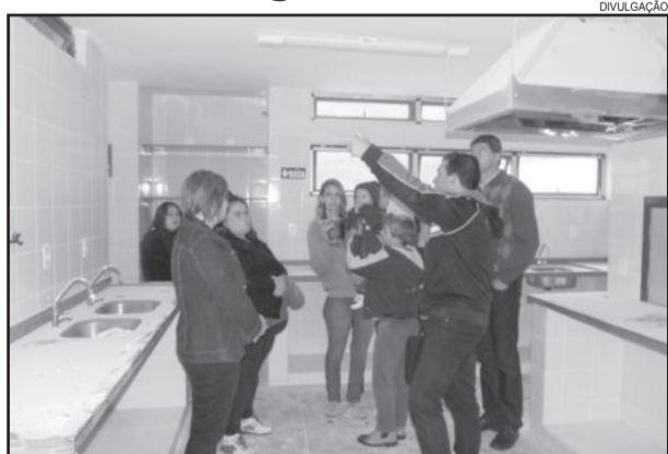
Professores puderam conhecer a estrutura da nova EMEI

Na manhã do dia 25 de abril, o corpo docente da Escola Municipal de Ensino Infantil Casa da Criança foi, a convite da Administração Municipal de Paverama, visitar e conhecer as obras e estrutura da EMEI ProInfância, que está em fase final de conclusão.