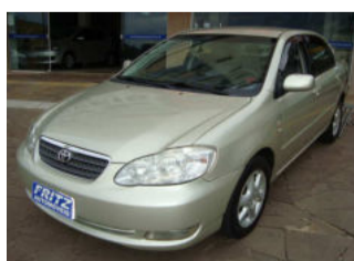
Corolla 1.8 XEI R$ 37.900,00

As compras com troca receberão tanque cheio e IPVA 2014 pago.