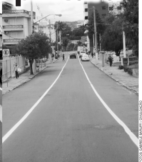
Rua Agostinho Mazzini