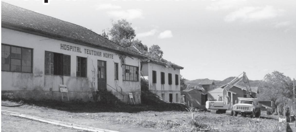
Limpeza no terreno frontal do antigo Hospital aconteceu na semana passada

A Administração Municipal de Teutônia, através da Secretaria de Obras, realizou na semana passada uma completa limpeza da área frontal ao antigo Hospital Teutônia Norte, no Bairro Teutônia. A terceira etapa foi a entrada de máquinas e caminhões para fazer uma ação mais detalhada, com a retirada de raízes, galhos e inço, e o nivelamento da área. Com isso, há um melhor aspecto visual do local e da fachada do prédio.