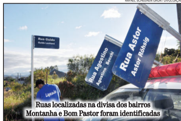
Rua localizada na divisa dos bairros Montanha e Bom Pastor foram identificadas