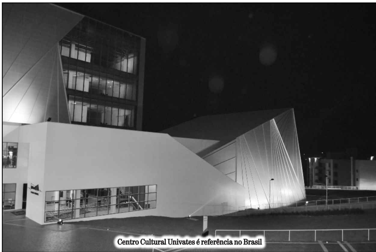
Centro Cultural Univates é referência no Brasil

D ia 3 de maio de 2014, uma data que ficará para a história do Centro Universitário Univates e do Vale do Taquari. A inauguração do Centro Cultural Univates foi marcada por muita emoção, entusiasmo e alegria na noite de sábado. A realização de um sonho da Instituição tornará possível a cultura para a região. O show de Gilberto Gil, juntamente com a Orquestra Sinfônica de Porto Alegre (Ospa), foi um dos momentos mais emocionantes da noite inaugural.