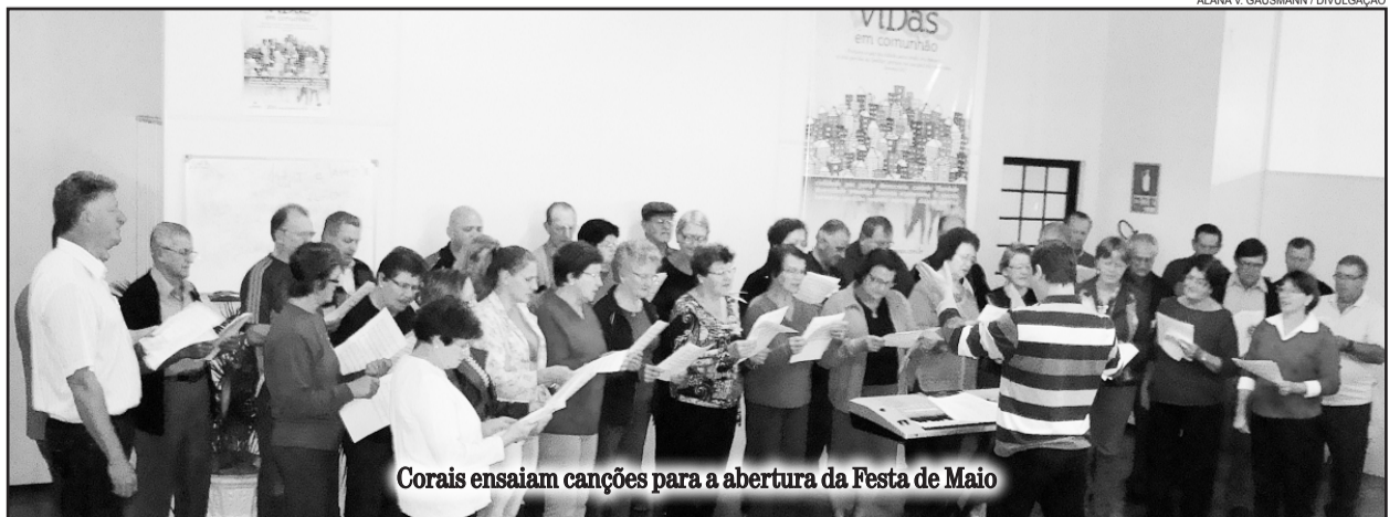
Corais ensaiam canções para a abertura da Festa de Maio