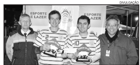
Vencedores do Torneio do Boi em 2013

Os cartões de inscrição para o torneio já encontram-se a venda por R$ 30 no Barbeirinho, Padaria Bruxel (Terminal) e na Loja Ponto Pisos (Boa União). A dupla poderá inscrever também um reserva.