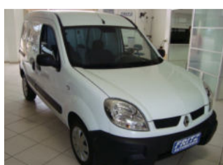
Kangoo 1.6 R$ 30.000,00

Aberto de segunda a sexta das 8h às 18h30min. Sem fechar ao meio dia e nos sábados das 8h às 16h.