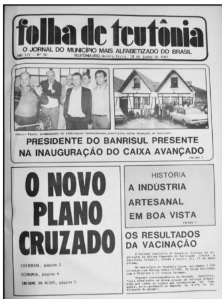
O novo Plano Cruzado

Ortografia mantida conforme edição da época