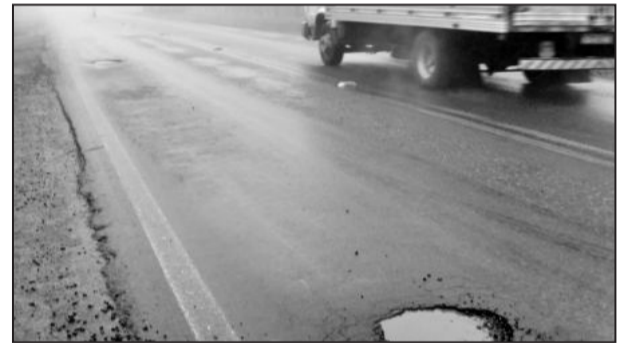
RSC 470 entre Carlos Barbosa e Bento Gonçalves, passando por Garibaldi, fica ainda mais perigosa no inverno