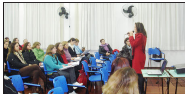
Encontro ocorreu em Estrela

Após a palestra ocorreu a formação de grupos para discussão e elaboração de princípios de trabalho para o EJA, de acordo com os sete eixos temáticos: currículo, avaliação, metodologia, sujeitos e diversidade, Educação de Jovens e Adultos no mundo do trabalho, educação ao longo da vida, formação continuada e educação popular e a EJA. Ao final, o relator de cada grupo apresentou a sistematização elaborada pelo grupo, e foram eleitos os delegados para participar do Encontro Estadual do EJA, em Porto Alegre, no mês de setembro.