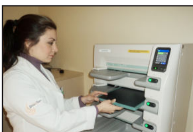
Com o PACS a visualização do diagnóstico é em tempo real