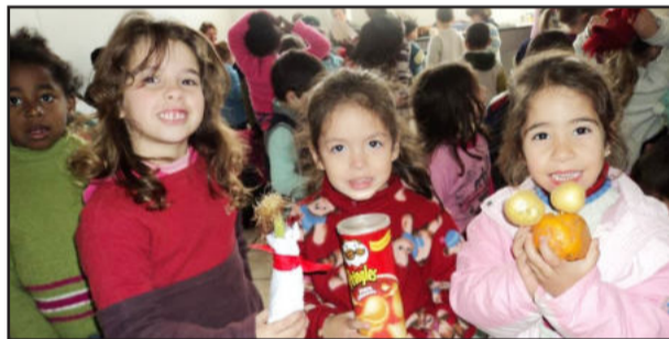
Crianças se divertiram com os brinquedos confeccionados pelos idosos