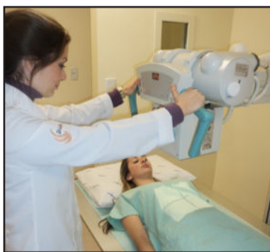
Com o raio-x digital, menos radiação é exposta ao paciente