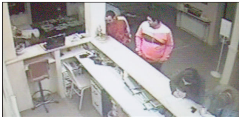
Câmeras de segurança flagraram integrantes da quadrilha realizando check-in na recepção de um hotel em Garibaldi

de Ijuí, residia em Estrela. É considerado o mentor da quadrilha;