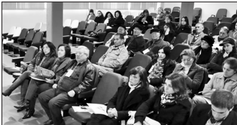
Conferência de Assistência Social contou com boa participação

Após os debates em grupo, o evento encerrou com a plenária de eleição dos delegados que representarão o município na Conferência Estadual de Assistência Social.