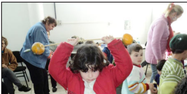
Aluno da EMEI Arco Íris mostrou aos idosos como ele faz atividade física

O grupo do Gracie visitou a Vovolândia e presenteou as vovós e vovós com muitas músicas da sua época, o que despertou grandes sorrisos e contagiou o lugar com muita alegria e diversão.