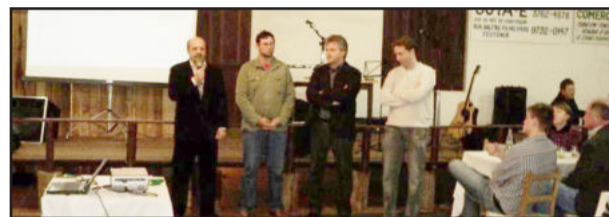
Parceiros enalteceram importância do investimento na formação de cidadãos e atletas

Alunos, ex-alunos, poder público, parceiros da AERC Juventus e comunidade em geral prestigiaram mais este evento promovido pela entidade e puderam conhecer um pouco mais desta bela história de 17 anos de conquistas e construção da cidadania por meio do esporte.