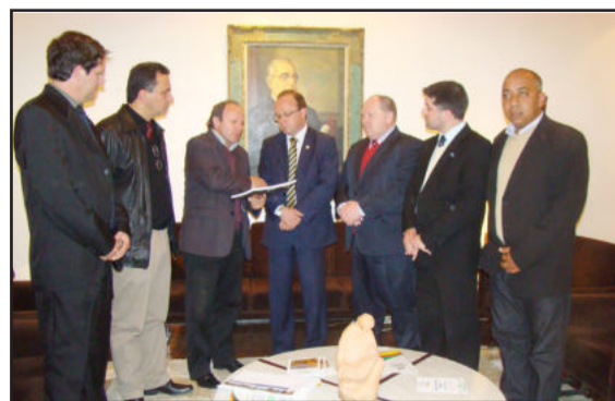
Villaverde também se engajou na causa