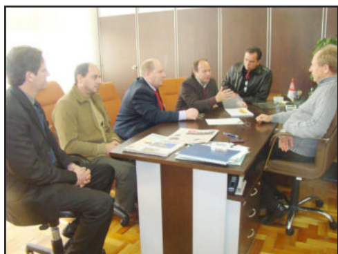
Casa garantiu o apoio na obra de duplicação