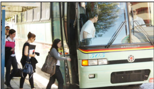
Transporte universitário gratuito para mais de 1,5 mil estudantes

A Administração Popular de Garibaldi fornece o transporte universitário totalmente gratuito para mais de 1,5 mil estudantes, que deslocam-se para as seguintes instituições: UCS, em Caxias do Sul e Bento Gonçalves; Unisinos, em São Leopoldo; Ulbra, em Canoas; Feevale, em Novo Hamburgo; e agora Univates, em Lajeado. Para mais informações sobre as associações de universitários de cada instituição, entre em contato com o Setor de Transporte Escolar da Prefeitura, pelo telefone (54) 3462-8246.