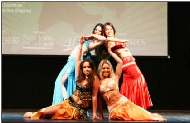
Evento ocorre dia 9 de setembro no Complexo Esportivo da Univates

Mais informações sobre o regulamento e a ficha de inscrição podem ser obtidas acessando o site www.univates.br/nucleodecultura no link Artes Cênicas, pelo telefone (51) 3714-7000, ramal 5362, ou pelo e-mail nucleodecultura@univates.br .