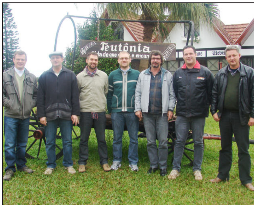
Representantes dos Músicos e Administração planejam evento para o Dia do Músico, em novembro