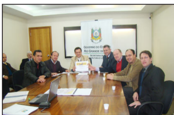
Membros da Comissão entregam relatório ao secretário estadual