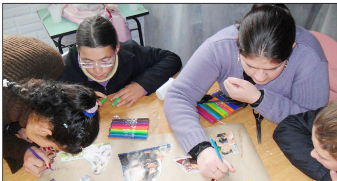
Jovens participam de oficinas e realizam trabalhos no Projovem Adolescente

O público-alvo constitui-se, em sua maioria, de jovens, cujas famílias são beneficiárias do Bolsa Família, estendendo-se também aos jovens em situação de risco pessoal e social, encaminhados pelos serviços de Proteção Social Especial do SUAS ou pelos órgãos do Sistema de Garantia dos Direitos da Criança e do Adolescente.