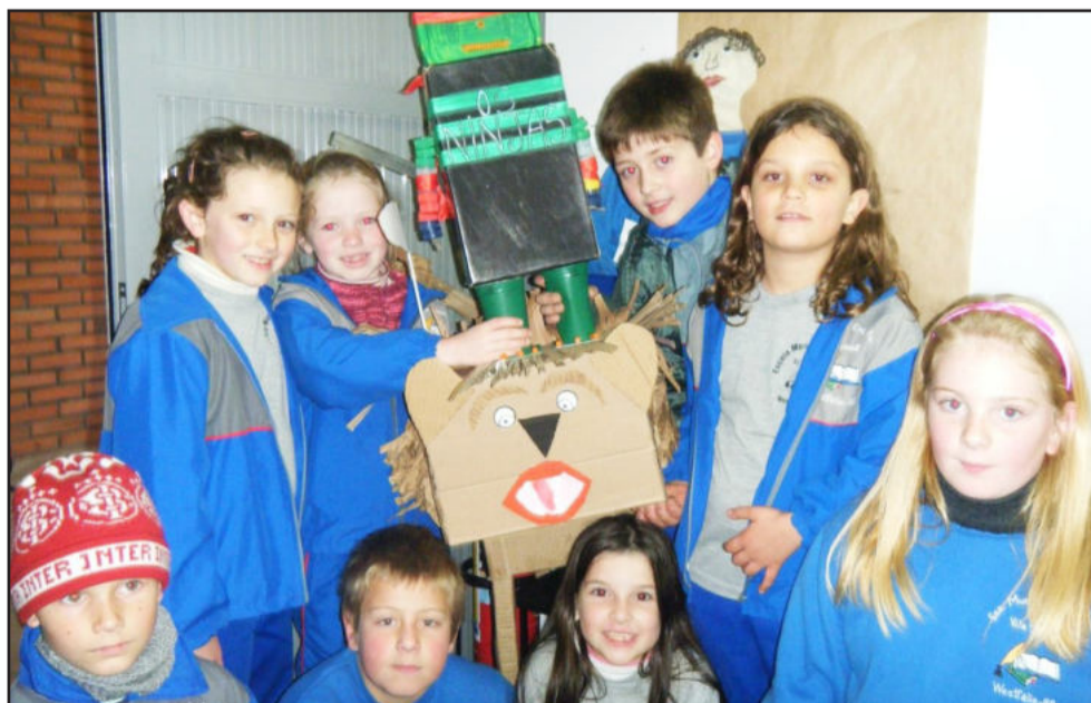
Alunos estão motivados com a gincana

alunos, pais, professores e toda comunidade. As provas são variadas, nas quais a rapidez e precisão contribuem para a classificação das equipes. As atividades terão culminância no próximo sábado, dia 13 de agosto, quando a escola comemorará seus 14 anos.