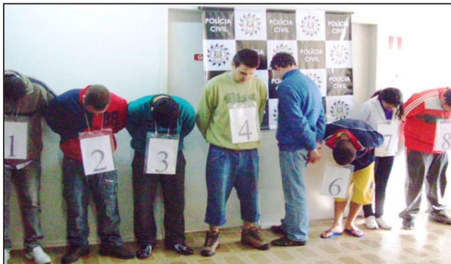
Grupo é acusado e responderá por vários crimes cometidos em três regiões do Estado

No dia 8 de junho, a Polícia surpreende integrantes da quadrilha em São Sepé com um veículo Monza roubado e armas. Da ocorrência de Santa Maria, um fato foi fundamental para a prisão de mais três integrantes ocorrida em Venâncio Aires: um dos anéis em posse dos presos era da idosa assaltada. Outras prisões ocorrem nos dias 16 e 17 de junho nas cidades de Garibaldi e Santa Cruz.