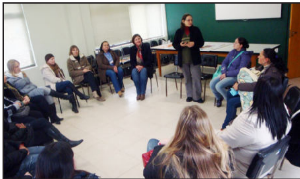
Encontro ocorreu na Câmara de Vereadores de Estrela e reunião dezenas de pessoas