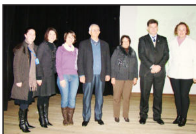
Representantes da parceria local na apresentação da campanha

A estimativa do Programa das Nações Unidas para o Meio Ambiente (PNUMA) é de que, até 2030, o Brasil produzirá 680 mil toneladas/ano de resíduos eletrônicos, e cada brasileiro será responsável pela geração de 3,4 quilos desse lixo digital. Outro dado preocupante: até 2020, o volume de resíduos procedentes de computadores crescerá 400% em países como a Índia e a África do Sul.