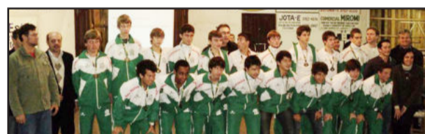
Juventus 96 foi lembrada na noite pelo terceiro lugar no Gauchão de 2010 e demais conquistas