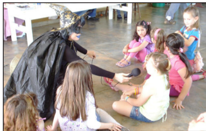
Diversas ações podem ser desenvolvidas, como doação de sangue e oficinas educativas