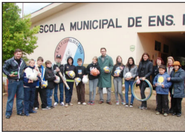
Educação entregou material para alunos da Escola Leopoldo Klepker