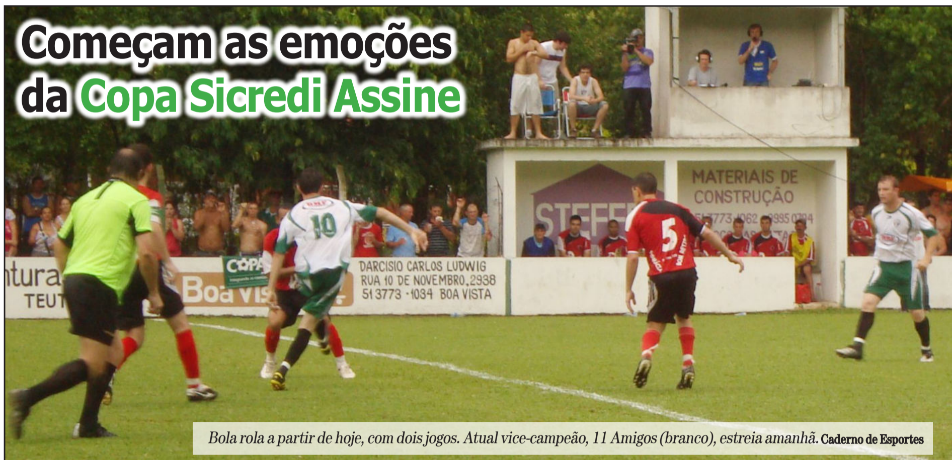
Bola rola a partir de hoje, com dois jogos. Atual vice-campeão, 11 Amigos (branco), estreia amanhã. Caderno de Esportes

A CIC Teutônia convida para a 5ª edição do evento em comemoração ao Dia do Comerciante e apresenta a palestra "O CLIENTE TEM RAZÃO OU NÃO?" Serão abordados assuntos como: - a influência da opinião das pessoas que cercam o cliente; - o acesso do cliente à muitas informações, o que pode confundir-lo; - o poder da emoção sobre as decisões do cliente na hora da compra; - como um bom vendedor pode influenciar o cliente no momento da compra.