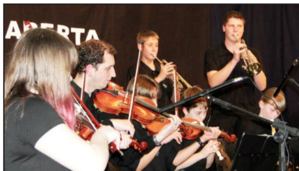
Conjunto Instrumental do Colégio Teutônia é o anfitrião do evento

Na oportunidade estarão representados o anfitrião Colégio Teutônia, Colégio Cônsul Carlos Renaux (Brusque/SC), Colégio Evangélico Jaraguá (Jaraguá do Sul/SC), Escola Ba-