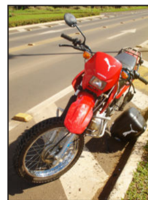
Acidente na Linha Ribeiro

tido Canabarro ao Bairro Centro Administrativo. O condutor da moto, foi encaminhado ao Hospital Ouro Branco, com ferimentos na perna.