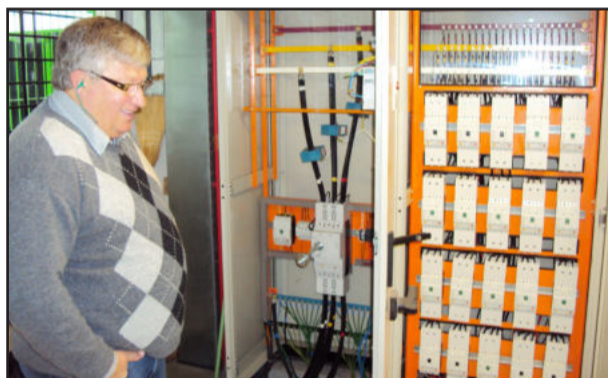
Dentro da fábrica de móveis do Grupo Krabbe

Para o prefeito Marasca a expansão industrial em Westfália é muito grande. “Nossa estrutura de empresas, indústrias, cooperativas e agricultura está muito unida e fortalecida. Isso reflete diretamente no crescimento da comunidade como um todo. Nós, como Administração Municipal, trabalhamos pelo fortalecimento do nosso setor produtivo, porque isso traz retorno direto e destaca as potencialidades dos empreendedores, funcionários e produtores de Westfália”, concluiu o prefeito Sérgio Marasca.