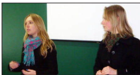
Oficina de Papinhas foi realizada por nutricionistas da Secretaria Municipal de Saúde

Esta última semana foi especial para algumas mães, gestantes e também profissionais da saúde, que participaram da programação alusiva à Semana Mundial de Amamentação, de 1º a 5 de agosto, com atividades diversas em Estrela, trabalhando os temas aleitamento materno, canções de ninar e papinhas. A programação foi realizada pela Prefeitura, por intermédio da Secretaria Municipal de Saúde e Assistência Social.