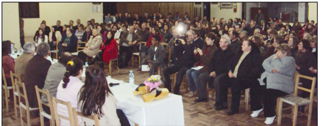
Audiência pública foi muito prestigiada em Westfália, debatendo a instalação da Universidade Federal

Acompanhe mais sobre a audiência pública na próxima edição da Folha Popular.