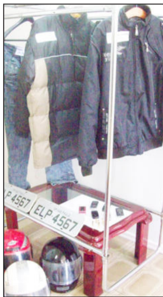
Roupas e capacetes reconhecidos por vítimas eram utilizados pela quadrilha