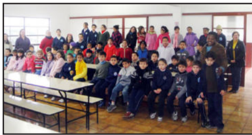
Alunos têm diversas atividades durante o turno integral

A vaga é para estudantes de pedagogia, com carga horária de 20 horas e salário de R$ 450,00. Os currículos devem ser entregues na Prefeitura, no Departamento Pessoal, de 05 a 26 de agosto, das 8 às 11h30min e das 13h30min às 17 horas.