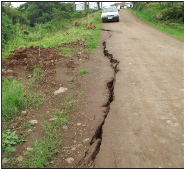
Local onde cedeu a estrada

“Já vem acontecendo há bastante tempo. A cada chuva, a estrada fica danificada no local. Mas nunca cedeu tanto como desta vez. É preocupante, pois se descesse esta parte, não sobraria mais muito espaço entre o morro do “zücherhut” e o declive”, destaca um morador da localidade.