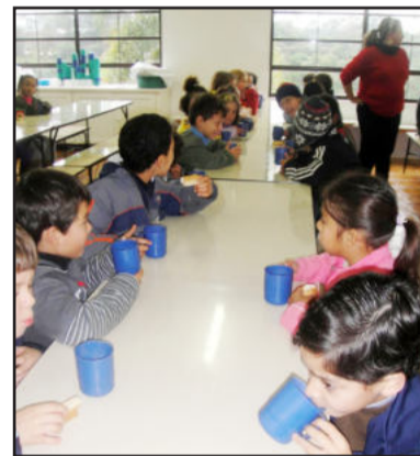
Crianças recebem lanche balanceado

A partir deste mês os alunos dos anos iniciais da Escola Municipal de Ensino Fundamental Odilo Afonso Thomé, localizada no Bairro Imigrantes, e da Escola Municipal de Ensino Fundamental Professora Ruth Markus Huber, localizada no Loteamento Popular, permanecem na escola em turno integral, participando da aula regular em um dos turnos e no contra turno participam de oficinas de teatro, dança, informática, letramento, matemática, futsal, capoeira, entre outras e recebem alimentação acompanhada por nutricionista.