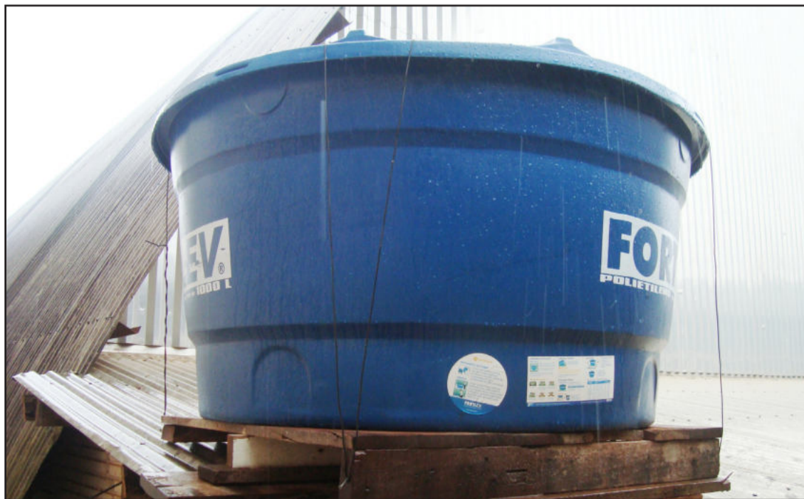
Novo tanque, com capacidade de 1.000 litros, dobrou a capacidade de armazenamento da água da chuva

Ações como essas dão ao IECEG o reconhecimento da sociedade e proporcionam aos alunos, pais, professores e colaboradores a sensação de que cada um deles está fazendo sua parte, contribuindo para um mundo melhor.