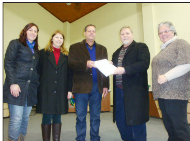
Momento da entrega do projeto da LDO na Câmara de Vereadores

A Câmara de Vereadores tem prazo até 30 de setembro para apreciar o projeto da LDO. A estimativa de distribuição dos recursos para 2012 pode ser visualizada na tabela abaixo: