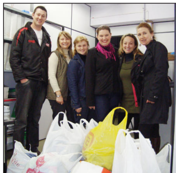
Feiticeiras do Asfalto arrecadaram e doaram agasalhos à campanha

A campanha transcorreu durante o mês de julho, mas para quem ainda não fez suas doações e deseja fazer, a Assistência Social (sala 29 do Centro Administrativo) e o CRAS (no Bairro Canabarro) informam que ainda recebem donativos.