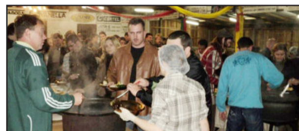
Feijoada foi o prato principal do jantar da Juventus