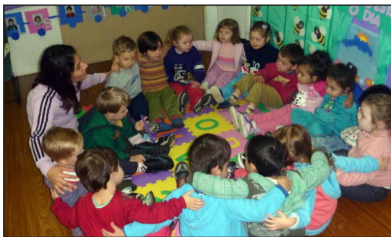
Educandário estimula o fortalecimento de vínculos com a comunidade