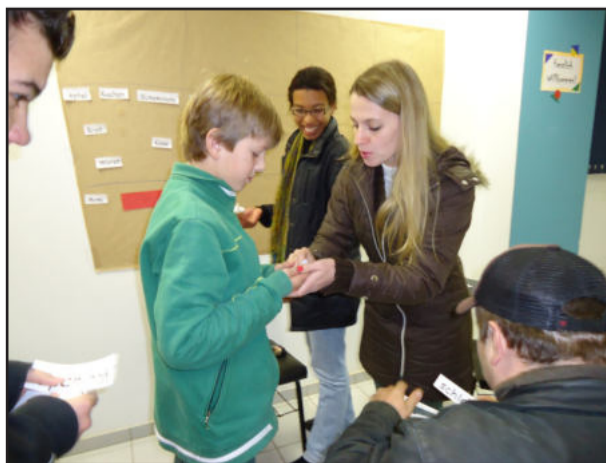
Alunos escolheram aulas de alemão e iniciaram aulas com atividades

Interessados ainda podem se inscrever para o Curso de Alemão Gratuito, oferecido pelo Centro Cultural 25 de Julho, através do telefone (51) 3762-1033.