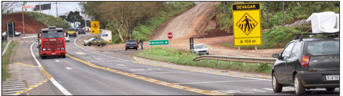
Cidades se mobilizam para obter mais 134 Km de duplicação da BR-386