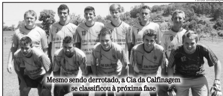
Mesmo sendo derrotado, a Cia da Calfinagem se classificou à próxima fase

No voleibol, o atual campeão, Schmitt, segue firme em busca do bi. Vitória fácil sobre o No Limite, 3 sets a zero, parciais 21 x 09, 21 x 10 e 21x12. No outro jogo, a Construtora Schena se superou para vencer o AAV de virada por 2 sets a 1, 11 x 21, 21 x 19 e 22 x 20. Também de virada, o Jucatra venceu a Fruteira Mertz por 2 sets a 1, parciais de 18 x 21, 21 x 09 e 21 x 12.