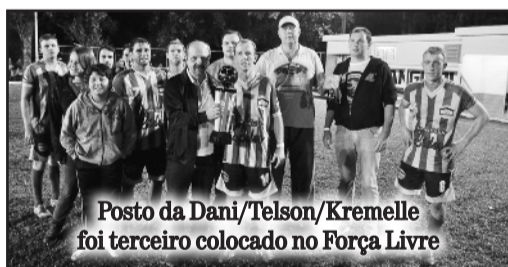
Posto da Dani/Telson/Kremelle foi terceiro colocado no Força Livre