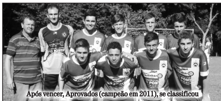
Após vencer, Aprovados (campeão em 2011), se classificou