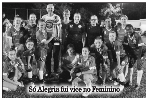
Só Alegria foi vice no Feminino