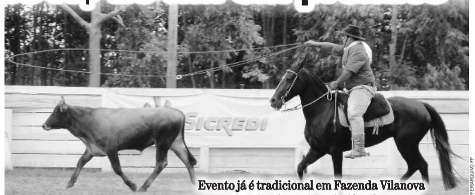
Evento já é tradicional em Fazenda Vilanova e expectativa é reunir mais 40 mil pessoas

O evento que atrai competidores de dezenas de municípios gaúchos, também tem chamado à atenção de competidores de Rondônia, São Paulo, Paraná, Santa Catarina e outros estados. Uma das especialidades do CTG é a receptividade aos visitantes. O parque de rodeios oferece ampla área de camping, com serviço de copa e cozinha, com buffet, agropecuária, supermercado e as tradicionais lavadeiras de louça.