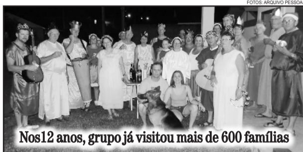
Nos 12 anos, grupo já visitou mais de 600 famílias

alguém continue isso e ajude a manter viva essa tradição”, salienta Gausmann.