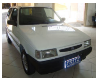
Uno Mille Fire R$ 12.900,00

Aberto de segunda a sexta das 8h às 18h30min. Sem fechar ao meio dia e nos sábados das 8h às 16h.