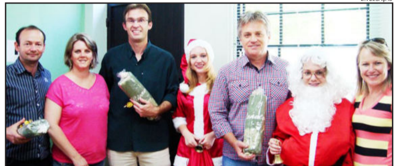
Papai Noel da EMEF Leopoldo Klepker presenteou a Administração