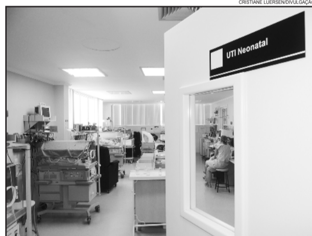
UTI Neonatal e Pediátrica passará de sete para dez leitos

Com estes três leitos a mais, o HBB irá aumentar em 42% a capacidade de atender os pacientes. Em 2013, a UTI Neonatal e Pediátrica atendeu 151 pacientes, com uma média de ocupação por mês de 95,5%, sendo que 72% das internações foram SUS. Atualmente, a equipe conta com 32 profissionais na área de enfermagem, como técnicos em enfermagem e enfermeiros, 12 médicos e quatro pessoas na área administrativa e de higiene.