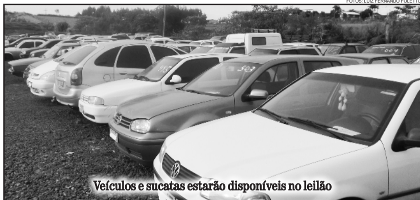
Veículos e sucatas estarão disponíveis no leilão

O licitante, ao arrematar um lote, deverá colocar imediatamente à disposição do leiloeiro seu documento de identificação, sob pena de perder o direito ao lote, sendo considerado nulo o lance oferecido, retornando o