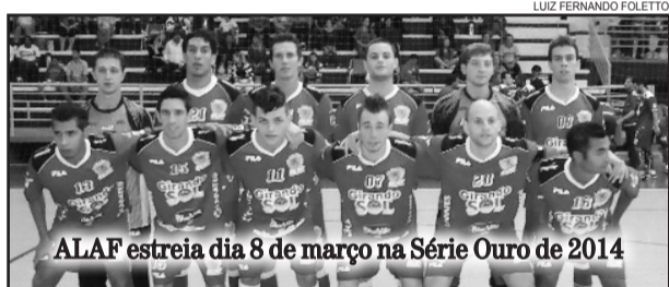
ALAF estreia dia 8 de março na Série Ouro de 2014