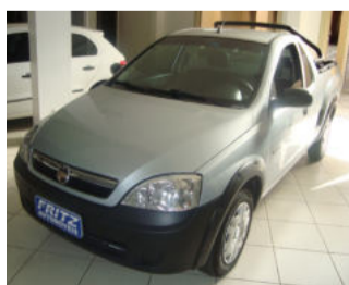
Montana Conquest 1.4 Consulte