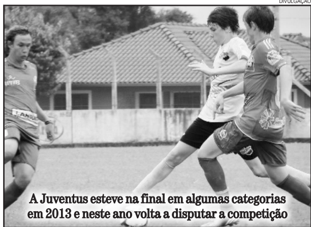
A Juventus esteve na final em algumas categorias em 2013 e neste ano volta a disputar a competição

A abertura será realizada na sexta, dia 10, a partir das 17 horas no campo do Santa Clara FC.