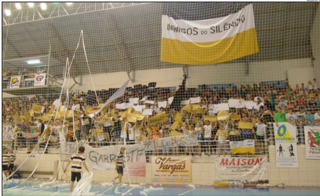
Diretoria acha fundamental o apoio da torcida e, devido a isso, pede que todos adquiram a campanha Sócio Torcedor 2014