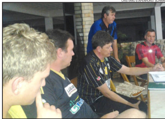
Membros da diretoria estiveram reunidos recentemente para a definição de alguns assuntos, inclusive do lançamento da campanha Sócio Torcedor

Teutônia. Os pinheiros, símbolo do cooperativismo, permanecem entre as correntes, sinal da força do grupo, torcida e comunidade.