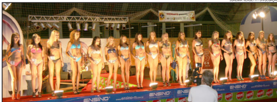
Após desfile serão conhecidas as selecionadas de Teutônia, Fazenda Vilanova e Westfália para a etapa regional

A etapa final do concurso de beleza será realizada nos dias 20, 21 e 22 de fevereiro de 2014, em Capão da Canoa. Todas as candidatas escolhidas nas etapas regionais serão finalistas do Garota Verão 2014. As 40 finalistas participarão de atividades propostas pela comissão organizadora envolvendo gravações, entrevistas, ensaios fotográficos, ensaios para desfiles, entre outros.