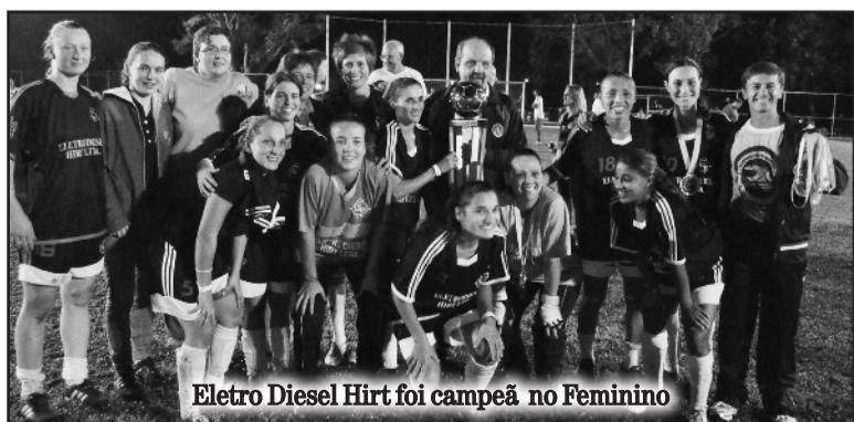
Eletro Diesel Hirt foi campeã no Feminino