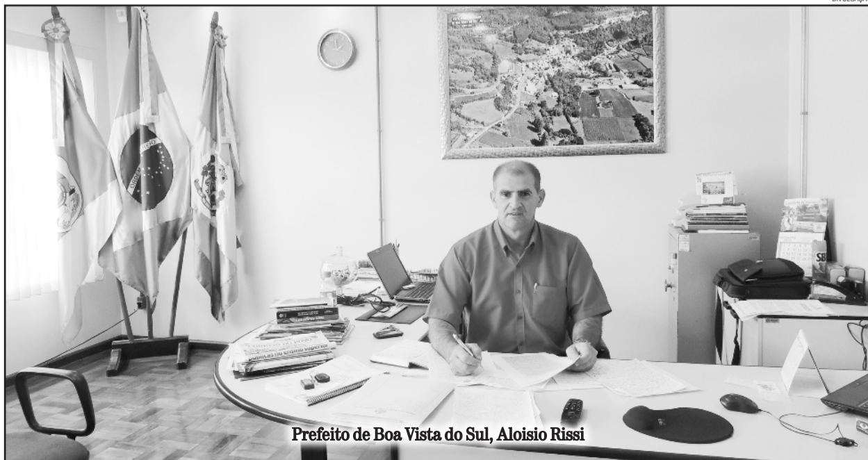
Prefeito de Boa Vista do Sul, Aloisio Rissi