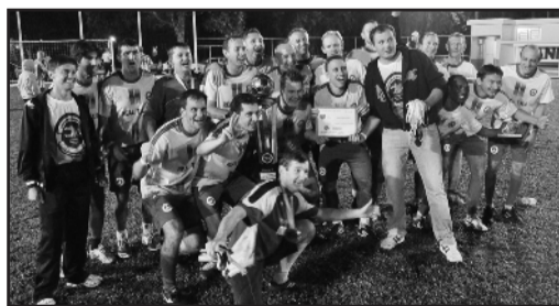
Móveis Zagonel/ Real TKF foi campeão no Veterano