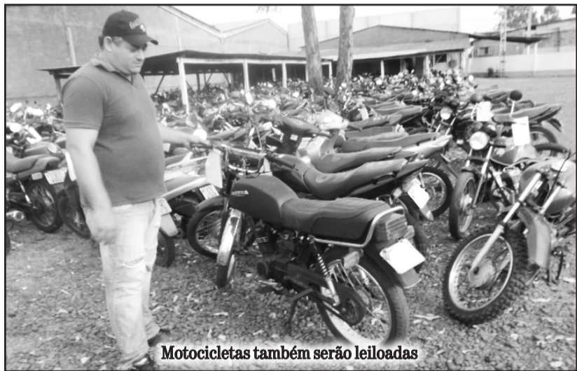
Motocicletas também serão leiloadas

O calendário com os demais leilões agendados e número de veículos ofertados, bem como os endereços dos locais de visitação dos bens, pode ser conferido no site do Detran/RS ( www.detrans.rs.gov.br ).