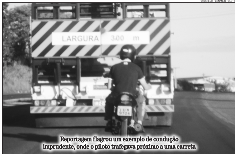
Reportagem flagrou um exemplo de condução imprudente, onde o piloto trafegava próximo a uma carreta

Prediger explica que para a condução de veículos de duas rodas é necessário que seja tomada uma série de cuidados, como o uso do equipamento de proteção individual, uma vez que passageiro e condutor ficam expostos e vulneráveis no caso de envolvimento em acidentes.