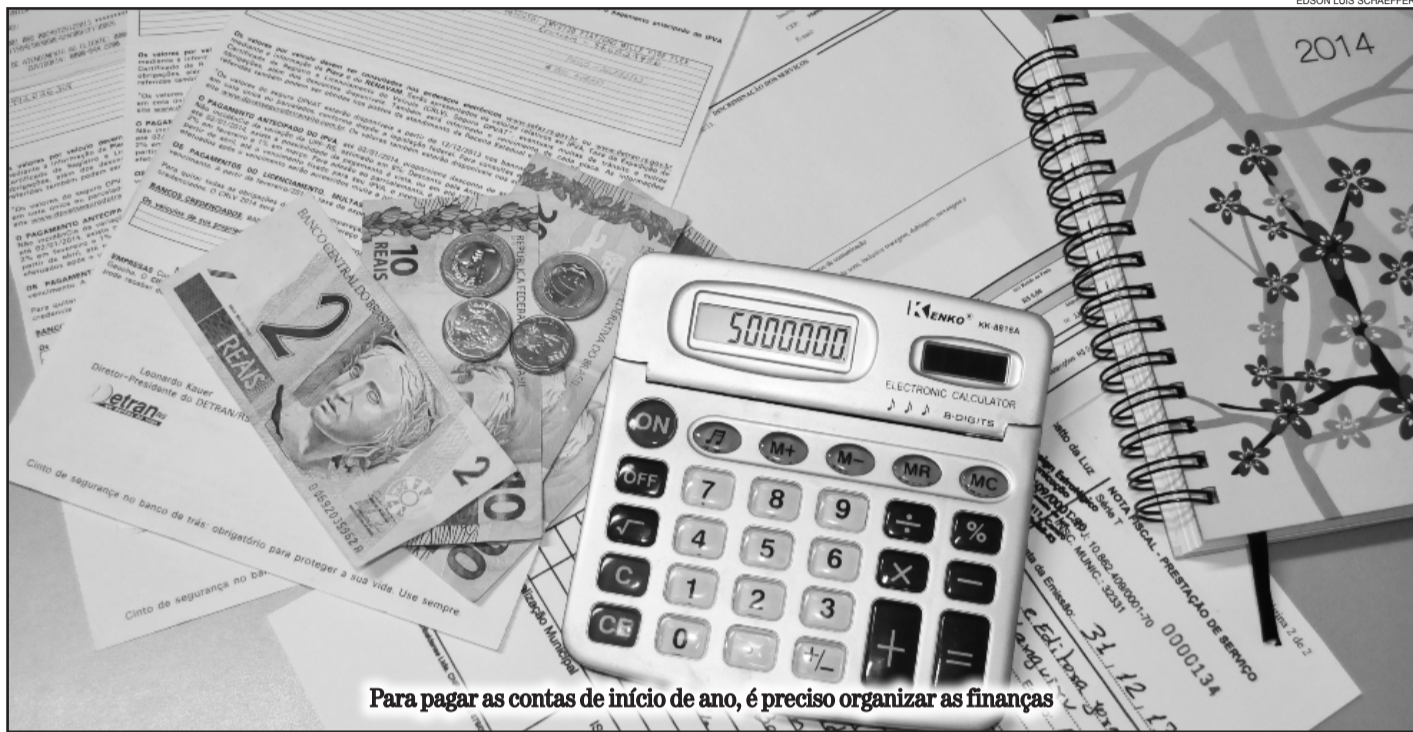
Para pagar as contas de início de ano, é preciso organizar as finanças

Passada a euforia das compras e festas de fim de ano, é chegada a hora em que o consumidor precisa lidar com uma série de obrigações financeiras que surgem em todo ano novo. Matrícula, material escolar, IPTU, IPVA, Seguro Obrigatório e anuidades de entidades representativas de classe e religiosas estão entre as despesas que pesam no orçamento nessa época. Ainda se inclui no cálculo os restos a pagar do Natal.