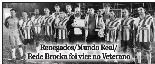
Renegados/Mundo Real/ Rede Brocka foi vice no Veterano