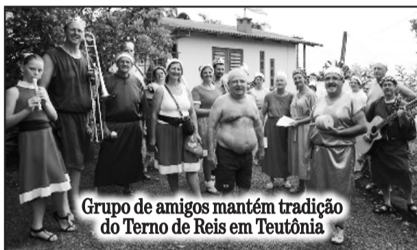
Grupo de amigos mantém tradição do Terno de Reis em Teutônia