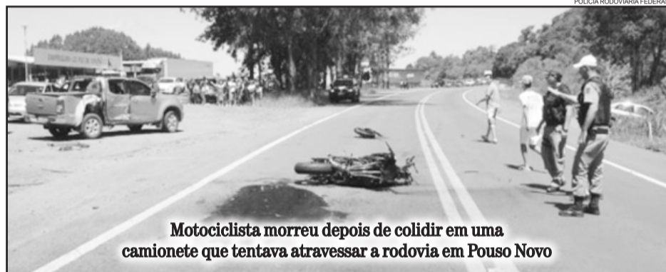
Motociclista morreu depois de colidir em uma camionete que tentava atravessar a rodovia em Pouso Novo