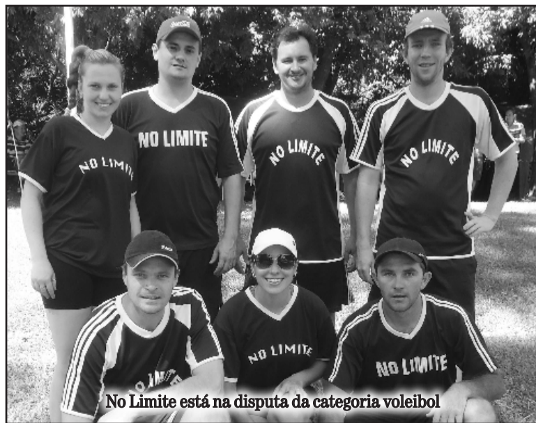
No Limite está na disputa da categoria voleibol