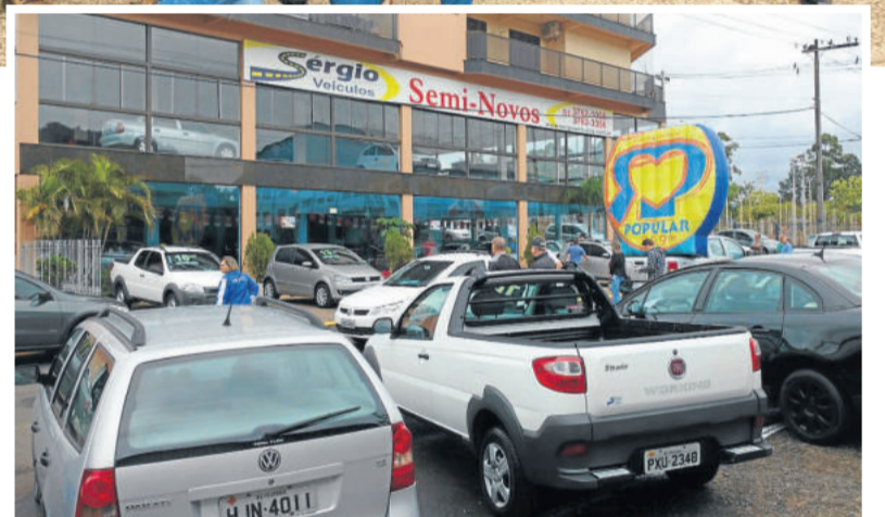
Feirão de veículos marcou a comemoração dos 30 anos