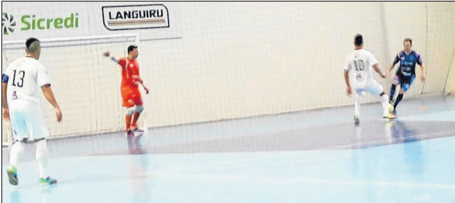
Teutônia Futsal não fez boa apresentação e perdeu de goleada em casa