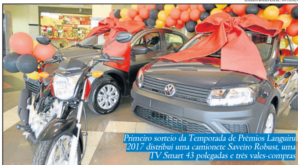
Primeiro sorteio da Temporada de Prêmios Languiru 2017 distribuiu uma camionete Saveiro Robust, uma TV Smart 43 polegadas e três vales-compras

A partir das 12h30min a programação de aniversário volta a Teutônia, onde, às 13h, ocorrerá o tradicional almoço de confraternização, na Associação dos Funcionários da Languiru. Além do almoço, haverá a apresentação do Conjunto Instrumental do Colégio Teutônia.