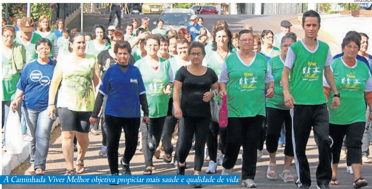
A Caminhada Viver Melhor objetiva propiciar mais saúde e qualidade de vida