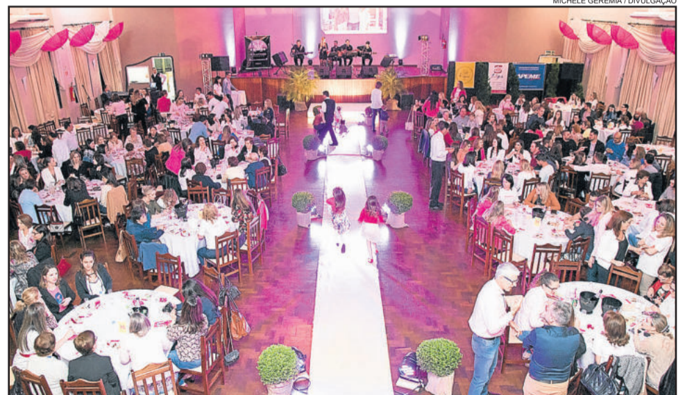
No ano passado o evento reuniu 380 pessoas