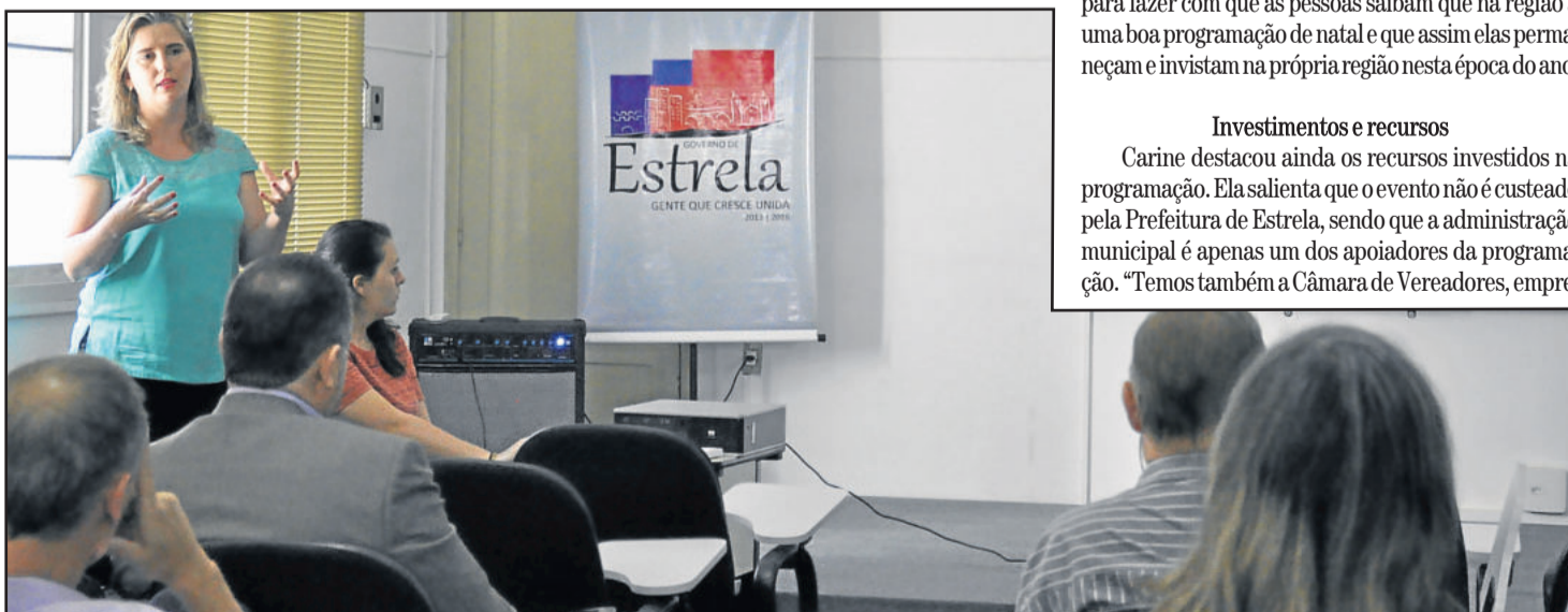
Primeira-Dama Carine Schwingel apresentou as atrações e novidades do Natal em Estrela durante coletiva de imprensa

Passeio de Smelito – embarque e desembarque na Praça Menna Barreto Das 20h às 22h30min