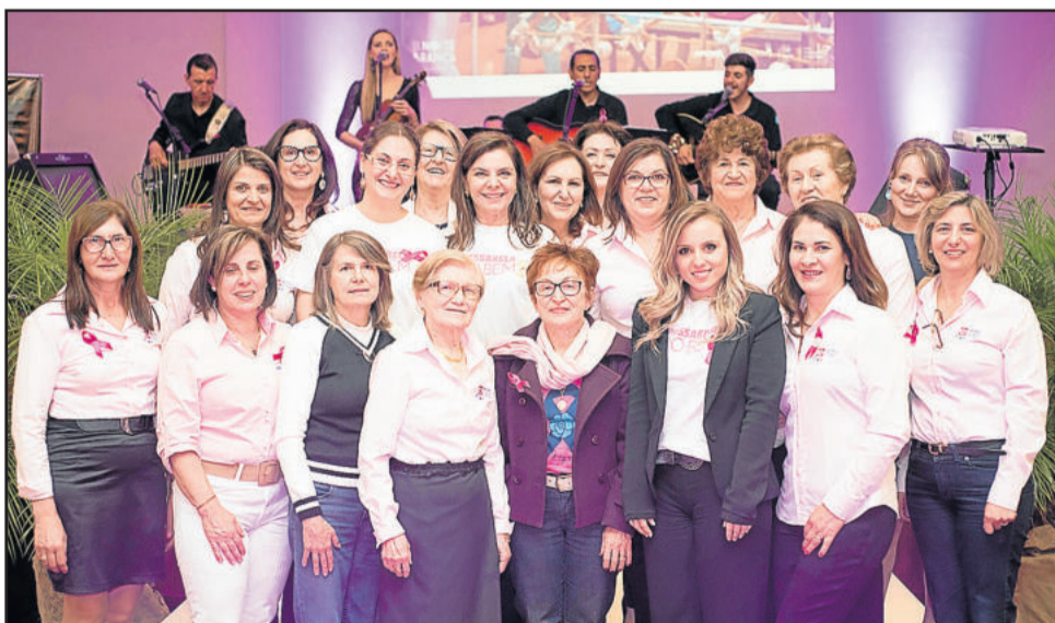
Em 2016, o evento destinou o valor arrecadado à Liga Feminina de Combate ao Câncer de Garibaldi

Os ingressos estão disponíveis nas lojas integrantes da Rota de Compras, na Apeme ou Apae de Garibaldi. O valor individual é de R$ 50. As mesas comportam dez pessoas. Mais informações pelo telefone (54) 3462-2755, WhatsApp 99161-4174 ou e-mail eventos@apeme.com.br . O evento é uma realização da Apeme, Rota de Compras e Apae de Garibaldi.