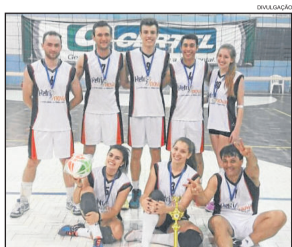
ACEVA de Lajeado conquistou o título