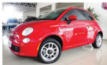
500 CULT DUALOGIC 1.4 8V FLEX - 2012 Vermelho, 4 portas, Flex - ISY-3743.

Opcionais: Ar-Condicionado, Air Bag Duplo, Câmbio Dualogic.