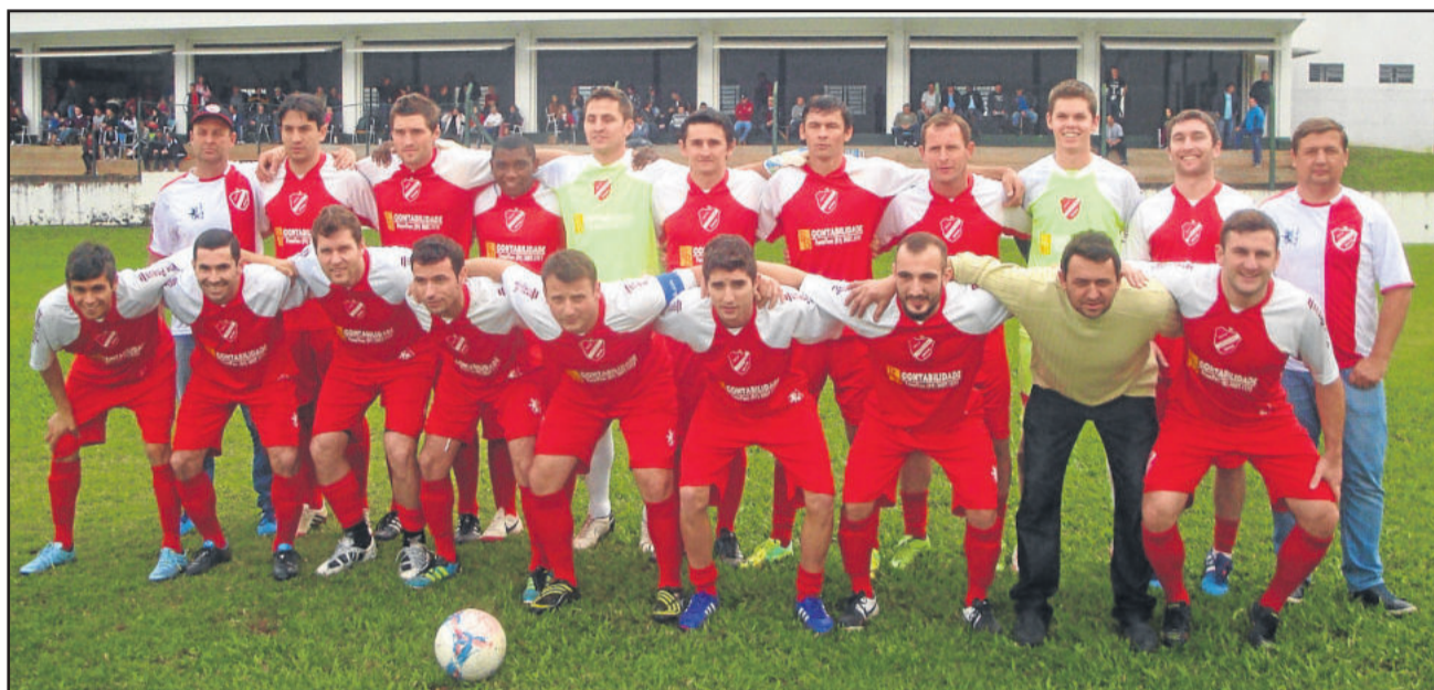
Juventude de Brochier precisa de um empate diante do 11 Amigos para ir às semifinais

O Esperança de Teutônia almeja fazer amanhã o que não fez em quase todo o campeonato: uma boa e convincente partida jogando em casa. Nos 5 jogos em Languiru, o Verdão saiu perdendo todas as vezes, conseguiu apenas uma vitória de virada (4x1 sobre o Olarias de Lajeado), arrancou dois empates (ASSEPE e Juventude de Brochier) e teve duas derrotas (Arroio Alegrense e Aimoré de Estrela).