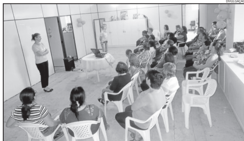
CRAS realizou atividades no Outubro Rosa