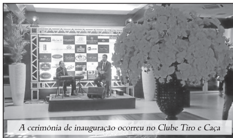
A cerimônia de inauguração ocorreu no Clube Tiro e Caça