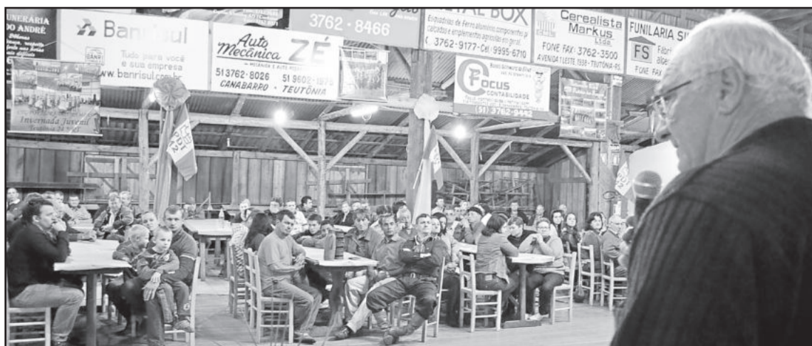
Cerca de 200 pessoas participaram do evento