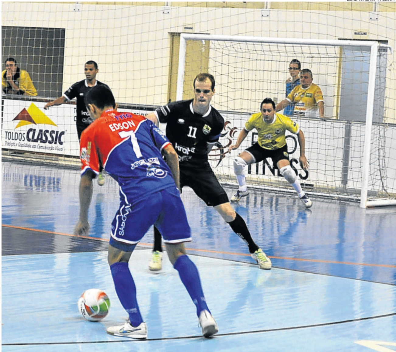
ALAF não pode perder se ainda sonha em conquistar a classificação. Teutônia garante vaga na semifinal com a vitória hoje à noite. GAUCHÃO - SÉRIE OURO > 30

PDT APRESENTA PRÉ-CANDIDATOS A PREFEITO TEUTÔNIA > 4