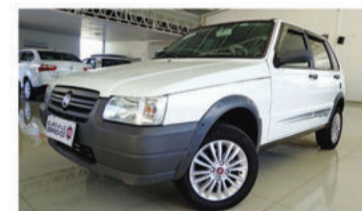
UNO MILLE WAY ECONO. 1.0 8V FIRE - 2011 Branco, 4 portas, Flex - IRH-5910.

Opcionais: Ar Quente, Desemb. Traseiro, Limpador Traseiro, Roda de Liga-leve.