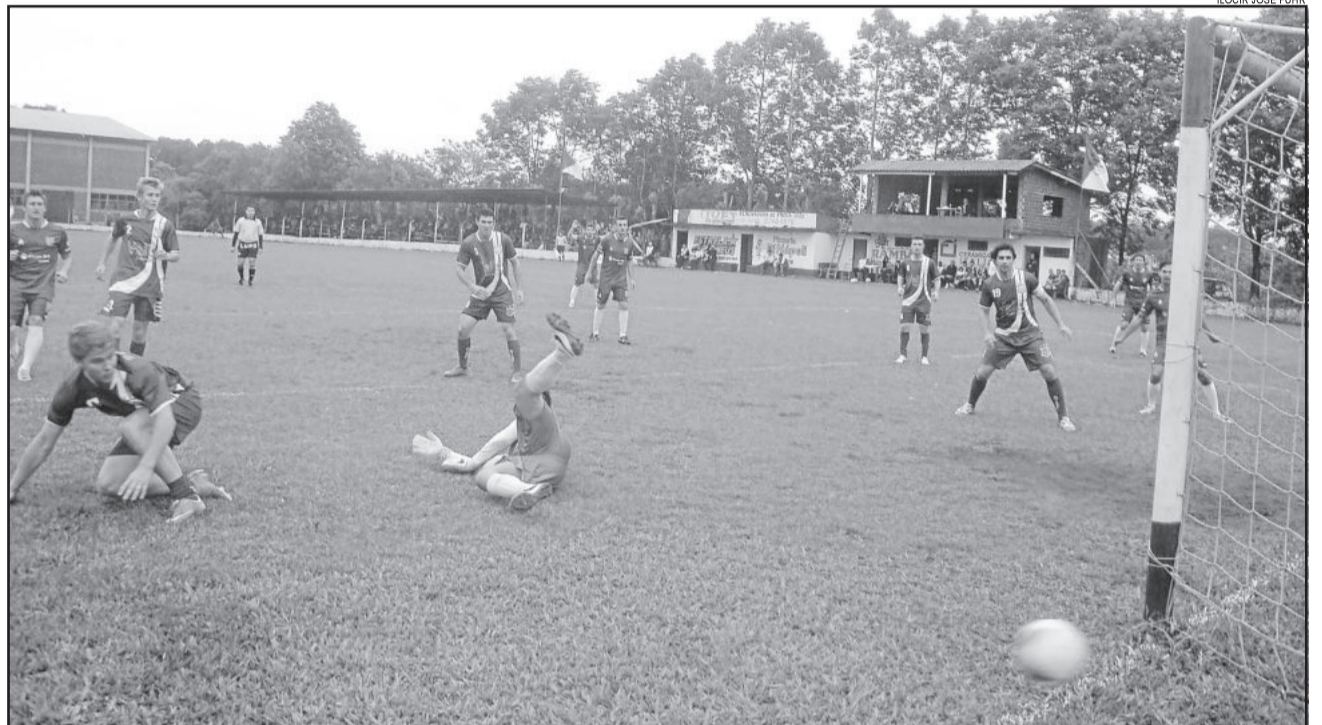
União Carneiros volta a medir forças contra a equipe de Teutônia. Esperança precisa vencer a partida para levar às penalidades

Confrontos deste final de semana definem as equipes que seguem na briga pelo título regional