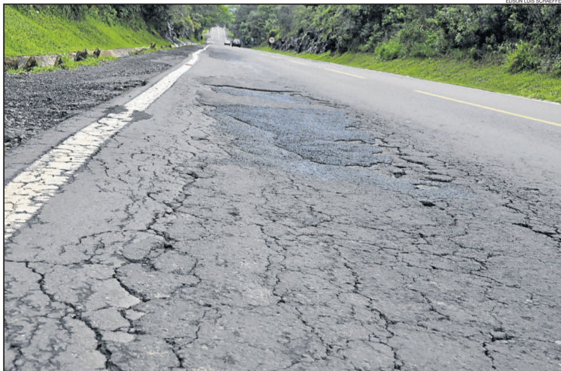
CNT avaliou situação das rodovias brasileiras e classificou a Via Láctea como Ruim

sada, a Via Láctea era considerada “Boa”. Com o passar dos anos, ela passou a “Regular” em 2009 e, conseqüentemente, a “Ruim” em 2014. O estudo deixa evidente o descaso que a rodovia vem sofrendo do Estado ao longo do tempo, o que persiste até hoje. A indefinição da Empresa Gaúcha de Rodovias (EGR) se investe efetivamente na via ou se a devolve ao Departamento Autônomo de Estradas de Rodagem (Daer) vai acentuando os problemas da Via Láctea dia após dia.