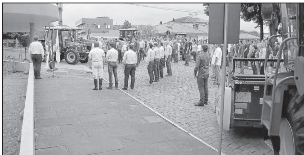
Colégio Teutônia recebeu novo equipamento em solenidade na terça-feira