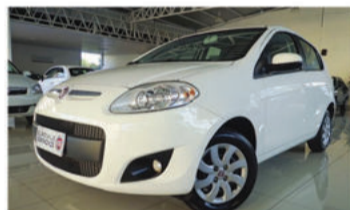
PALIO ATTRACTIVE 1.4 8V FLEX - 2014 Branco, 4 portas, Flex - IVD-2484.

Opcionais: Ar-Condicionado, Direção Hidráulica, Air Bag Duplo, Freios ABS.