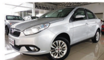
GRAND SIENA ATTRACTIVE 1.4 FLEX - 2013 Prata, 4 portas, Flex - IUJ-9885.

Opcionais: Ar-Condicionado, Direção Hidráulica, Air Bag Duplo, Freios ABS.