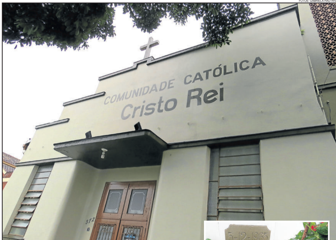
A Igreja está localizada na Rua Senhor dos Passos, no Bairro Languiru