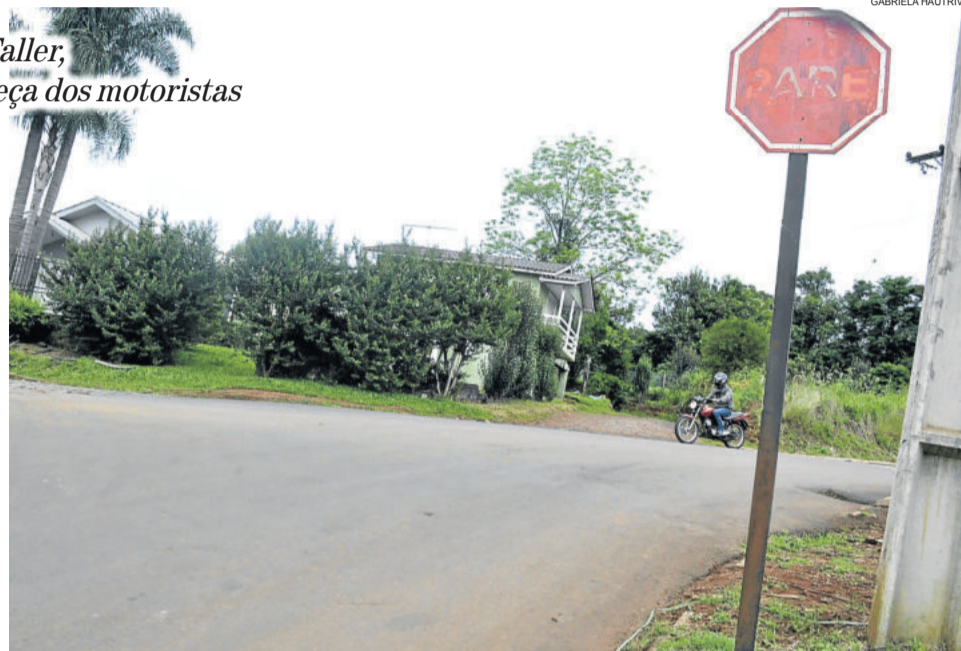
A placa de “pare” é ignorada muitas vezes pelos motoristas que saem da Rua Guilherme Trennepohl

A reportagem da Folha Popular foi até o local para falar com alguns moradores e percebeu que muitos não se importam com o que acontece ali. Alguns até citam que nunca foi registrado um acidente grave e que é preciso fazer “reportagens dos trevos” de acesso aos bairros e não falar desta situação. Outros não têm opinião sobre isso ou não quiseram falar sobre o assunto. Mas, no tempo em que tivemos no local, flagramos diversos tipos de irregularidades e infrações à sinalização instalada. A pergunta é: será que só depois de acontecer um acidente grave é que as pessoas vão se preocupar e tomar providências sobre a situação?