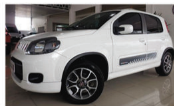
UNO SPORTING 1.4 8V FLEX - 2014 Branco, 4 portas, Flex - IVF-9878.

Opcionais: Ar-Condicionado, Air Bag Duplo, Freios ABS, Travas Elétricas.