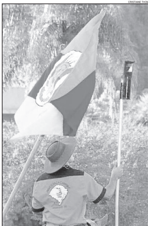
2º lugar - A chama que reacende a tradição gaúcha