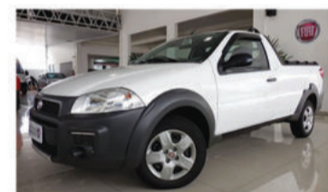
STRADA WORKING 1.4 MPI 8V FLEX - 2014 Branco, 4 portas, Flex - IVT-7211.

Opcionais: Air Bag Duplo, Freios ABS, Computador de Bordo.