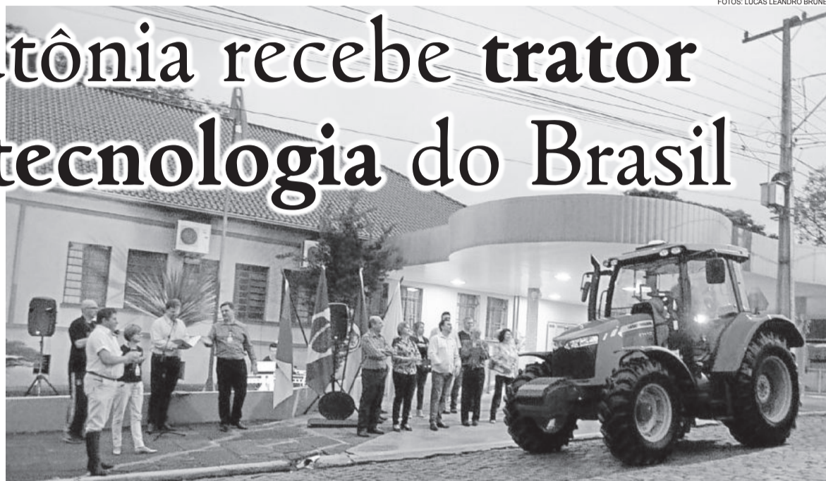
Colégio Teutônia entregou dois tratores em troca do novo