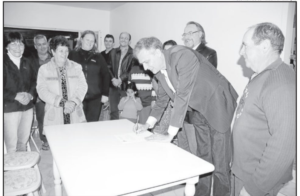
Prefeito autorizou início dos trabalhos na Rua José Leopoldo Keller