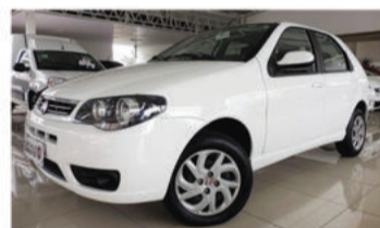
PALIO 1.0 MPI 8V FIRE - 2015 Branco, 4 portas, Flex - IWI-8937.

Opcionais: Ar-Condicionado, Freios ABS, Air Bag Duplo, Direção hidráulica.