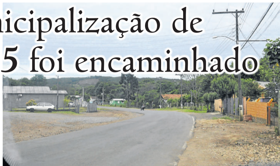
Trecho da VRS-835 que pertence ao DAER