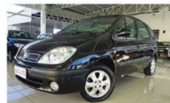
RENAULT SCÉNIC RXE 2.0 16V - 2008 Preto, 4 portas, Automático, Flex - GOL-7065.

Opcionais: Ar-Condicionado digital, Direção Hidráulica, Air Bag Duplo.