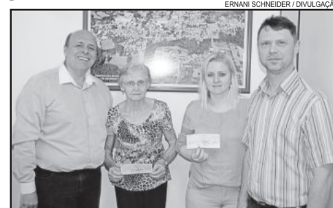
Ganhadoras do penúltimo sorteio de 2015

As cartelas podem ser trocadas junto à Secretaria Municipal de Agricultura, Meio Ambiente e Desenvolvimento Econômico, em horário de expediente.