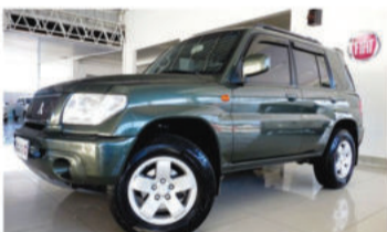
PAJERO TR4 4x4 2.0 16V FLEX - 2006 Verde, 4 portas, Flex - IMX-8220.

Opcionais: Ar-Condicionado, Bancos de Couro, Air Bag Duplo, Freios ABS.