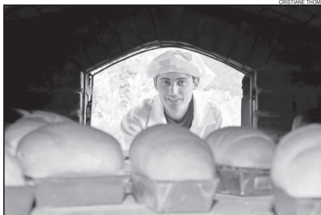
3º lugar - Sabores Coloniais um novo olhar