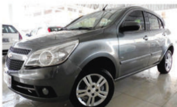
AGILE LTZ 1.4 MPFI 8V ECONO.FLEX - 2012 Cinza, 4 portas, Flex - ISM-7522.

Opcionais: Ar-Condicionado, Direção Hidráulica, Air Bag Duplo, Vidros Elétricos.