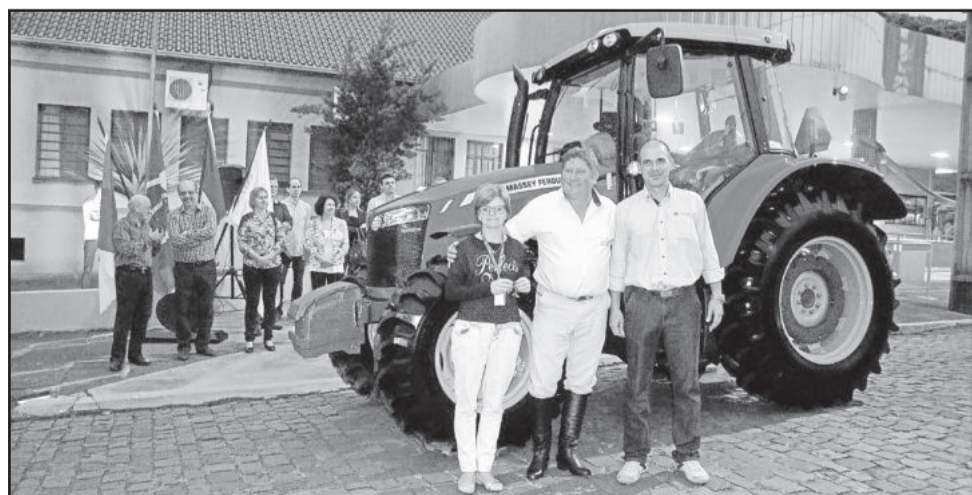
Trator MF Dyna 4 foi entregue na terça-feira