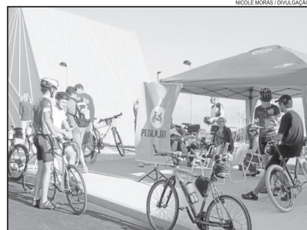
NICOLE MORÁS / DIVULGAÇÃO