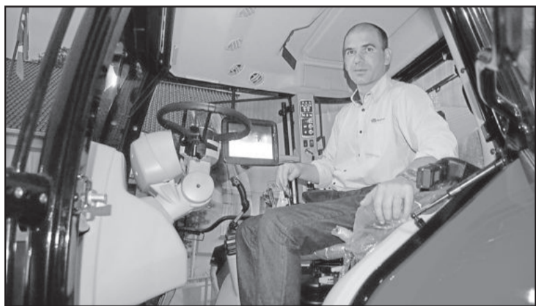
Trator dispõe de tecnologia para agricultura de precisão