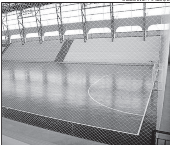
Ginásio receberá jogo do Gaúcho. Curioso é a Federação Gaúcha aceitar que dois jogos decisivos aconteçam em dias diferentes