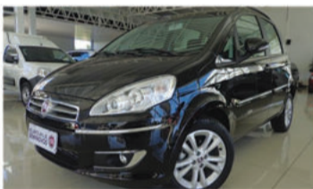
IDEA ESSENCE DUALOGIC 1.6 16V - 2015 Preto, 4 portas, Automático, Flex - IWK-0047.

Agora em TEUTÔNIA venha fazer uma visita!