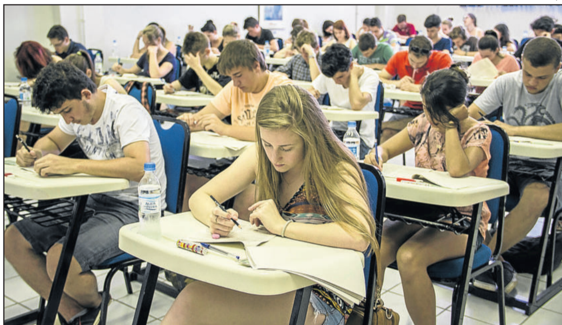
Prova única será aplicada no dia 29 de novembro