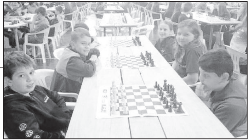
6º torneio de xadrez foi realizado no ginásio da Escola Estadual Nicolau Müssnich

Alunos da Escola Municipal Vila Schmidt mostraram ótimo desempenho