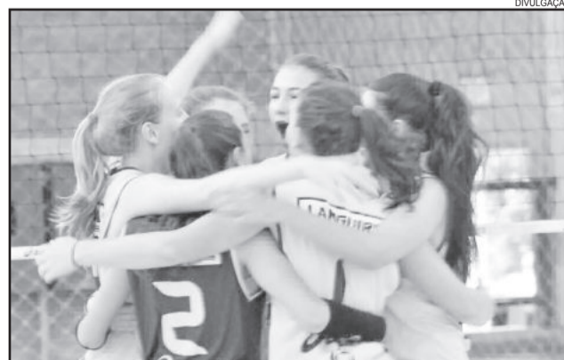
Equipe estrelense vai as semifinais e enfrenta o Grêmio Náutico União de Porto Alegre

- Copa dos Vales - cat. Guarani de Bagé x Juvenil às 10h na SER Gaúcho - Teutônia.