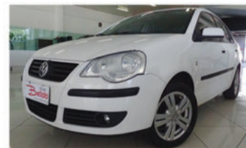
POLO SEDAN 1.6 MI 8V TOTAL FLEX - 2008 Branco, 4 portas, Flex - INX-6318.

Opcionais: Ar-Condicionado, Direção Hidráulica, Travas Elétricas.