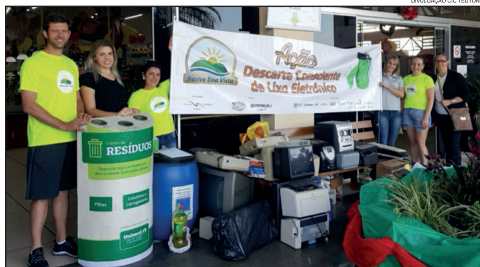
Voluntários recebem materiais em posto de coletas instalado junto ao Supermercado Languiru do Bairro Canabarro

de 500 mudas de árvores nativas. Em 2011 a ação recolheu 750kg de lixo, seguiu com o plantio de mudas de árvores nativas e ainda propiciou visita ao Aterro Sanitário de Teutônia. A mesma quantidade de lixo foi recolhida no ano de 2012, que também teve o plantio de árvores. As atividades de 2013 estiveram voltadas ao trabalho de conscientização da comunidade, com a distribuição de material informativo e educativo. Em 2014, com a retomada do recolhimento de lixo às margens do Boa Vista, foram coletados 290Kg, além de distribuídas para plantio 200 mudas de árvores nativas. Com o slogan "Sombra e água fresca estão em suas mãos", a 6ª edição, desenvolvida em 2015, contou com a primeira ação de descarte consciente de lixo eletrônico e medicamentos vencidos, oportunidade em que foram coletados mais de 450 eletrônicos e 1,5 mil pilhas, cerca de 100 medicamentos vencidos e 29 litros de óleo de cozinha. No ano de 2016, em quatro edições da ação, realizadas em junho, setembro, outubro e novembro, foram recolhidos cerca de 180 litros de óleo de cozinha, milhares de unidades de pilhas e baterias, em torno de 250 unidades de medicamentos vencidos, mais de 1,2 mil equipamentos eletrônicos e 140 chapas de Raio-X. Em 2017 foram realizadas três ações do Revive Boa Vista: no mês de setembro, descarte consciente de lixo eletrônico e medicamentos vencidos, com o recolhimento de mais de 650 itens, além de 71 litros de óleo de