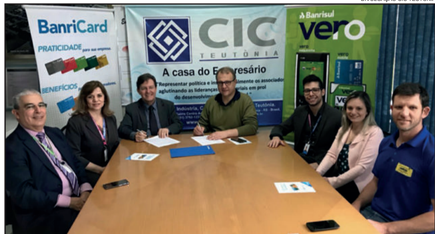
Assinatura de parceria ocorreu no dia 10 de novembro

A CIC Teutônia e o Banrisul firmaram convênio de parceria em benefício dos associados da entidade empresarial. Assinado no dia 10 de novembro, o convênio do Banrisul Cartões oferece vantagens e condições diferenciadas aos empresários, atendendo demanda do quadro social da CIC.