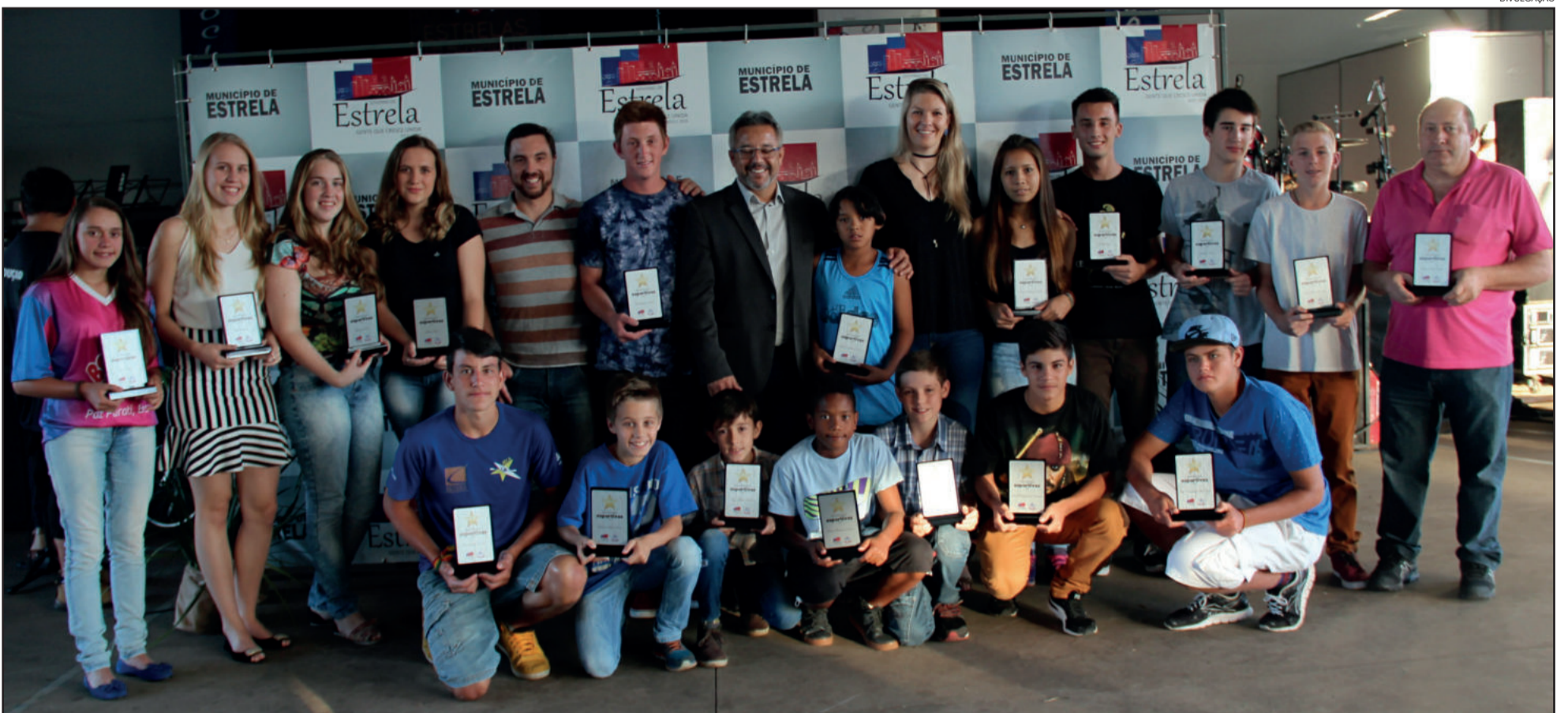
Na edição passada, jovens valores do esporte local foram laureados

A escolha é feita pela equipe da Secretaria Municipal de Esportes e Lazer (Smel), promotora do evento, e atende a uma série de requisitos e regras. Neste ano, a participação nos projetos esportivos existentes em Estrela, como o Vida Saudável, ou ainda em eventos realizados pela pasta no município ao longo do ano serão considerados na escolha.