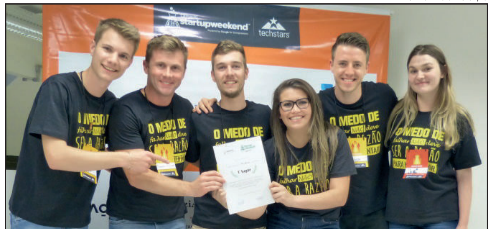
Equipe Re-alloc foi a grande vencedora do SW 2017