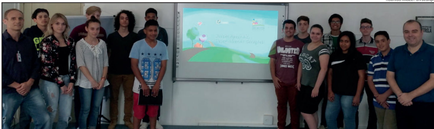
Segunda turma do Desenvolvendo Gerações – Jovem Aprendiz já iniciou a capacitação

Outras três turmas estão agendadas para os três primeiros meses de 2018. Os recursos para a realização dos cursos são provenientes do Governo Federal, por meio do Ministério do Desenvolvimento Social. Inscrições e informações na Sedesth (Rua 13 de Maio, nº 398) e pelo telefone 3981-1215.