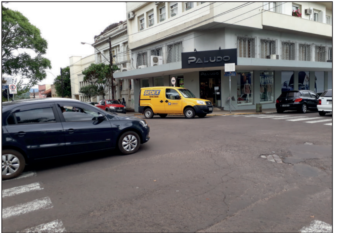
Maior fluxo de veículos na época do ano, inclusive de visitantes, colabora para o aumento de acidentes

Sugestões e reclamações quanto ao trânsito de Estrela podem ser feitas na Seplade, pelos telefones 3981-1075 e 3981-1032, ou em outros canais de acesso, entre eles a Ouvidoria do município (3981-1219).