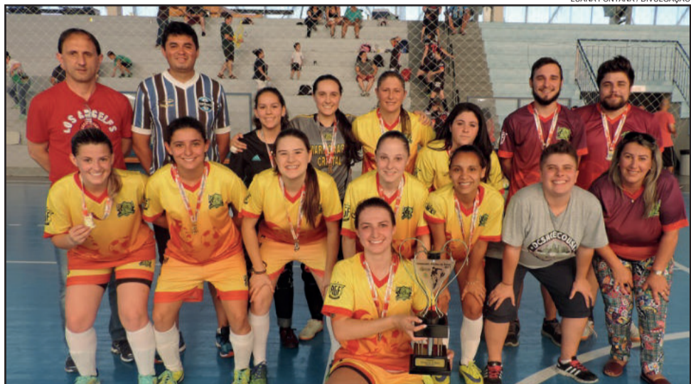
1º Lugar Damas de Ferro

O Campeonato Citadino de Futsal – Categorias de Base é promovido pela Prefeitura de Garibaldi, por meio da Secretaria Municipal de Esportes e Lazer.