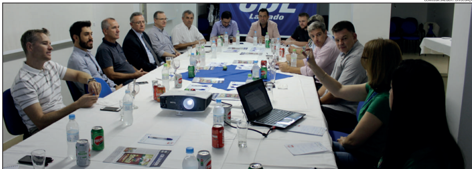
Reunião ocorreu nesta terça-feira na sede da entidade