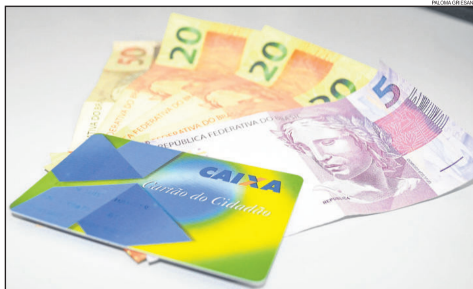
Valores de contas inativas começam a ser pagos em março

Não é preciso necessariamente ir até uma agência da Caixa para receber os valores do FGTS de contas inativas. Valores de até R$ 3 mil podem ser sacados em salas de auto-atendimento, lotéricas e correspondentes Caixa Aqui. Para sacar até R$ 1.500 é preciso ter apenas a senha do Cartão Cidadão e o número do PIS, para valores de R$ 1.500 até R$ 3 mil é necessário ter o Cartão Cidadão e a senha. Valores acima de R$ 3 mil só podem ser sacados em agências da Caixa.