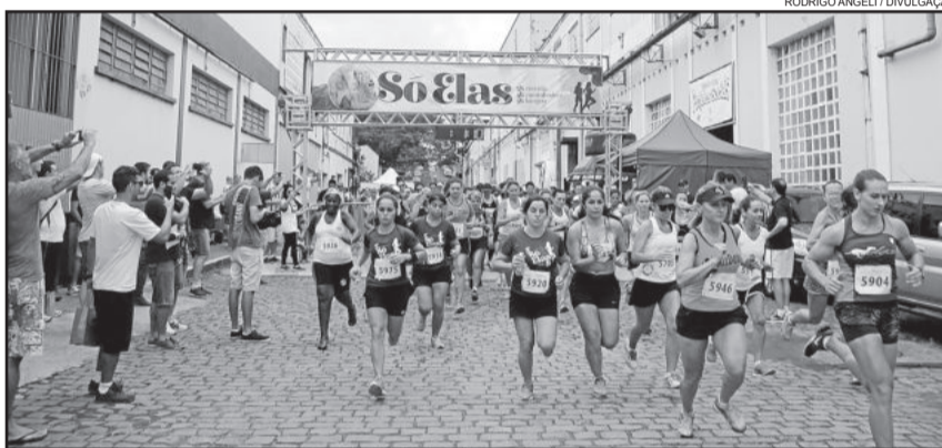
Provas reuniram mais de 260 atletas de todo o Estado

Quem participou da caminhada também recebeu medalha de participação e a camiseta oficial do evento. Foram ainda distribuídos brindes extras de patrocinadores e prêmios para maiores grupos. Todas participantes tiveram apoio médico, distribuição de frutas, água, serviço de massagens e ainda puderam descer na tirolesa junto à escadaria, tudo gratuitamente.