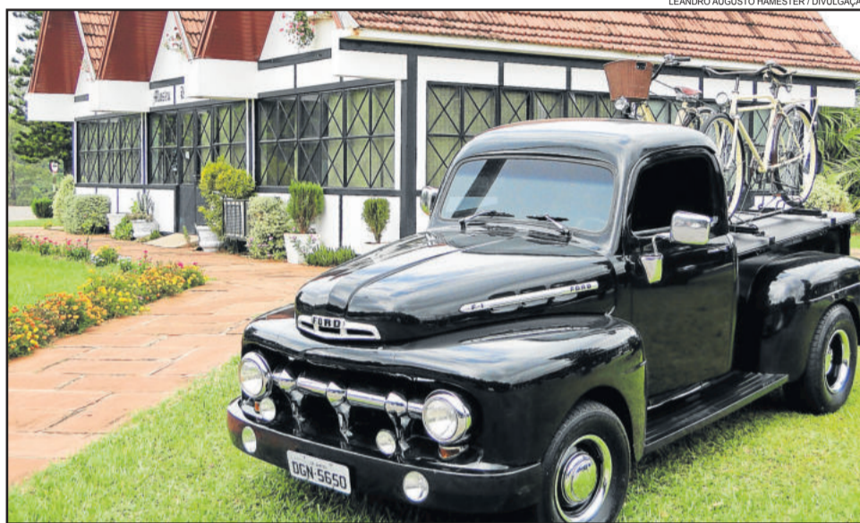
Raridades que povoam o imaginário de muitas pessoas estarão em Teutônia

A infraestrutura do local terá praça de alimentação diversificada, com recepção especial