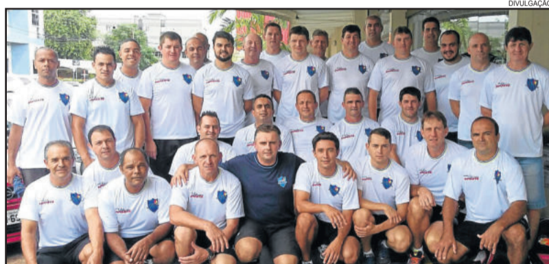
Novo uniforme Pivi Arbitragem

Pivi Arbitragem apresentou neste domingo, dia 5 de março, seu novo traje de passeio, utilizado por árbitros e assistentes (bandeiras). Antes do grupo se dirigir aos gramados, parada para a fotografia. Uniforme demonstra organização e padronização na apresentação da arbitragem.