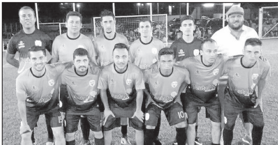
Kaxa Baxa derrotou o Saidera nas penalidades