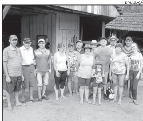
14 agricultores participaram do Dia de Campo

Os agricultores participaram de quatro estações. A primeira tratou sobre o Cultivares de milho da empresa KWS (grão e silagem). A segunda foi sobre a implantação, adubação e manejo de pastagens permanentes. A terceira estação tratou sobre a silagem. Foram abordados assuntos como tamanho de partícula, qualidade da silagem e ponto de silagem. A quarta e última estação teve como tema o processo de ordenha e qualidade do leite.