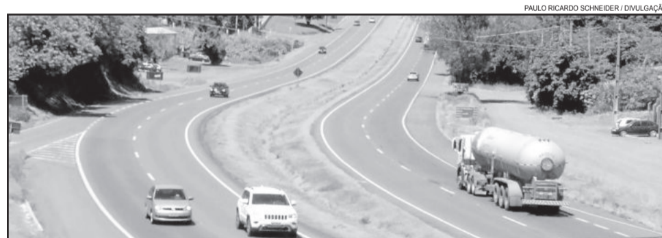
Concessão e pedágios na BR-386 está na pauta