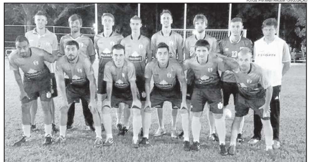
Saidera caiu nas quartas-de-final, porém tem chances no Sub-20