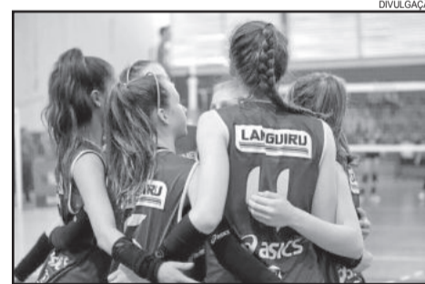
Equipe mirim ficou com o vice campeão da Taça Paraná em 2016

de Voleibol e os torneios internacionais, como o Festival de Estrela, Festival Mercosul e quatro torneios na Argentina.