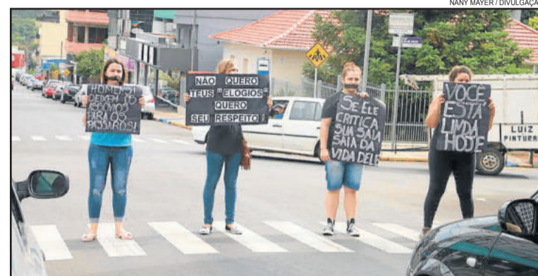
Blitz de conscientização foi realizada nas sinalceiras

Hoje, dia 7, continuam as atividades em várias escolas do município,