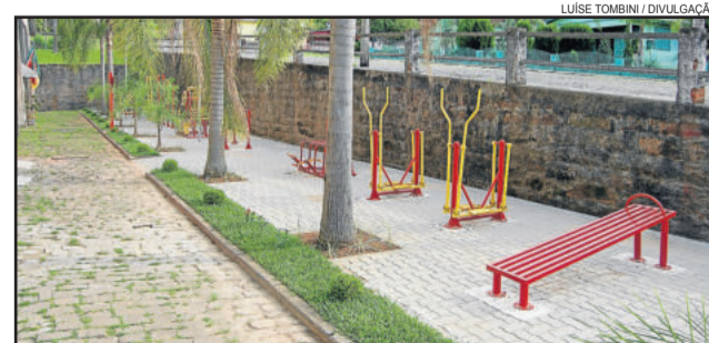
Academia de Saúde fica ao lado do ginásio, no Centro

A comunidade imigrantense recebe mais uma importante obra, a ser entregue pelo governo municipal nesta semana. Todos estão convidados a participar da inauguração da Academia da Saúde de Imigrante, localizada ao lado do Ginásio Municipal de Esportes, nesta sexta-feira, dia 10 de março. O ato simbólico de inauguração será às 9 horas da manhã, e após haverá apresentações e também a demonstração de como utilizar os equipamentos da academia.