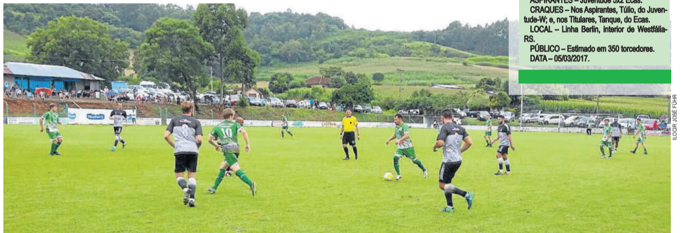
Juventude saiu na frente, mas Ecas virou e venceu a partida na Linha Berlin