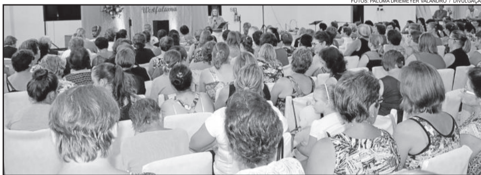
Mais de 200 mulheres participaram do evento neste ano