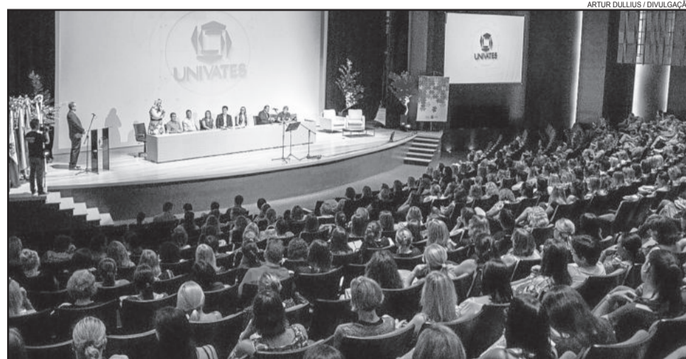
Audiência pública discutirá concessão à iniciativa privada de quatro rodovias, entre elas a BR-386

O trecho a ser concedido compreende a BR-101/SC, do km 455,9 até a divisa SC/RS; da BR-101/RS, entre a divisa SC/RS até o entroncamento com a BR-290 (Osório); da BR-290/RS, no entroncamento com a BR-101 (Osório) até o km 98; da BR-386, no entroncamento com a BR-285/377 (para Passo Fundo) até o entroncamento com a BR-448 (Rodovia do Parque); e da BR-448, no entroncamento com a BR-386 até o entroncamento com a BR-116/290.