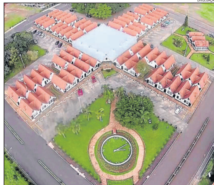
IPTU é um tributo que fica 100% no Município

No caso de portadores de HIV ou câncer, está prevista a isenção de IPTU para o proprietário do imóvel que esteja em tratamento, cuja comprovação se faz por laudo médico acompanhado de resultado laboratorial, desde que o imóvel sirva como residência própria ou renda auxiliar.