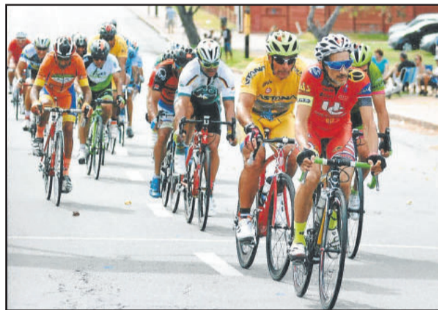
Birigui (c) ficou em 7º lugar na Geral da categoria

Não tenho palavras para agradecer todas as mensagens que recebi de apoio, força e carinho. A cada etapa, dei meu melhor. Que torcida hein! Valeu muito!”, avaliou a atleta em sua página pessoal.