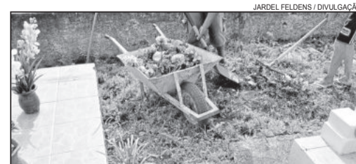
Apenados realizam diversos serviços sob supervisão de funcionário da Susepe

A Prefeitura de Lajeado está usando mão de obra prisional para melhorias na cidade. Detentos do Presídio Estadual de Lajeado estão realizando limpeza e pintura no Cemitério Municipal do Bairro Florestal. Os três presos do regime semiaberto trabalham sob a supervisão de um funcionário da Susepe. Eles já realizaram trabalhos como recolhimento de entulhos, recuperação de túmulos e melhoria geral da aparência do local. O próximo passo é a pintura dos muros do cemitério. O serviço não tem previsão de término.