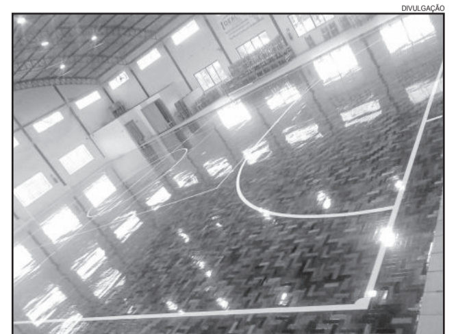
Quadra da SER Gaúcho foi reformada