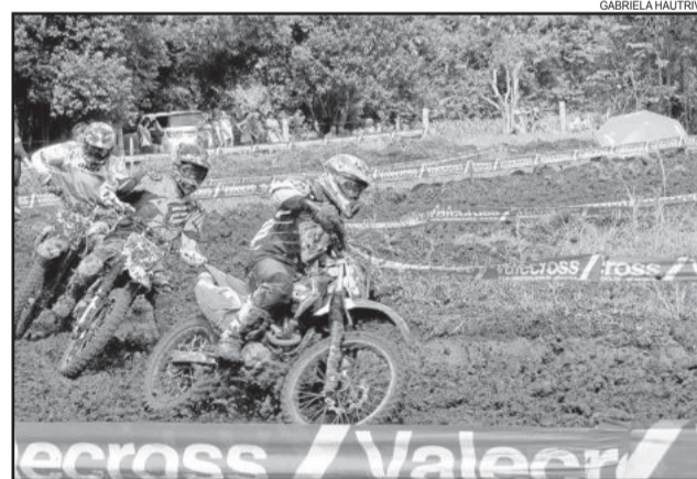
Pista de tamanho reduzido e com bastante barro dificultou a prova para os competidores

Depois de inaugurada a pista teutoniense para o Veloterra, a organização do evento planeja trazer para o município uma das etapas do campeonato Pireli SuperBi-