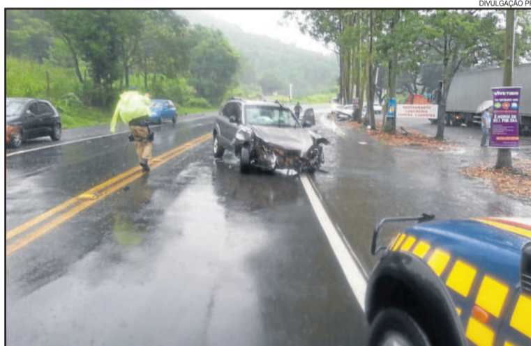
Na região, o acidente mais grave foi em Marques de Souza, que vitimou duas pessoas

* Em 2014, foram cinco dias de operação, entre os dias 15 e 21 de abril. Já em 2015, também foram cinco dias de operação, entre os dias 2 e 6 de abril.