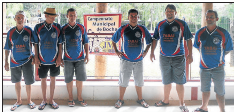
Lancheria da Márcia segue em busca da primeira vitória