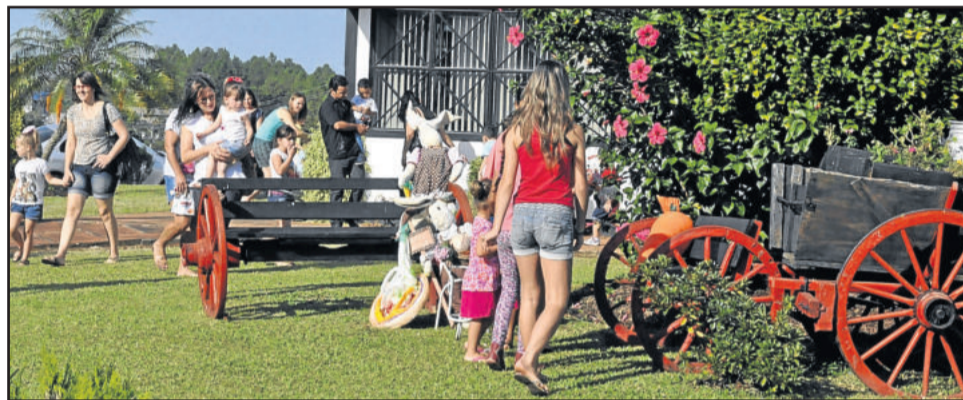
Os pequenos procuraram pelos ninhos nas dependências do Centro Administrativo

A proposta do evento foi fazer uma ação solidária na Páscoa e proporcionar uma atração diferente. Como foi a primeira experiência neste ano, e a