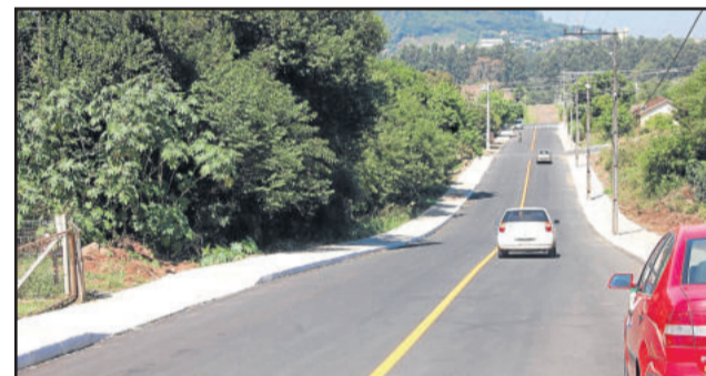
Rua Asido Dreyer