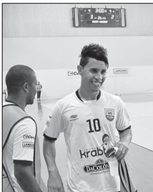
Biel marcou o gol da vitória de cabeça