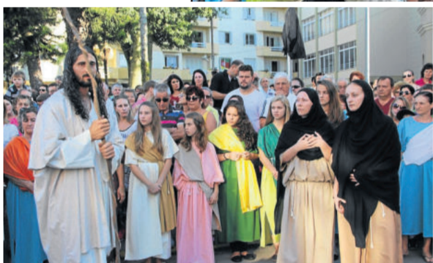
Cerca de 10 mil pessoas prestigiaram a encenação da Paixão de Cristo