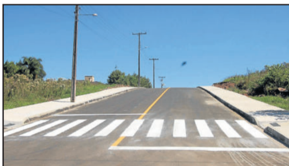
Rua Leopoldo Knöpker