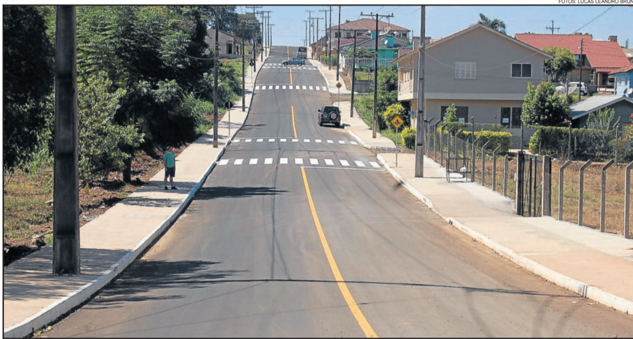
Rua Décio Böhmer

Dentre as ruas novas, destaque para 863 metros na Santa Rosa, no Bairro Alesgut; para os 527 metros da Avenida 1 Oeste no Bairro Centro Administrativo; mais de 1.500 metros somando os trechos das ruas Décio Böhmer, Carlos Frederico Guilherme Ahlert e Friedhold Heilmann, todas no Bairro Teutônia.