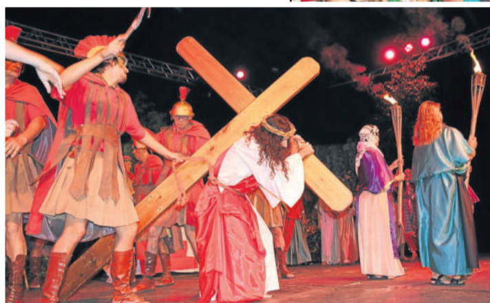
O açoitamento dos soldados enquanto Jesus carregava a cruz impressionou pelo realismo

Cerca de 600 pessoas compareceram ao Ginásio Nelson Francisco Brancher para a encenação da Paixão de Cristo