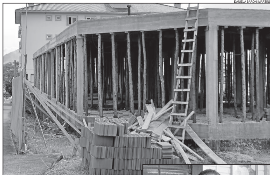
Estrutura do prédio foi concluída

A questão de espaço também será uma melhoria. “O novo prédio é bem amplo, então ele vai atender de forma significativa todas as nossas necessidades. Inclusive já em uma perspectiva de futuro, para quando nós crescermos também já ter um espaço adequado”, destaca. O local deve receber a tão esperada sala para a instalação da sala de videomonitoramento, com as imagens das câmeras de segurança a serem instaladas nas ruas. Ainda não há uma data definitiva para a entrega