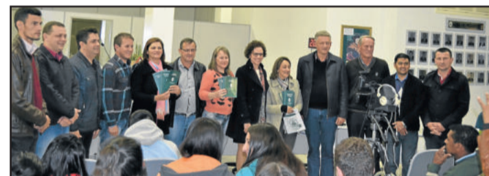
Alunos acompanharam a sessão e receberam a lei orgânica municipal

A próxima sessão da Câmara de Vereadores de Teutônia ocorrerá na próxima quinta-feira, dia 12 de maio, a partir das 18h30min.