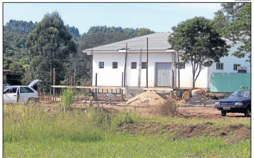
Rampa de acesso está sendo construída no Posto de Saúde, no Centro

Com foco nos atendimentos de emergências e remoções, a Secretaria de Saúde deu início, no mês passado, na construção de uma rampa de acesso. Assim, todo tipo de remoção ou atendimento de emergência será feito pela porta lateral da parte ampliada do Posto de Saúde, não causando desconforto aos munícipes que estão na recepção, aguardando o atendimento.