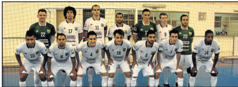
Teutônia Futsal recebe hoje a BGF em casa