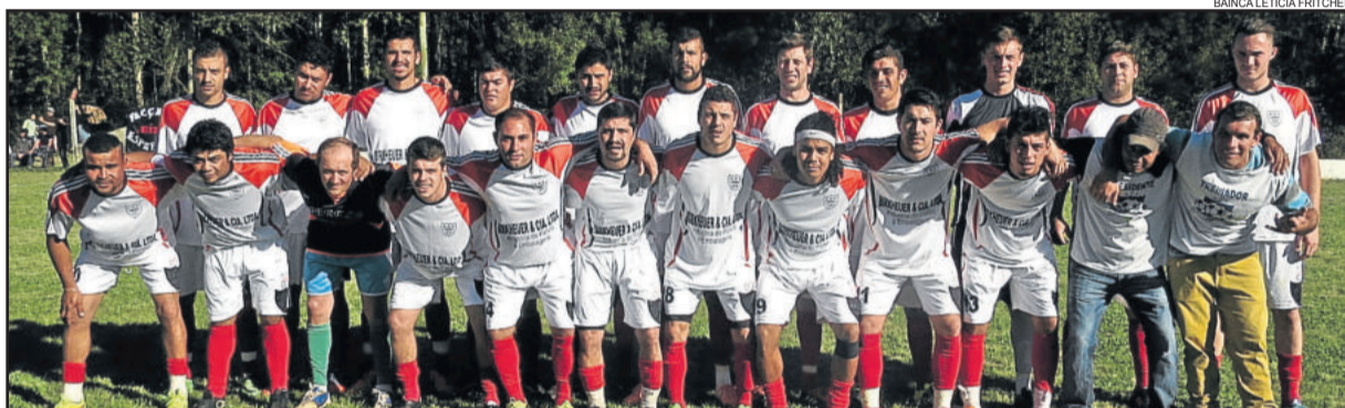
União de Linha Germano venceu os dois jogos das quartas-de-final