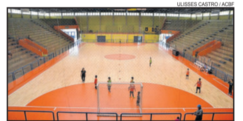
Nova quadra do ginásio será inaugurada no jogo contra o Marreco

O time laranja enfrentará o Marreco Futsal na próxima quarta-feira, dia 11, às 20h15min. O jogo também será a inauguração da nova quadra, que passou por reformas no início da temporada.