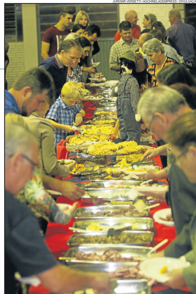
Evento ocorrerá no Salão Paroquial de Daltro Filho, em Imigrante