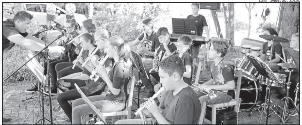
Apresentação da Orquestra Jovem na praça municipal

Para finalizar as apresentações da semana do município, eles se apresentam amanhã, domingo, dia 08 de maio, no Centro Comunitário Evangélico Arroio da Secca, antecedendo a Orquestra Municipal de Imigrante e a banda alemã Eis Am Stiel. O evento inicia às 19h30min e tem entrada gratuita.