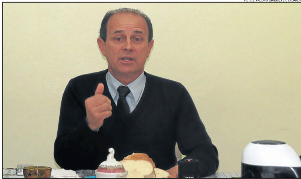
Cettolin anunciou adiamento da quarta etapa de revitalização da Buarque de Macedo

“Nesse momento, Garibaldi está olhando muito para as pessoas”, ponderou. Apesar de obras materiais estarem acontecendo por todos os lados, Cettolin avalia que é muito mais importante olhar para as obras humanas, que seria cirurgias eletivas, espaços educacionais, entre outros. “Ajudar o ser humano como um todo, porque o foco do Município é ajudar pessoas. Estamos vivendo em um município harmônico, isso nós falamos com muito orgulho. Os pilares da nossa economia são sólidos, e então vamos construindo e crescendo”, pontuou o prefeito de Garibaldi, Antonio Cettolin.