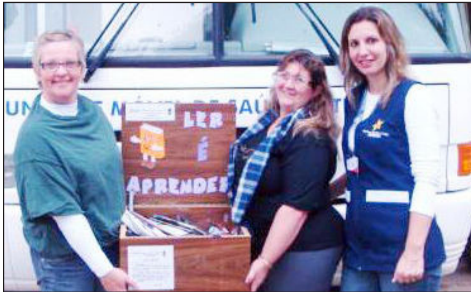
Caixa de leitura ficará a disposição da comunidade na Unidade Móvel de Saúde

já são quatro os locais (Posto de Saúde Central, Caps e Pronto Socorro), que os interessados podem desfrutar do prazer de folhar livros e periódicos. Interessados em contribuir para o enriquecimento do acervo das caixas de leitura podem destinar suas doações de livros, revistas e gibis para a Secretaria de Educação.