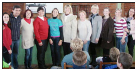
Grupo de orientadoras, diretora, professores, psicóloga e Secretária de Educação

Condições válidas até 29/05/2011, CG 150 Titan EX Flex ano/mod 2011 preço à vista R$ 8.400,00, financ. 48 vezes juros ao mês 2,68% e ao ano 32,16%. 48x342,00=16.416,00. Cred. suj. a aprovação agente financeiro. Brindes: emplacamento 2011; 01 capacete Tork Liberty; tanque cheio até 16 lts de combustível.