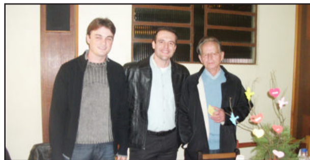
Pastora (no alto) e padre (acima, no centro) prestigiaram