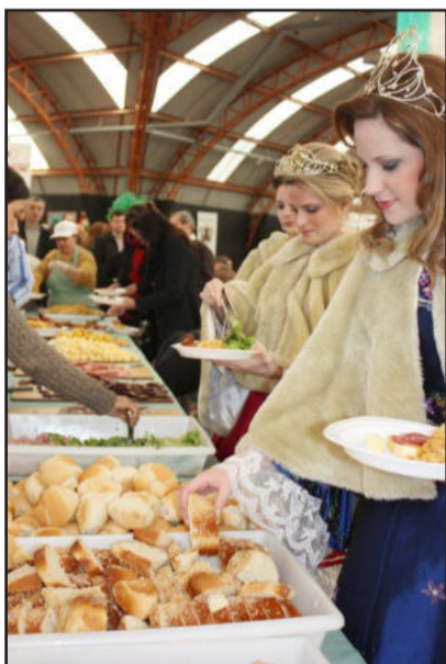
Farta gastronomia italiana