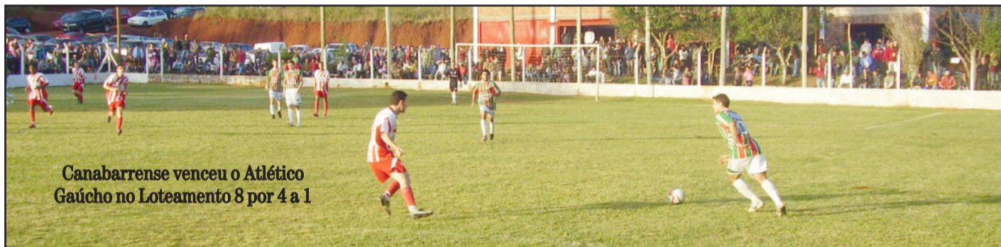
Canabarrense venceu o Atlético Gaúcho no Loteamento 8 por 4 a 1