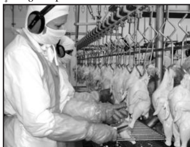
Frigoríficos garibaldenses se destacam na produção de frangos e serão afetados por embargo da Rússia

Como alternativa, alguns grupos pretendem redirecionar a produção regional para unidades em outros estados que não foram atingidos.