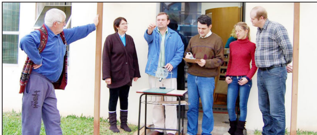
Terceiro sorteio foi realizado na sexta-feira

A Administração Municipal de Imigrante informa que os sorteios são realizados no espaço da recepção ou em frente a Prefeitura, sendo aberto à população. Qualquer cidadão poderá acompanhar os respectivos sorteios, sempre às 11 horas, conforme as datas especificadas nas cartelas.