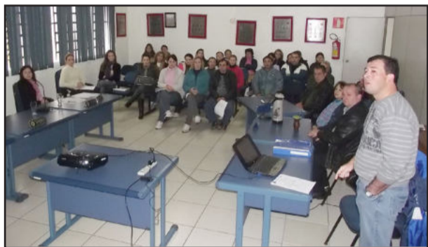
Novos servidores de Paverama passam por estágio probatório

Na manhã desta sexta-feira, dia 03 de junho, reuniram-se, na Câmara de Vereadores de Paverama, a Comissão de Avaliação de Estágio Probatório e os novos servidores públicos e empregados públicos nomeados em fevereiro desse ano. Na ocasião foram passadas informações técnicas sobre o estágio, sobre os direitos e deveres, boletim de acompanhamento e sobre legislação. São novos professores, pedreiros, médicos, psicólogos, agentes de saúde e assistentes sociais que complementarão o quadro de funcionários.