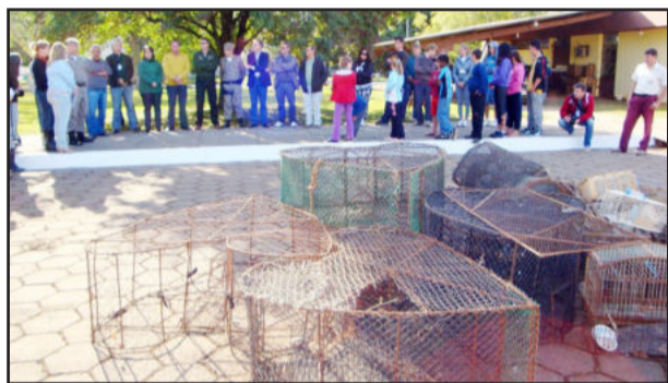
Público assistiu ato realizado

A Semana de Meio Ambiente, que se estende até o dia 8 de junho, tem como objetivo fomentar discussões e desenvolver ações que envolvam e mobilizem a comunidade para a tomada de atitudes em prol da preservação ambiental, sendo este um importante passo para promover a qualidade de vida das pessoas.