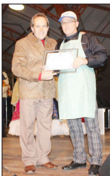
Prefeito prestou homenagem à Associação dos Veteranos