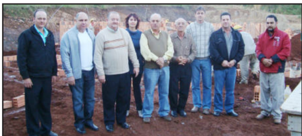
Executivo e Legislativo foram vistoriar obra da EMEI Pró-Infância