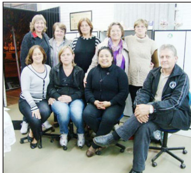
Professores da rede municipal de classes multisseriadas que aderiram ao Programa Escola Ativa

programa Escola Ativa para a comunidade escolar presente. Este foi um dos momentos de integração e convivência que estimulam a criatividade e a vivência de valores como respeito, carinho e cooperação.