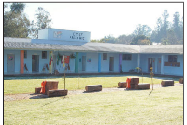
Escola Arco-Íris inaugurada em julho de 2009