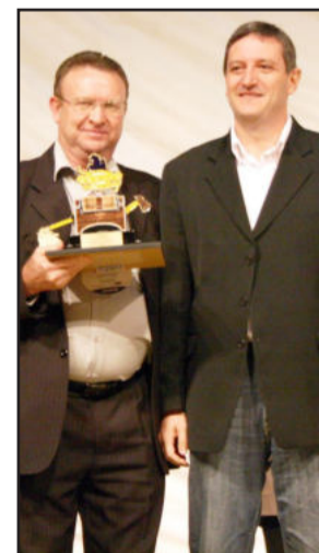
Entrega do prêmio aconteceu no sábado, dia 28

Tradicionalmente o Beto Carrero World organiza uma festa temática e também realizou o lançamento de uma nova atração durante a premiação. Neste ano foi apresentado o musical "O Sonho do Cowboy", a mais nova superprodução musical é uma homenagem ao Beto Carrero e conta com um elenco de mais de 30 artistas, entre atores, bailarinos e cantores, o espetáculo mescla música, dança e teatro. Na apresentação são utilizados mais de 100 figurinos, cavalos adestrados, alta tecnologia de som e luz, grandes cenários móveis e muitos efeitos especiais.