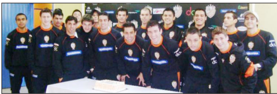
ACBF recebeu homenagem da Plimor

A Transportadora Plimor é patrocinadora Oficial da ACBF desde o início da temporada 2011. Neste período, o clube de Carlos Barbosa já chegou a dois grande títulos: a inédita Superliga de Futsal, em Betim/MG, o Tricampeonato da Copa Libertadores da América de Futsal, em Encarnación - Paraguai, além do vice-campeonato Mundial de Futsal, em Alcalá de Enares - Espanha.