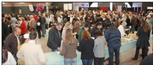
Recorde de público no evento deste ano