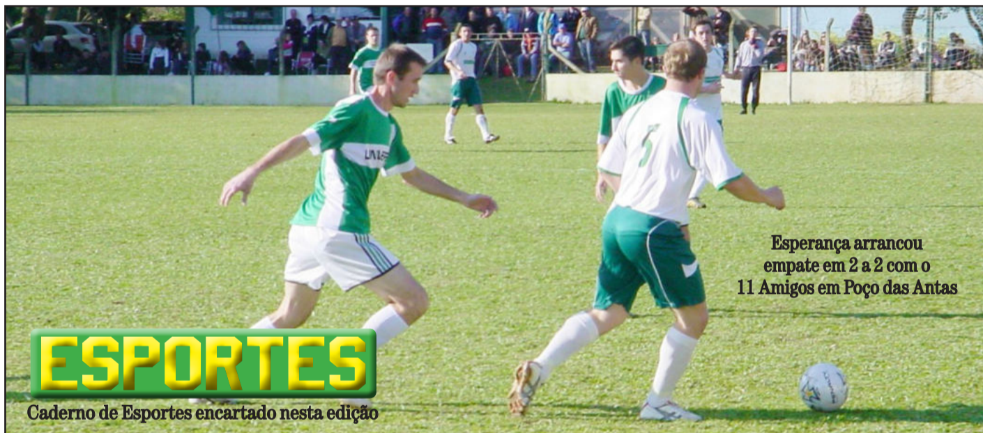
Esperança arrancou empate em 2 a 2 com o 11 Amigos em Poço das Antas