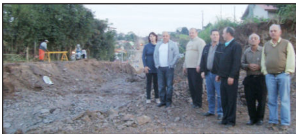
Executivo e Legislativo acompanharam obras de construção do viaduto