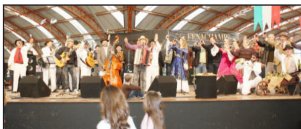
Brinde marcou abertura do evento