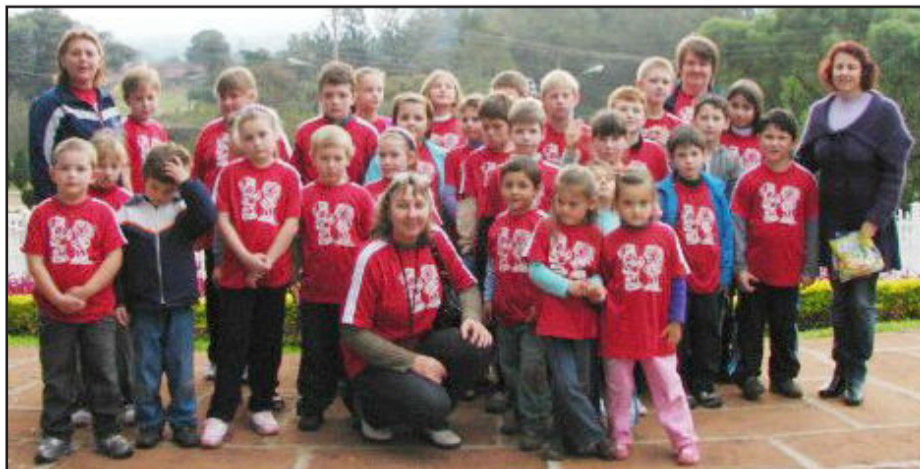
Alunos de três escolas do interior visitaram o Município