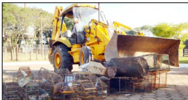
Máquina destruiu diversos apetrechos usados para maltratar os animais