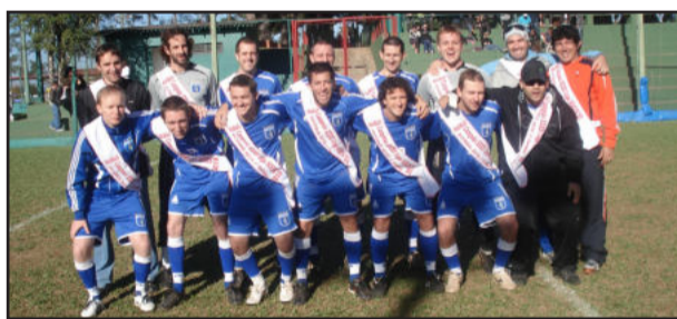
Passa Bola B

* Classificação - Thundercats B 9; Galera Alpha 6; Manguaça, Meninos da Vila e Al Qaeda Jr 4; Chapolins, Xtutz United, Os Kururus NC e Unidade 8 3; Smoking 1; SER Nata e Falkatrua 0.