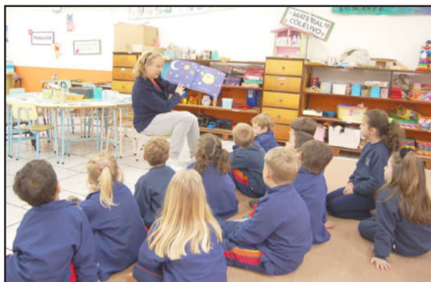
Escola de qualidade para jovens que serão os adultos de amanhã

Para alcançar o índice de destaque em Educação, a Administração Municipal de Imigrante investe na infraestrutura de: recursos didáticos, tecnológicos, biblioteca, capacitação de recursos humanos, valorização salarial, construção e melhorias na manutenção de escolas e de ginásios esportivos e de lazer, alimentação com controle nutricional e transporte escolar. No primeiro trimestre de 2011, por exemplo, o Município investiu 26,11% sobre a receita – corrente líquida, em Educação, sendo R$ 881.700,77 aplicados na manutenção e desenvolvimento do ensino.