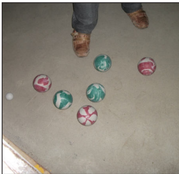
Grande final será realizada nos dias 10 e 11

O 2º Campeonato Municipal de Bocha de Teutônia registrou na sexta e sábado os jogos semifinais, que apontaram as equipes da Área Verde "A" e da Elegê "A" para a grande final. A Elegê "A" conquistou duas vitórias e somou 5 pontos na semifinal, contra 4 pontos da Área Verde "A", que venceu um e perdeu o outro jogo. Por isso, a primeira final será sexta-feira, dia 10, à noite, na Área Verde, e a grande final no sábado à tarde, na Associação da Elegê Alimentos.