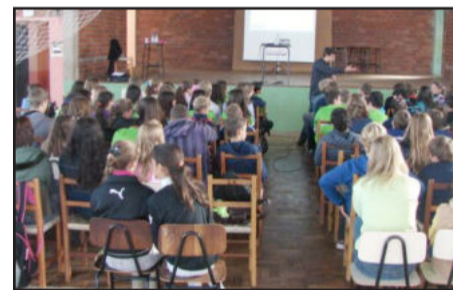
Alunos com o palestrante